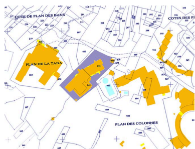
Plan masse. Extrait du plan cadastral IVR82_20127302561NUDA