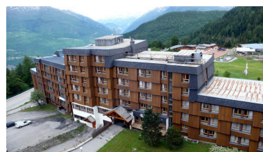
Vue d'ensemble depuis le nord-ouest IVR82_20127302563NUCA