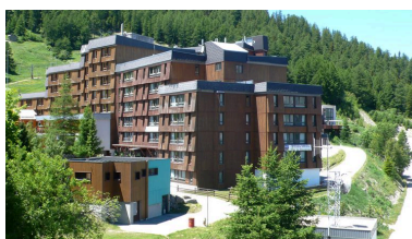
Vue d'ensemble depuis l'est IVR82_20127302262NUCA