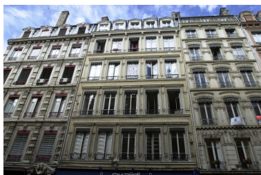
Façade, vue générale par-dessous IVR82_20046900922NUCA