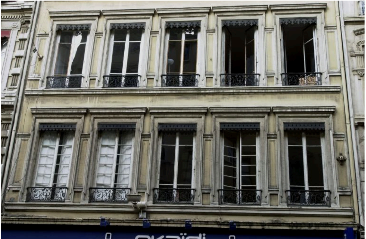
Façade, 2e et 3e niveaux