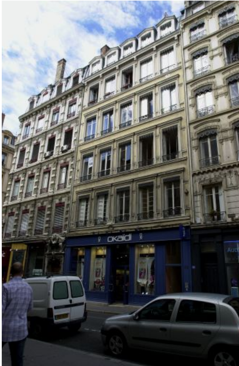
Façade, vue générale