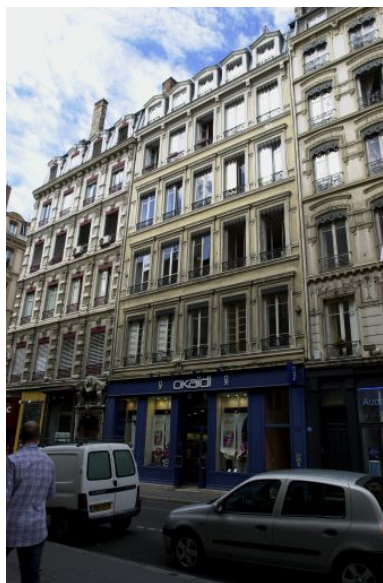
Façade, vue générale IVR82_20046900921NUCA