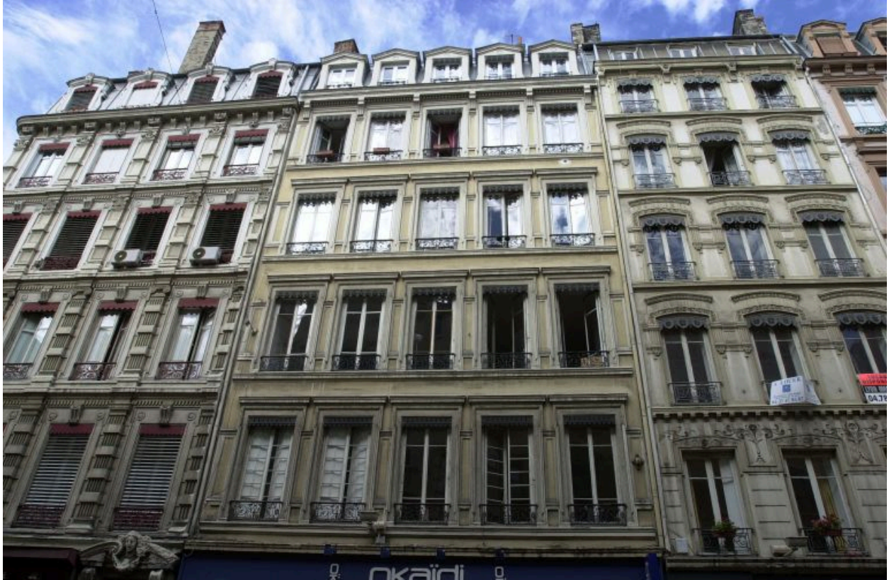
Façade, vue générale par-dessous