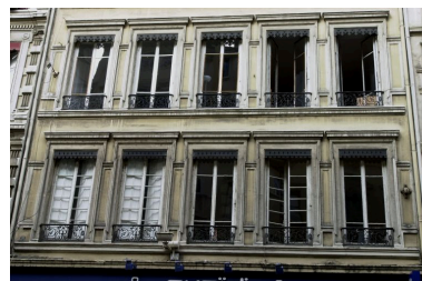
Façade, 2e et 3e niveaux IVR82_20046900923NUCA