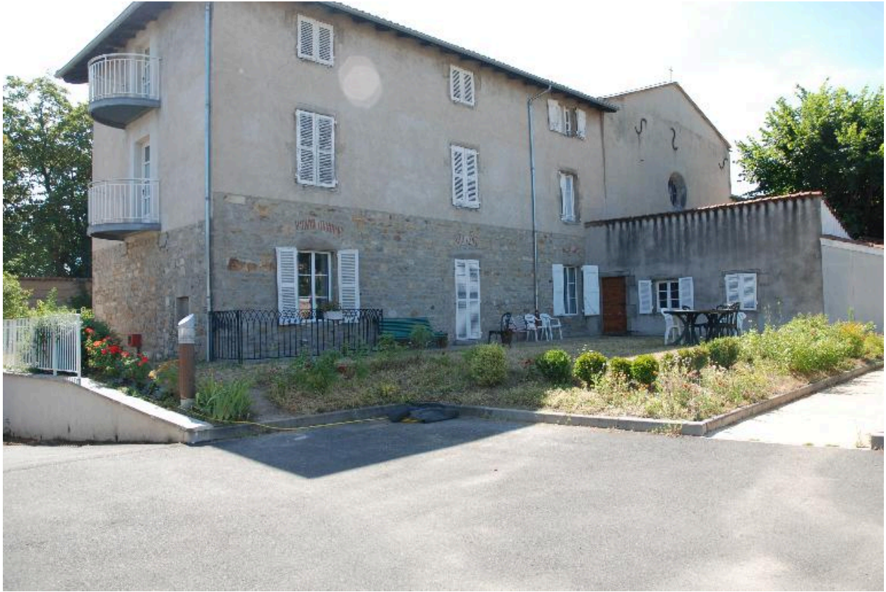
Vue d'une partie des bâtiments depuis le nord-ouest.