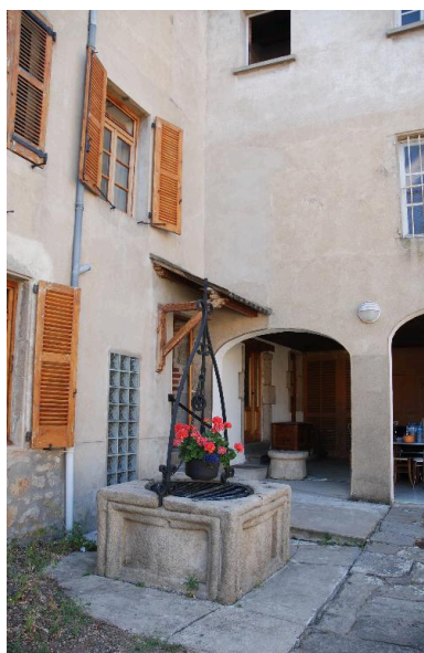
Vue du puits.