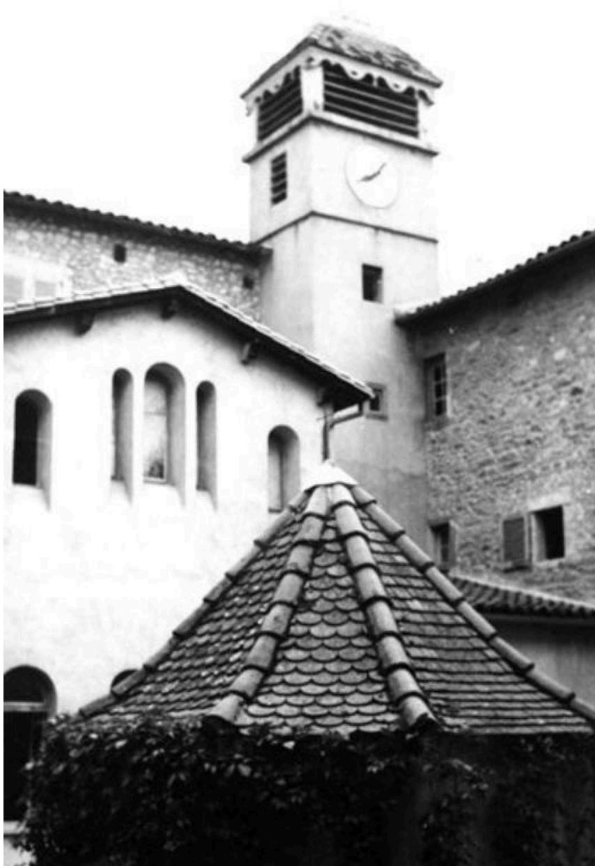
Monastère Sainte-Claire - 42 - Montbrison / LE CLOCHER (carte postale).