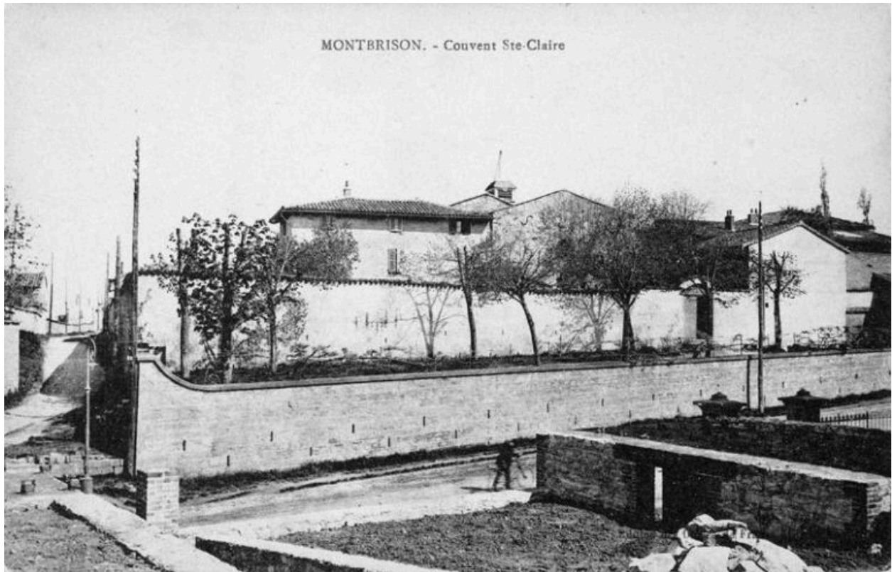
MONTBRISON. - Couvent Ste-Claire (carte postale).