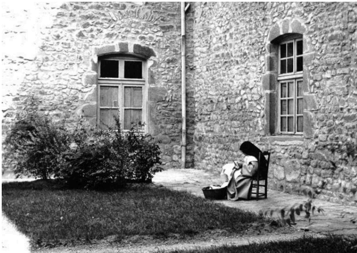
Monastère Sainte-Claire - 42 - Montbrison [Religieuse dans la cour] (carte postale).