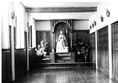
Monastère Sainte-Claire -42 -Montbrison / SALLE DU CHAPITRE (carte postale). IVR82_20054201676NUCB