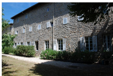
Vue d'une partie des bâtiments depuis le sud. IVR82_20154200378NUCA