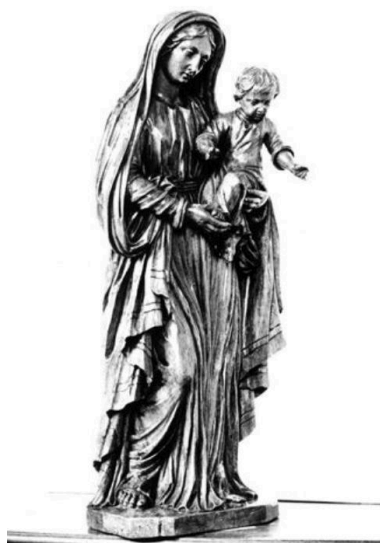
Monastère Sainte-Claire - 42 - Montbrison / VIERGE (Bois du XVIIIe siècle) (carte postale). IVR82_20054201682NUCB