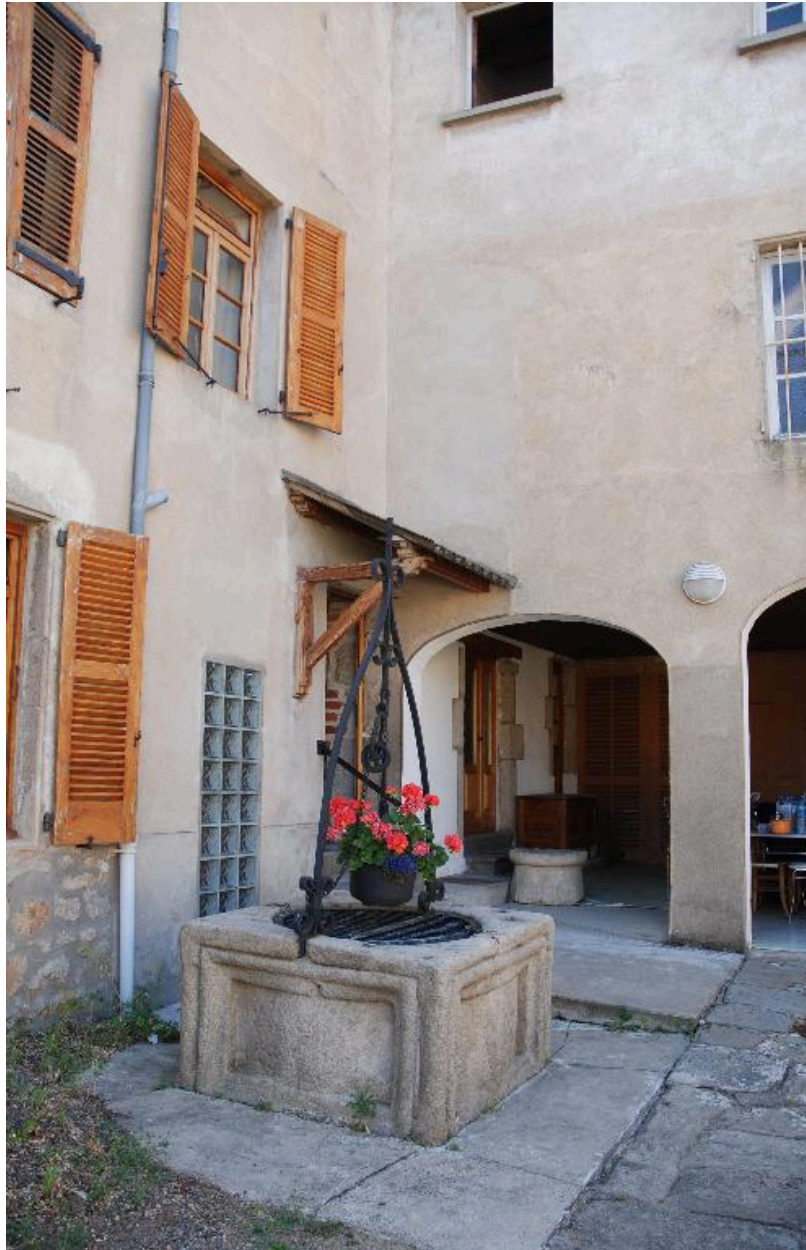
Vue du puits.