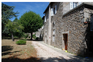
Vue d'une partie des bâtiments depuis le sud-est.