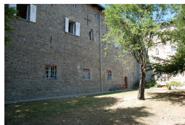
Vue d'une partie des bâtiments depuis le nord-est.