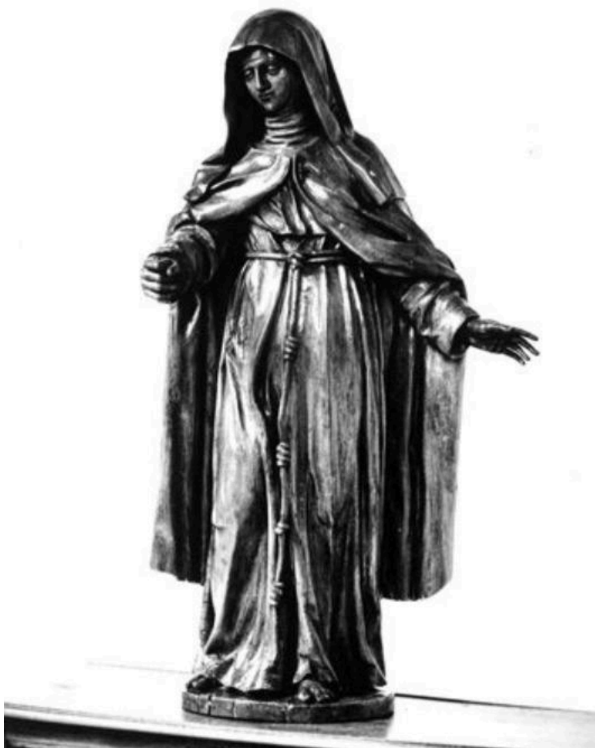
Monastère Sainte-Claire - 42 - Montbrison / SAINTE CLAIRE Bois XVIIe (carte postale).