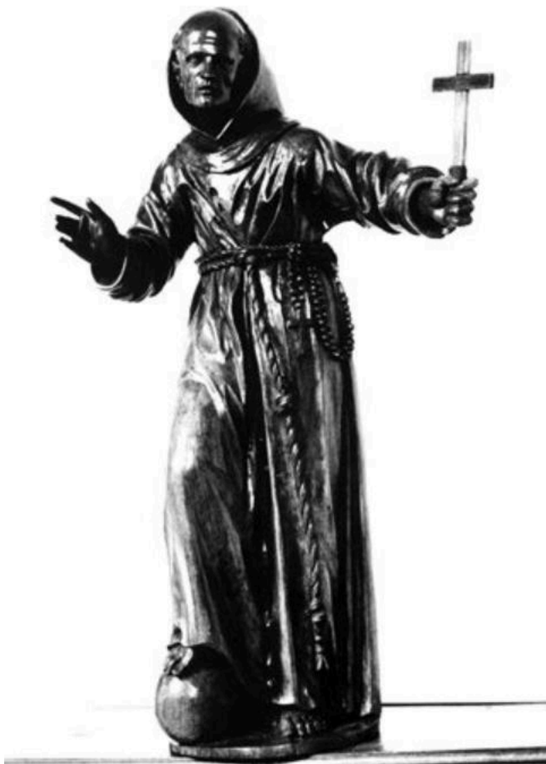
Monastère Sainte-Claire - 42 - Montbrison / SAINT FRANÇOIS D'ASSISE / (bois du XVIIIe siècle) (carte postale).