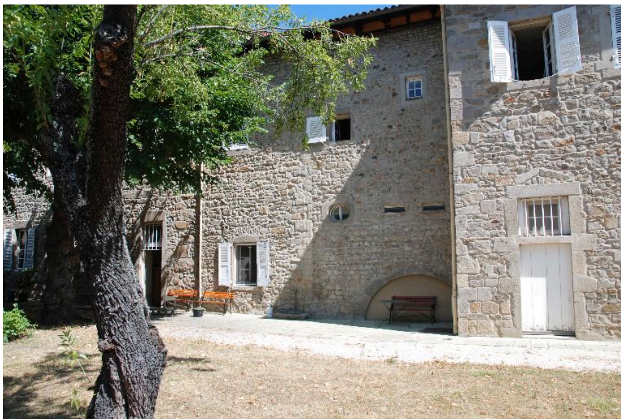
Vue d'une partie des bâtiments depuis le sud.