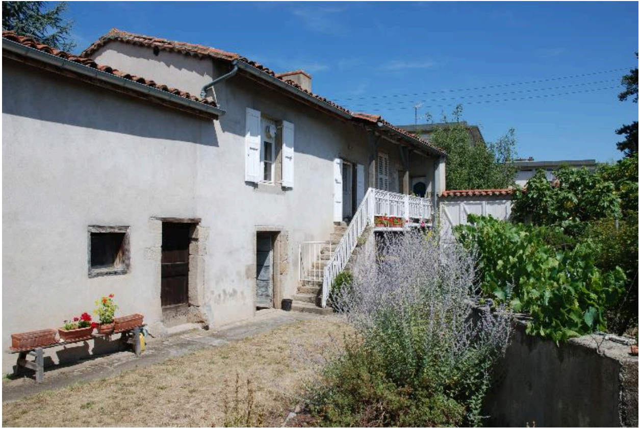
Vue sur l'atelier depuis le sud-est.