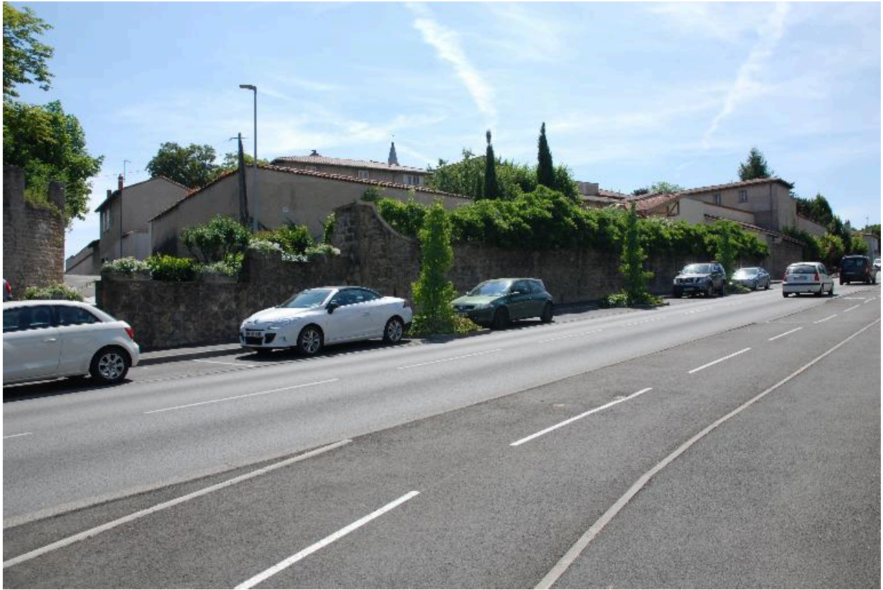
Vue générale depuis le nord-ouest et l'avenue de la Libération.