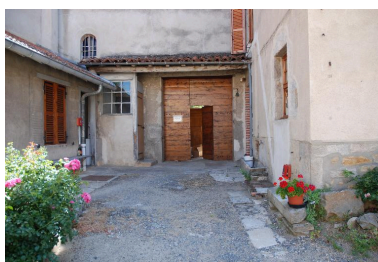
Vue du portail d'entrée du cloître.