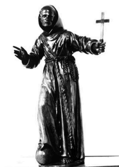
Monastère Sainte-Claire - 42 - Montbrison / SAINT FRANÇOIS D'ASSISE / (bois du XVIIIe siècle) (carte postale). IVR82_20054201683NUCB