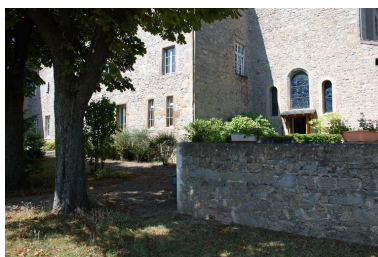
Vue d'une partie des bâtiments et de la chapelle depuis l'est. IVR82_20154200373NUCA