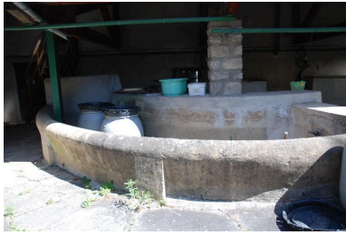
Vue du lavoir.