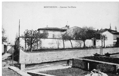
MONTBRISON. - Couvent Ste-Claire (carte postale).