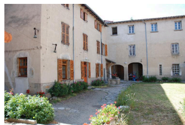
Vue d'une partie des bâtiments depuis le nord-ouest.