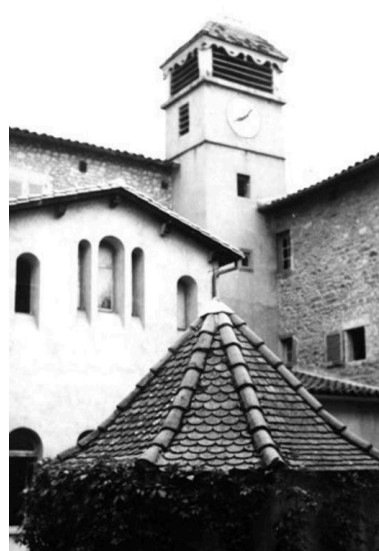
Monastère Sainte-Claire - 42 - Montbrison / LE CLOCHER (carte postale). IVR82_20054201675NUCB