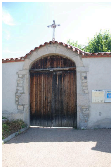
Entrée ouest du couvent. IVR82_20154200379NUCA