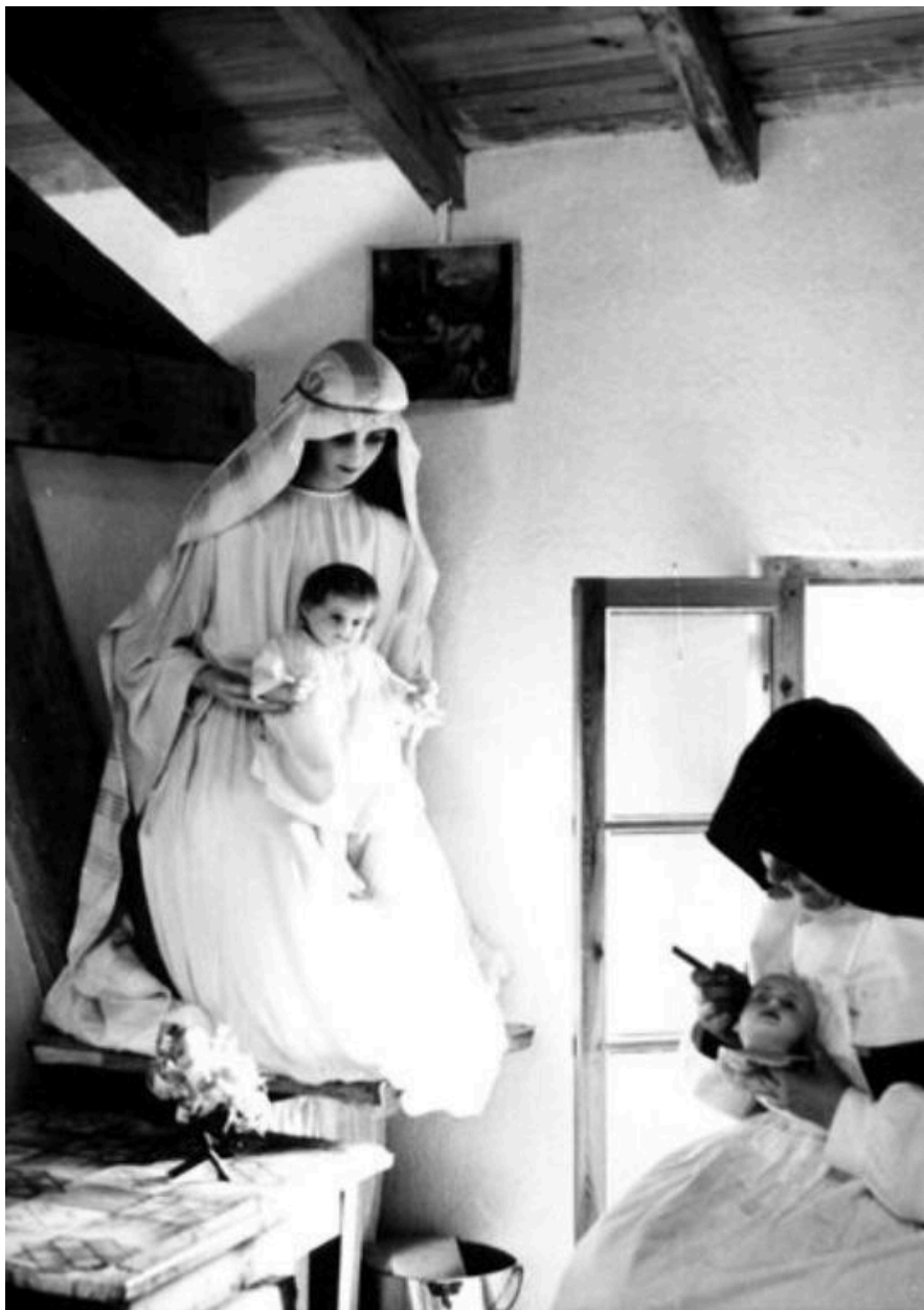
Monastère Sainte-Claire - 42 - Montbrison / ATELIER DE MODELAGE (carte postale).