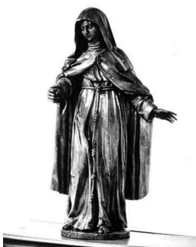
Monastère Sainte-Claire - 42 - Montbrison / SAINTE CLAIRE Bois XVIIe (carte postale). IVR82_20054201681NUCB