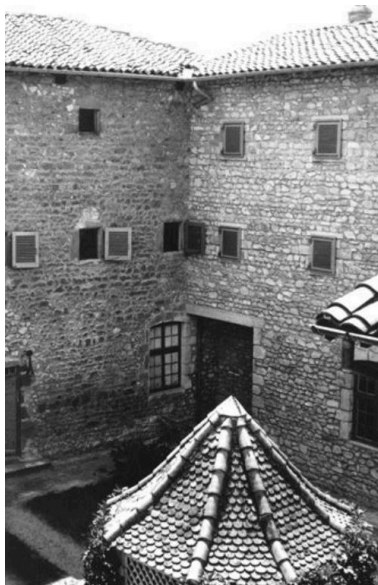
Monastère Sainte-Claire - Montbrison (Loire) / "Cour intérieure et le Puits" (carte postale).