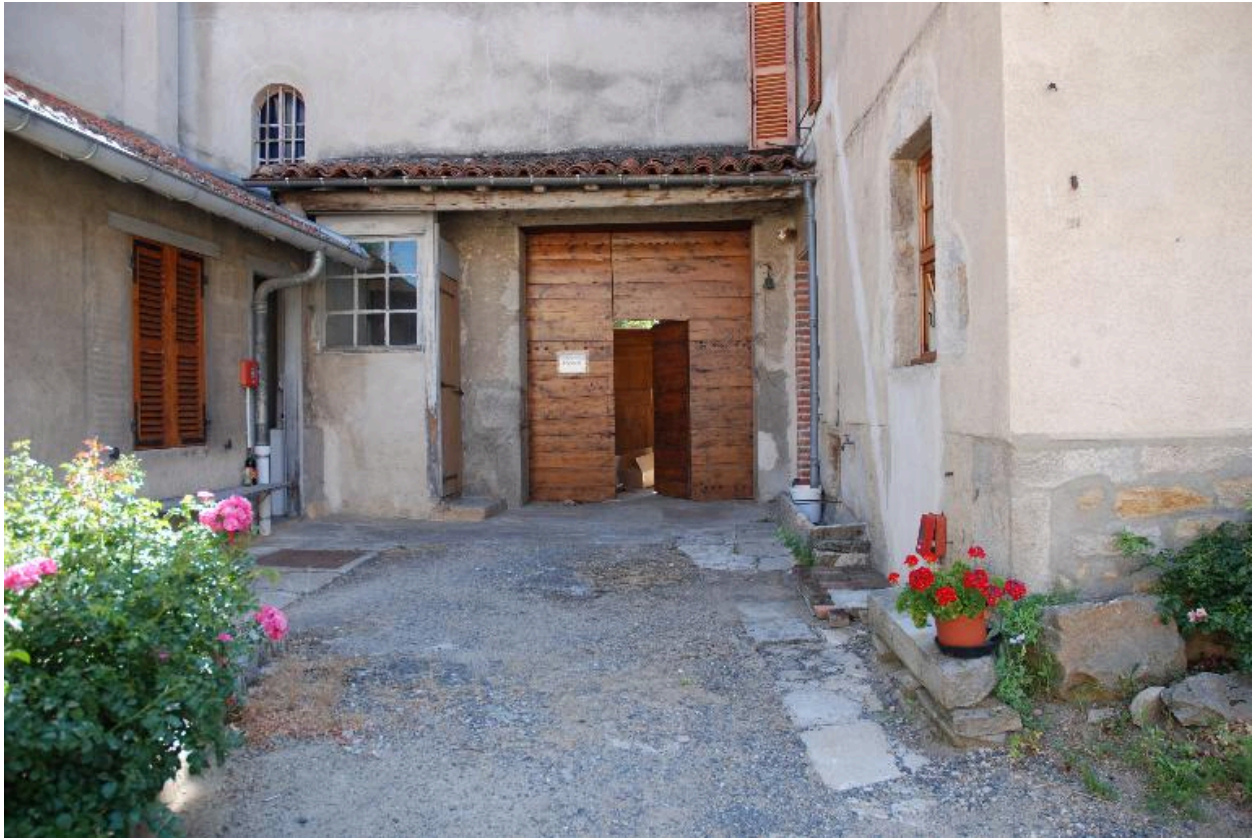
Vue du portail d'entrée du cloître.