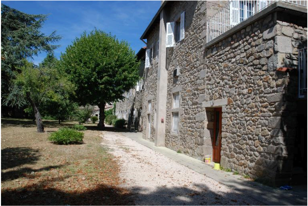
Vue d'une partie des bâtiments depuis le sud-est.