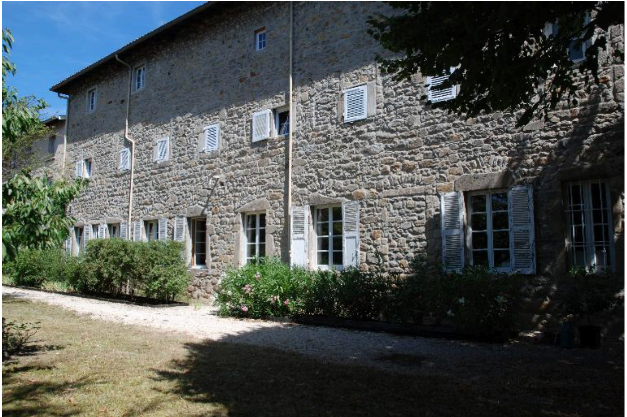
Vue d'une partie des bâtiments depuis le sud.