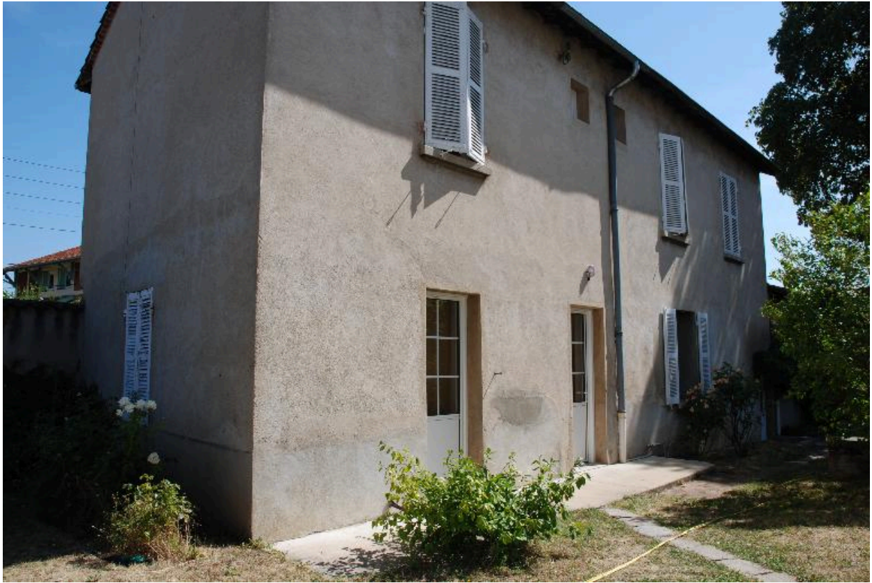
Vue sur la maison de l'aumônier depuis le sud-ouest.