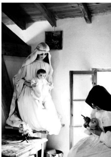
Monastère Sainte-Claire - 42 - Montbrison / ATELIER DE MODELAGE (carte postale).