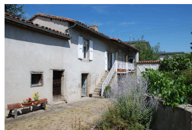
Vue sur l'atelier depuis le sud-est.