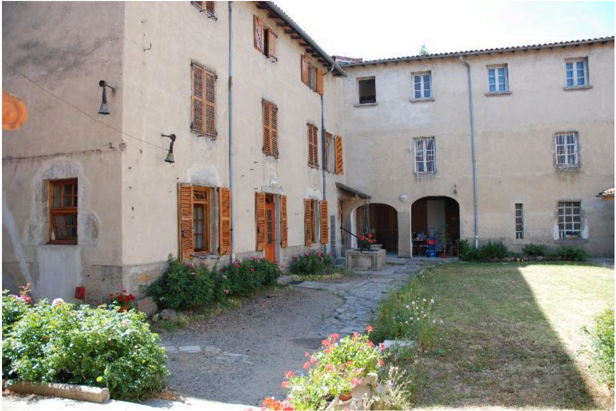
Vue d'une partie des bâtiments depuis le nord-ouest.