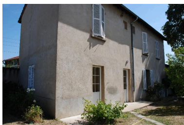
Vue sur la maison de l'aumônier depuis le sud-ouest.