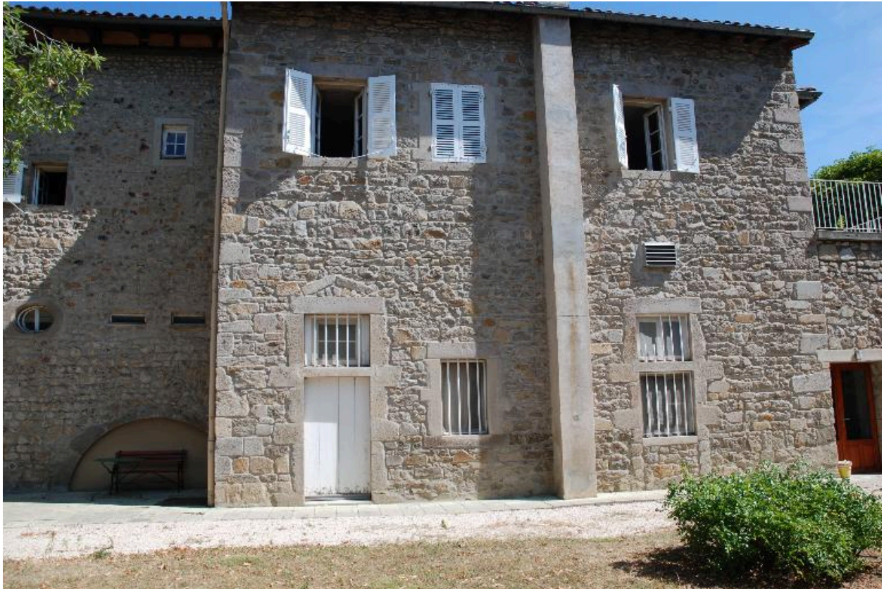
Vue d'une partie des bâtiments depuis le sud.