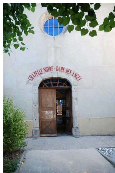
Vue sur l'entrée de la chapelle.