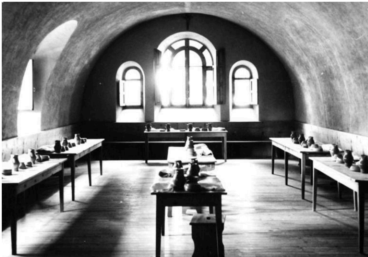
Monastère Sainte-Claire - 42 - Montbrison / LE REFECTOIRE (carte postale).