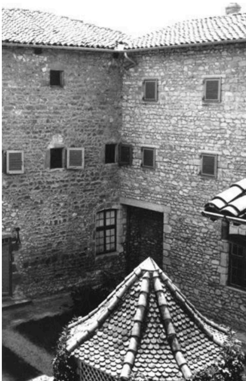
Monastère Sainte-Claire - Montbrison (Loire) / "Cour intérieure et le Puits" (carte postale).