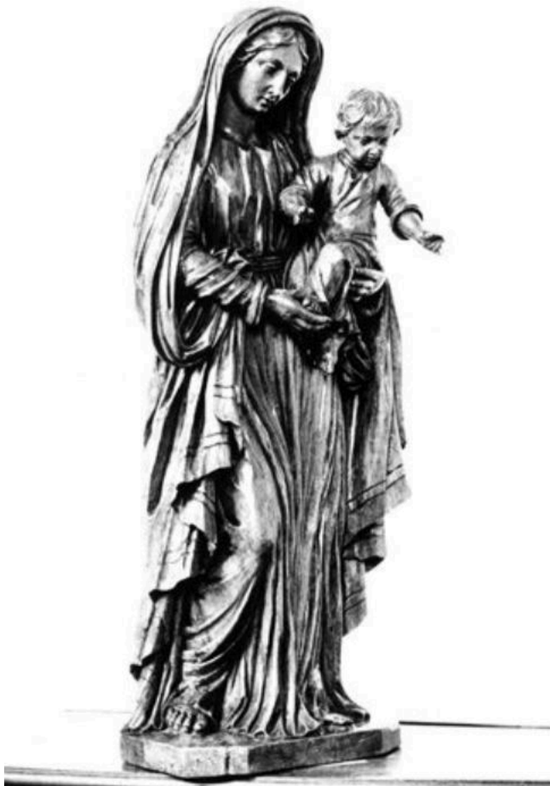
Monastère Sainte-Claire - 42 - Montbrison / VIERGE (Bois du XVIIIe siècle) (carte postale).