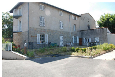
Vue d'une partie des bâtiments depuis le nord-ouest. IVR82_20154200421NUCA