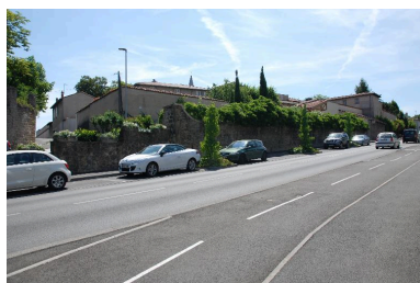
Vue générale depuis le nord- ouest et l'avenue de la Libération.