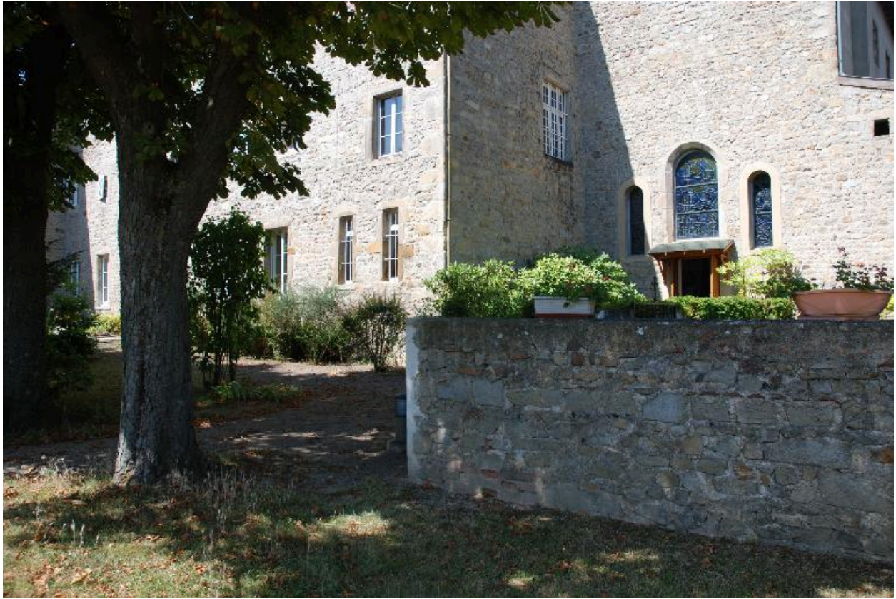
Vue d'une partie des bâtiments et de la chapelle depuis l'est.