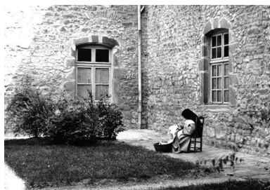
Monastère Sainte-Claire - 42 - Montbrison [Religieuse dans la cour] (carte postale). IVR82_20054201673NUCB