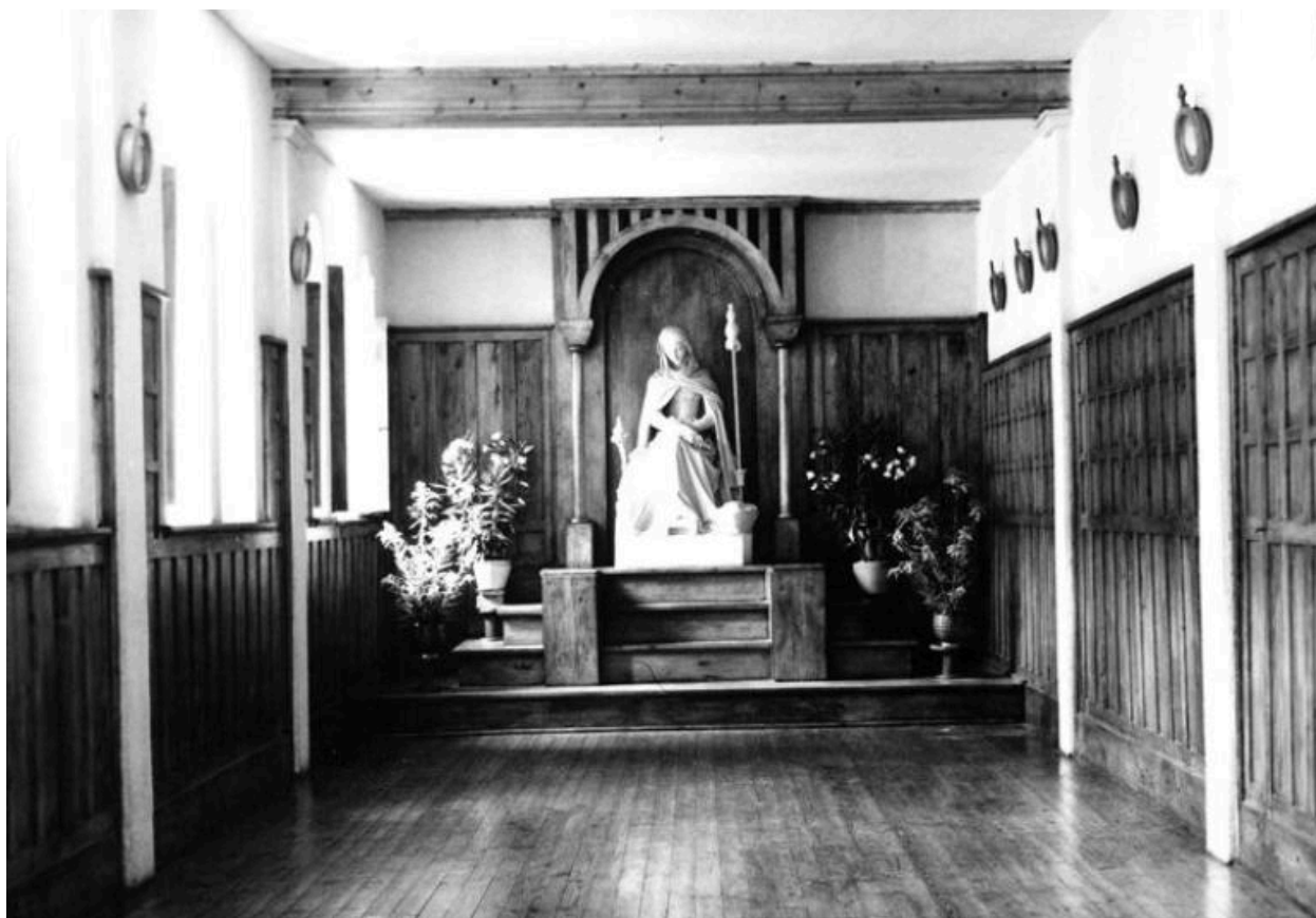
Monastère Sainte-Claire -42 -Montbrison / SALLE DU CHAPITRE (carte postale).