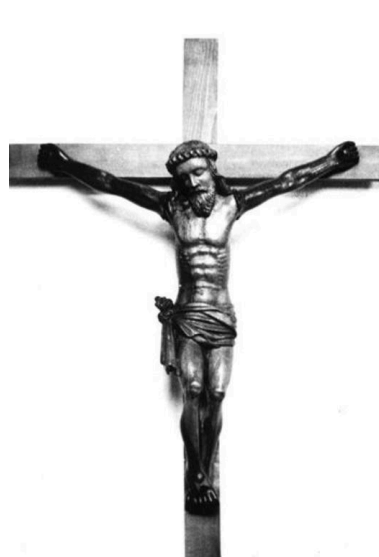
Monastère Sainte-Claire - 42 - Montbrison / CRUCIFIX (bois du XVIIIe siècle) (carte postale).