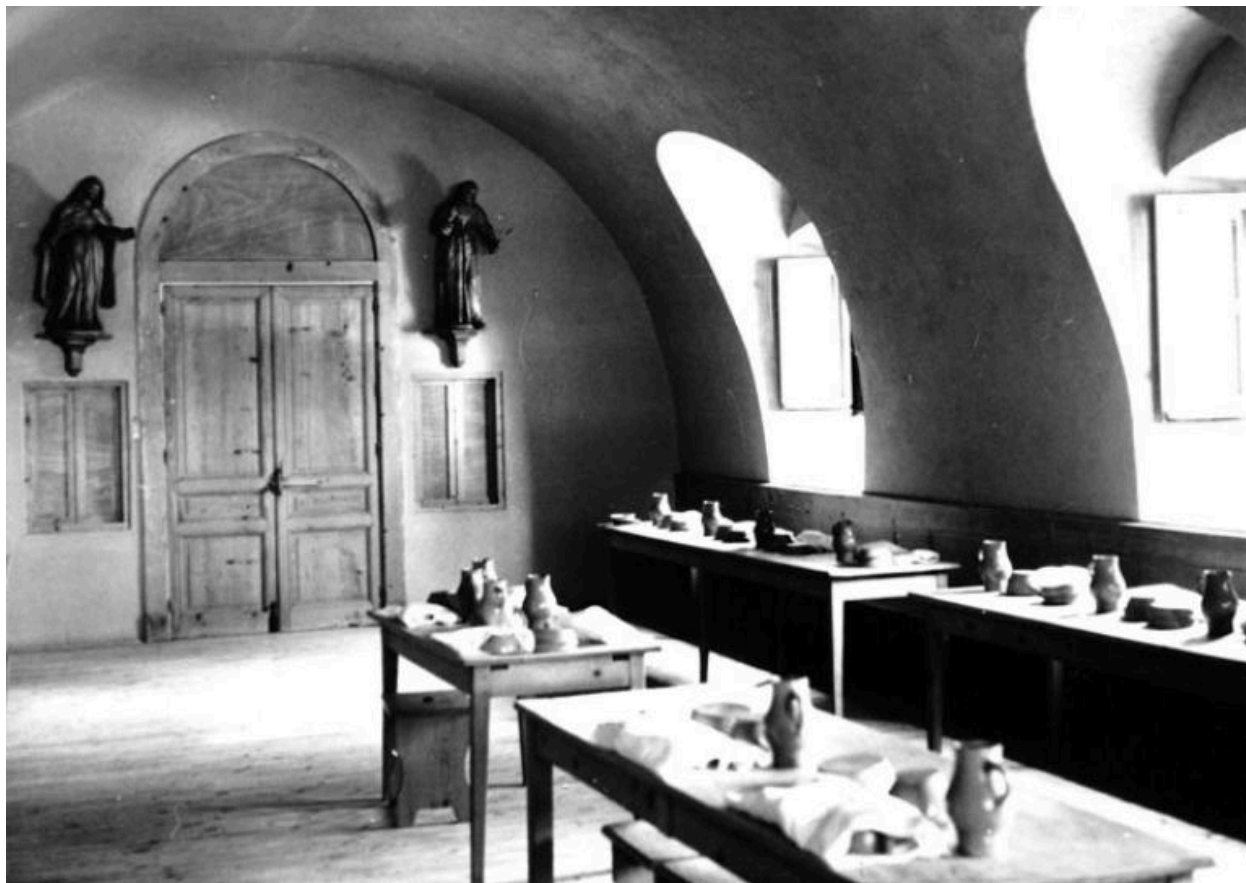
Monastère Sainte-Claire - 42 - Montbrison / LE REFECTOIRE [statues] (carte postale).