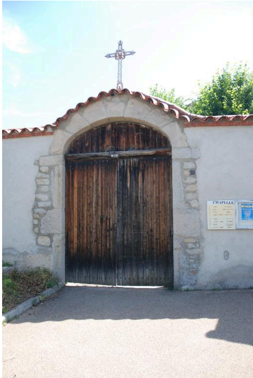
Entrée ouest du couvent.