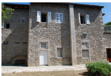
Vue d'une partie des bâtiments depuis le sud. IVR82_20154200376NUCA