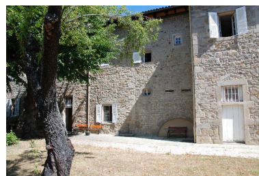
Vue d'une partie des bâtiments depuis le sud. IVR82_20154200377NUCA