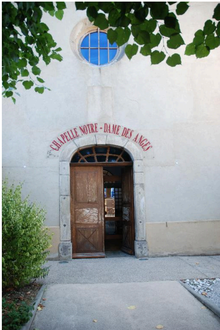
Vue sur l'entrée de la chapelle.