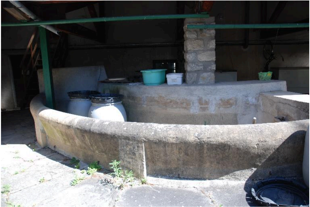
Vue du lavoir.