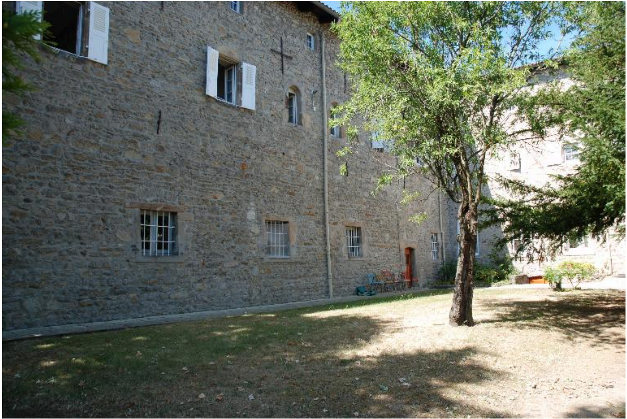
Vue d'une partie des bâtiments depuis le nord-est.