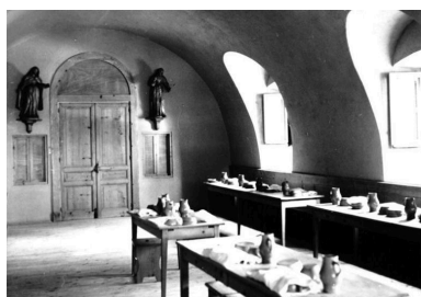
Monastère Sainte-Claire - 42 - Montbrison / LE REFECTOIRE [statues] (carte postale). IVR82_20054201677NUCB