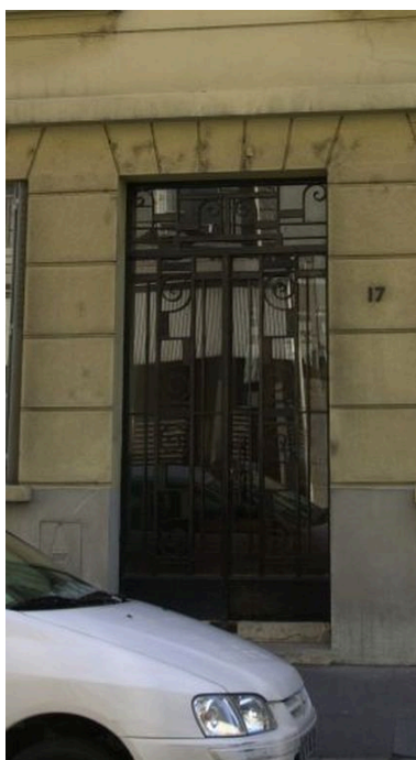
Porte d'entrée IVR82_20046903164NUCA