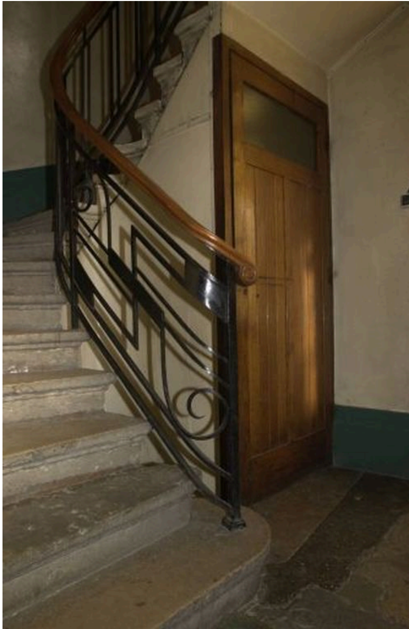
Départ de l'escalier