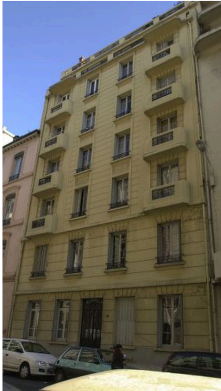
Vue générale de l'élévation