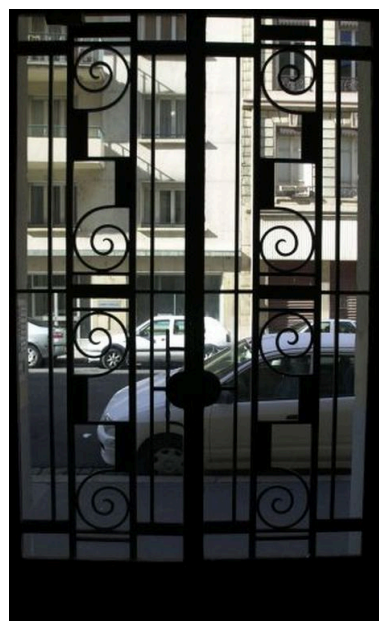
Vue intérieure de la porte d'entrée IVR82_20046903165NUCA