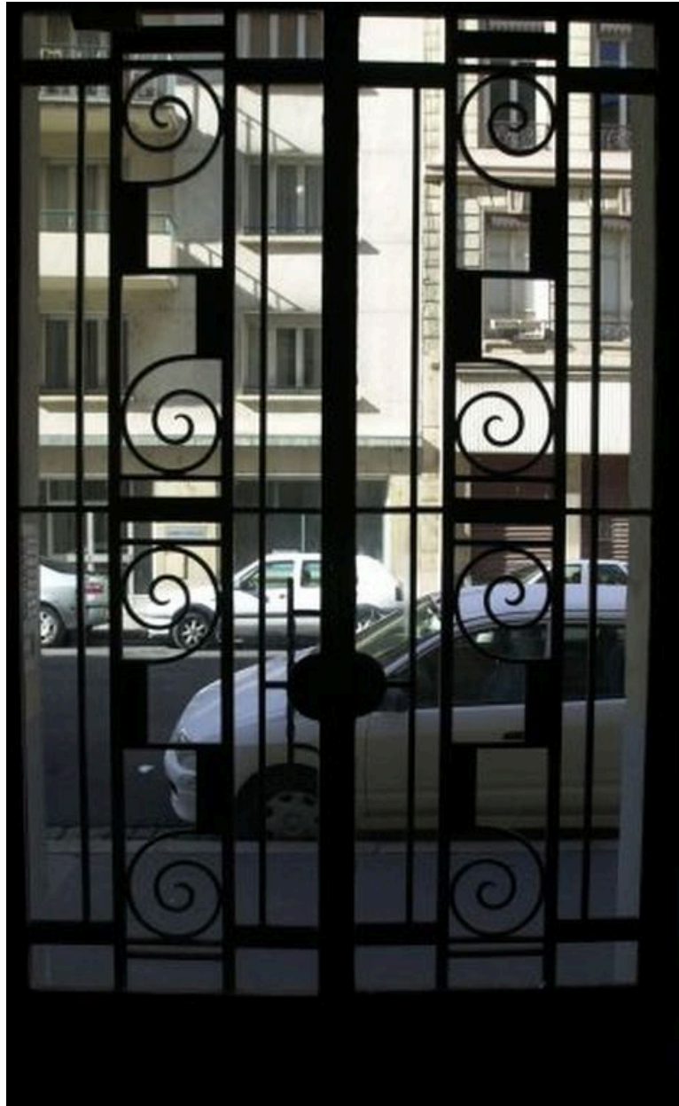
Vue intérieure de la porte d'entrée