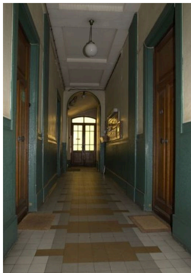
Vestibule d'entrée IVR82_20046903166NUCA