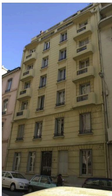
Vue générale de l'élévation IVR82_20046903312NUCA