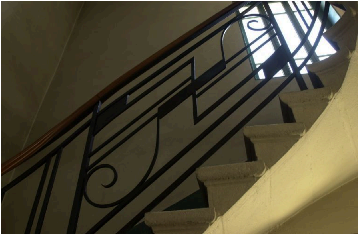
Détail de la rampe d'escalier