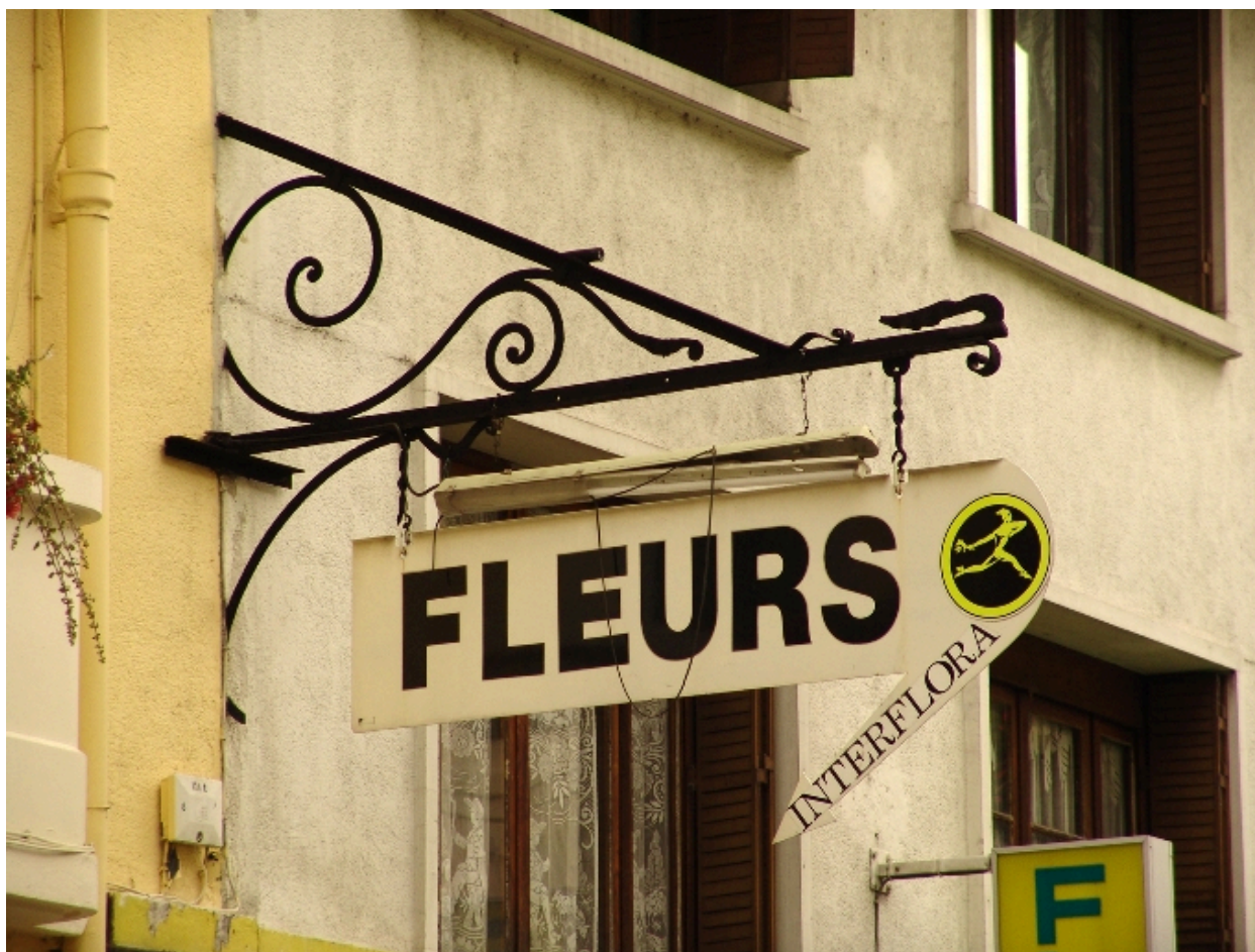
Détail de la potence d'une enseigne