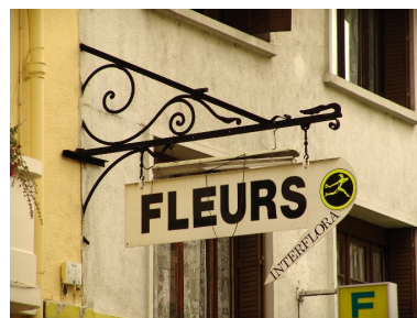
Détail de la potence d'une enseigne