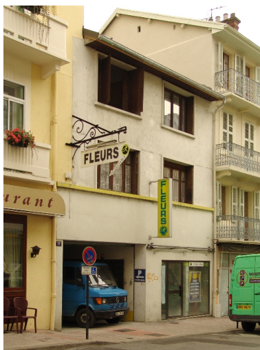
Façade sur la rue de Chambéry IVR82_20067300752NUCA