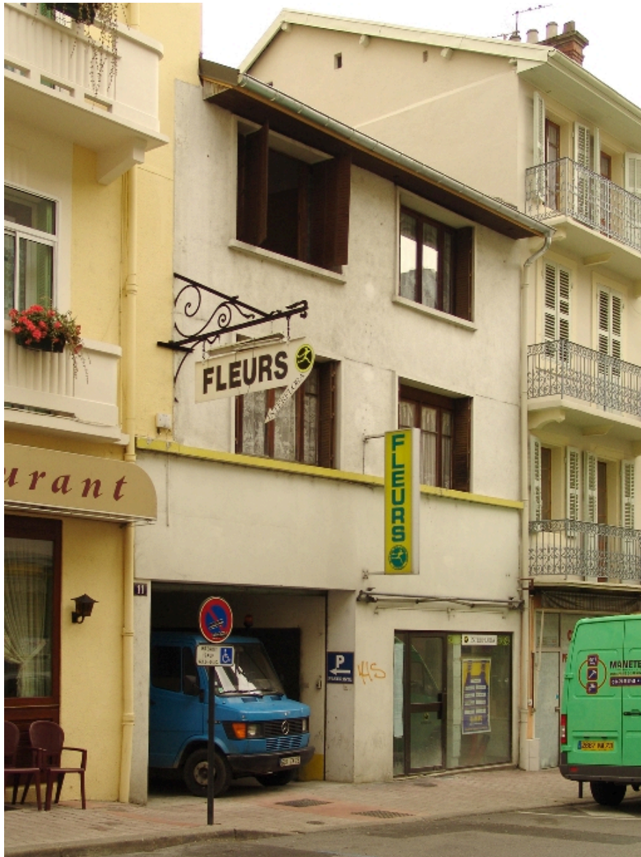
Façade sur la rue de Chambéry