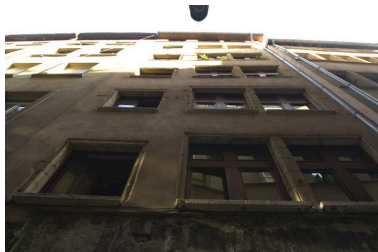
Façade, vue des étages IVR82_20046900007NUCA