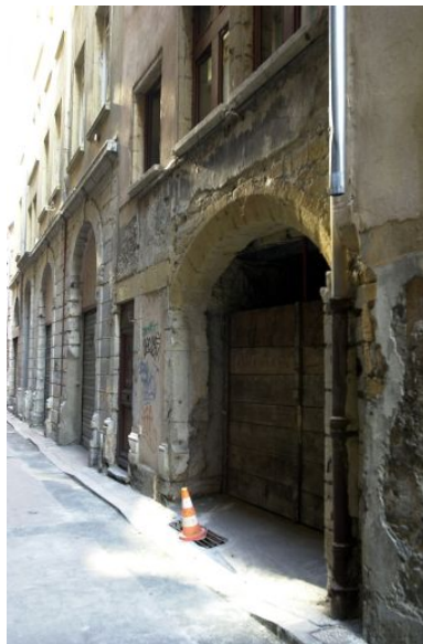
Façade, détail du rez-de-chaussée IVR82_20046900006NUCA