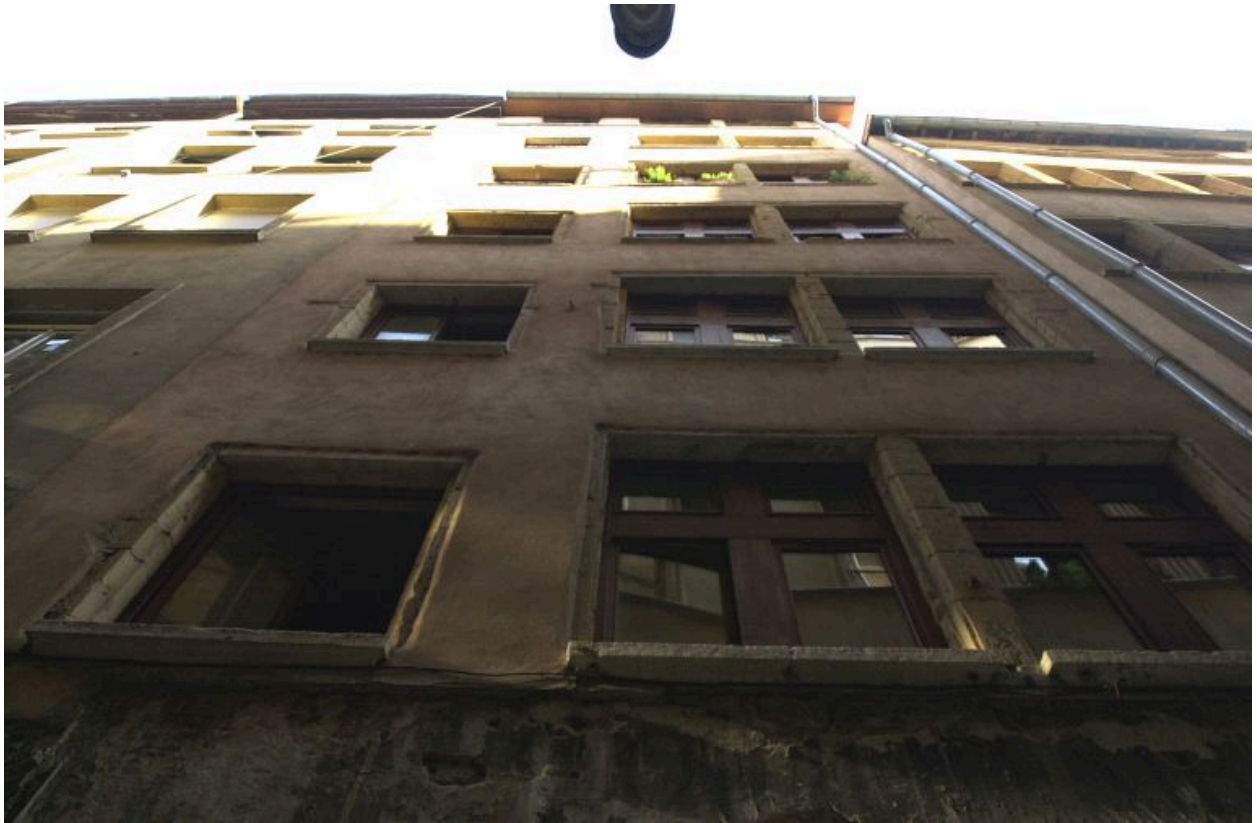
Façade, vue des étages