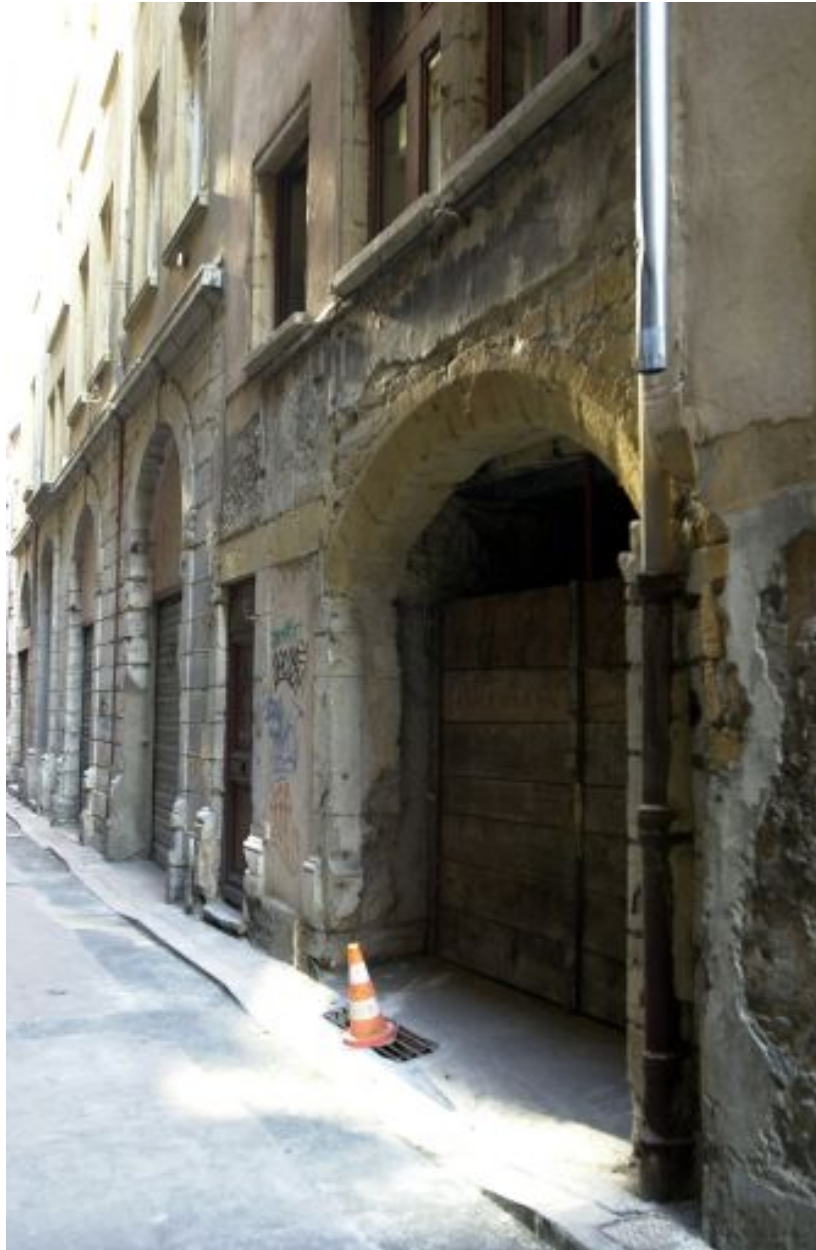
Façade, détail du rez-de-chaussée