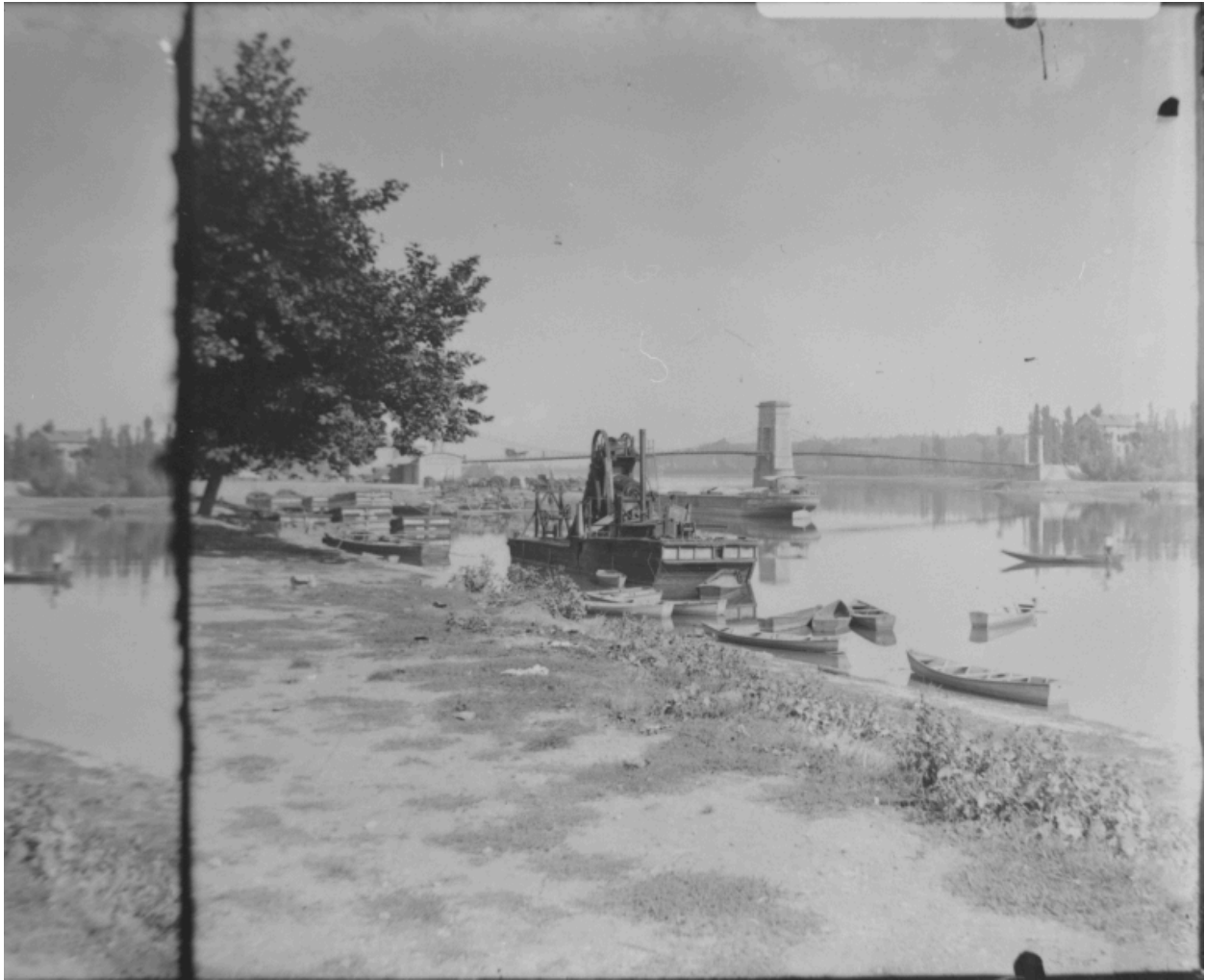
Ancien pont, vu depuis la rive droite. vers 1900, plaque de verre.