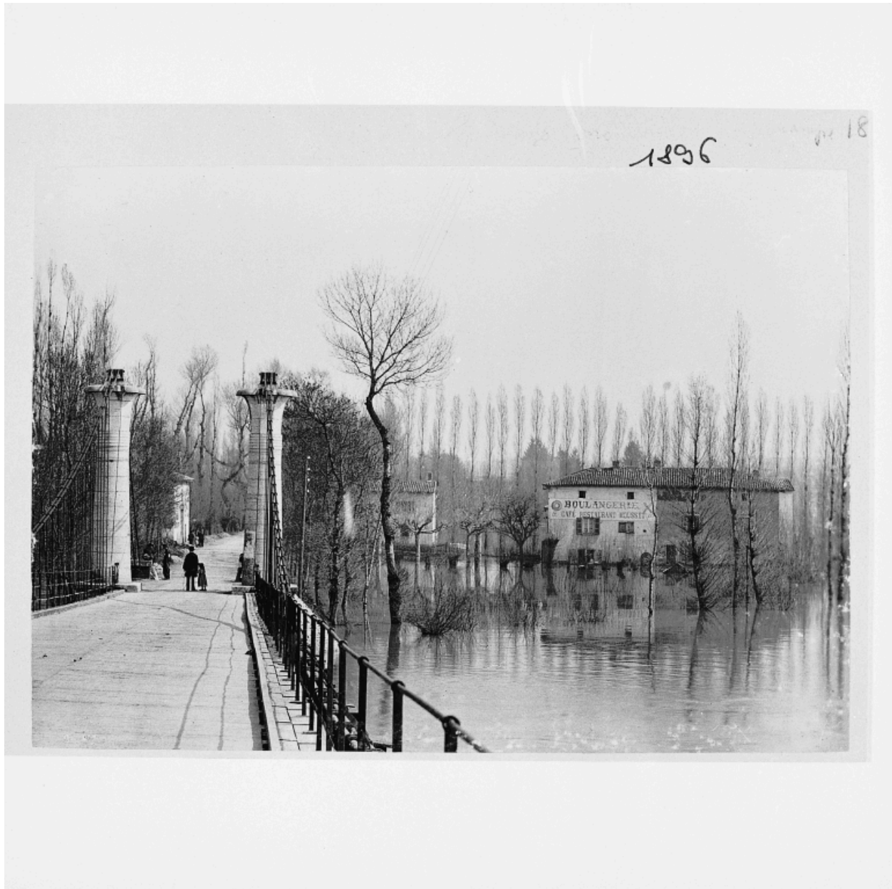
Ancien pont sur la Saône : inondation de 1896. Photogr., 1896.