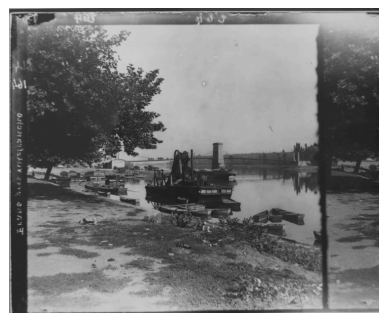
Frans près Francheville. Le pont et le port vus depuis la rive droite. vers 1900, plaque de verre. IVR82_19900100066XB