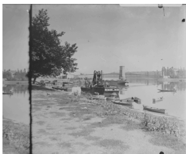
Ancien pont, vu depuis la rive droite. IVR82_19900100065XB