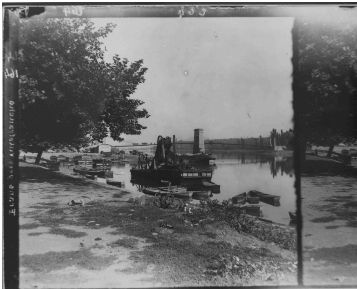
Frans près Francheville. Le pont et le port vue depuis la rive droite. vers 1900, plaque de verre.