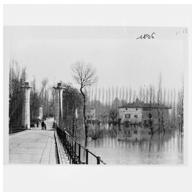
Ancien pont sur la Saône : inondation de 1896. Photogr., 1896.