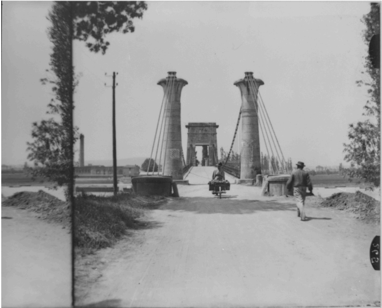
Entrée, rive gauche, de l'ancien pont sur la Saône. Photogr. par [Berthier], vers 1900, plaque de verre.