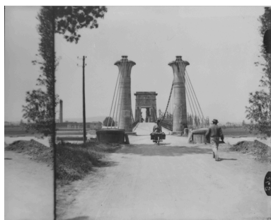
Entrée, rive gauche, de l'ancien pont sur la Saône.