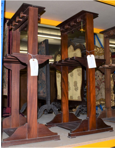
Vue générale IVR84_20226301272NUC4A