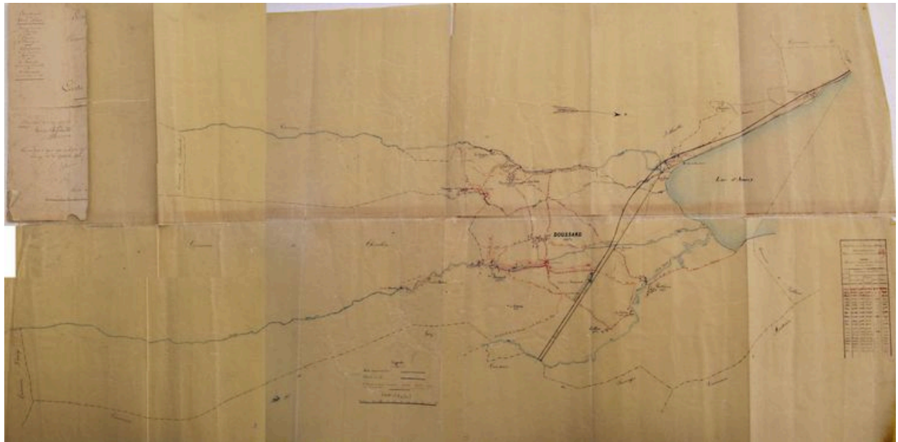
Carte des voies de Doussard du 17 septembre 1896