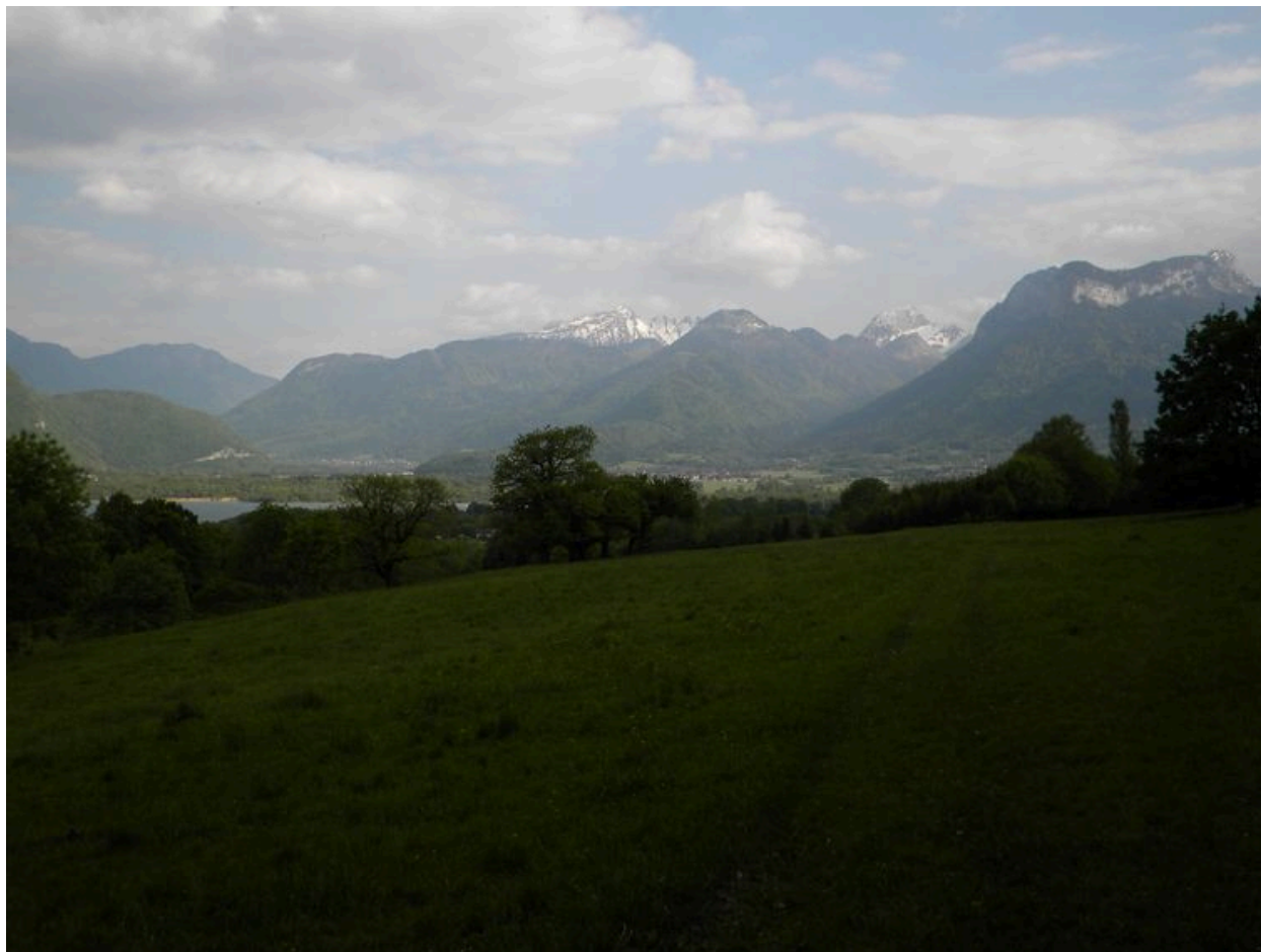
Vue de la plaine de Doussard avec le massif des Bauges en arrière plan depuis les ruines des Carres au dessus de Bredannaz.