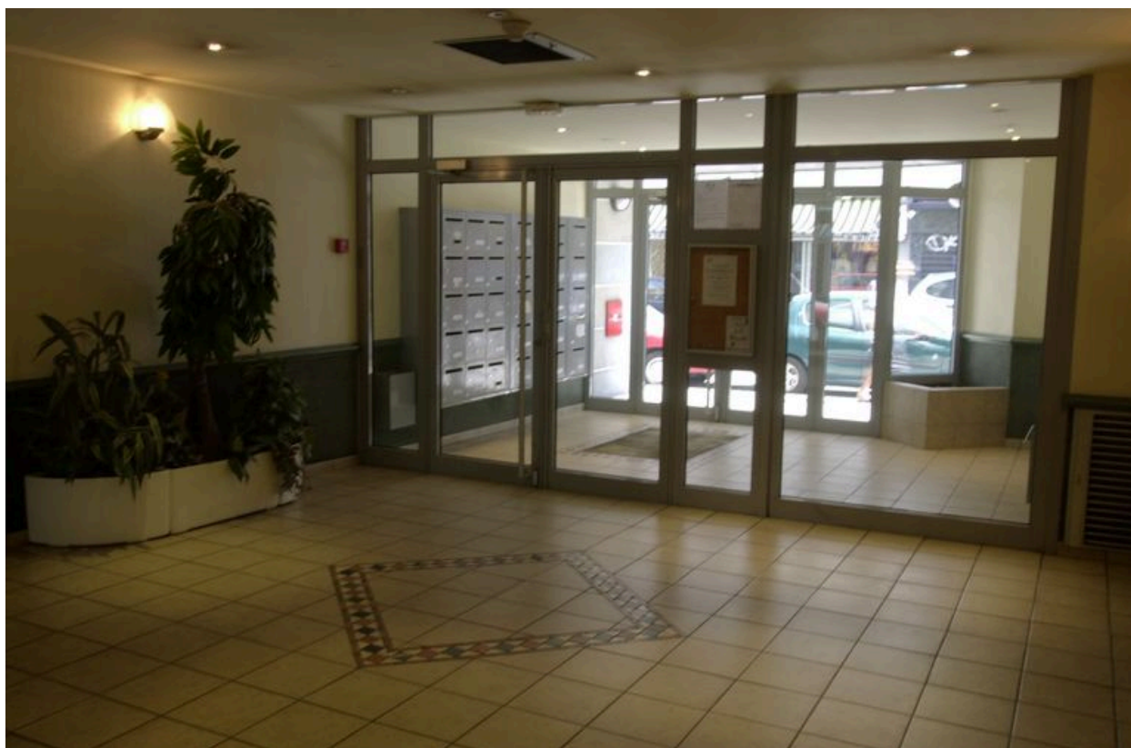
Vue du vestibule d'entrée