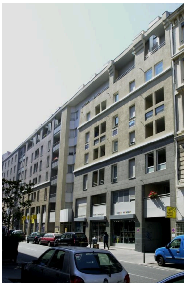
Élévation principale depuis l'ouest IVR82_20046906039NUCA