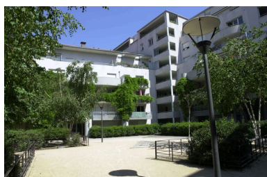
Élévations postérieures sur le square IVR82_20046906049NUCA