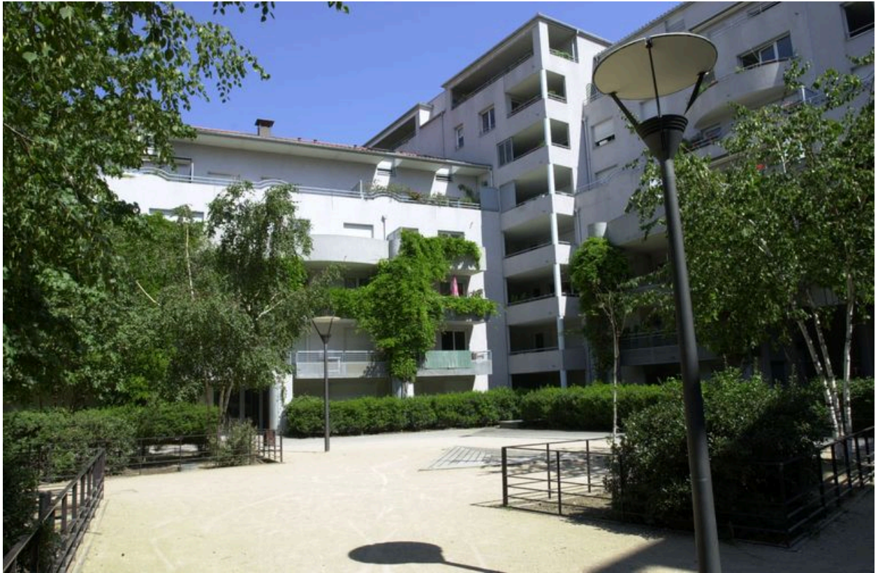
Elévations postérieures sur le square