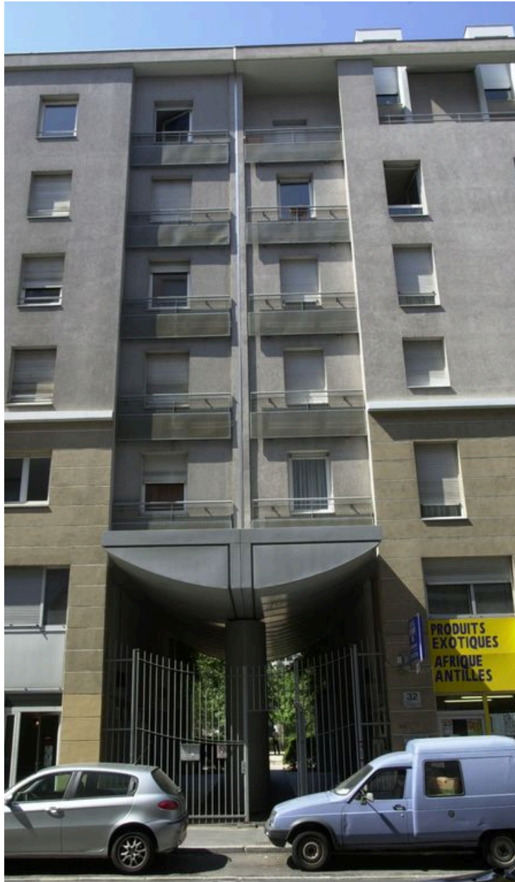
Passage couvert vers le square en coeur d'îlot