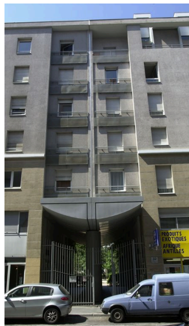
Passage couvert vers le square en coeur d'îlot