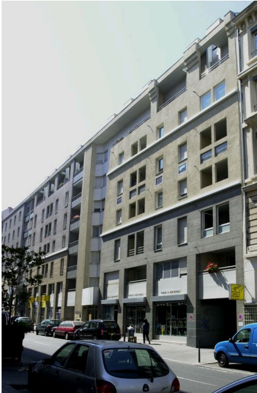
Elévation principale depuis l'ouest