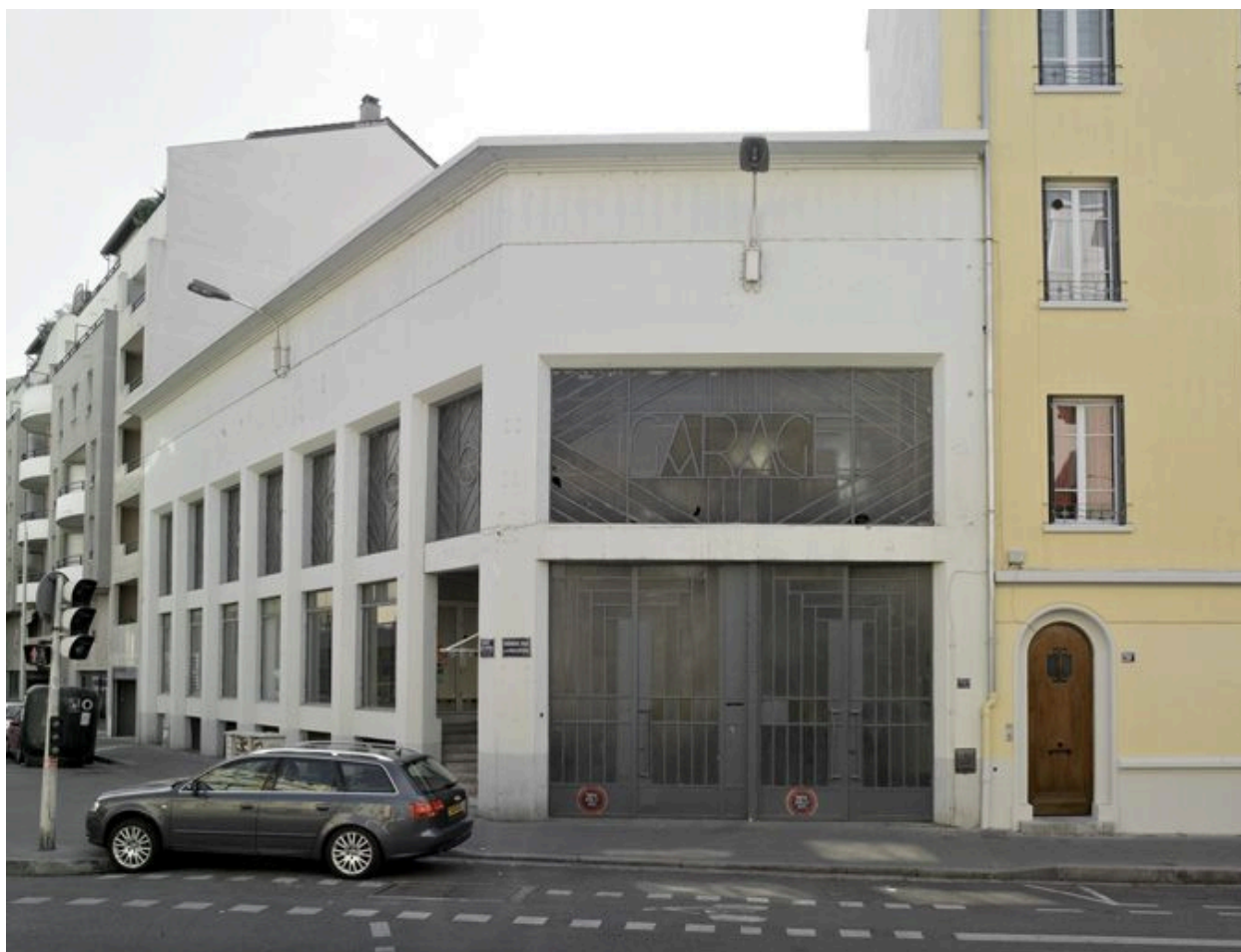
Vue générale depuis le nord