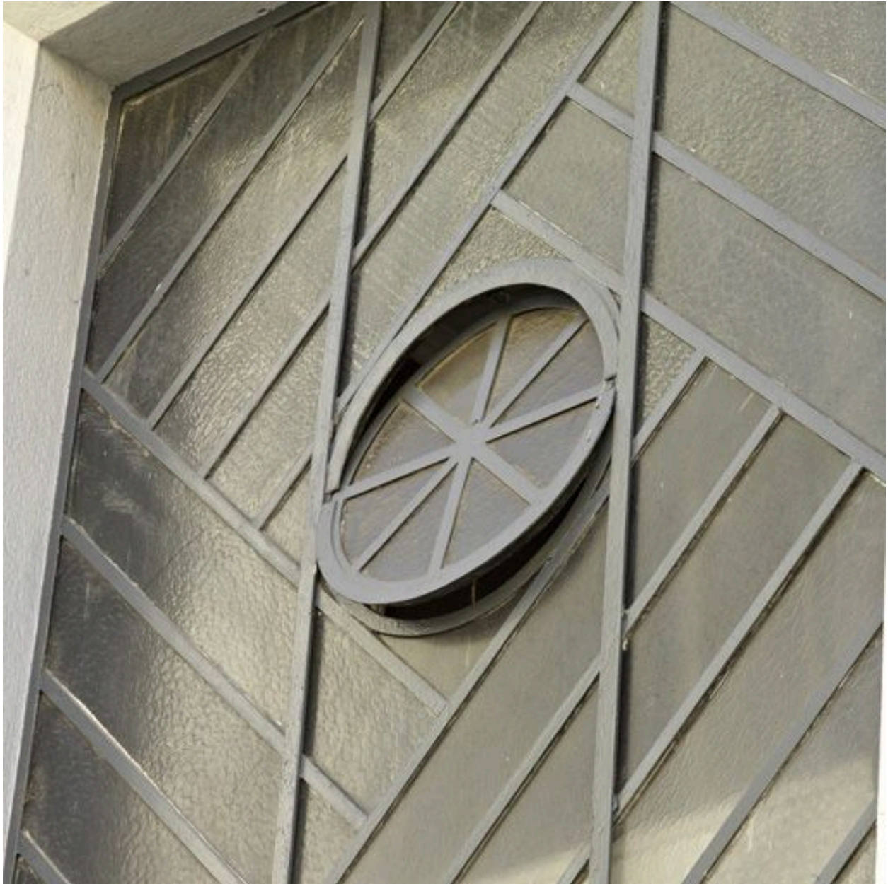
Détail de la porte principale