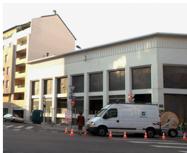
Elévation latérale IVR82_20136900971NUCA