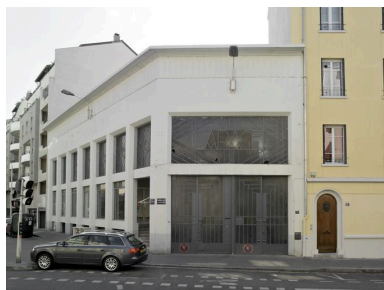
Vue générale depuis le nord