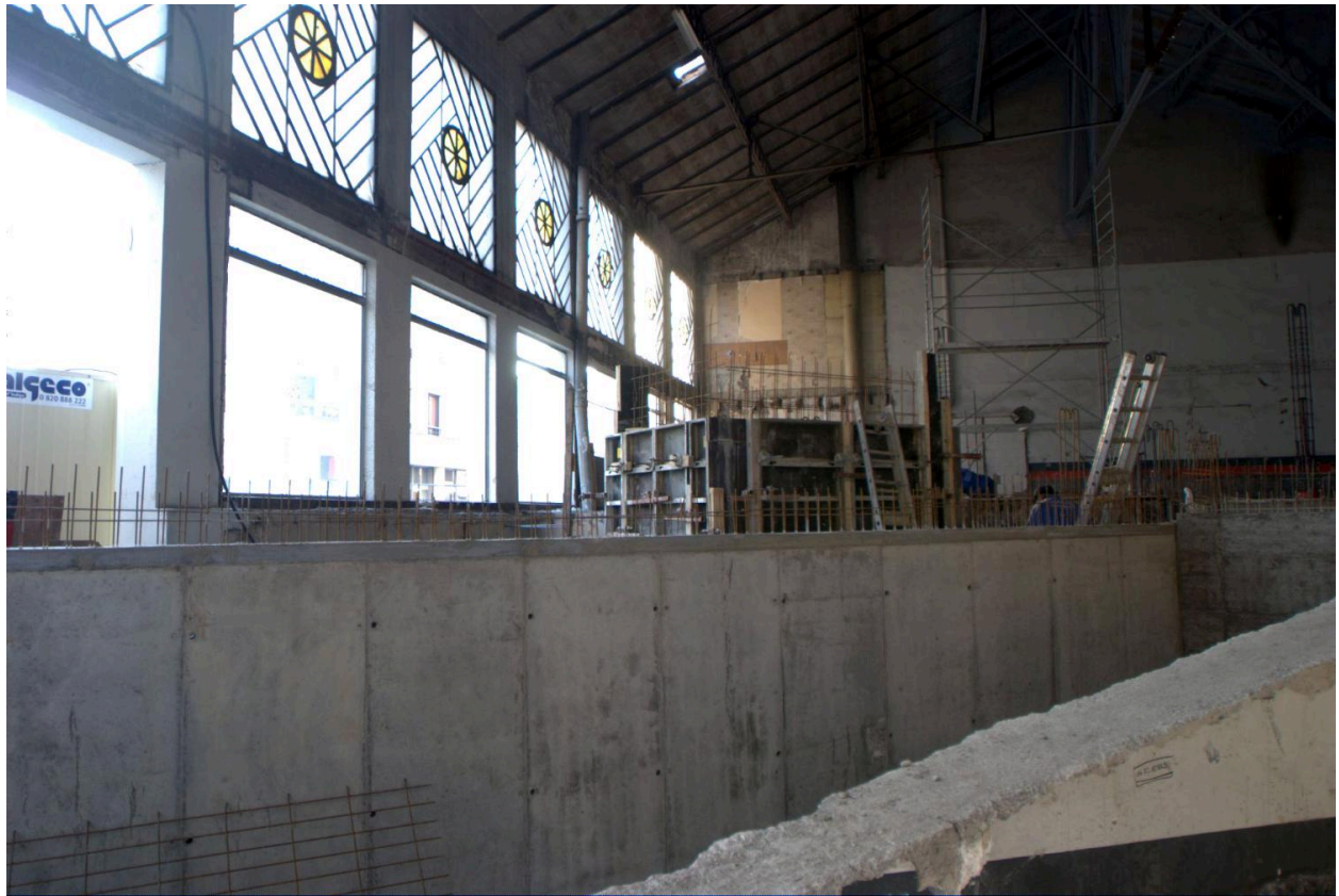
Vue intérieure en cours de travaux (janvier 2008)