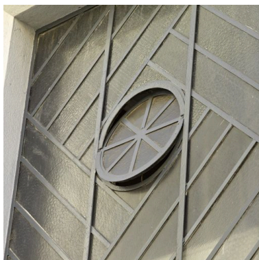
Détail de la porte principale IVR82_20076902434NUCA