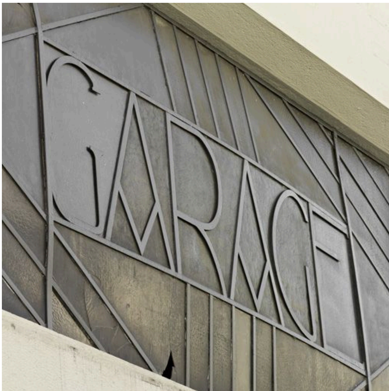
Détail de l'enseigne, porte principale