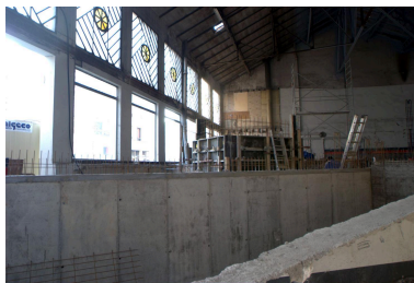
Vue intérieure en cours de travaux (janvier 2008)