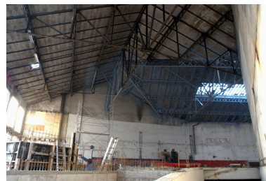
La charpente métallique