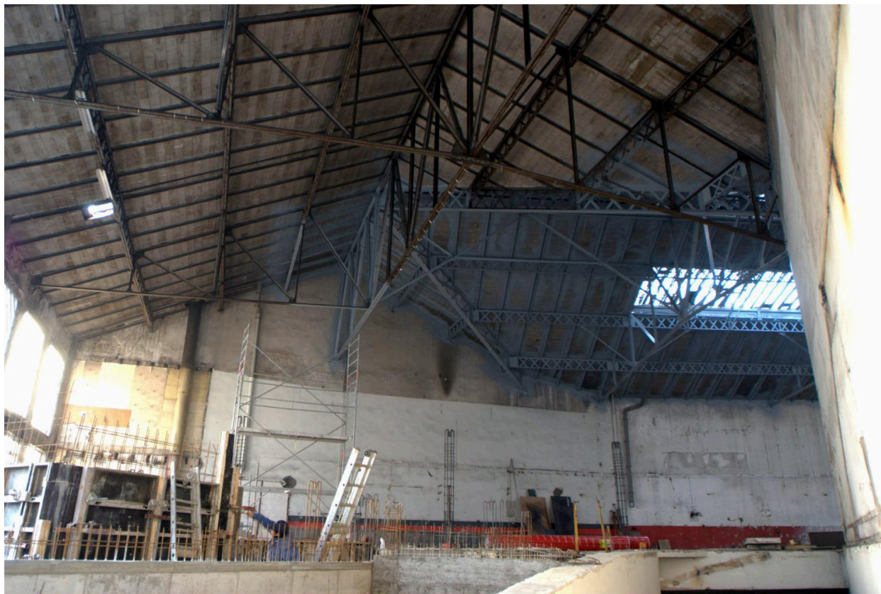
La charpente métallique