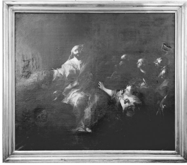
Vue générale IVR82_19786900082P