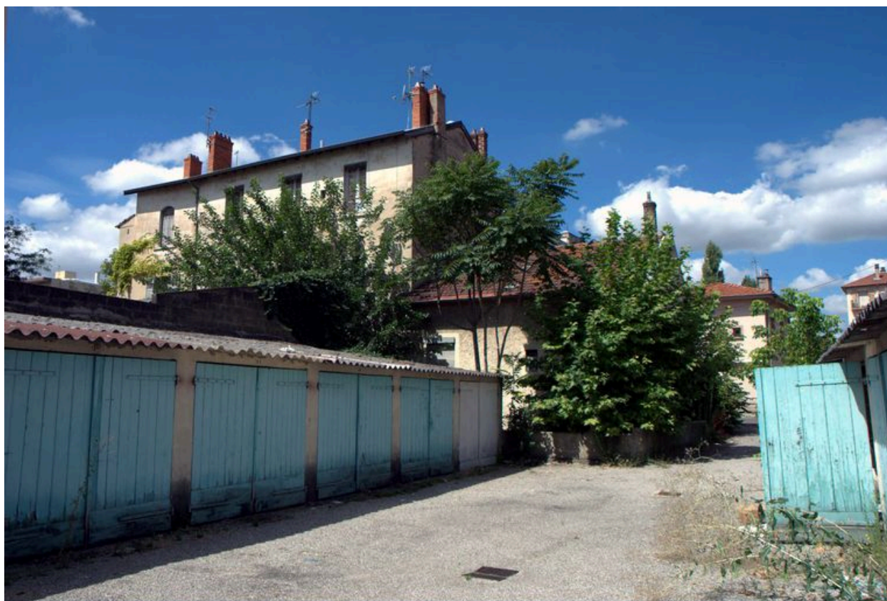
Vue des garages