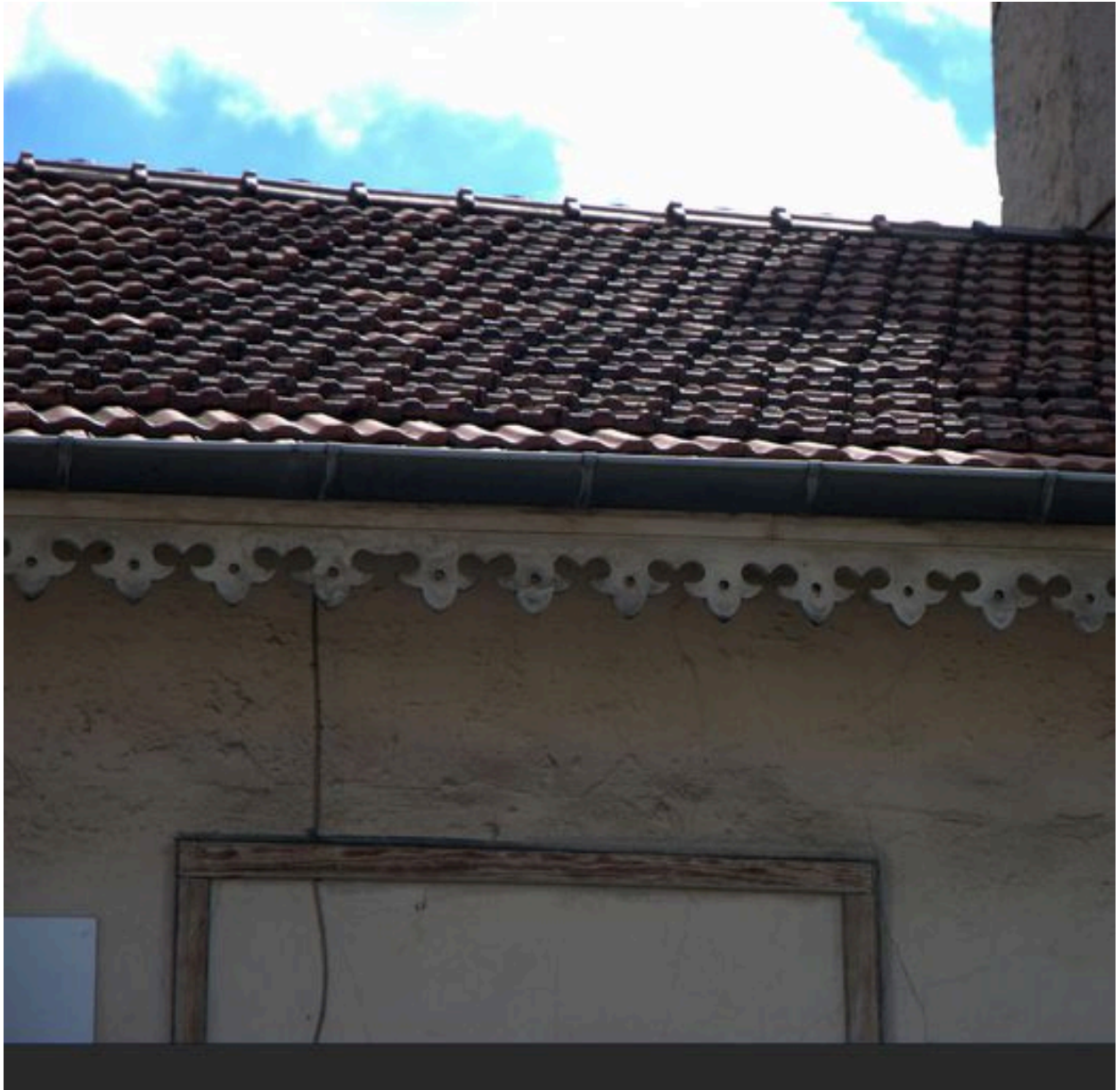
Elévation antérieure de l'immeuble, détail du lambrequin