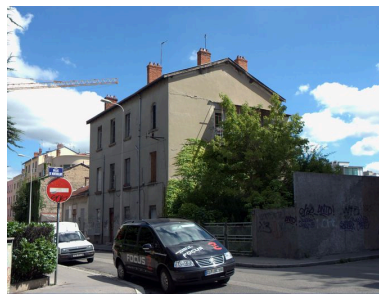
Vue d'ensemble depuis le sud IVR82_20086901432NUCA