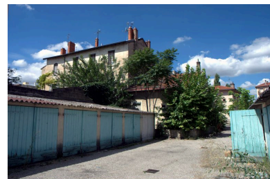
Vue des garages IVR82_20086901433NUCA