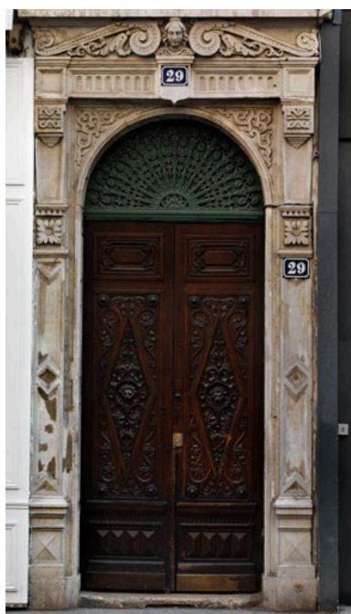
La porte