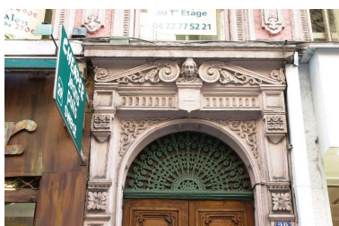
La porte : partie supérieure avec le tympan de ferronnerie IVR82_20046905235NUCA