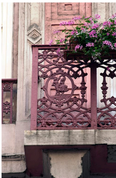
Garde-corps des balcons des deuxième et troisième étages carrés : panneau latéral orné d'un couple de danseurs IVR82_20046905232NUCA