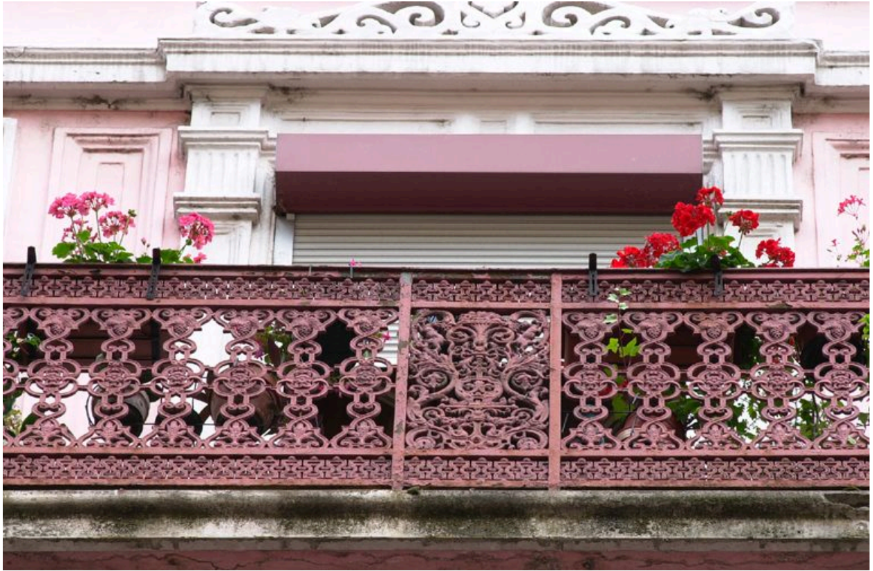
Garde-corps du balcon, quatrième étage carré : détail