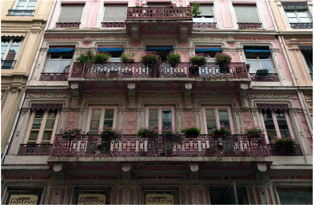
Vue des étages carrés ornés de balcons, état en 2004