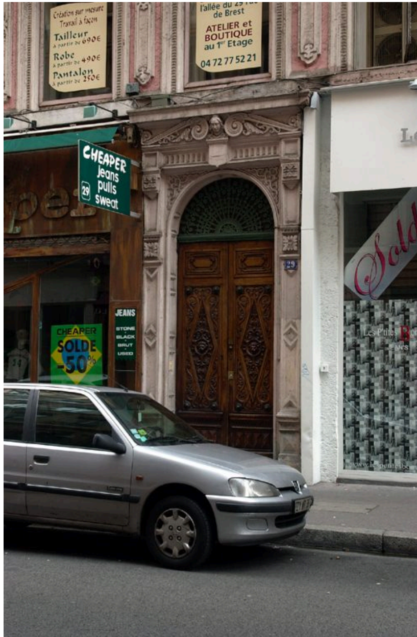
La porte, vue de situation