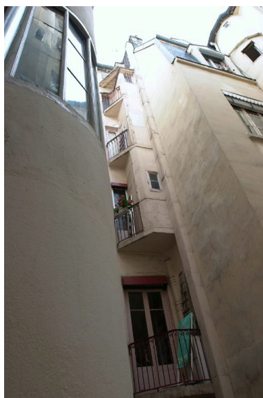
Vue de la cour depuis l'escalier du 31 rue de Brest IVR82_20046905236NUCA