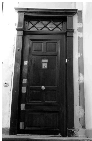
Porte palière IVR82_20046905252NUC