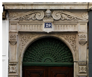
La porte, partie supérieure : dentelle de pierre et de fonte IVR82_20126901472NUCA