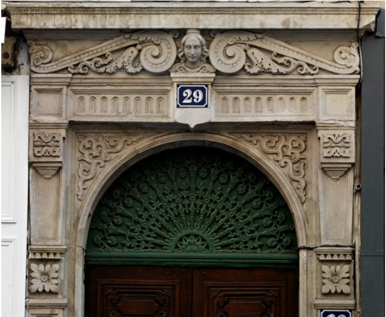
La porte, partie supérieure : dentelle de pierre et de fonte