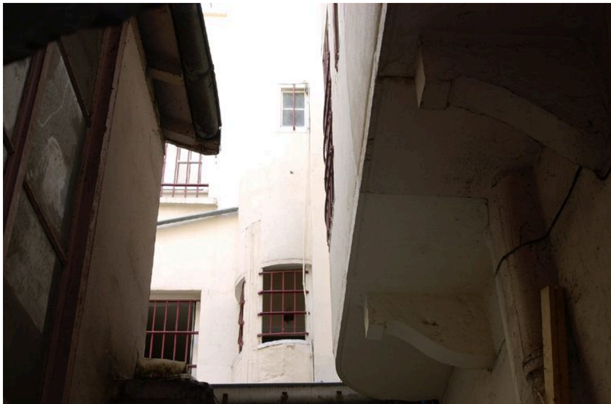
A gauche, vue partielle de la loge de concierge, à droite, corps de bâtiment en encorbellement