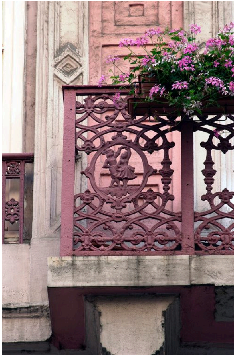
Garde-corps des balcons des deuxième et troisième étages carrés : panneau latéral orné d'un couple de danseurs