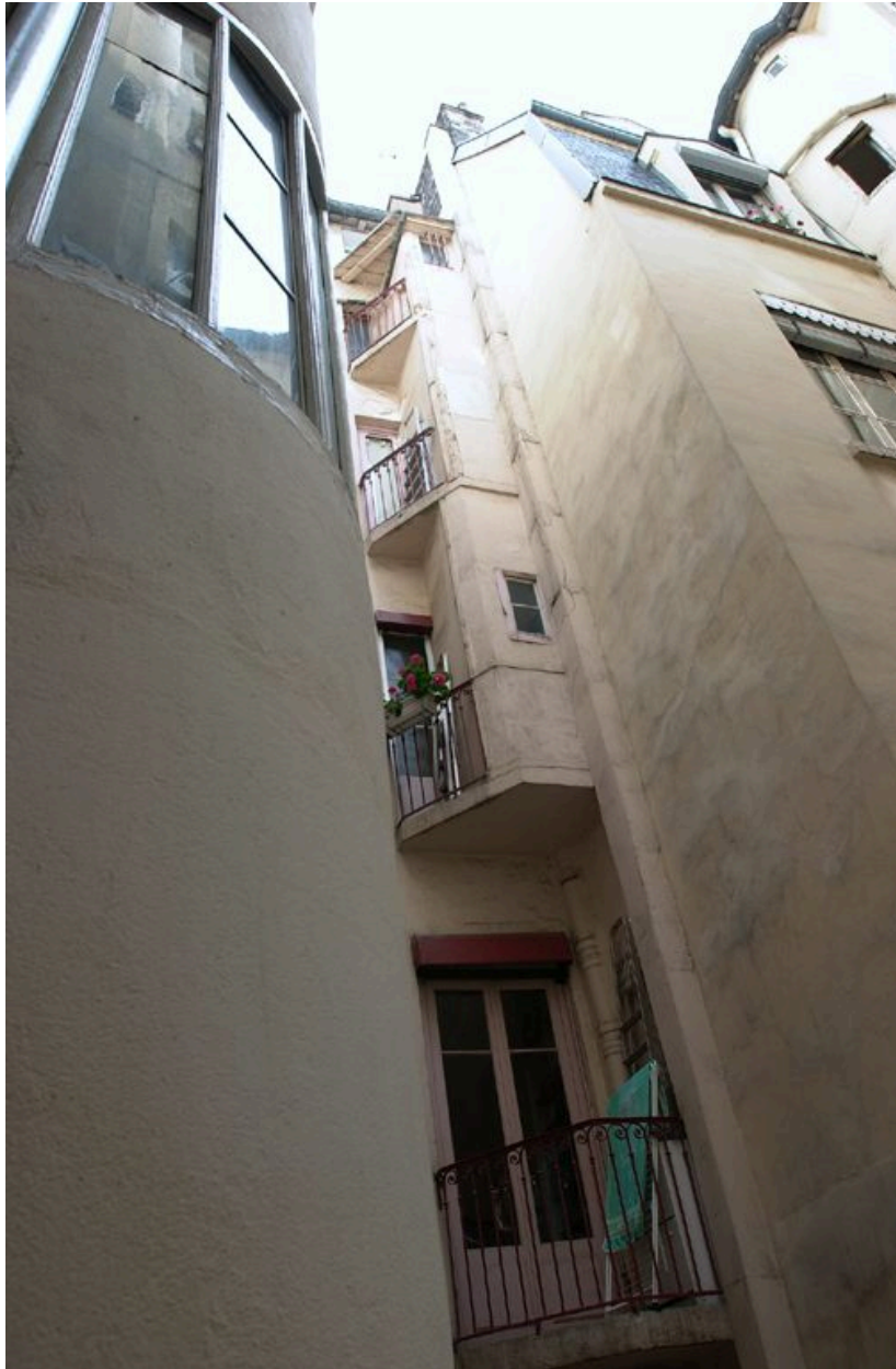
Vue de la cour depuis l'escalier du 31 rue de Brest