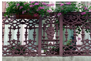
Garde-corps du balcon, deuxième étage carré : panneau central orné d'un sculpteur IVR82_20046905230NUCA