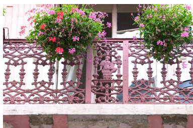
Garde-corps du balcon, troisième étage carré : panneau central orné d'un poète ? IVR82_20046905231NUCA