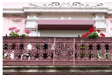
Garde-corps du balcon, quatrième étage carré : détail IVR82_20046905233NUCA