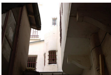
A gauche, vue partielle de la loge de concierge, à droite, corps de bâtiment en encorbellement IVR82_20046905251NUCA