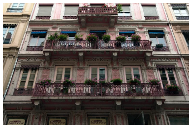
Vue des étages carrés ornés de balcons, état en 2004