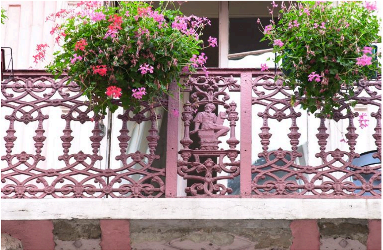
Garde-corps du balcon, troisième étage carré : panneau central orné d'un poète ?