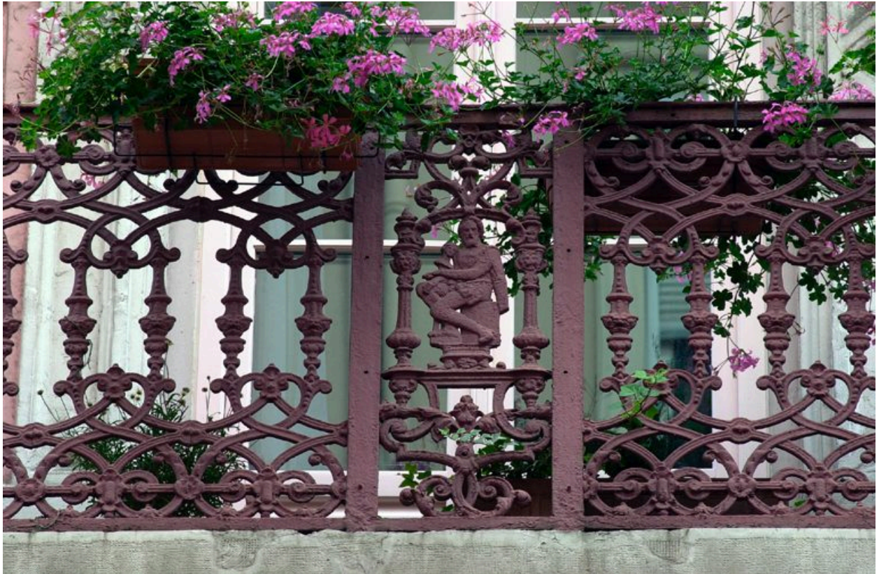
Garde-corps du balcon, deuxième étage carré : panneau central orné d'un sculpteur