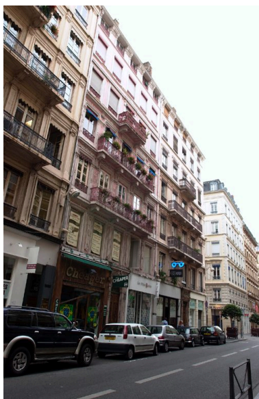
Vue de situation IVR82_20046905222NUCA