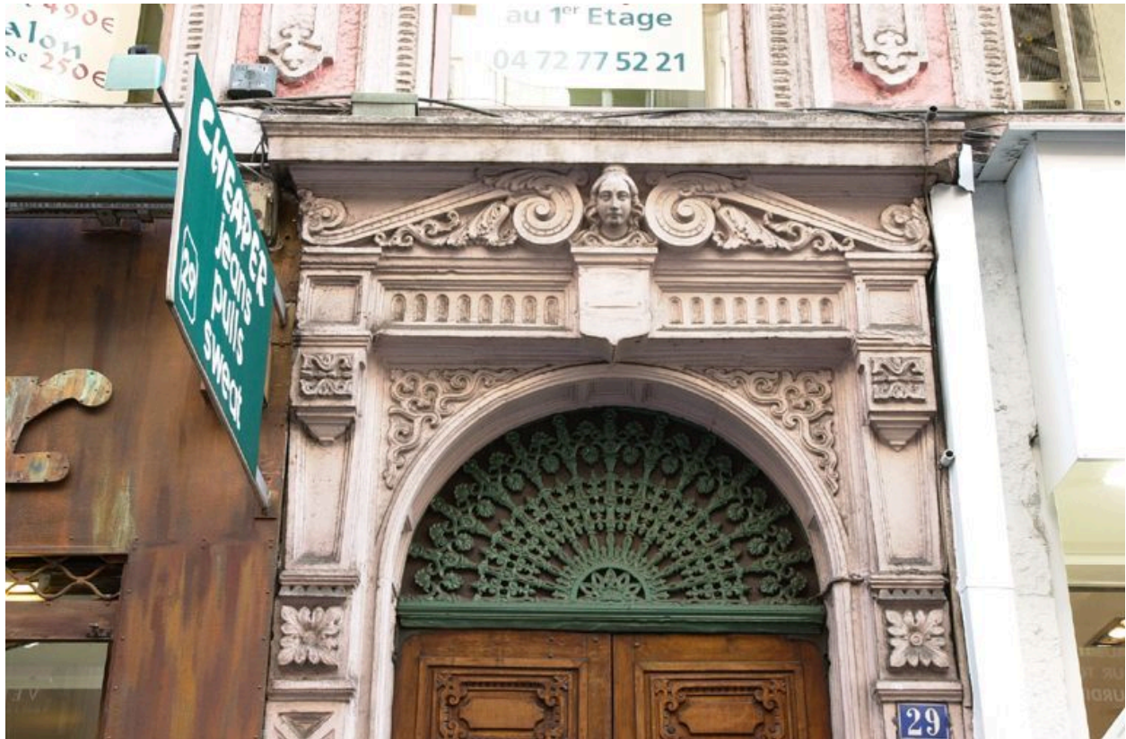
La porte : partie supérieure avec le tympan de ferronnerie