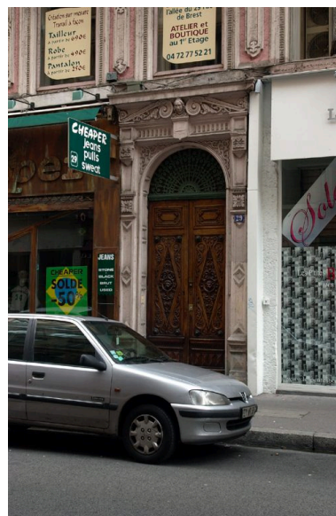
La porte, vue de situation