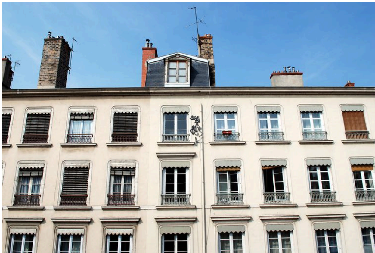
Détail des étages supérieurs depuis la grenette, sise 21 rue de Brest