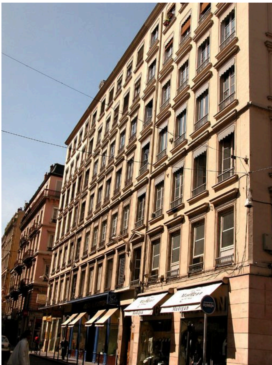
Vue d'ensemble avec les immeubles mitoyens (28 et 30 rue de Brest)