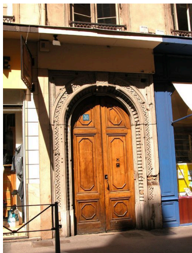
Détail de la porte : vue extérieure IVR82_20046905121NUCA