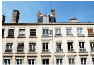
Détail des étages supérieurs depuis la grenette, sise 21 rue de Brest IVR82_20096902288NUCA