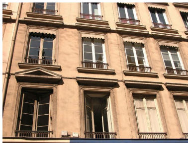
Vue partielle de l'élévation IVR82_20046905120NUCA