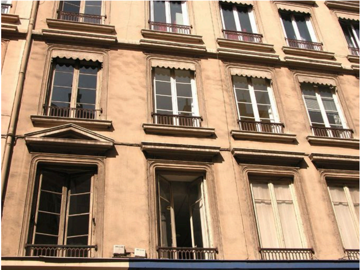
Vue partielle de l'élévation