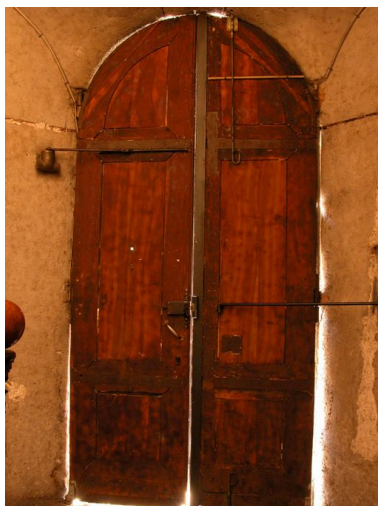
Détail de la porte : vue intérieure IVR82_20046905122NUCA