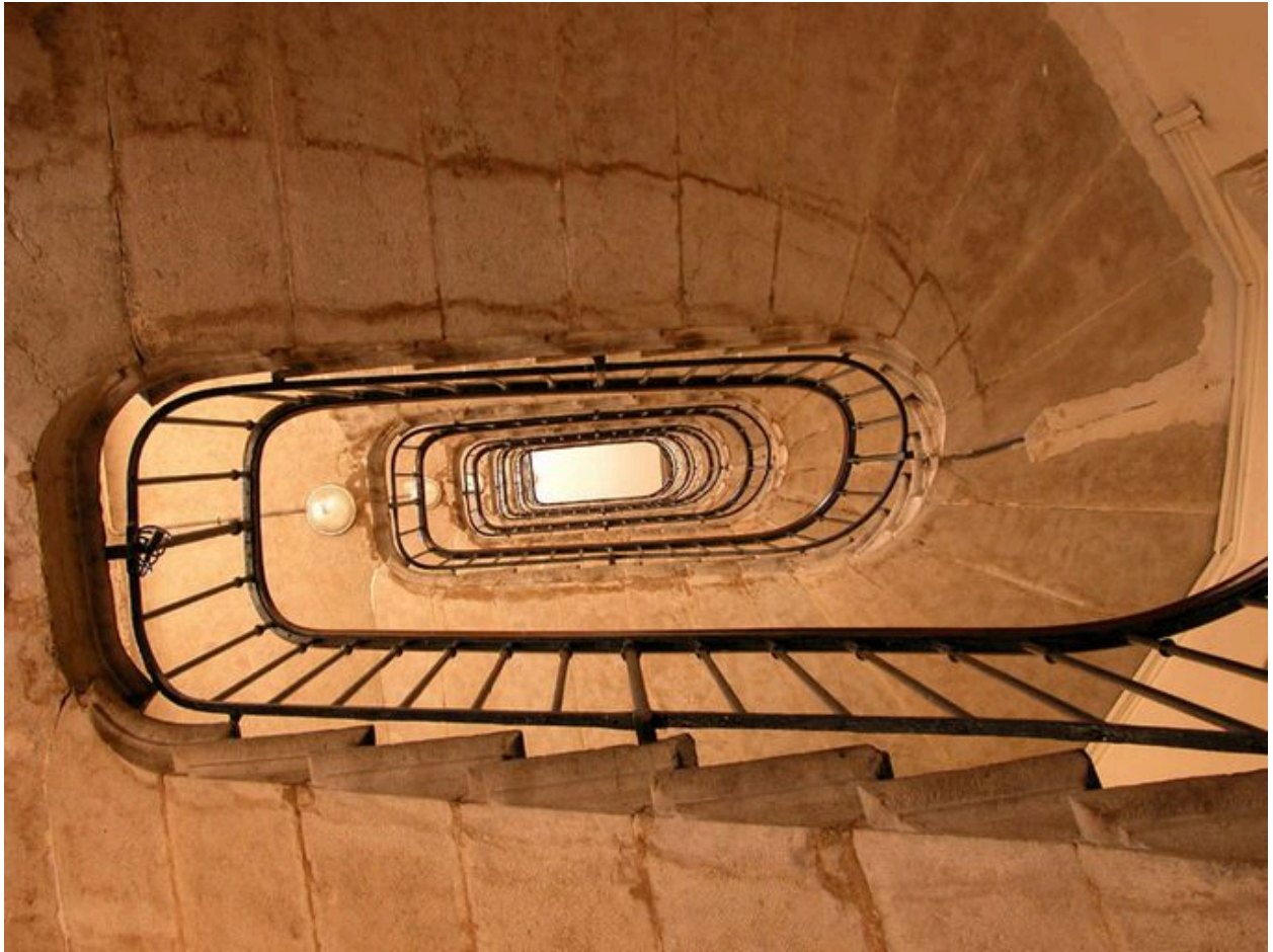
Vue de l'escalier en contre-plongée