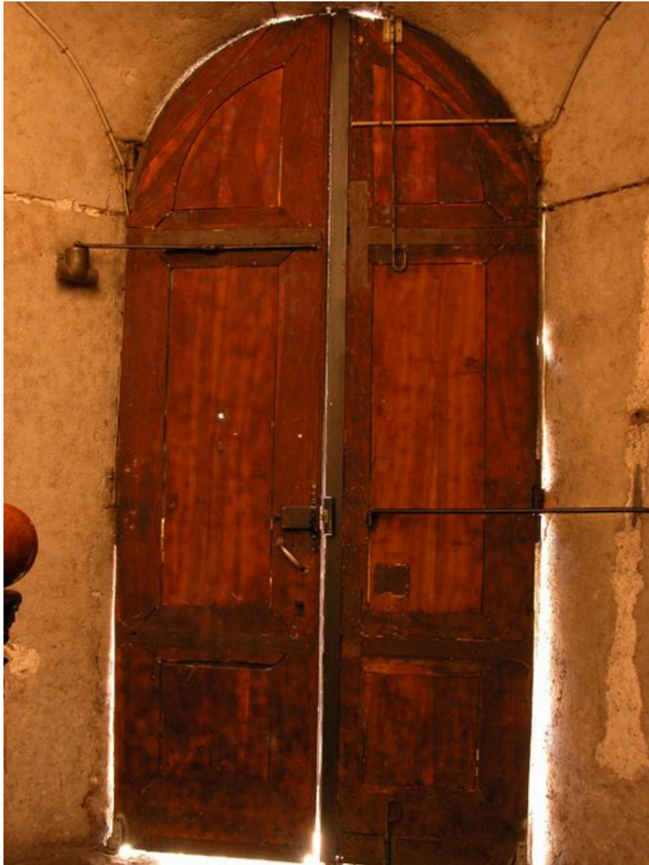
Détail de la porte : vue intérieure