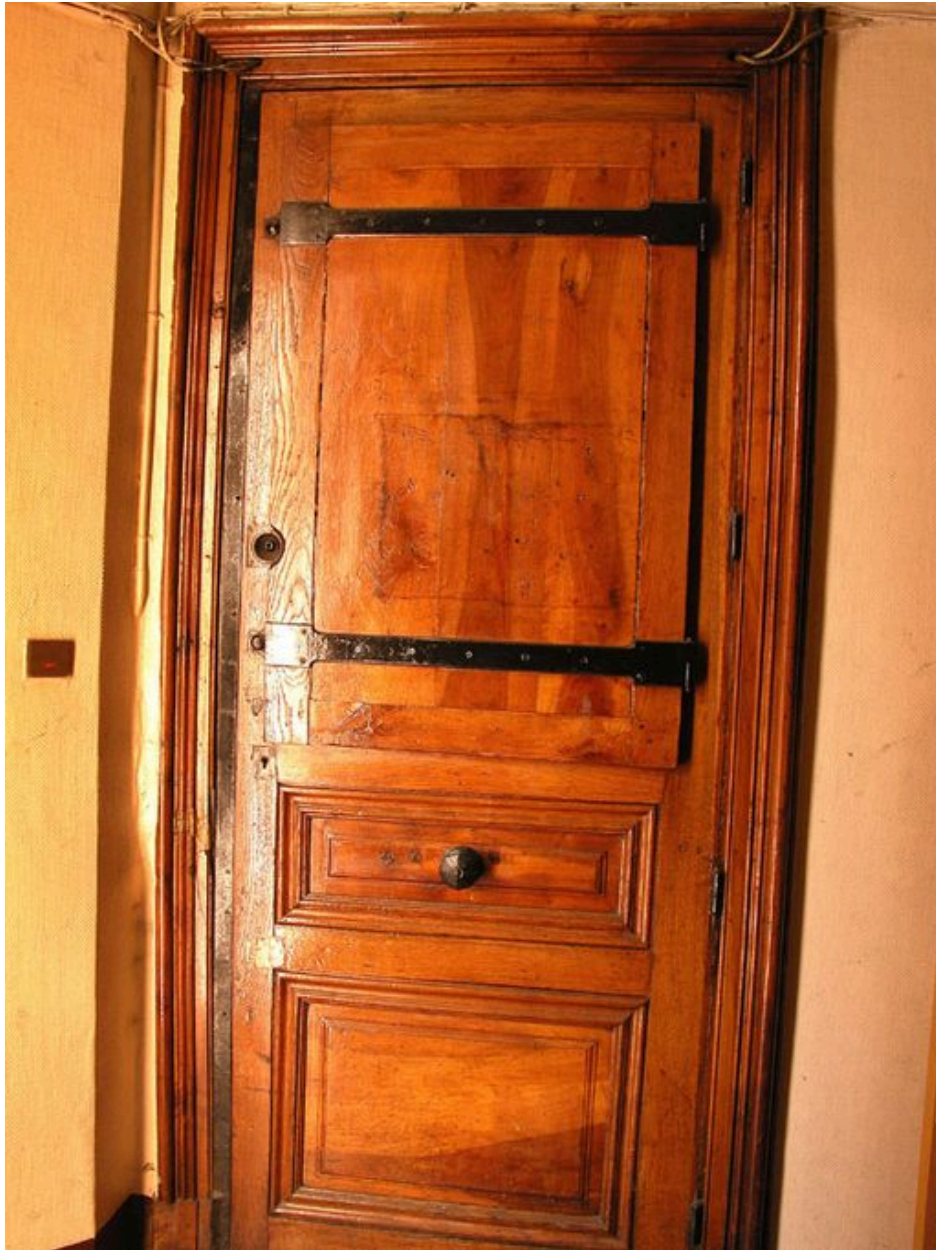
Rez-de-chaussée : détail d'une porte palière