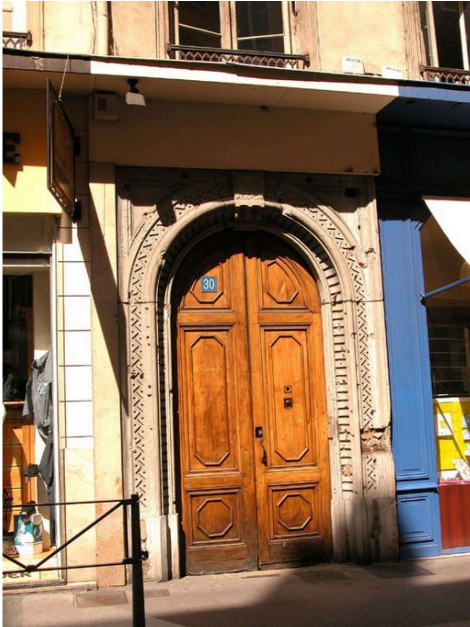
Détail de la porte : vue extérieure