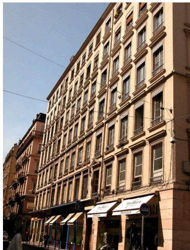
Vue d'ensemble avec les immeubles mitoyens (28 et 30 rue de Brest) IVR82_20046905119NUCA