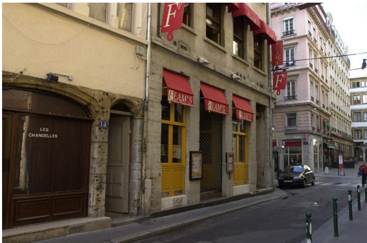
Vue de situation rue Tupin