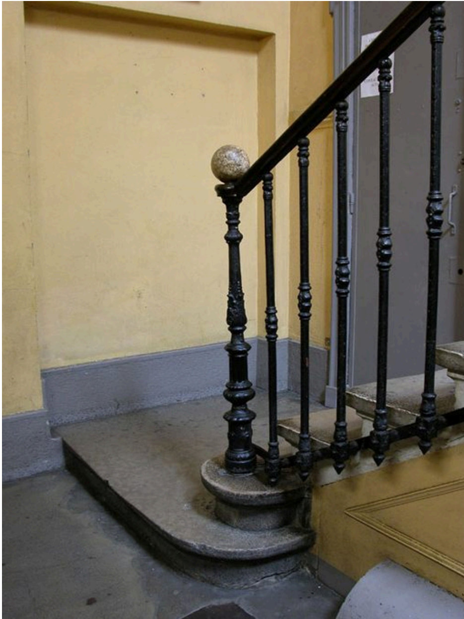
Départ de l'escalier