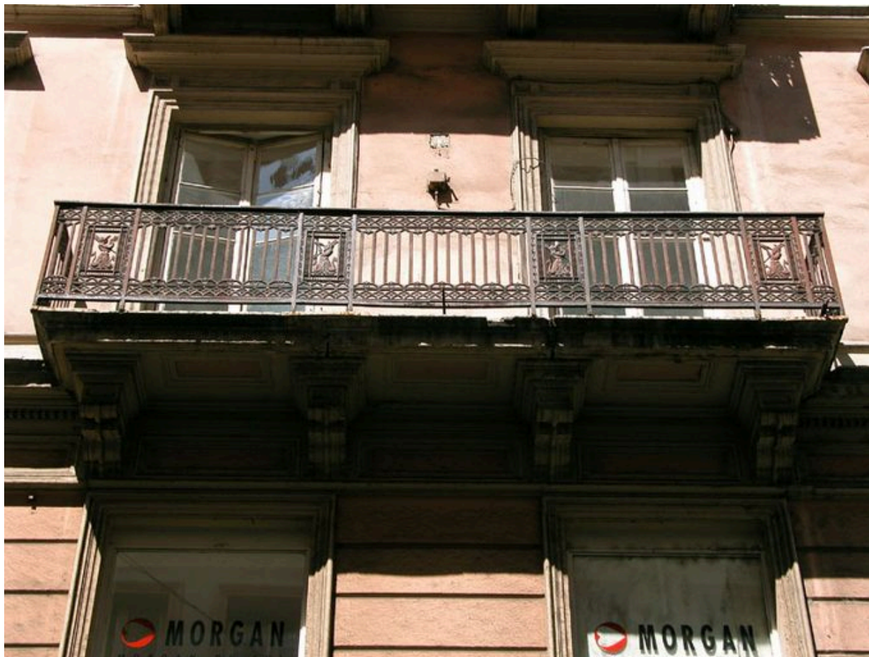
Détail d'un balcon de la rue de Brest