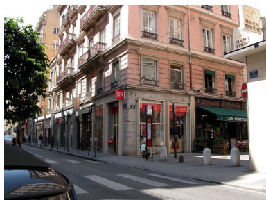
Le rez-de-chaussée IVR82_20046905151NUCA