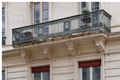
L'un des balcons sur la rue de Brest IVR84_20226900495NUCAQ