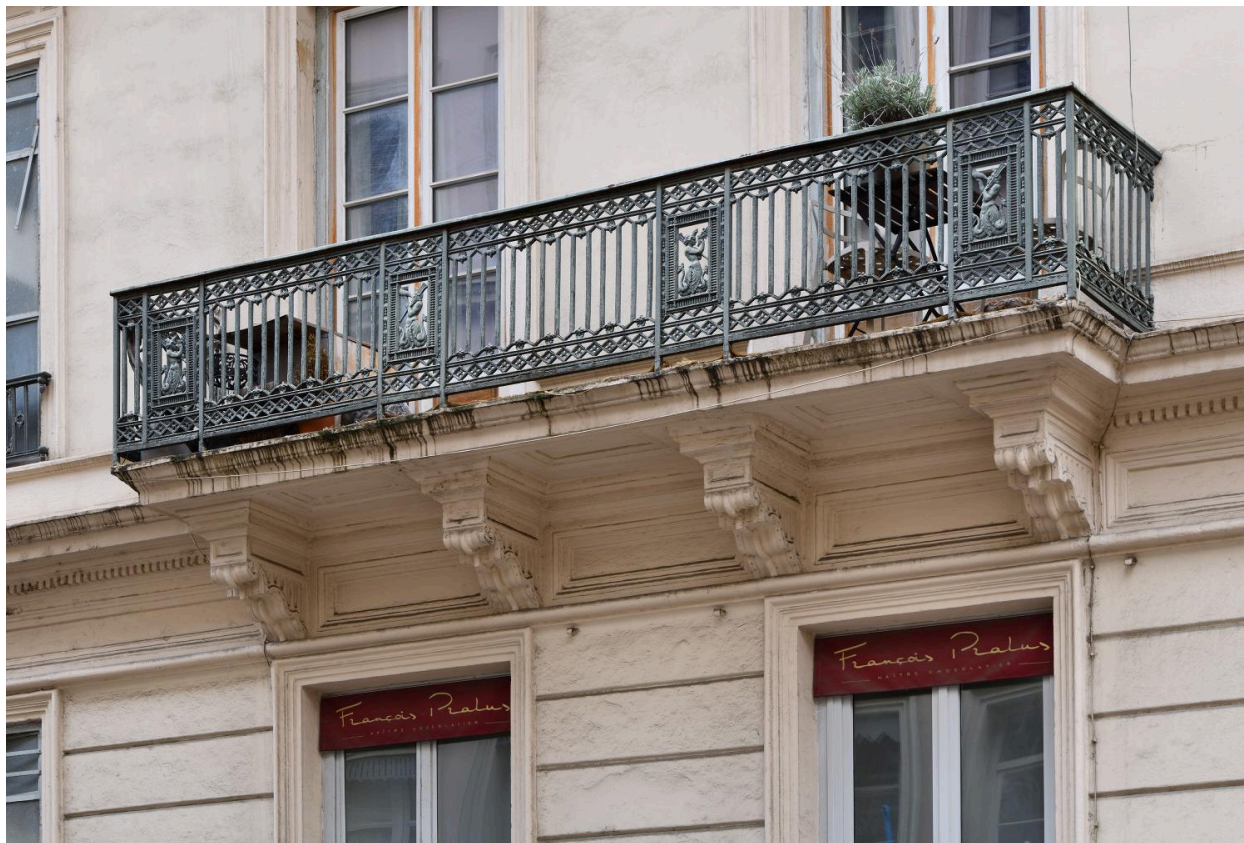
L'un des balcons sur la rue de Brest