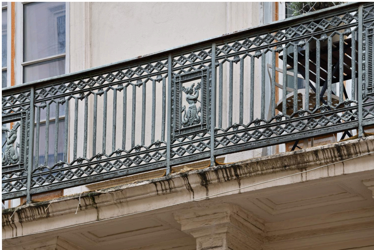
Balcons de la rue de Brest : détail d'un panneau figuré