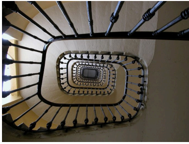
La cage d'escalier en contre-plongée