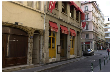
Vue de situation rue Tupin IVR82_20046905285NUCA