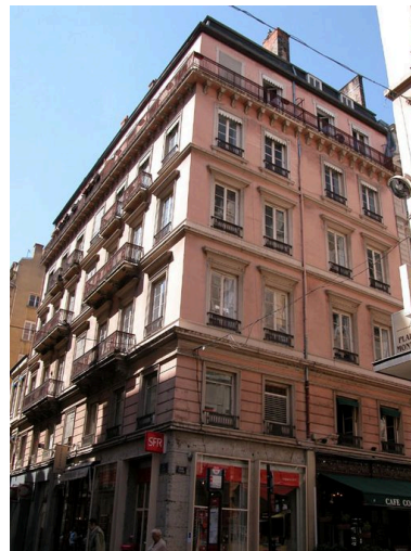
Vue générale IVR82_20046905150NUCA