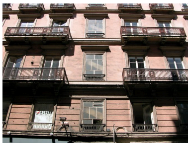
Travées centrales sur la rue de Brest IVR82_20046905152NUCA