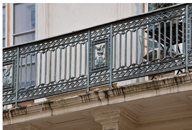
Balcons de la rue de Brest : détail d'un panneau figuré IVR84_20226900497NUCAQ