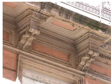
Consoles à volutes supportant la plate-forme ornée de tables du balcon IVR82_20046905154NUCA