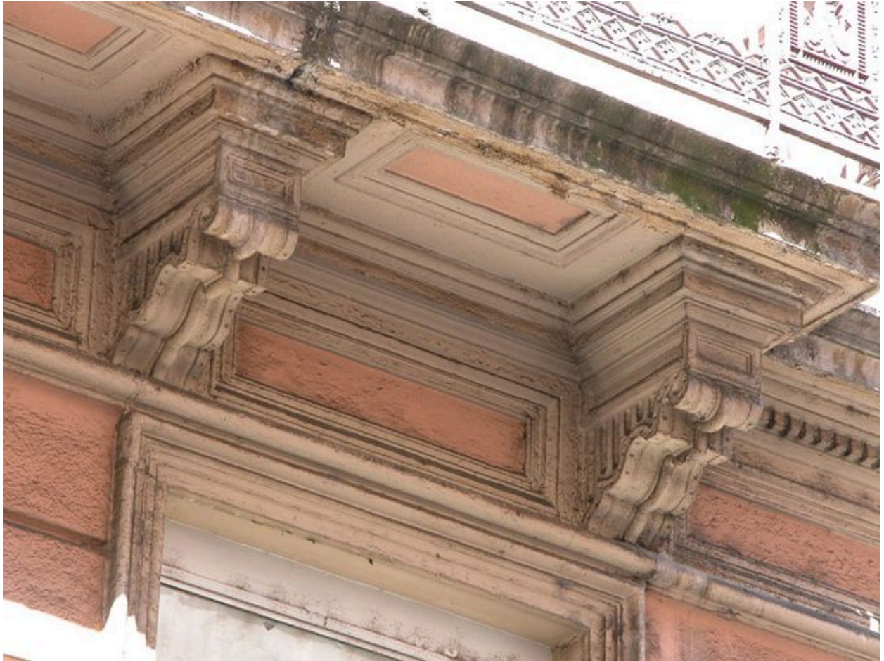
Consoles à volutes supportant la plate-forme ornée de tables du balcon