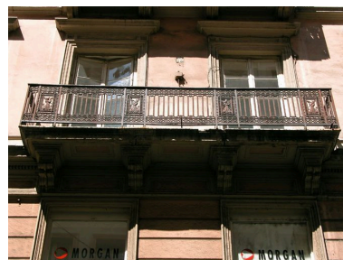
Détail d'un balcon de la rue de Brest