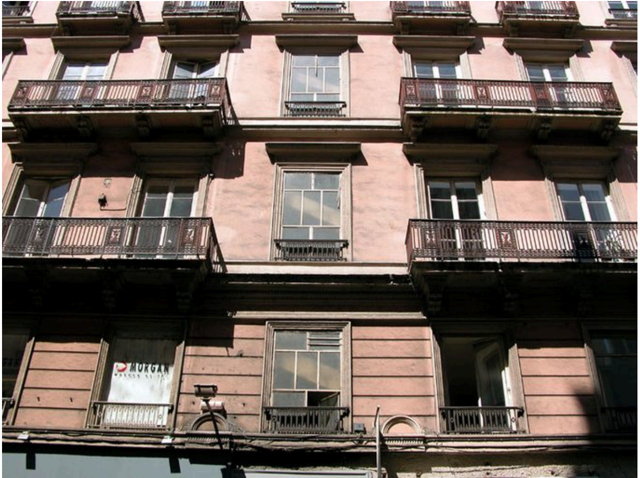
Travées centrales sur la rue de Brest