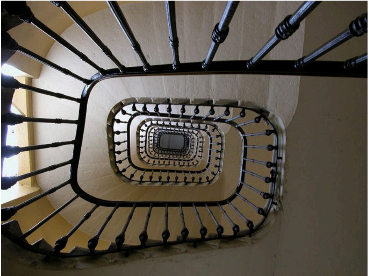
La cage d'escalier en contre-plongée