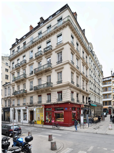
Vue d'ensemble IVR84_20226900493NUCAQ