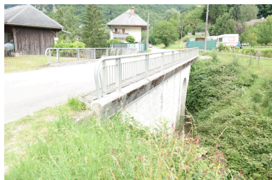
Pont de la Petite Morge, vue de la face aval IVR84_20207403103NUCA