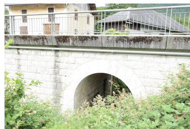
Pont de la Petite Morge, vue de la face amont IVR84_20207403102NUCA