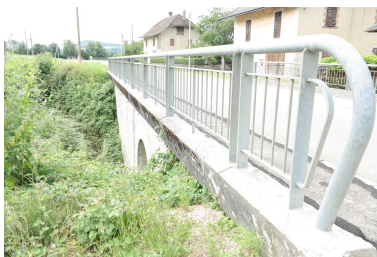
Pont de la Petite Morge, vue de la face amont, détail des garde-corps