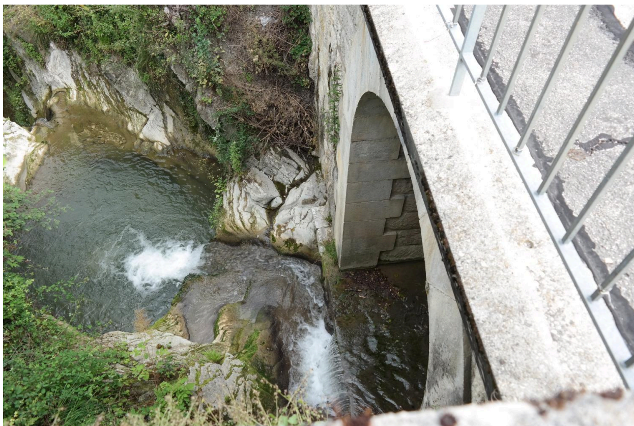
Pont de la Petite Morge, détail du seuil en face aval