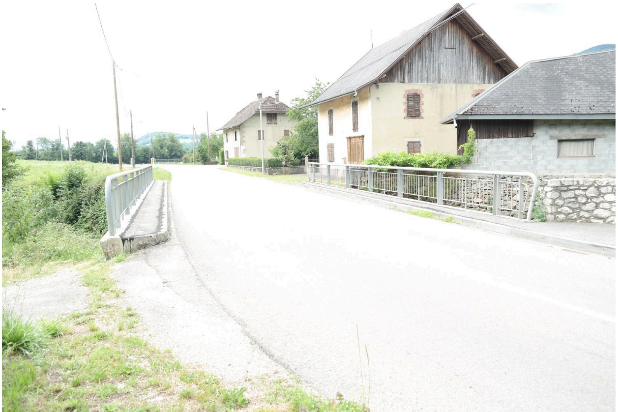
Pont de la Petite Morge, vue de la chaussée et des bâtiments alentours