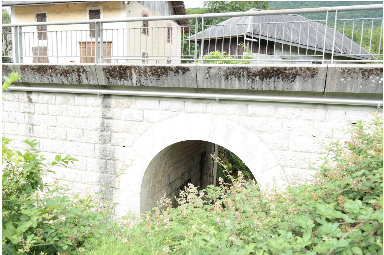
Pont de la Petite Morge, vue de la face amont