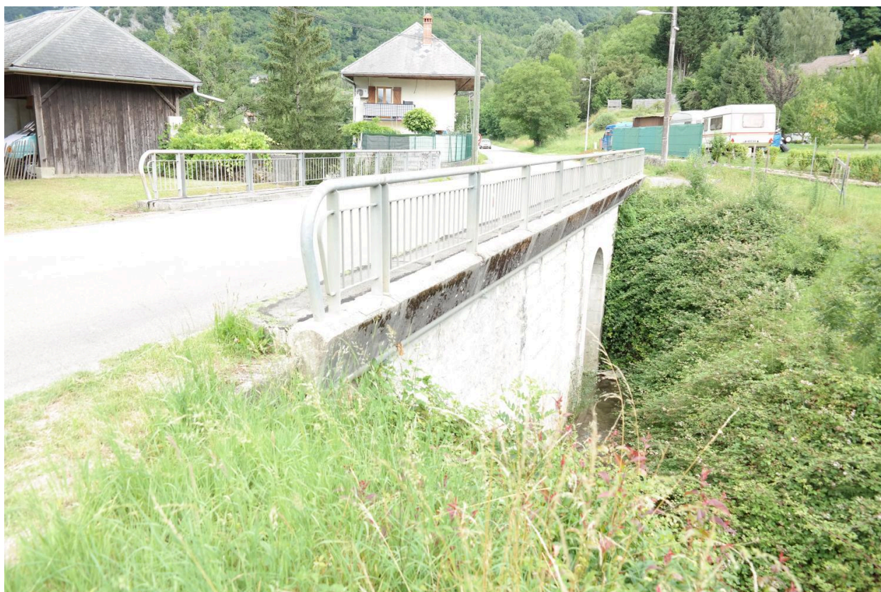
Pont de la Petite Morge, vue de la face aval