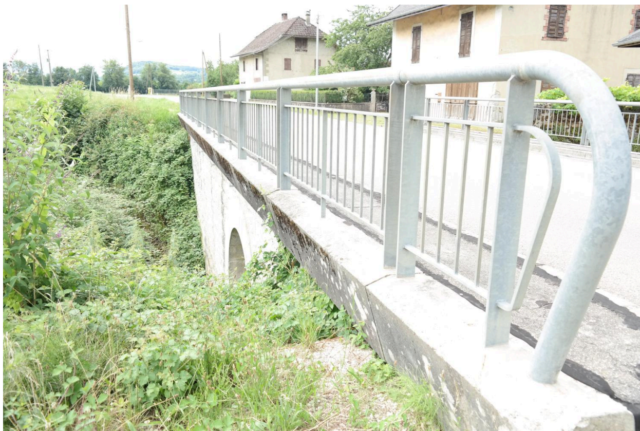
Pont de la Petite Morge, vue de la face amont, détail des garde-corps