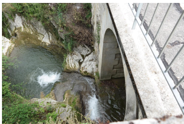
Pont de la Petite Morge, détail du seuil en face aval IVR84_20207403104NUCA