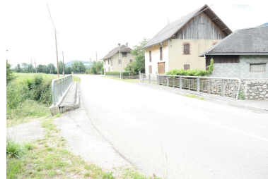
Pont de la Petite Morge, vue de la chaussée et des bâtiments alentours