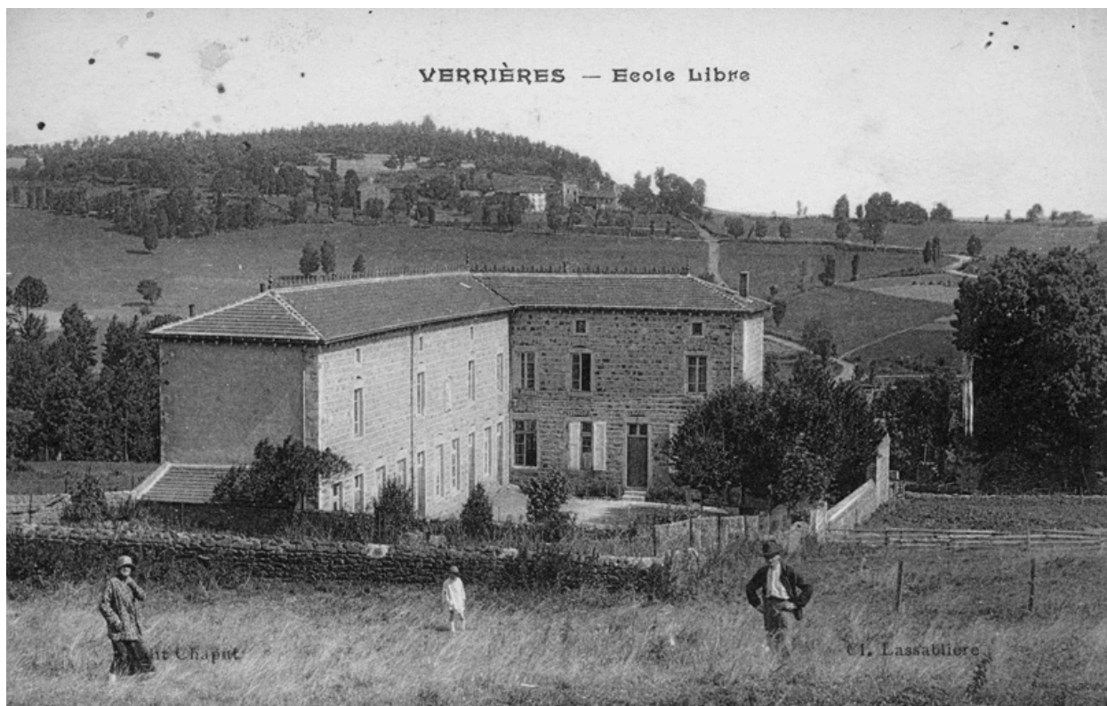
Verrières - Ecole libre. Carte postale (1927)