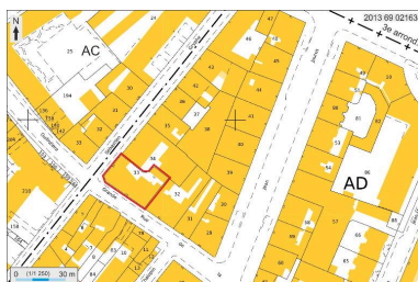
Plan masse et de situation, extrait de http://cadastre.gouv.fr Dess. André Céréza