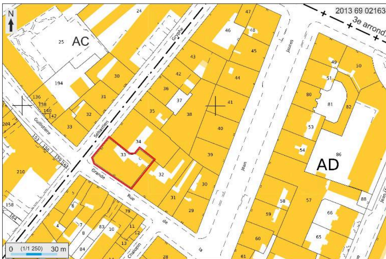
Plan masse et de situation, extrait de http://cadastre.gouv.fr