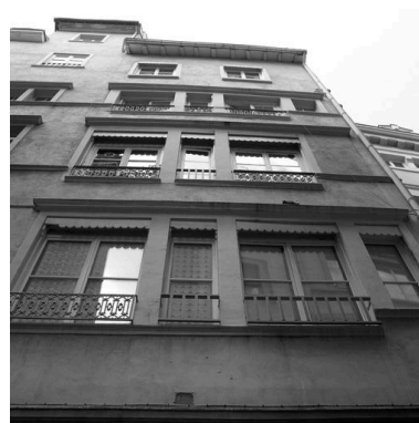
Façade, vue générale par-dessous IVR82_20056901546NUC