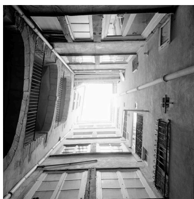
Cour commune, vue générale par-dessous IVR82_20056902646X