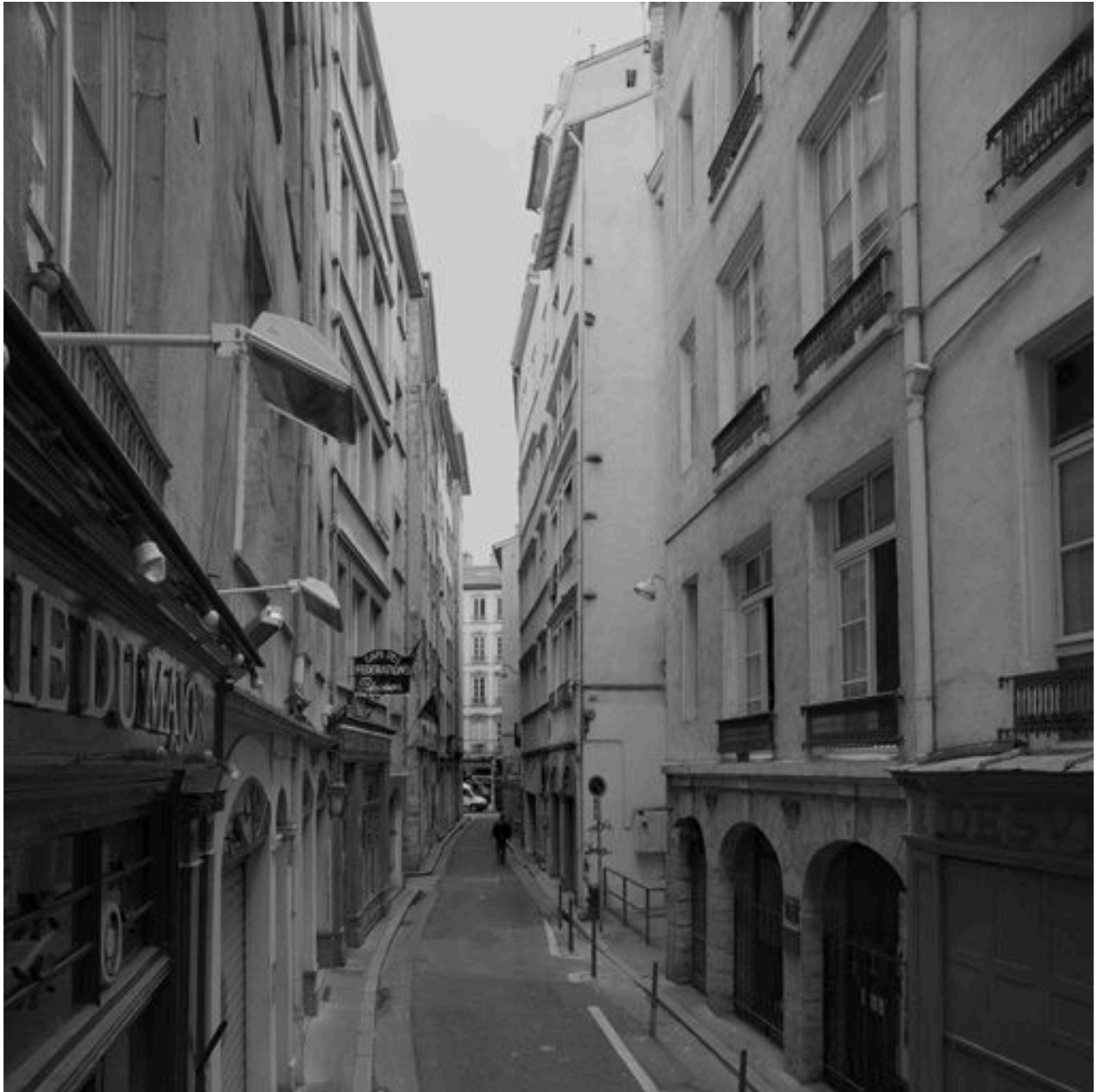
Vue générale de la façade