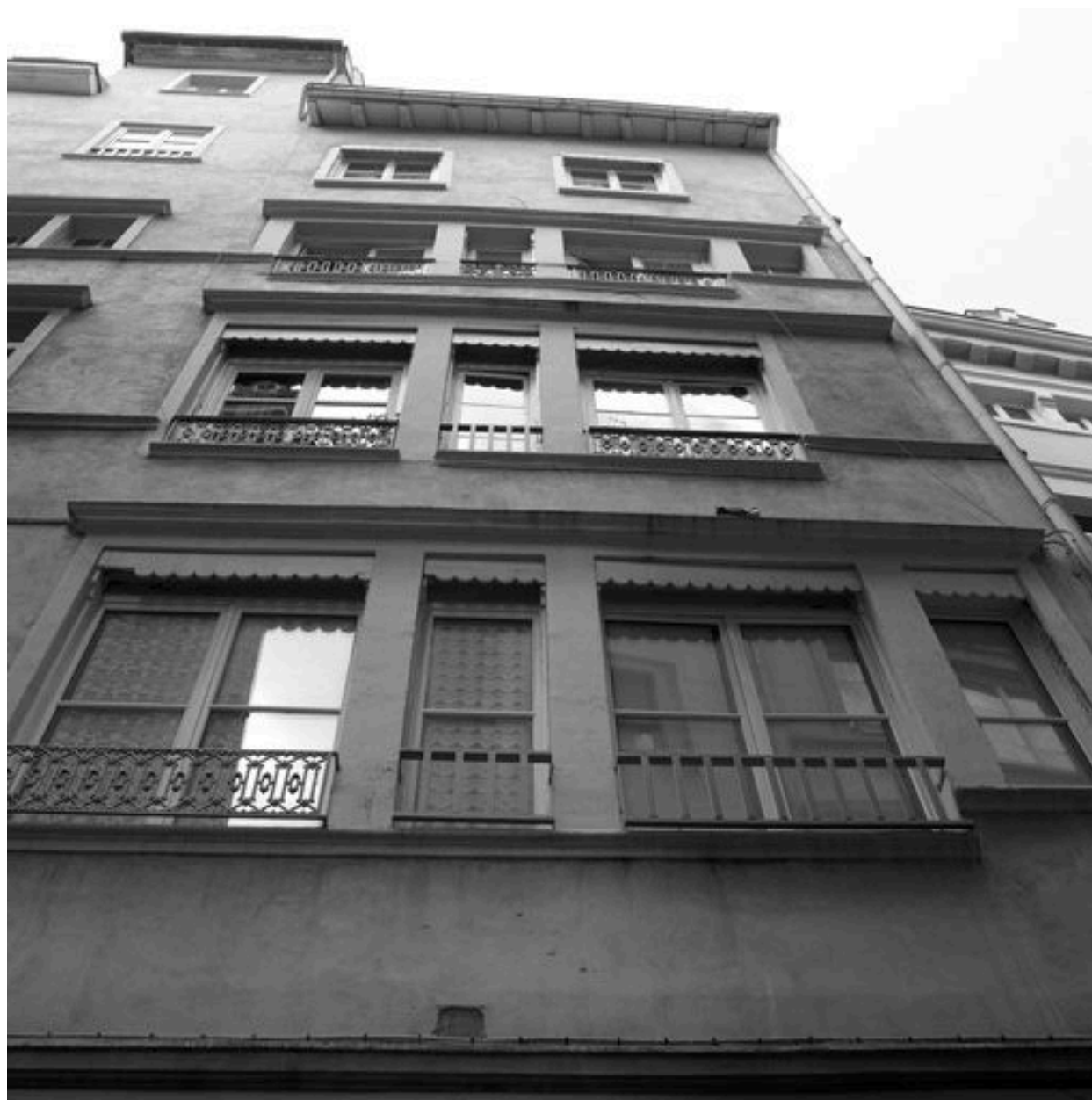
Façade, vue générale par-dessous