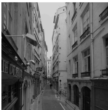
Vue générale de la façade IVR82_20056900406NUC