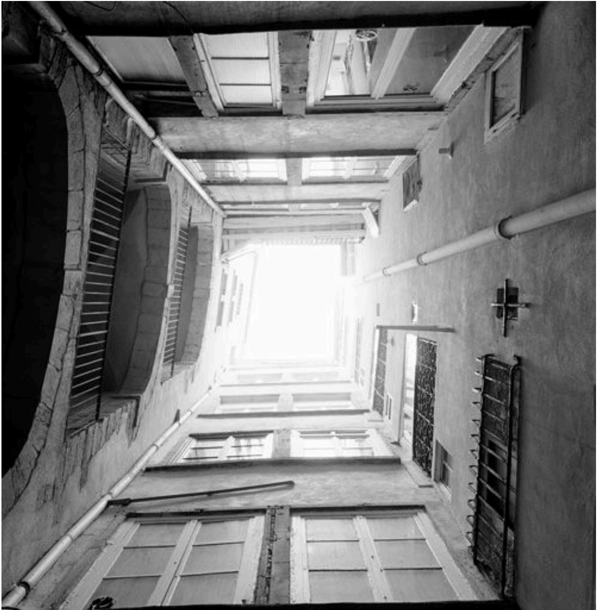
Cour commune, vue générale par-dessous