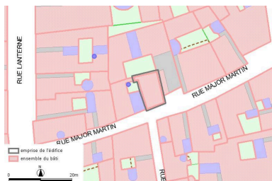
Plan-masse, d'après le système urbain de référence, version 1999 IVR82_20056902713NUDA