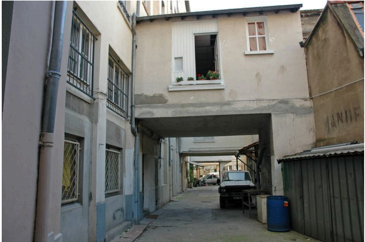
Loge de concierge. Vue depuis le nord