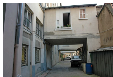
Loge de concierge. Vue depuis le nord IVR82_20076900302NUCA