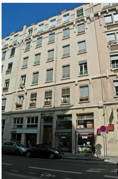
Élévation principale IVR82_20076900300NUCA