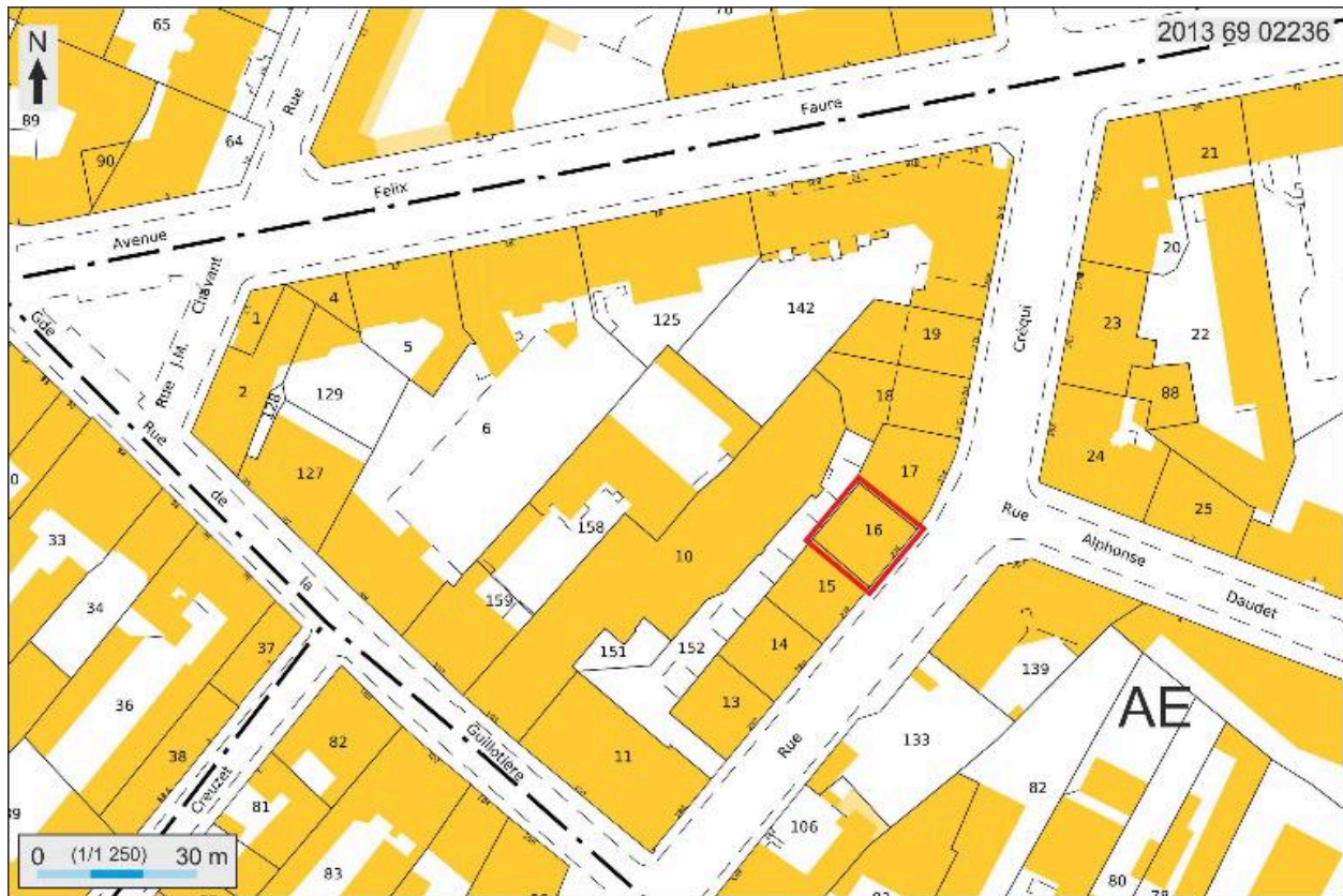
Plan masse et de situation