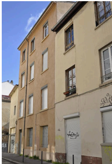
Elévation sur rue, vue générale IVR84_20176900979NUCA