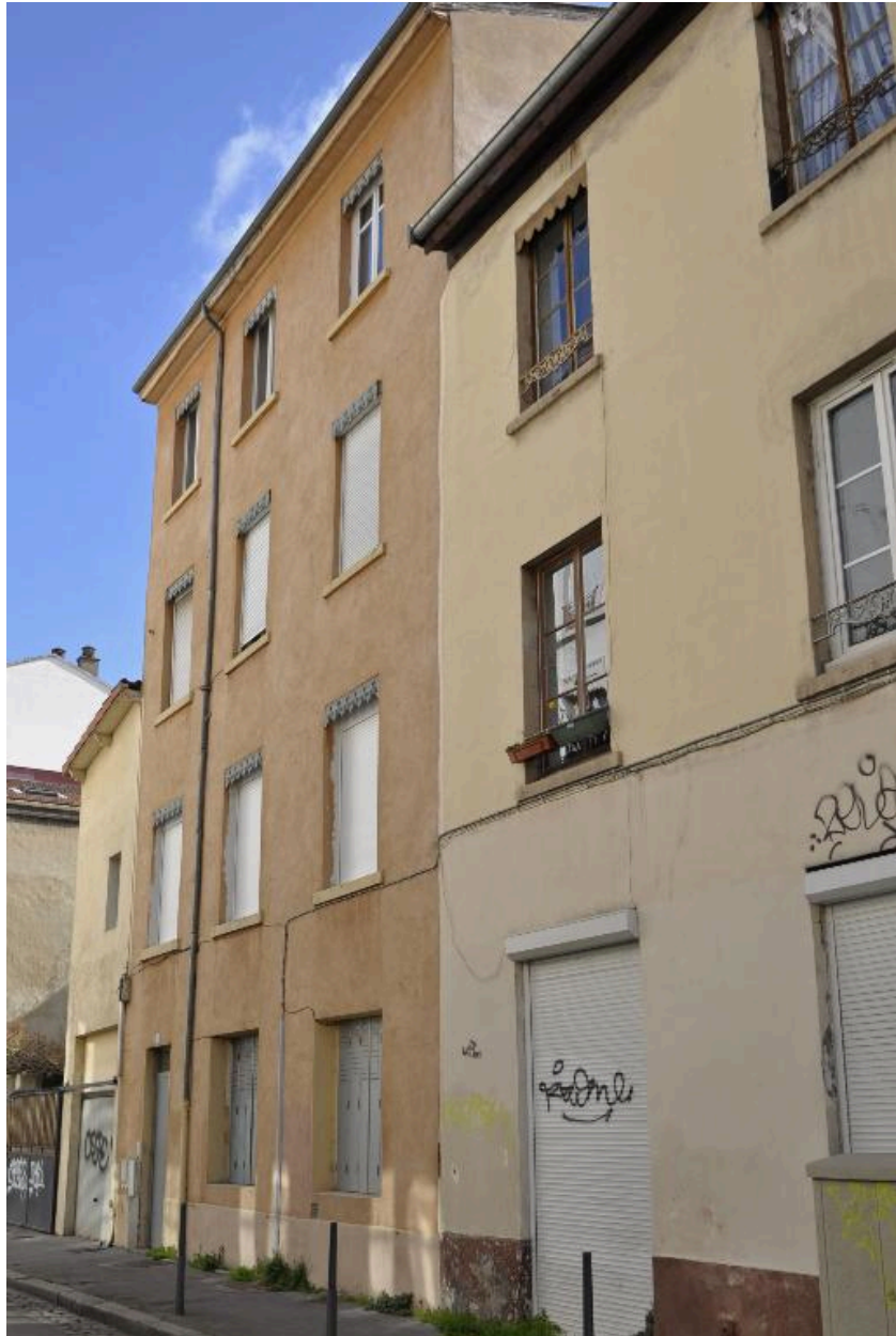
Elévation sur rue, vue générale