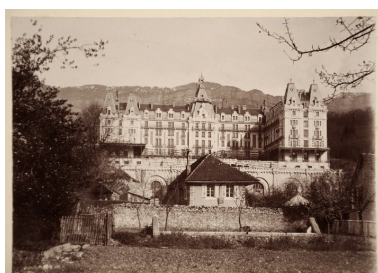
La villa, au premier plan, vers 1898