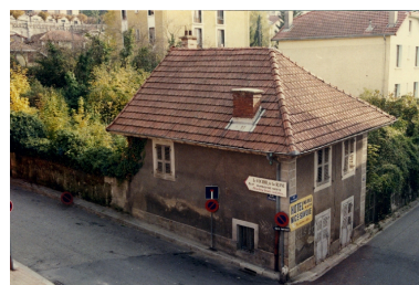
Vue générale IVR82_20097300349NUCB