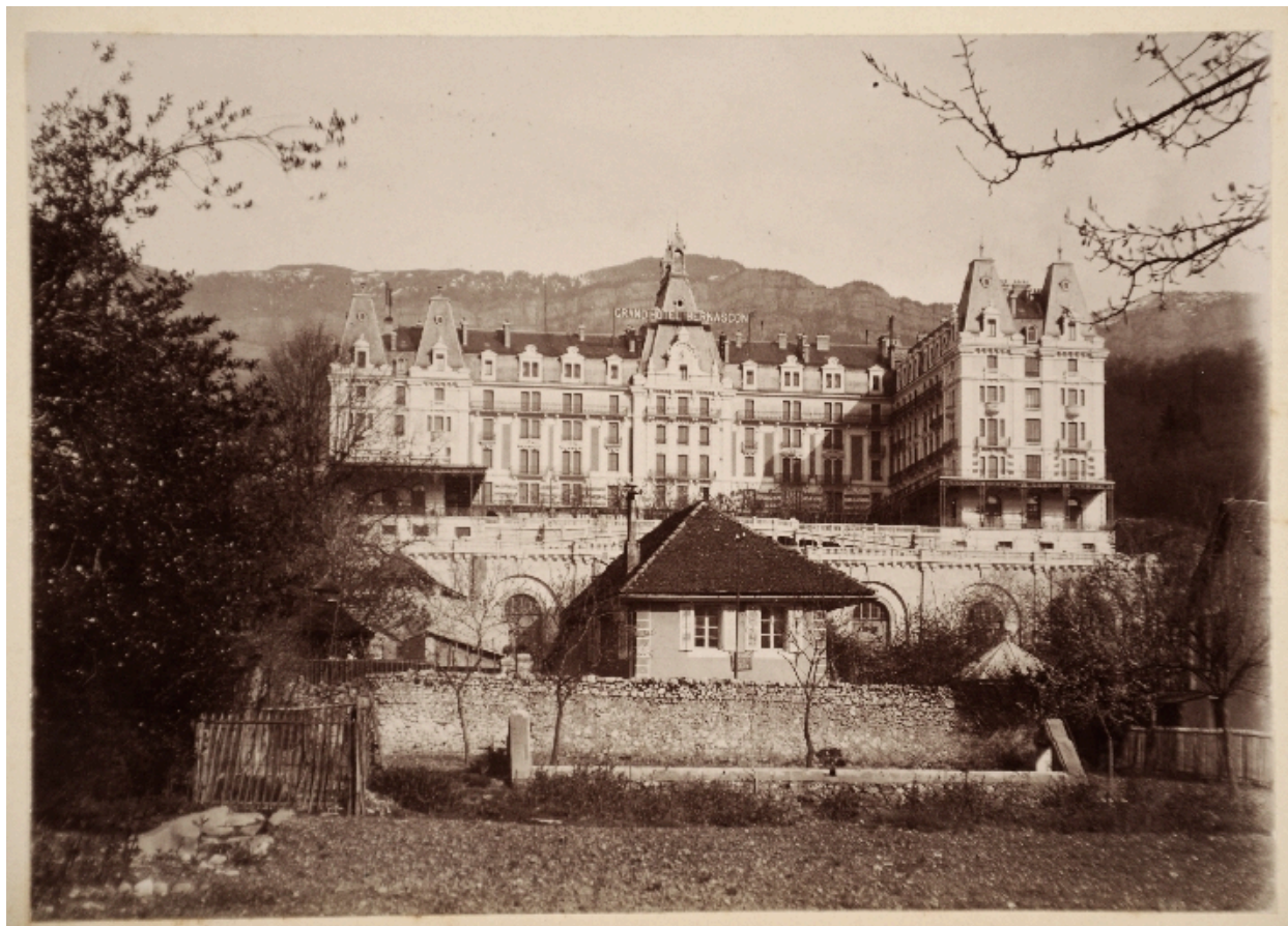
La villa, au premier plan, vers 1898