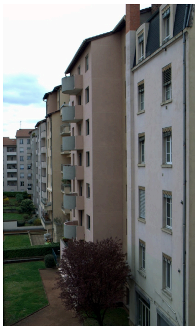
Elévation postérieure IVR82_20116905025NUCA