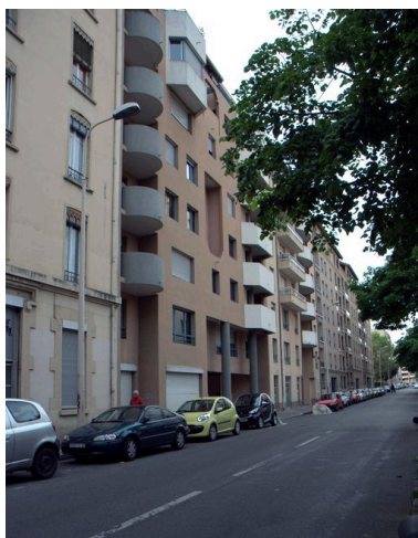
Vue générale IVR82_20106905089NUCA