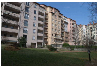
Elévations postérieures des immeubles 5, 7 et 9 rue Nicolai IVR82_20126902449NUCA