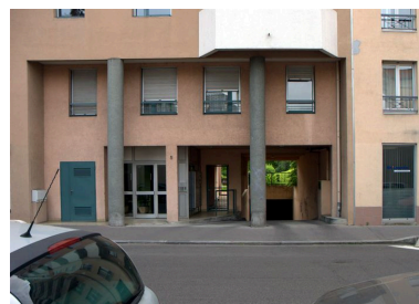
Détail de l'entrée IVR82_20106905090NUCA