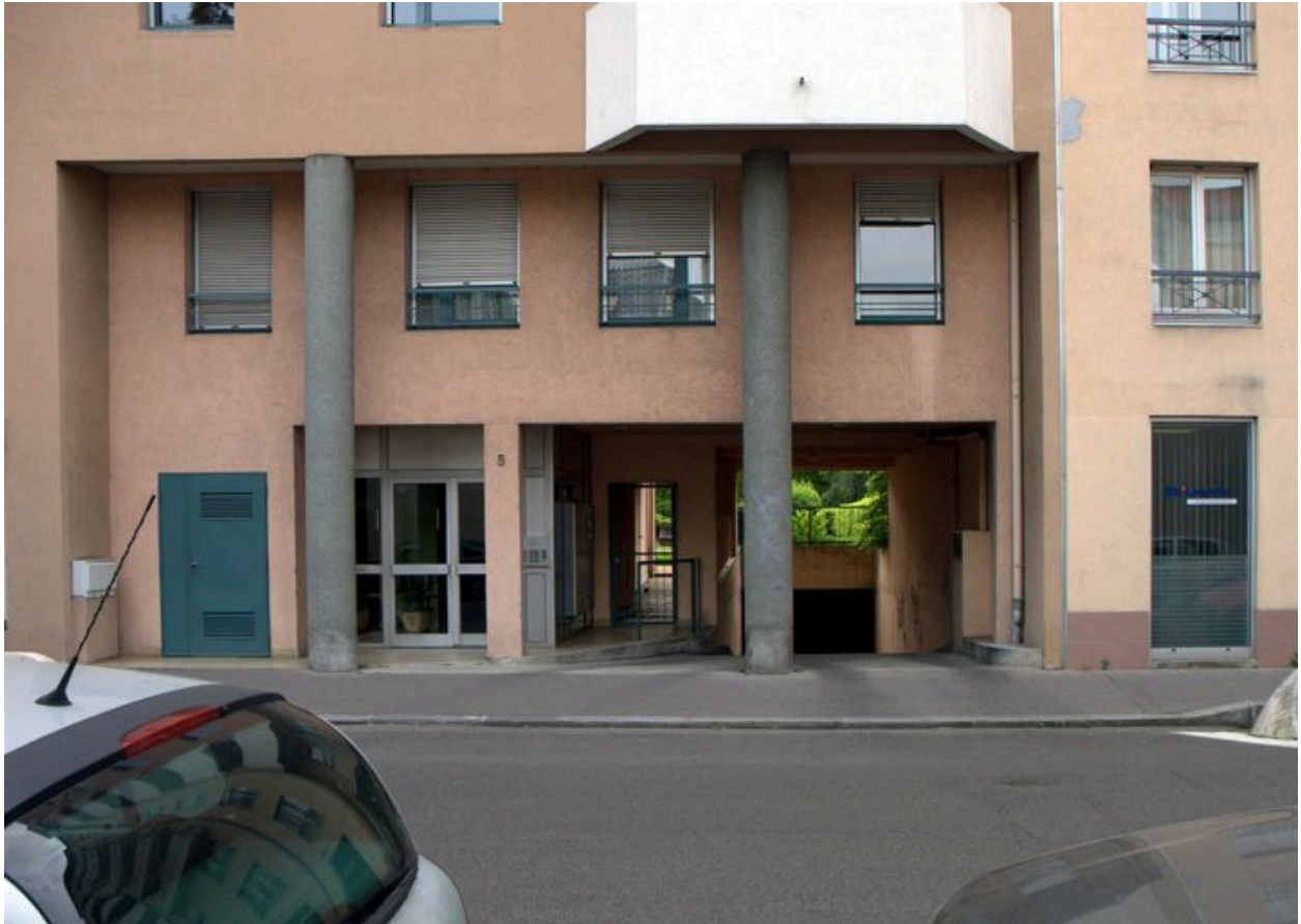
Détail de l'entrée