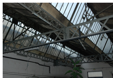
Détail poutre métallique à croisillons IVR82_20126900436NUCA