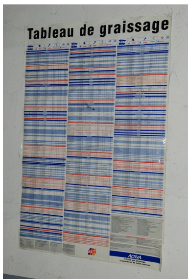
Panneau de graissage de l'ancien garage IVR82_20126900437NUCA