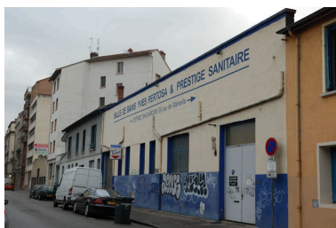
Vue générale nord IVR82_20106900546NUCA