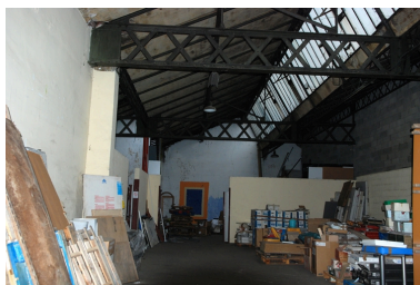
Vue intérieur des ateliers IVR82_20126900432NUCA