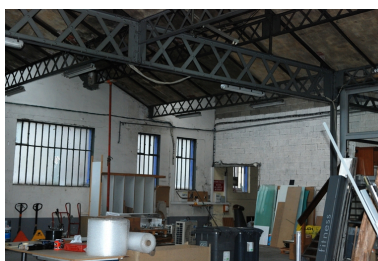
Baies rectangulaires IVR82_20126900438NUCA