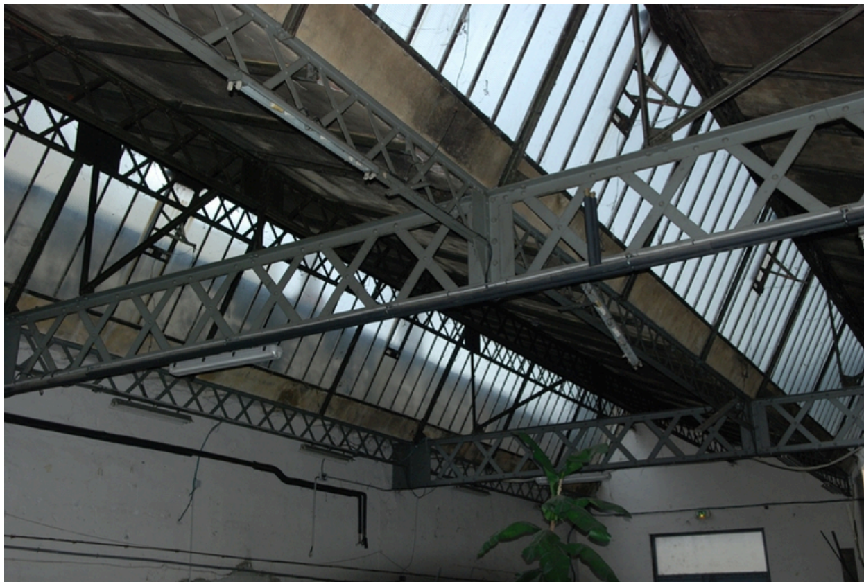
Détail poutre métallique à croisillons