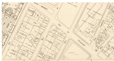
Plan général de Lyon ACL 4S232, 1974 IVR84_20256902077NUCA