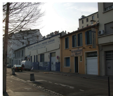
Vue d'ensemble nord IVR82_20106900545NUCA