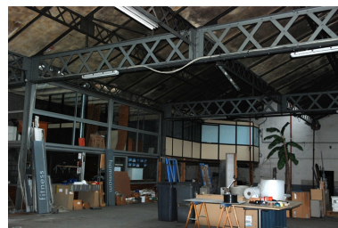
Vue d'ensemble des ateliers avec structure métallique en charpente