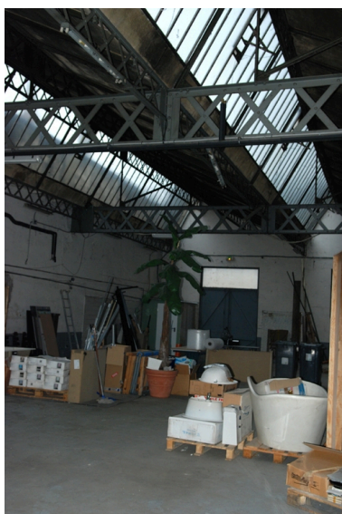
Vue d'ensemble atelier IVR82_20126900435NUCA