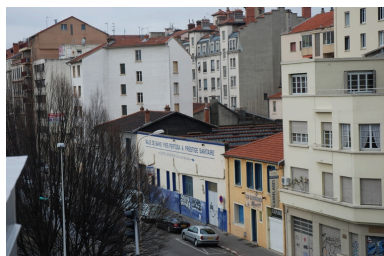
Vue nord-est : shed en toiture IVR82_20126900431NUCA