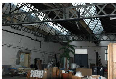
Détail charpente IVR82_20126900434NUCA