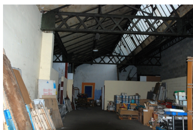
Vue intérieur des ateliers IVR82_20126900432NUCA