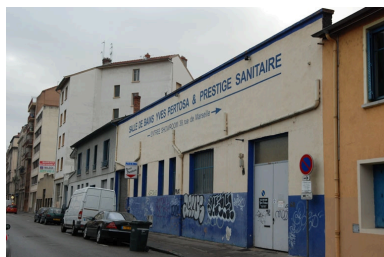
Vue générale nord IVR82_20106900546NUCA