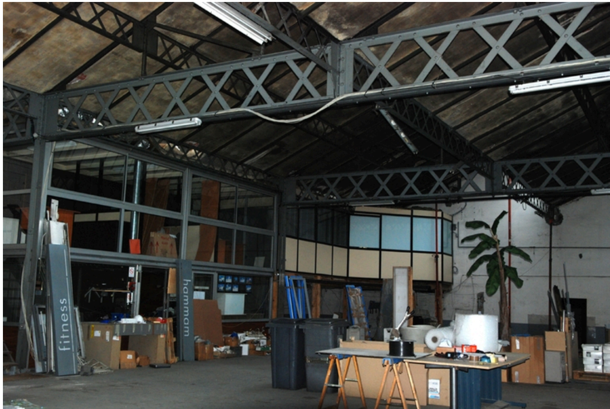
Vue d'ensemble des ateliers avec structure métallique en charpente