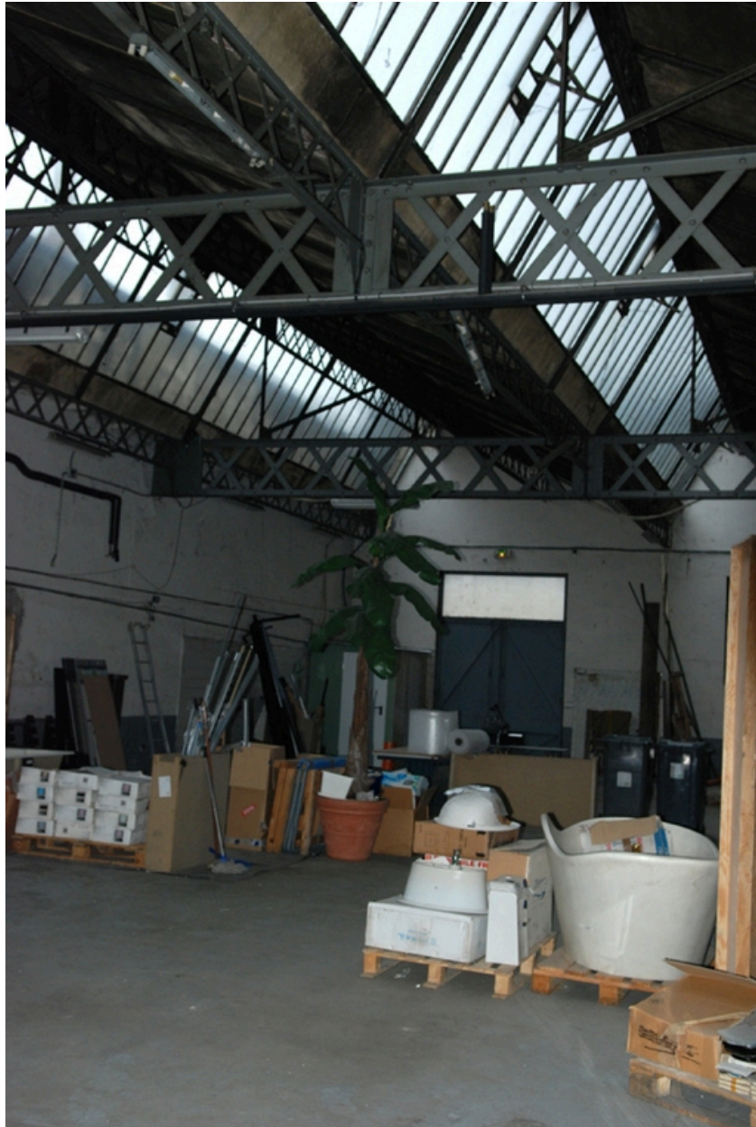
Vue d'ensemble atelier