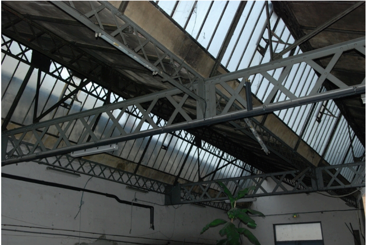
Détail poutre métallique à croisillons