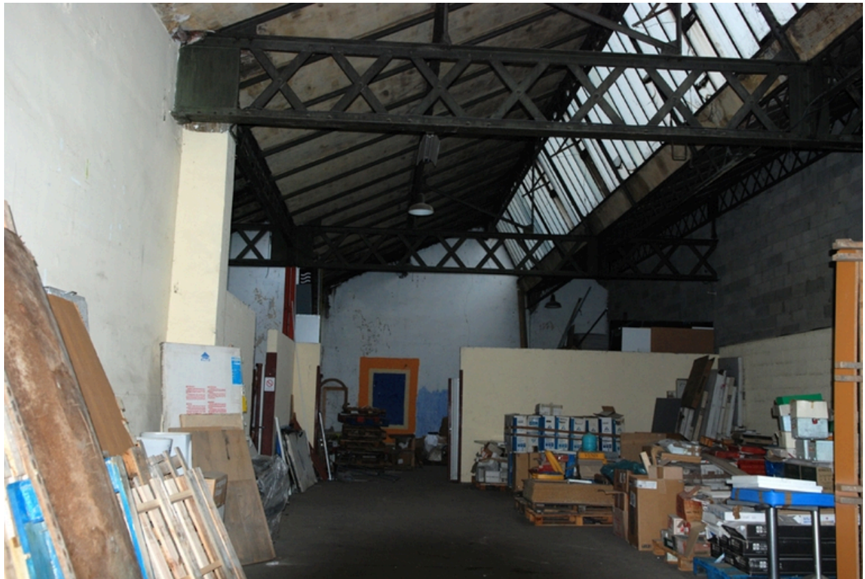
Vue intérieur des ateliers