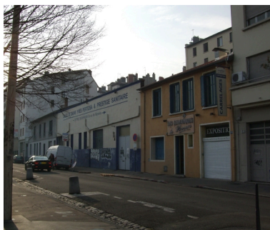
Vue d'ensemble nord IVR82_20106900545NUCA