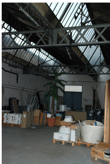
Vue d'ensemble atelier IVR82_20126900435NUCA