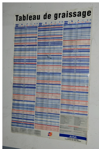
Panneau de graissage de l'ancien garage