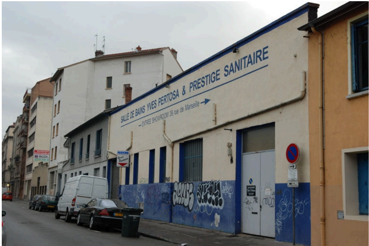
Vue générale nord