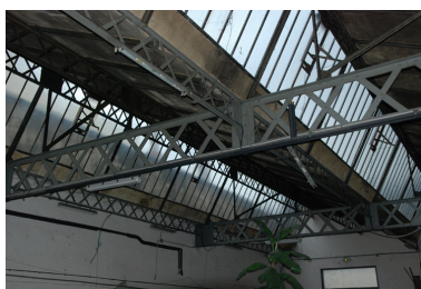
Détail poutre métallique à croisillons IVR82_20126900436NUCA