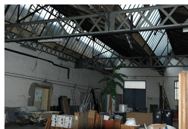
Détail charpente IVR82_20126900434NUCA