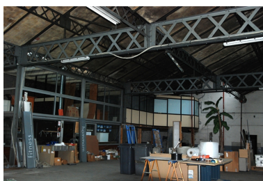
Vue d'ensemble des ateliers avec structure métallique en charpente IVR82_20126900433NUCA