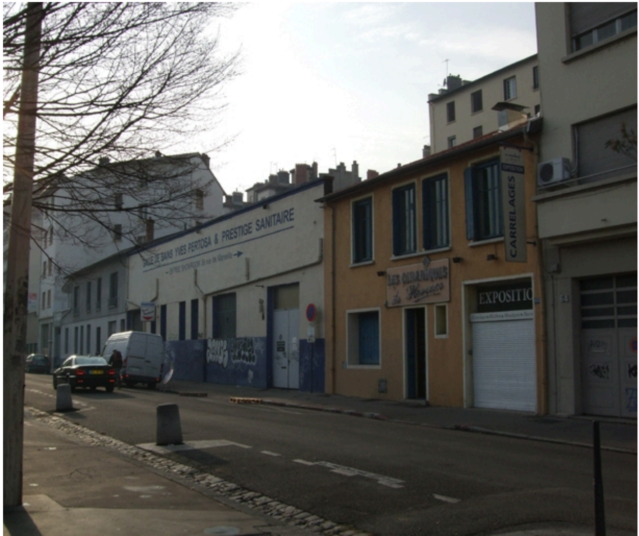
Vue d'ensemble nord