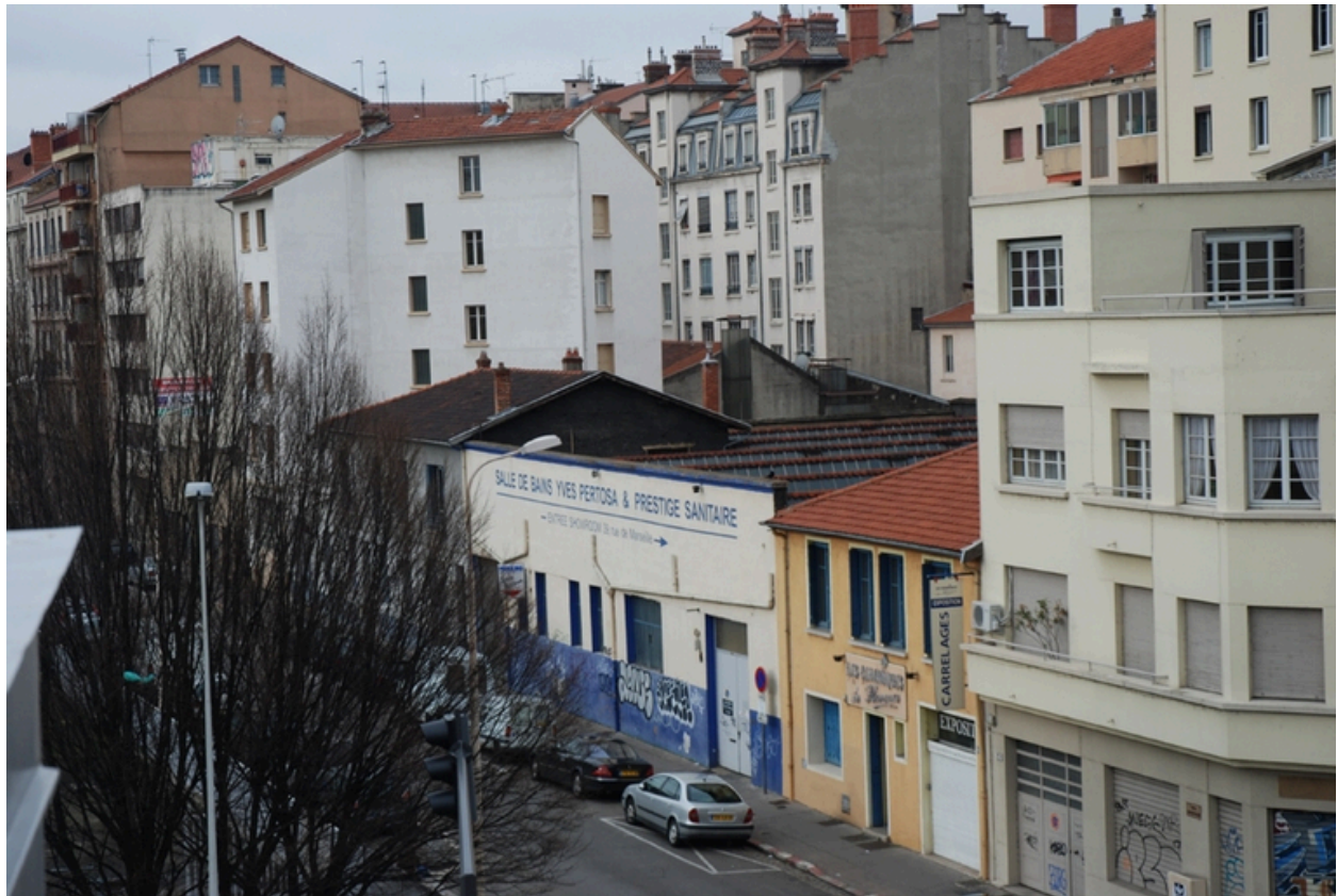
Vue nord-est : shed en toiture