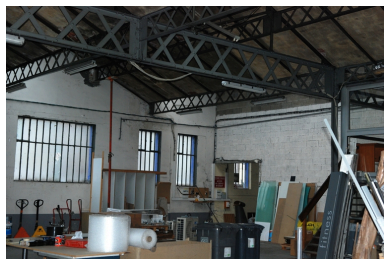
Baies rectangulaires IVR82_20126900438NUCA