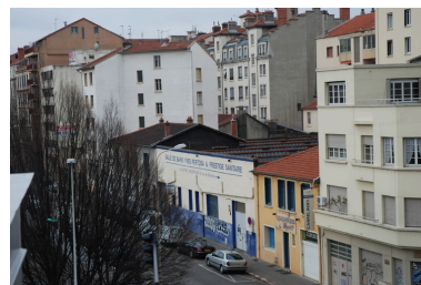
Vue nord-est : shed en toiture IVR82_20126900431NUCA