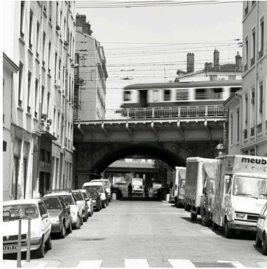
Vue générale depuis le nord IVR82_20026903821X