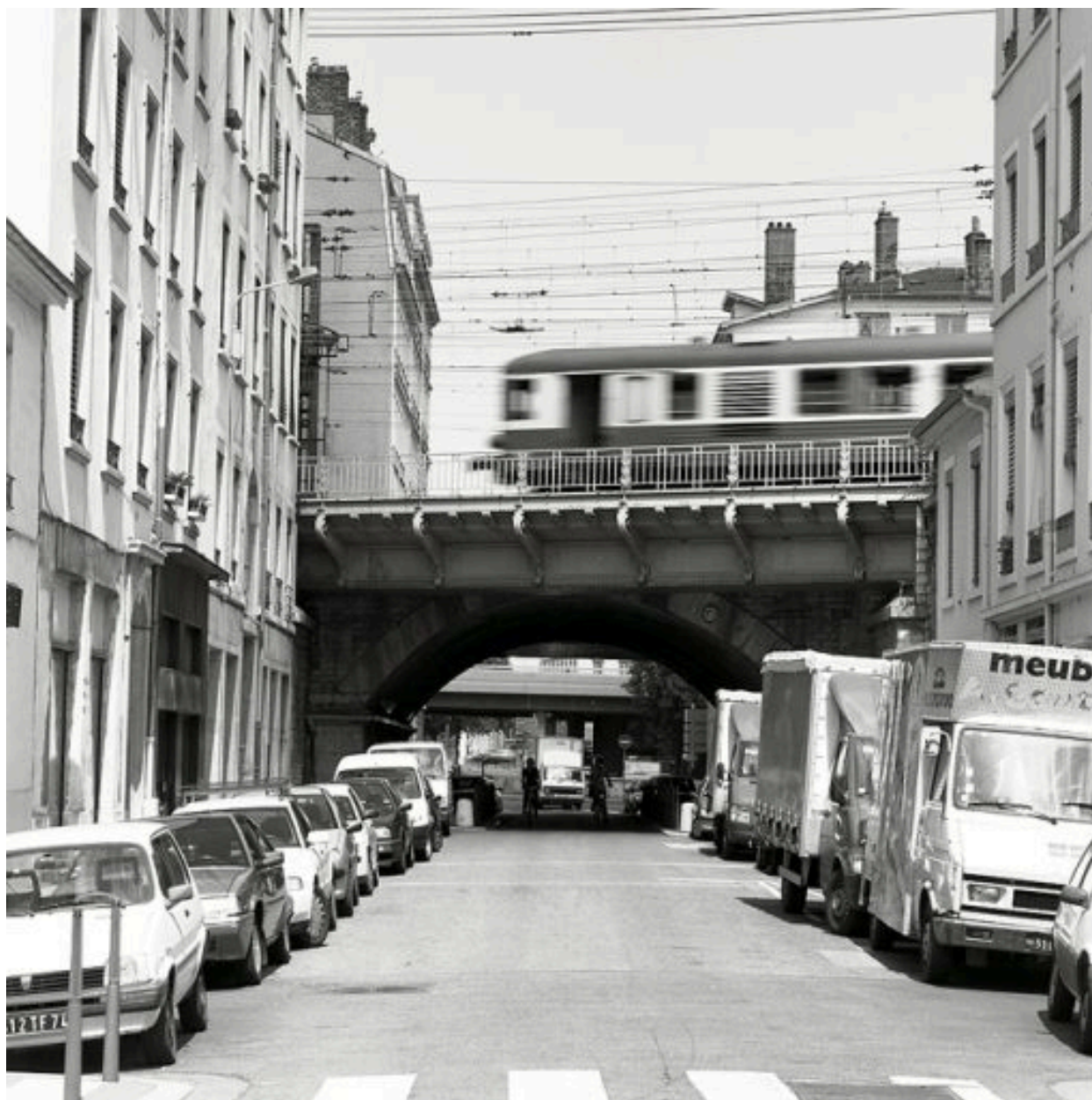
Vue générale depuis le nord