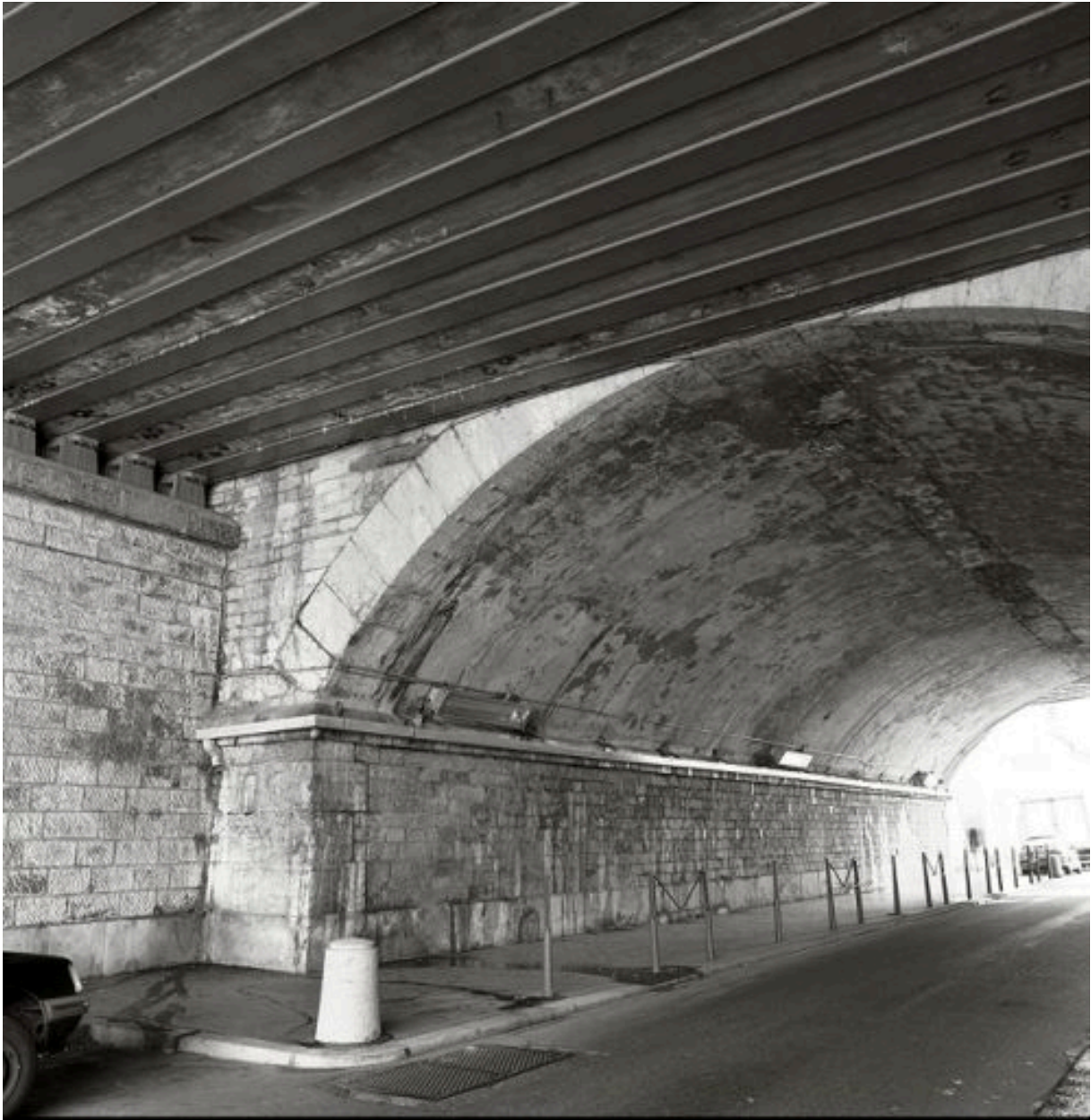
La jonction du tablier métallique et de l'arche en pierre