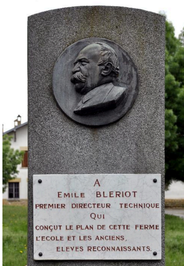
Détail de la partie supérieure, de face

Vue d'ensemble, de face