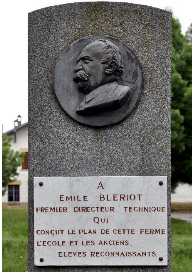
Détail de la partie supérieure, de face