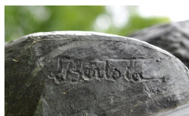
Détail de la signature