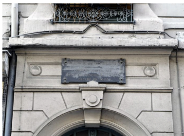
Détail de la plaque fixée au dessus de la porte d'entrée IVR82_20116902014NUCA