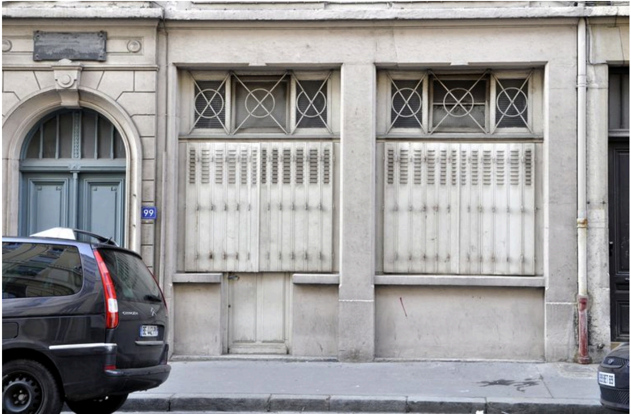
Vue du rez-de-chaussée (ancienne boutique)