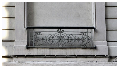
Vue d'un garde-corps