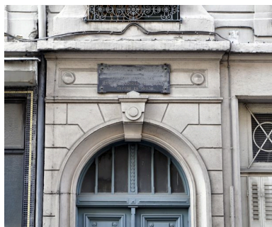
Détail de la porte