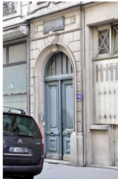
Vue de la porte d'entrée