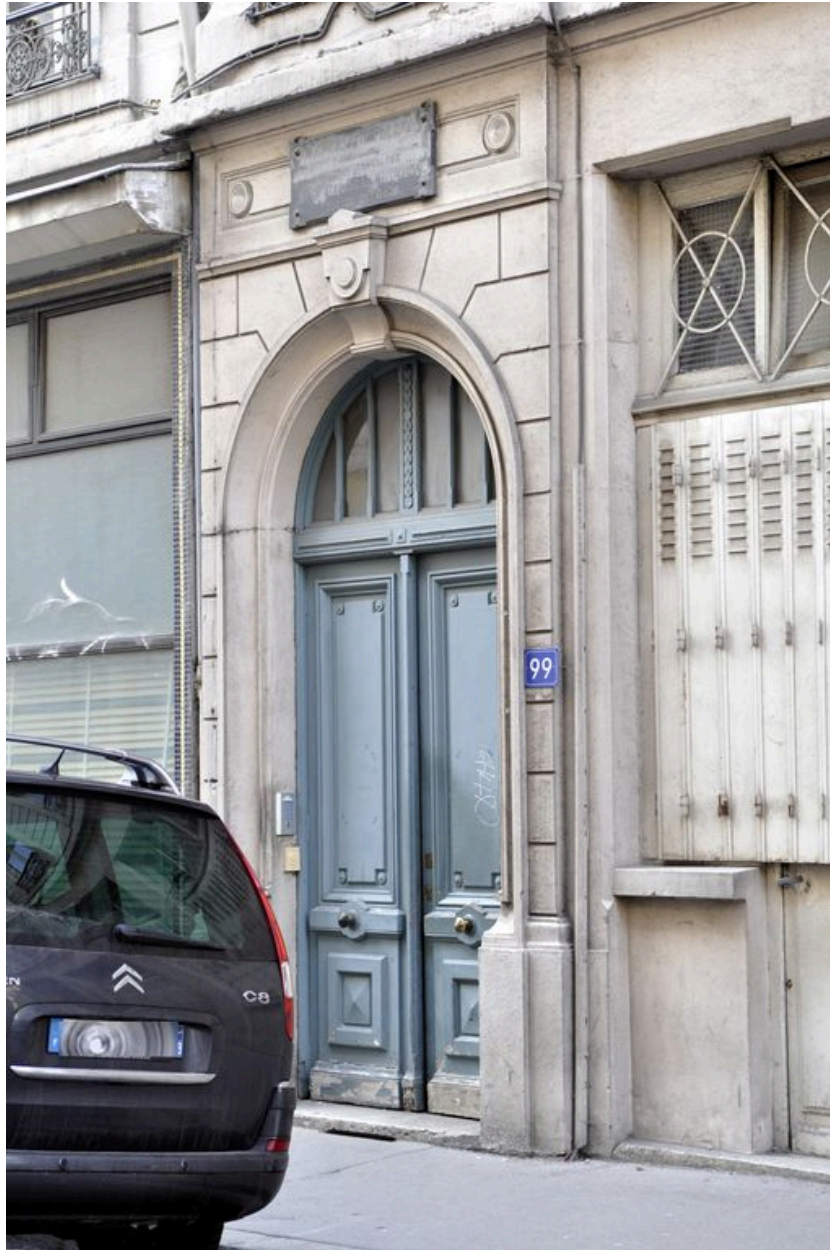
Vue de la porte d'entrée