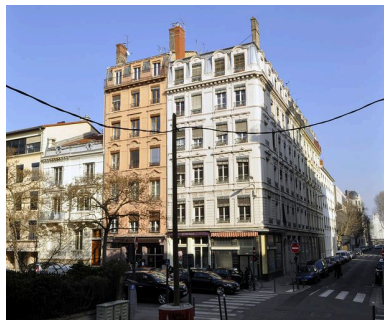
Vue générale IVR82_20116902010NUCA