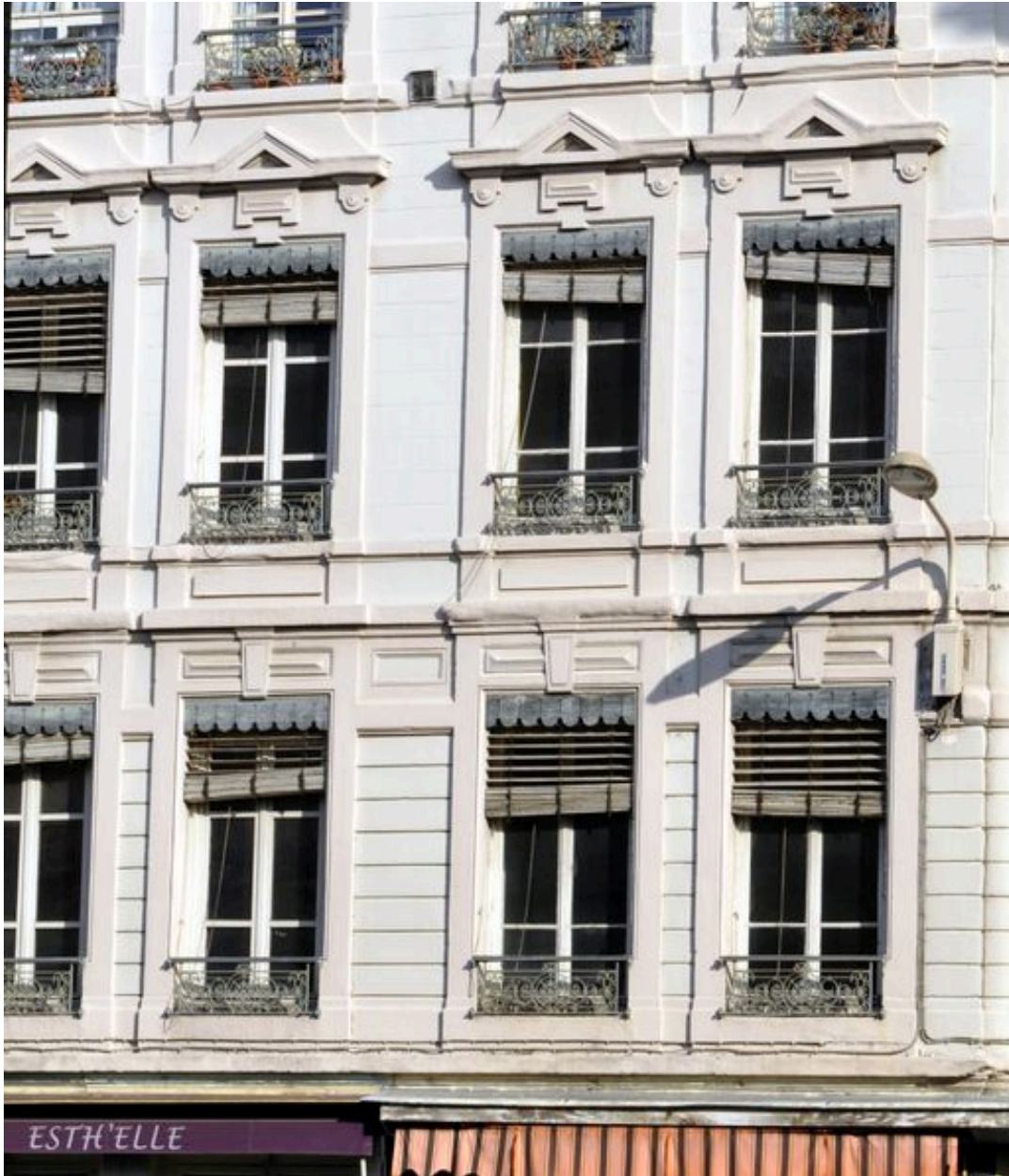
Vue des baies