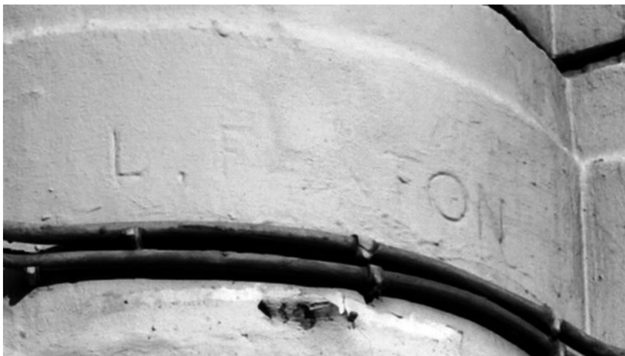
Nom de l'architecte gravé à l'angle de l'immeuble