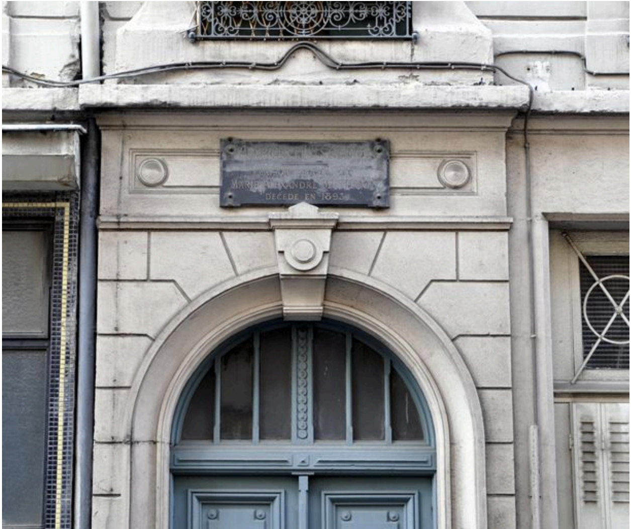
Détail de la porte