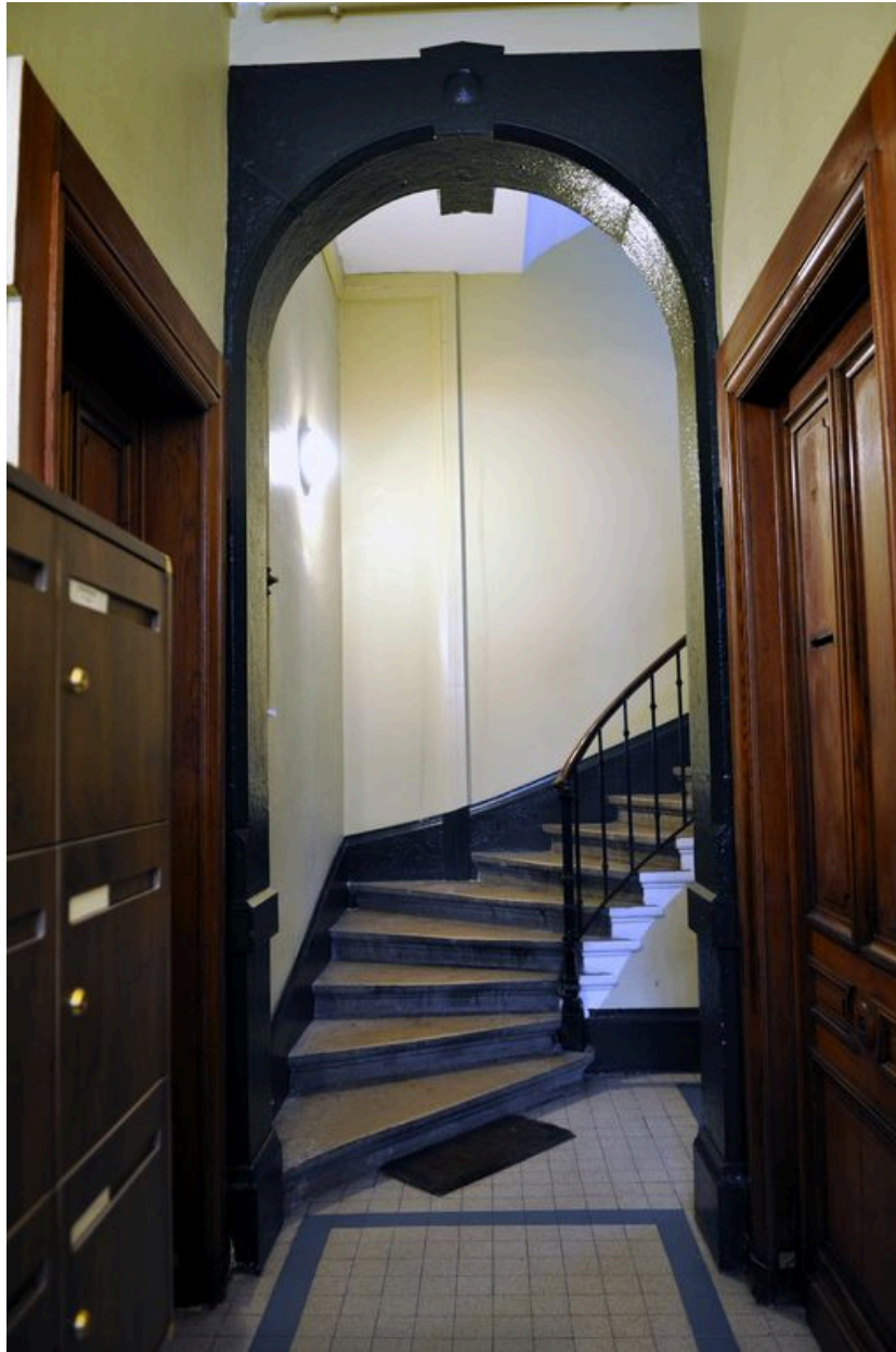
Vue de l'allée et de l'escalier