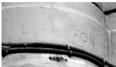
Nom de l'architecte gravé à l'angle de l'immeuble IVR82_20116902017NUCA