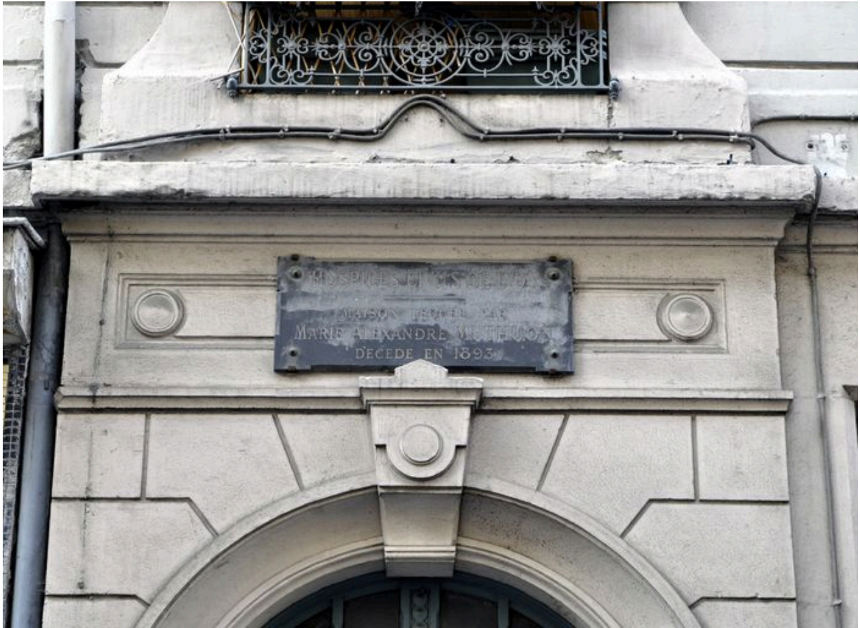
Détail de la plaque fixée au dessus de la porte d'entrée