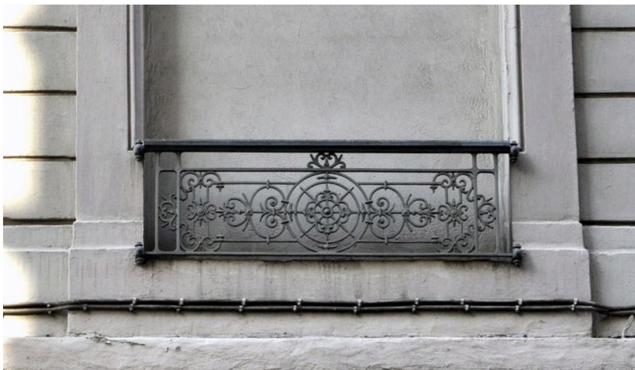
Vue d'un garde-corps