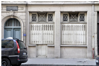
Vue du rez-de-chaussée (ancienne boutique)