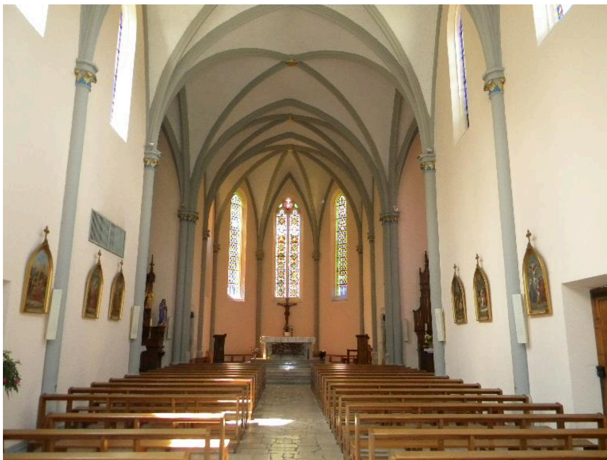
Vue de la nef.