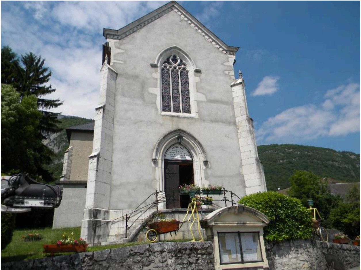
Vue de la façade principale.