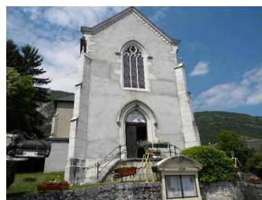
Vue de la façade principale. IVR82_20147400275NUCA