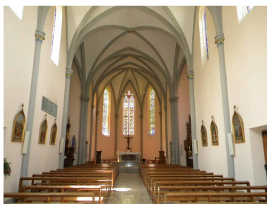
Vue de la nef. IVR82_20147400278NUCA