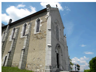
Vue de trois-quarts de l'église depuis la place de la mairie.