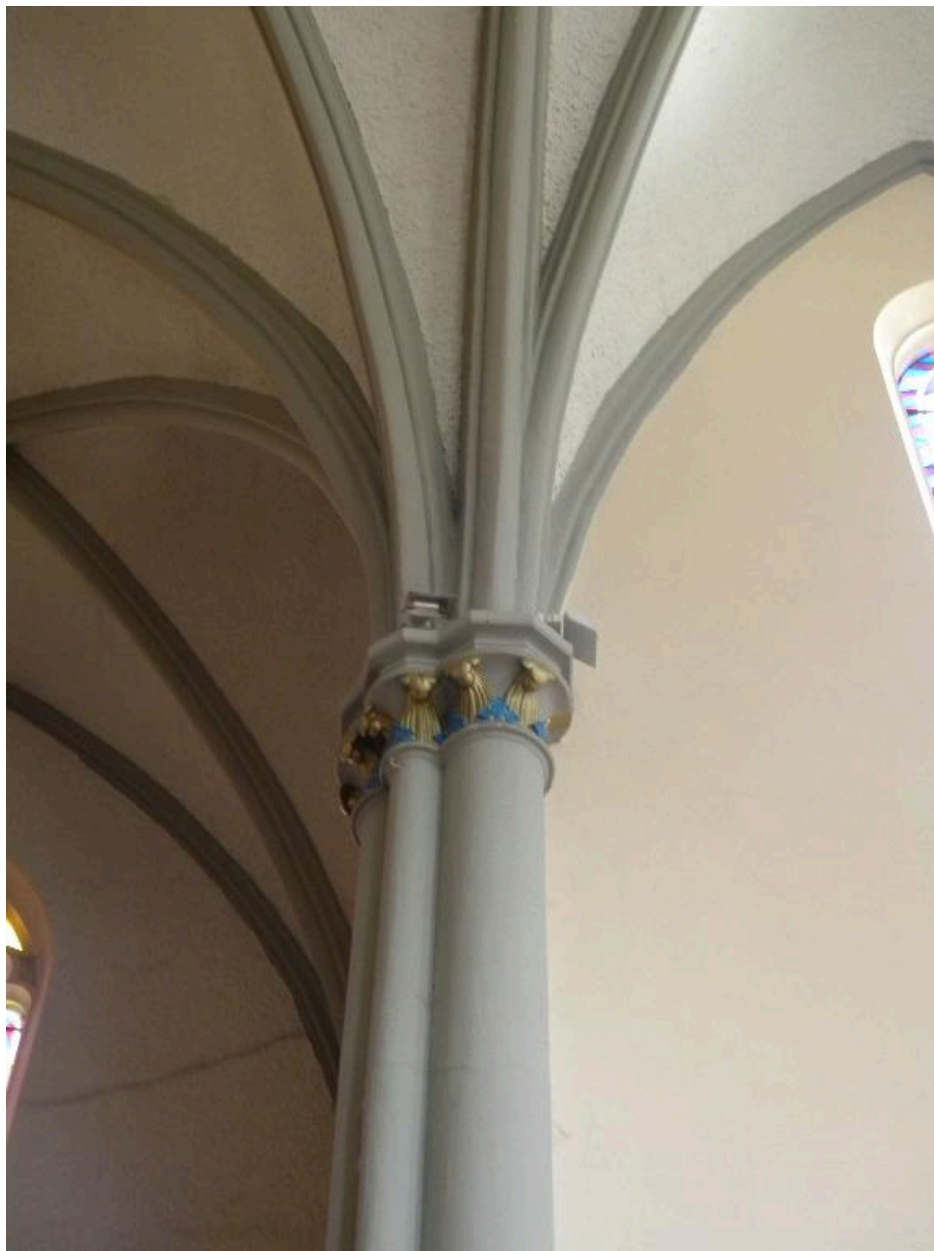
Détail d'un chapiteau dans l'église.