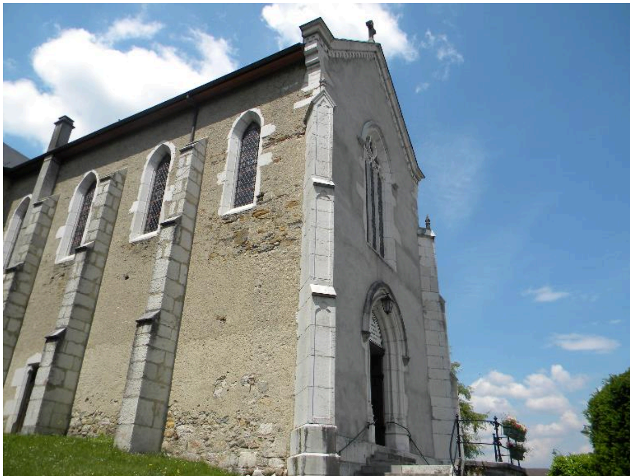
Vue de trois-quarts de l'église depuis la place de la mairie.