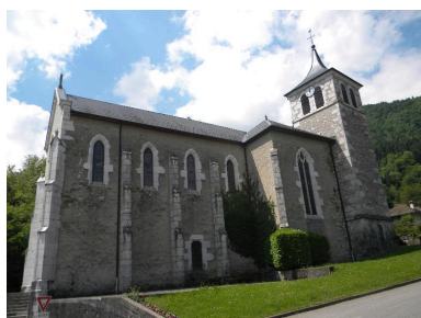
Vue d'ensemble. IVR82_20147400274NUCA