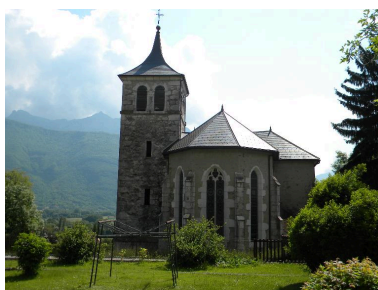
Vue du chevet de l'église.