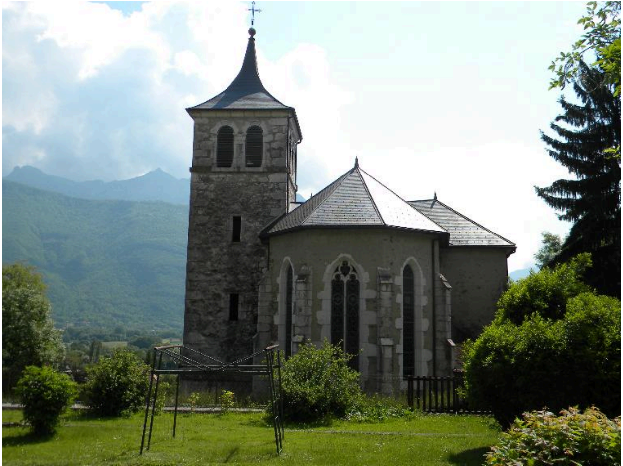
Vue du chevet de l'église.