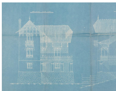
Elévation ouest IVR82_20137300848NUCB