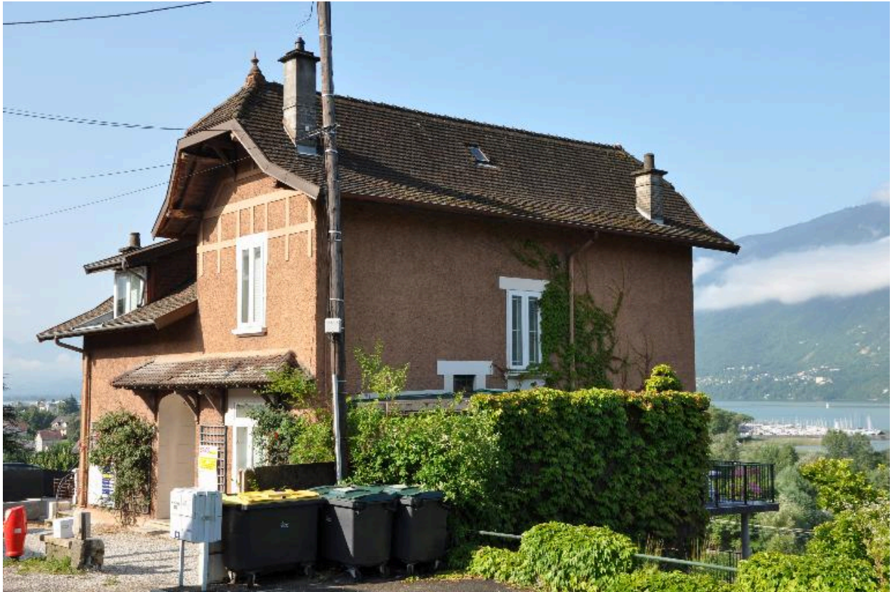
Vue de trois-quart droit