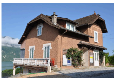
Vue de trois-quart gauche IVR82_20137300757NUCA