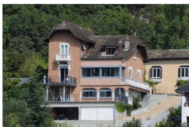
Vue d'ensemble IVR82_20157301036NUCA