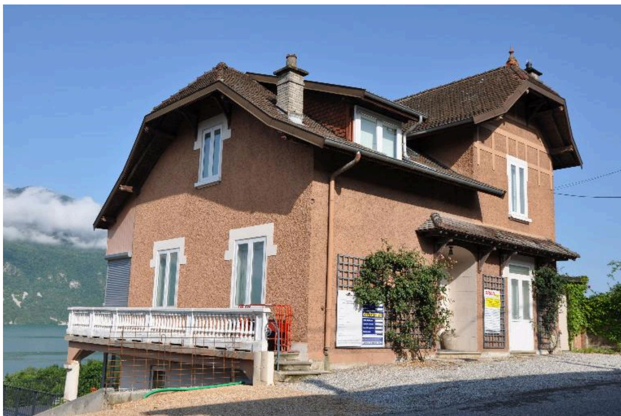
Vue de trois-quart gauche