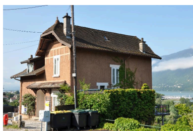
Vue de trois-quart droit IVR82_20137300754NUCA