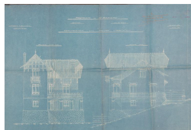
Elévations ouest et sud IVR82_20137300847NUCB