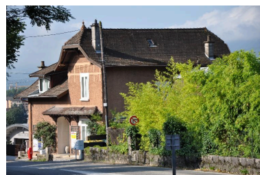
Vue d'ensemble depuis le nord IVR82_20137300753NUCA