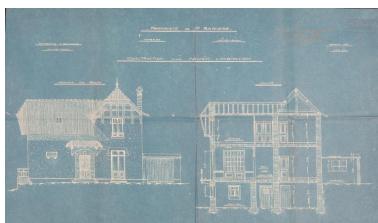
Coupe et élévation