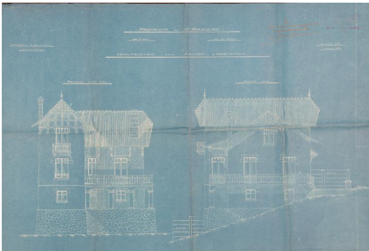
Elévations ouest et sud