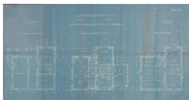
Plans IVR82_20137300846NUCB