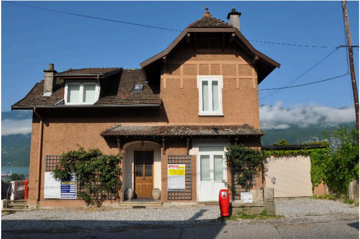
Elévation sur rue