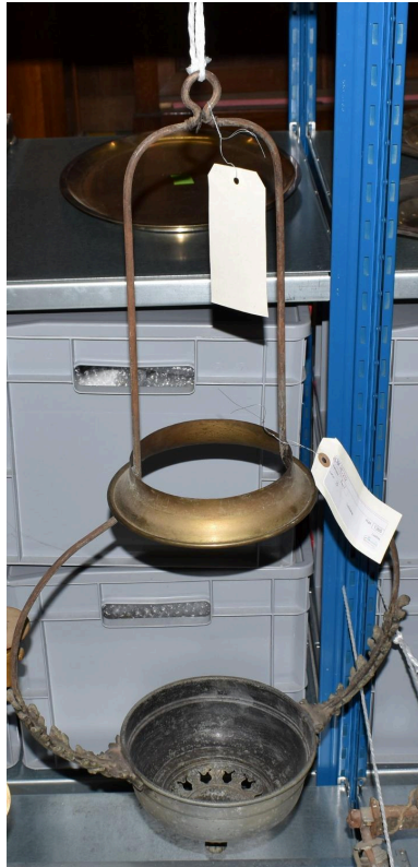
Vue générale de la suspension n°1 IVR84_20226302859NUC4A