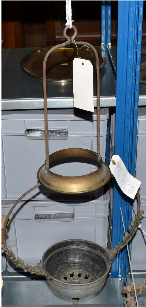
Vue générale de la suspension n°1