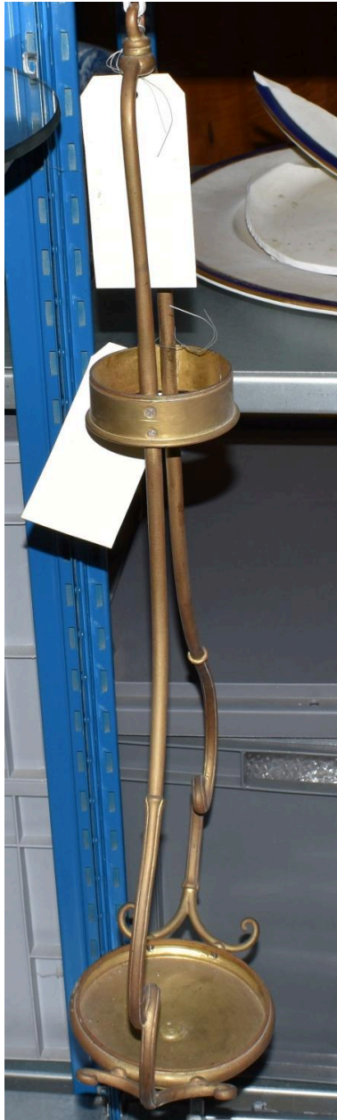
Vue générale de la suspension n°2 IVR84_20226302860NUC4A