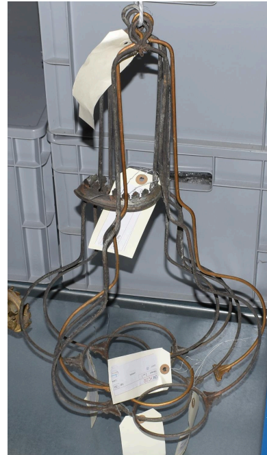
Vue générale des numéros 3 à 7.