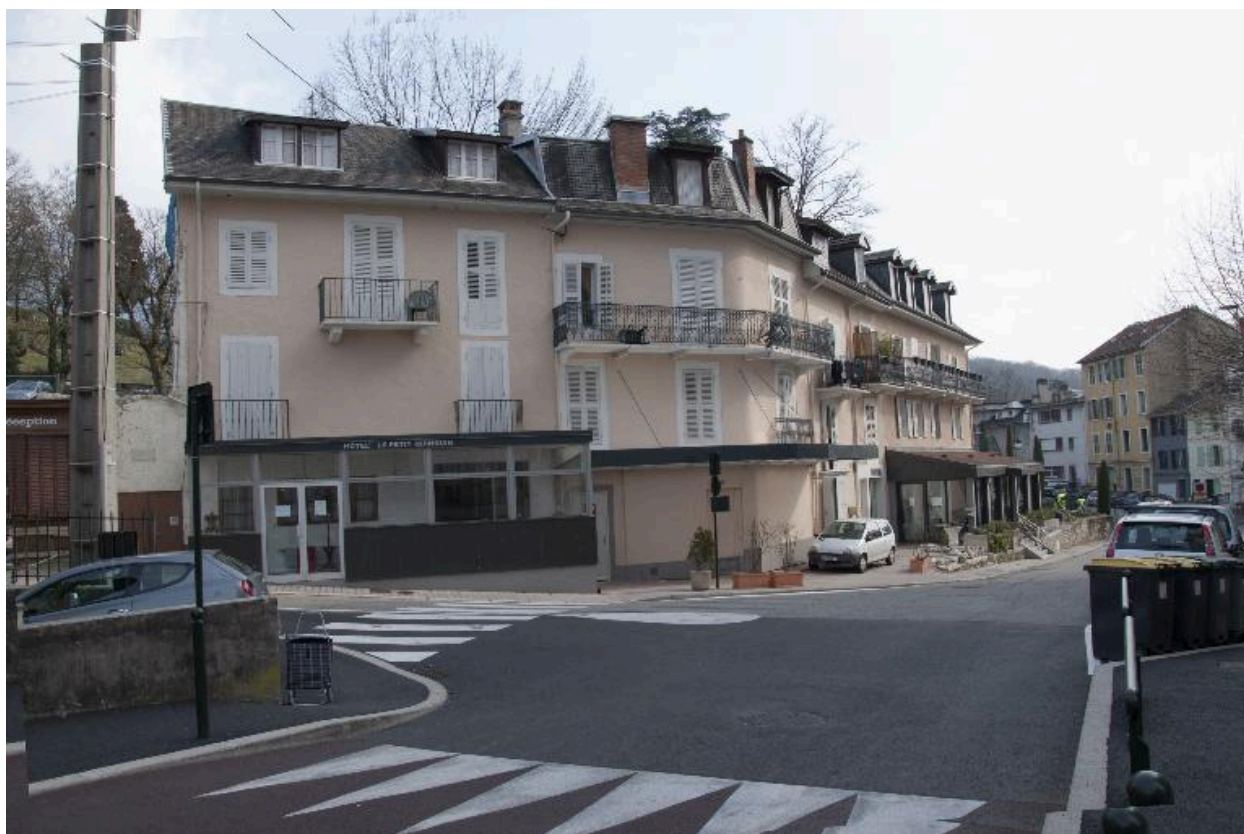
Vue d'ensemble en 2015 (immeuble à gauche)