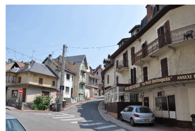
Le Petit Quinquin et son annexe, vue générale