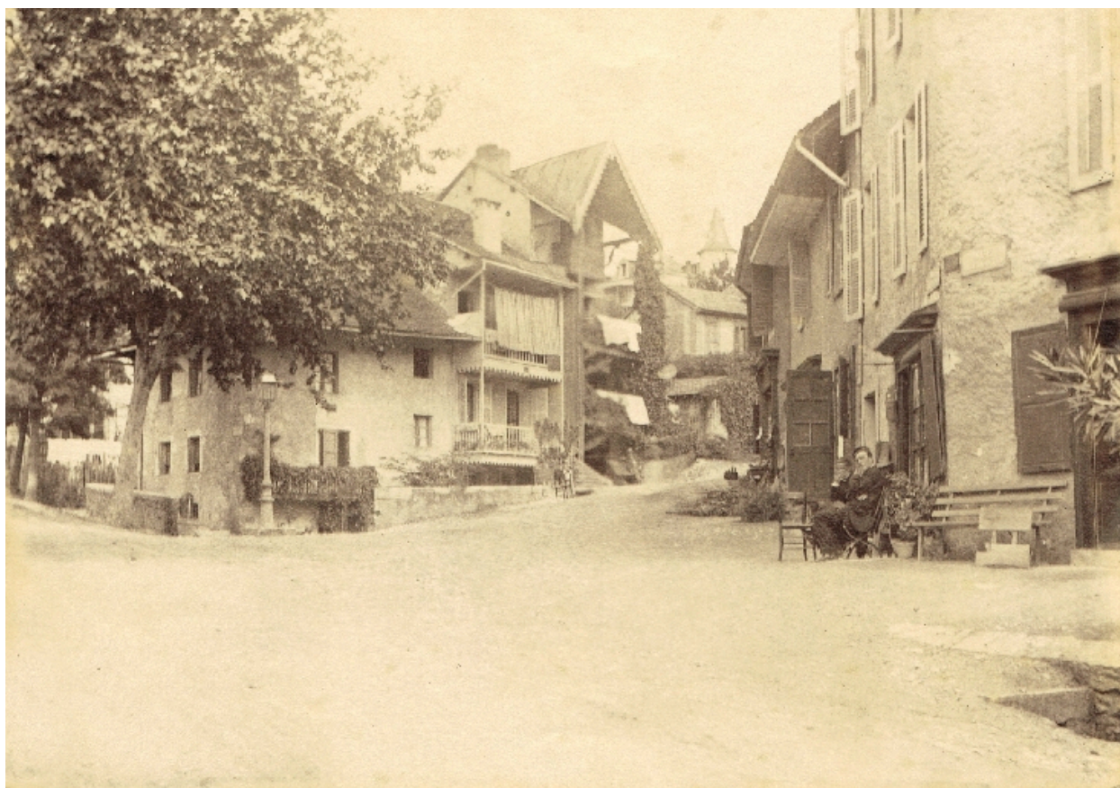
Vue en 1890