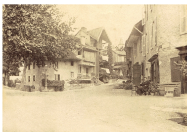
Vue en 1890 IVR82_20117300899NUCB