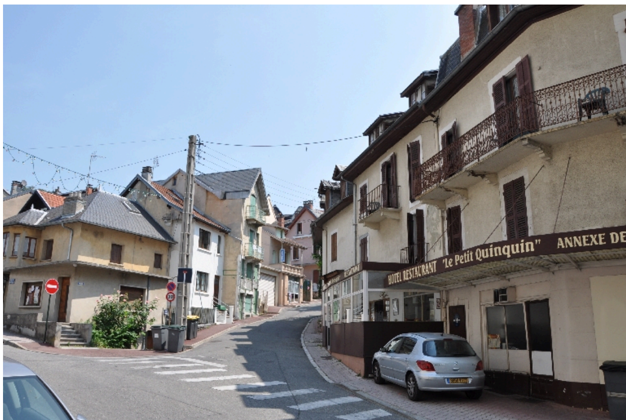
Le Petit Quinquin et son annexe, vue générale