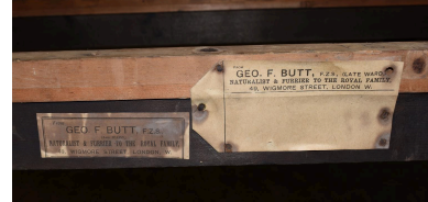
Vue des étiquettes IVR84_20226303513NUC4A