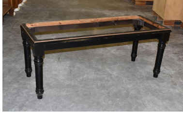
Vue générale IVR84_20226303512NUC4A