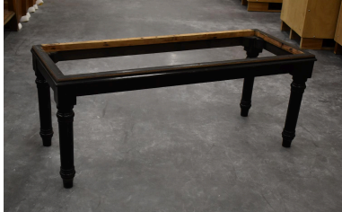
Vue générale IVR84_20226303511NUC4A