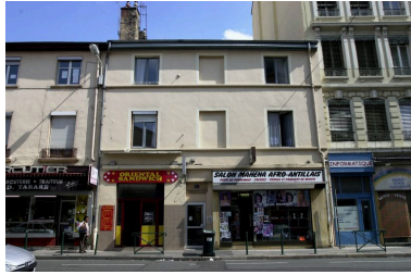
Elévation principale IVR82_20046904620NUCA