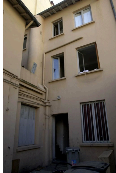
Elévation postérieure IVR82_20046904622NUCA