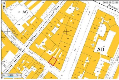
Plan masse et de situation, extrait de http://cadastre.gouv.fr IVR82_20136902189NUDA