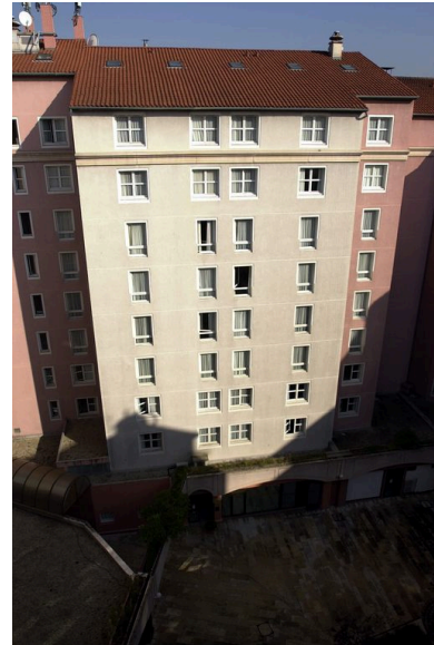
Elévation nord de la cour fermée