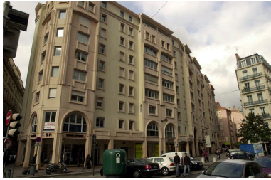
Vue générale depuis la place des Jacobins