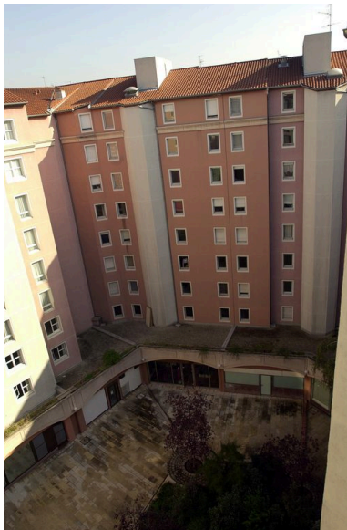
Elévation est de la cour fermée IVR82_20076902915NUCA