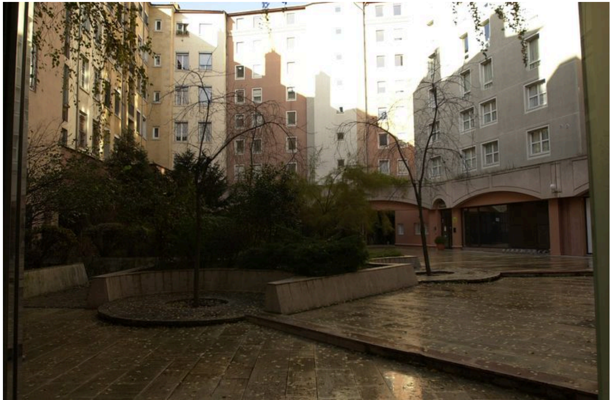
Le jardin intérieur