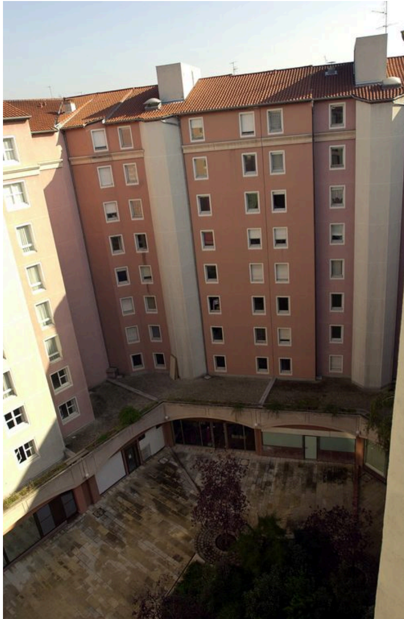
Elévation est de la cour fermée