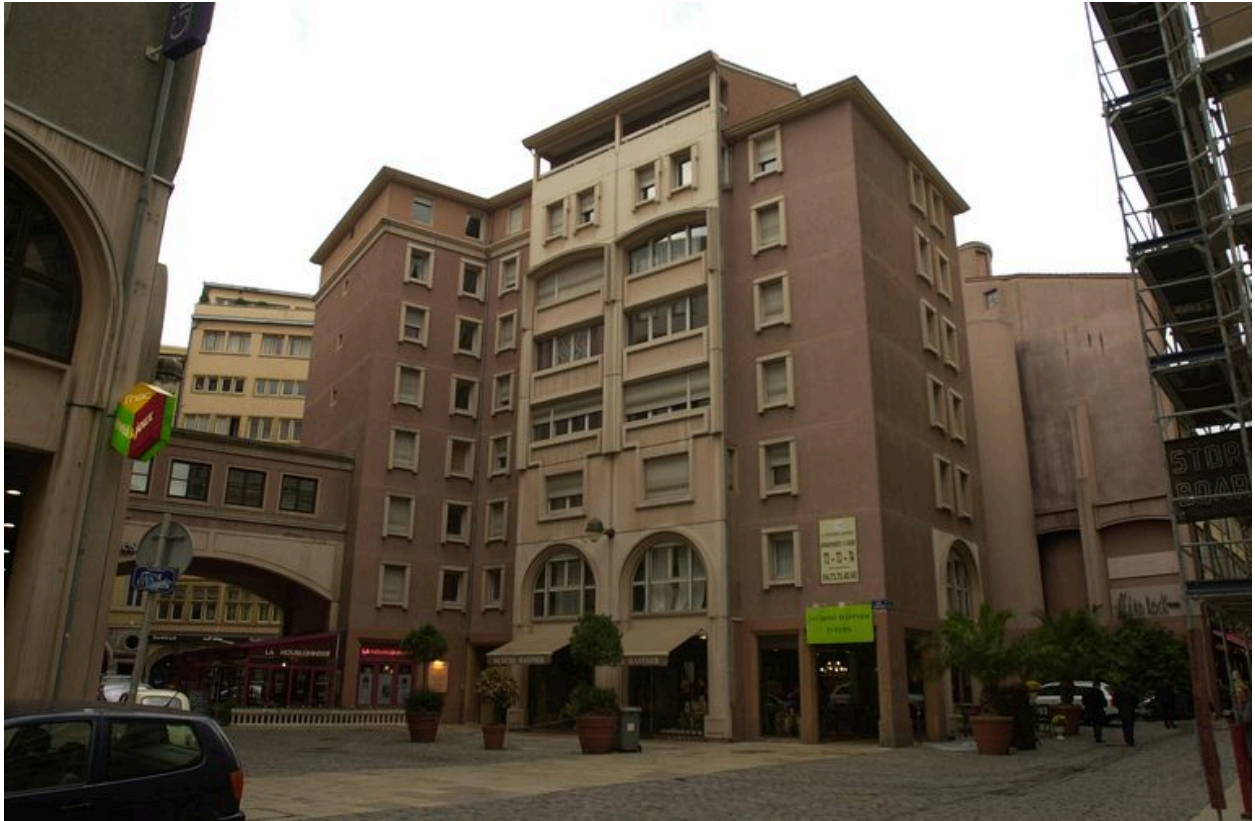
Vue générale depuis la rue Thomassin