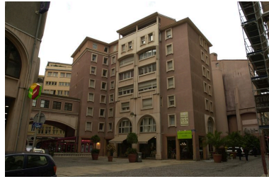
Vue générale depuis la rue Thomassin IVR82_20076901250NUCA