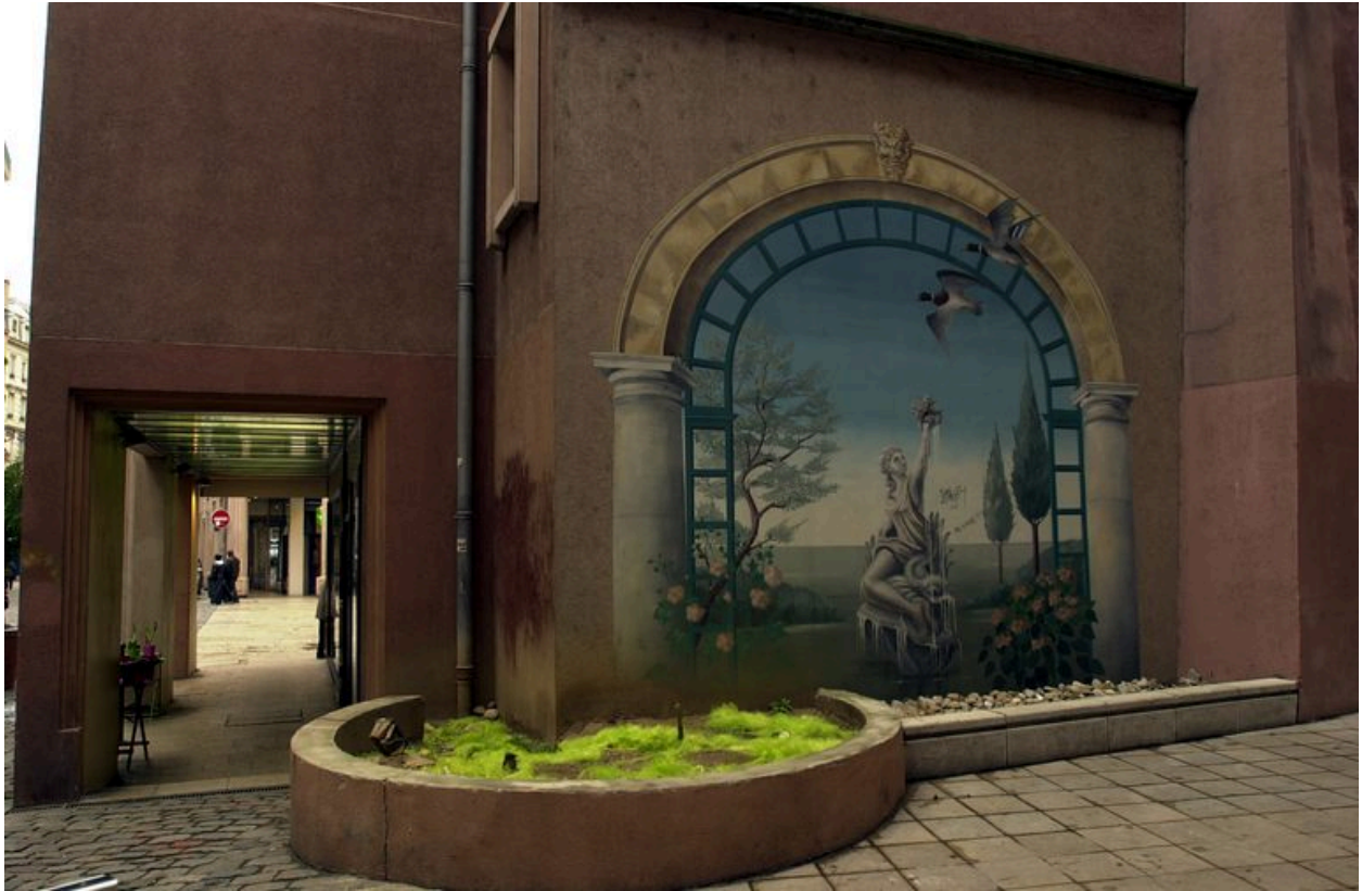
La peinture monumentale du mur nord donnant sur la cour de l'hôtel Horace-cardon