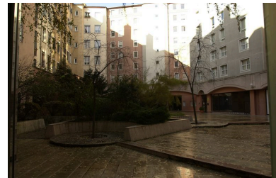
Le jardin intérieur IVR82_20076901251NUCA