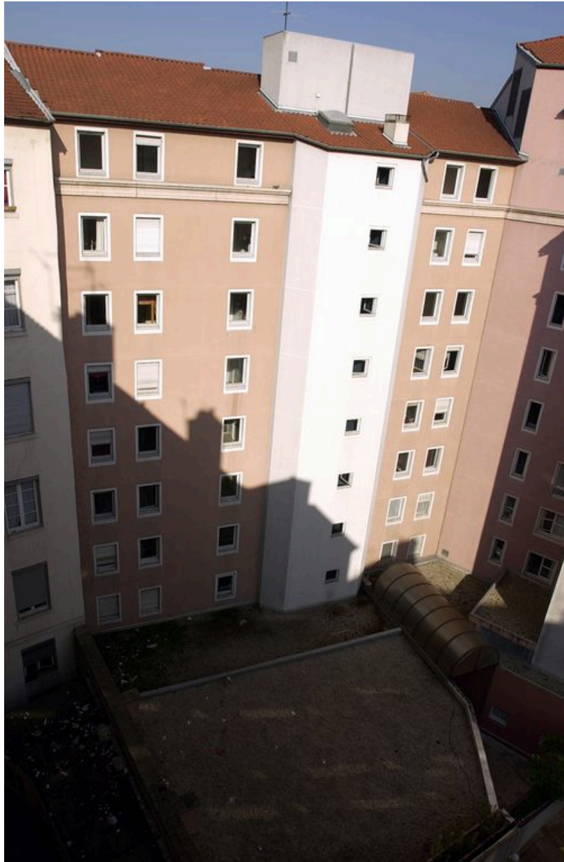
Elévation ouest de la cour fermée