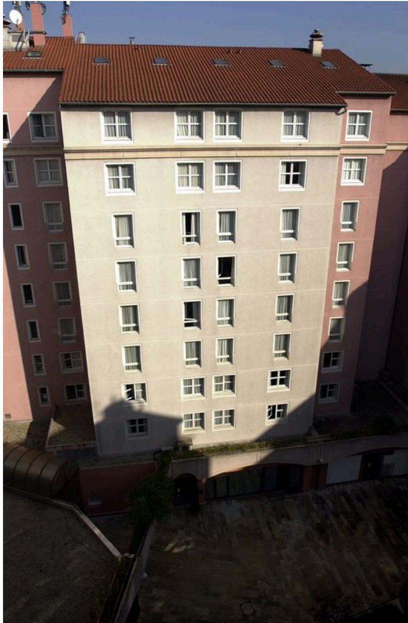
Elévation nord de la cour fermée