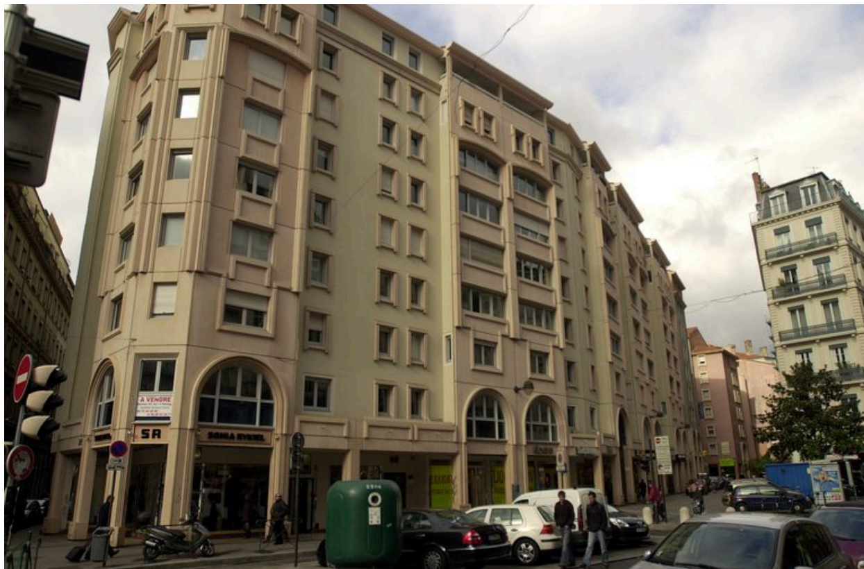
Vue générale depuis la place des Jacobins