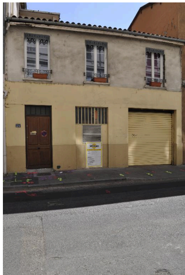
Vue générale IVR82_20156900959NUCA