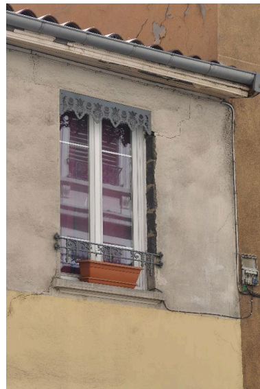
Vue rapprochée d'une fenêtre de l'étage