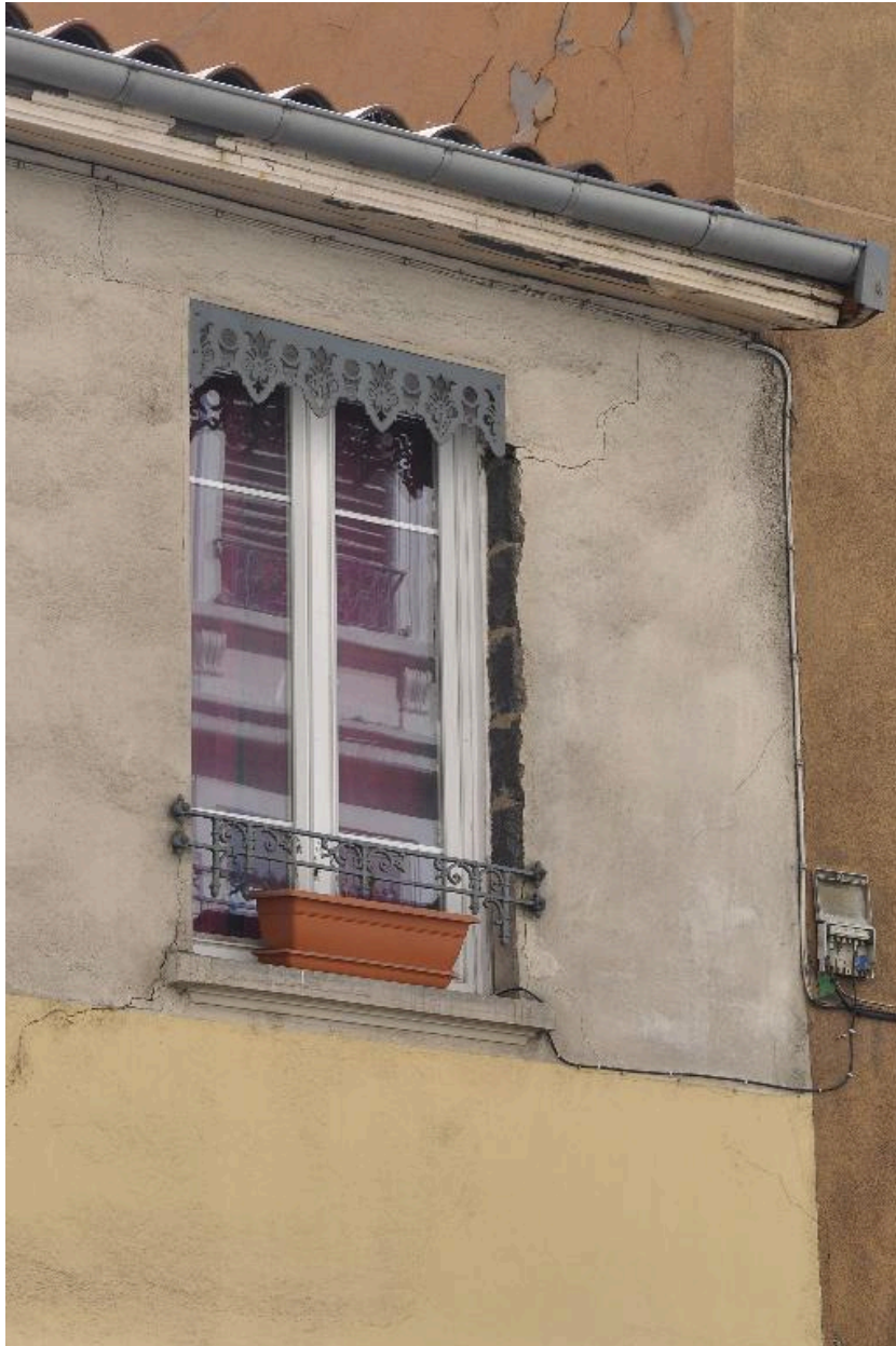
Vue rapprochée d'une fenêtre de l'étage