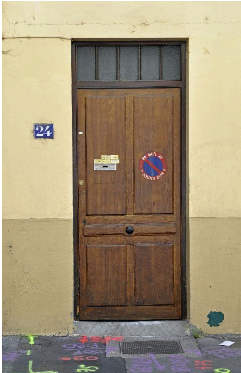
Vue rapprochée de la porte