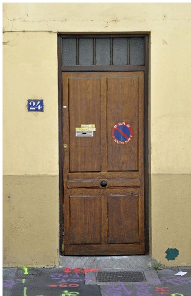
Vue rapprochée de la porte IVR82_20156900961NUCA