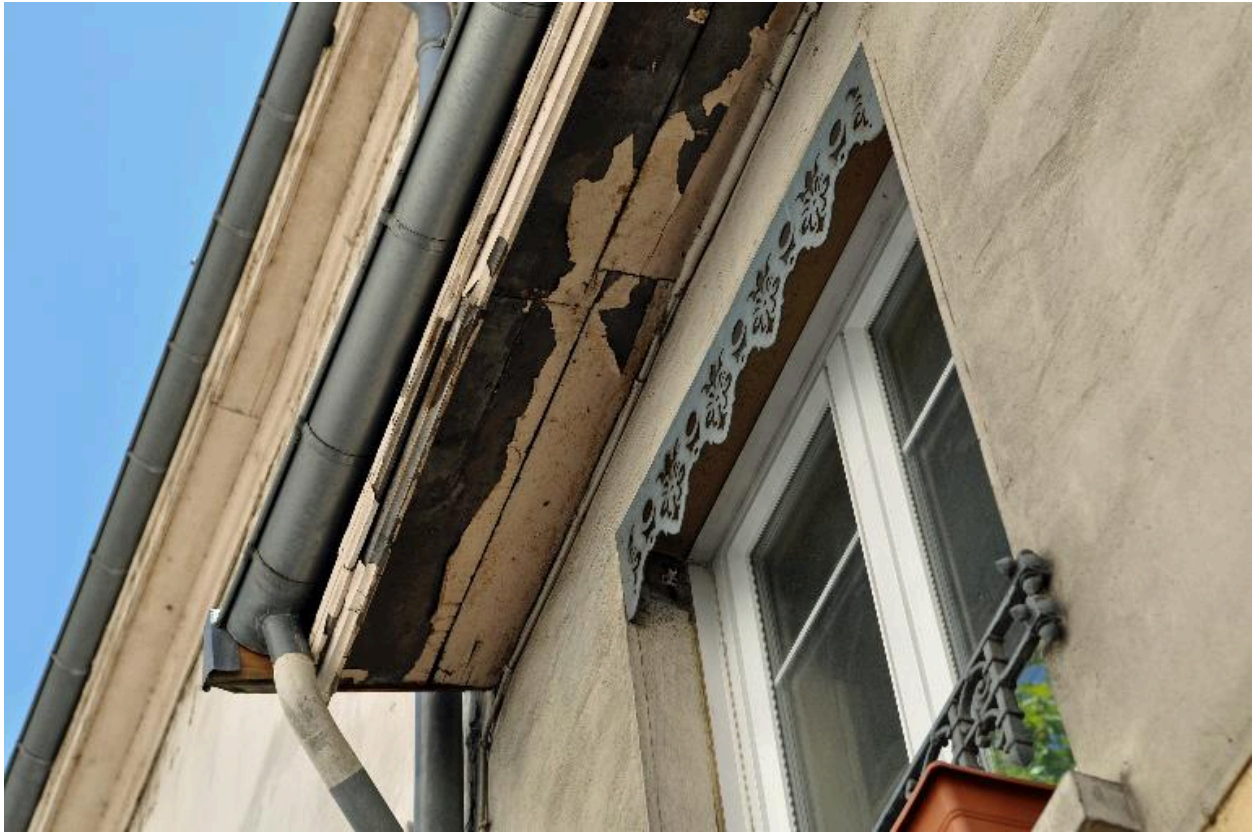
Vue rapprochée : avant-toit fermé en bois