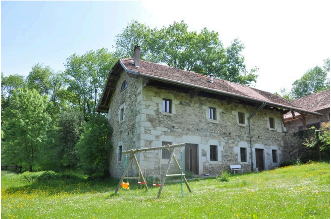
Façade antérieure du moulin principale