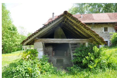
Four à pain du moulin des Ecuries IVR82_20107400585NUCA