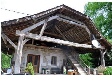
Fermes en bois du second bâtiment du moulin IVR82_20107400592NUCA