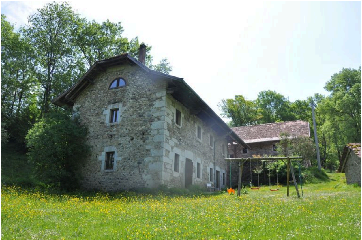
Elévation nord-ouest du moulin principal