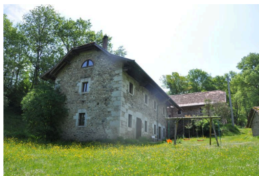
Elévation nord-ouest du moulin principal IVR82_20107400589NUCA