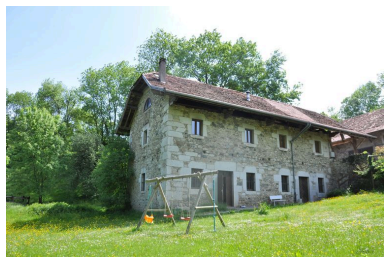
Façade antérieure du moulin principale IVR82_20107400588NUCA