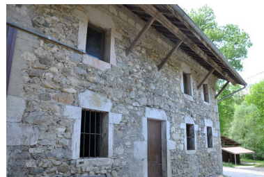
Façade antérieure du bâtiment du premier bâtiment du moulin IVR82_20107400593NUCA