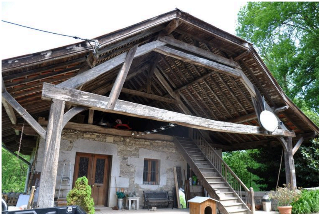
Fermes en bois du second bâtiment du moulin