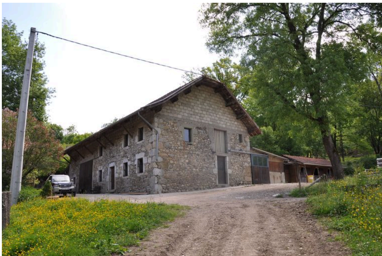
Mur pignon sud du premier moulin