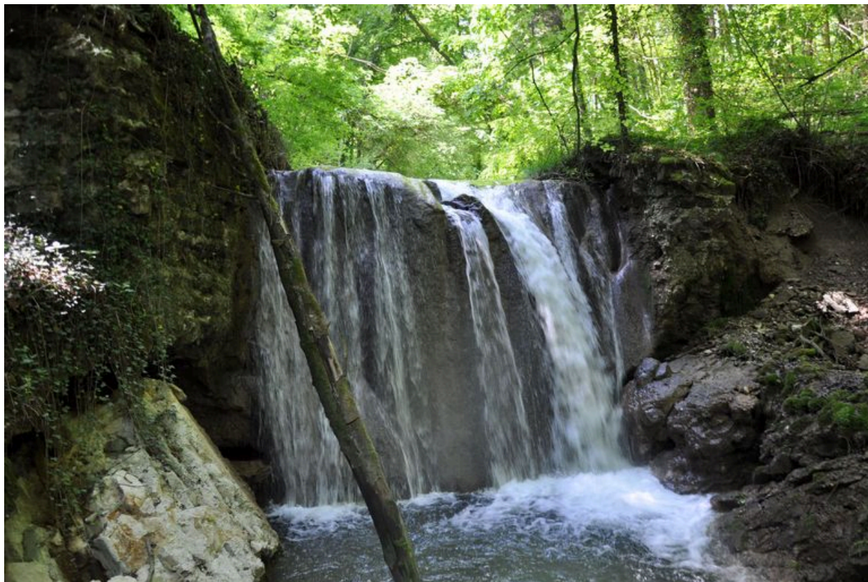
Seuil de prise d'eau alimentant le bief