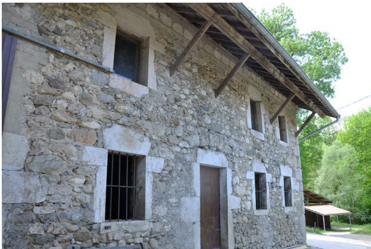
Façade antérieure du bâtiment du premier bâtiment du moulin