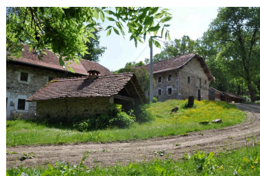
Vue d'ensemble du domaine depuis le chemin intérieur IVR82_20107400587NUCA