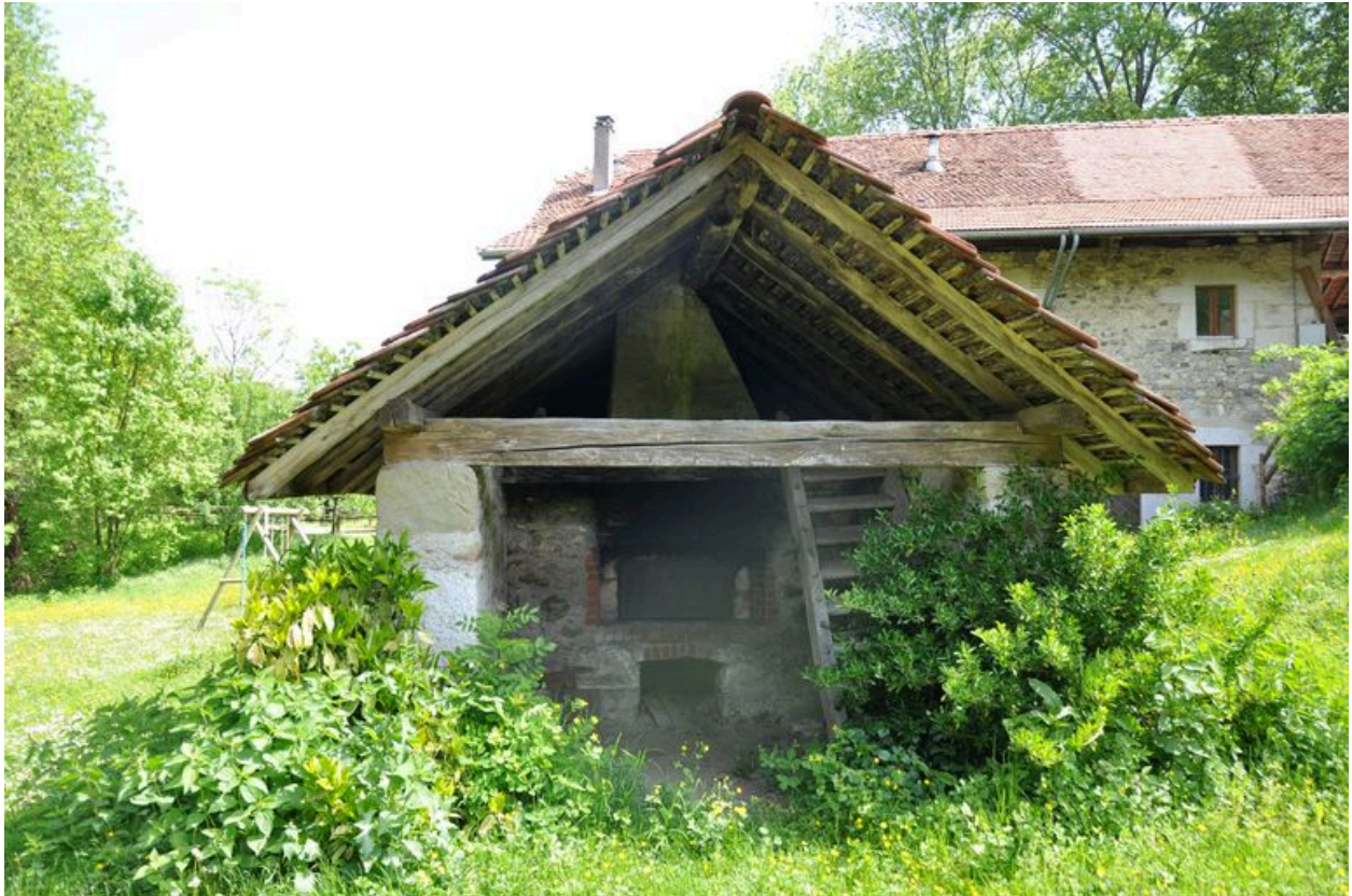
Four à pain du moulin des Ecuries