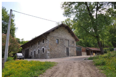
Mur pignon sud du premier moulin IVR82_20107400591NUCA