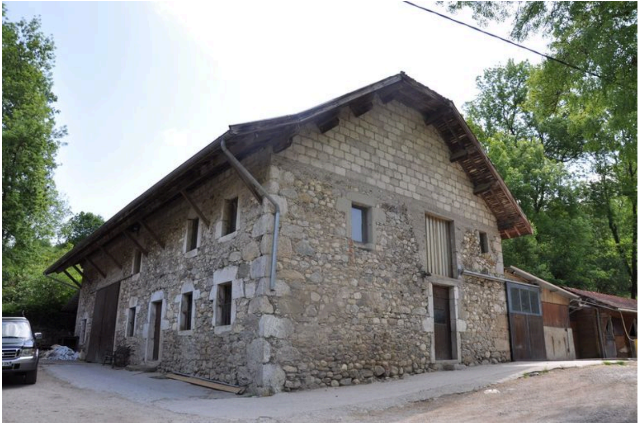
Elévation nord-est du bâtiment secondaire