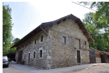
Elévation nord-est du bâtiment secondaire IVR82_20107400584NUCA