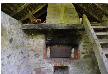
Vue intérieure du four à pain