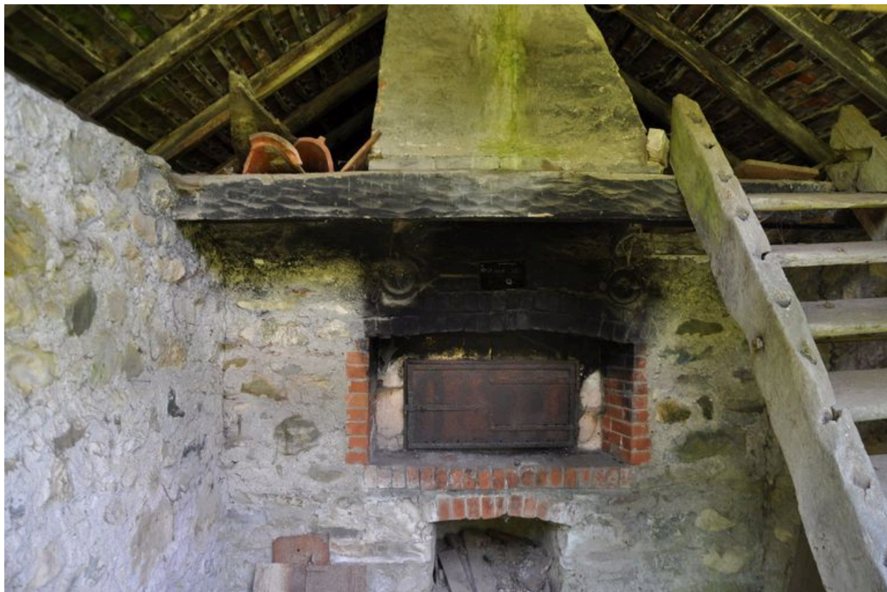
Vue intérieure du four à pain