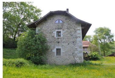
Travée principale du mur pignon nord