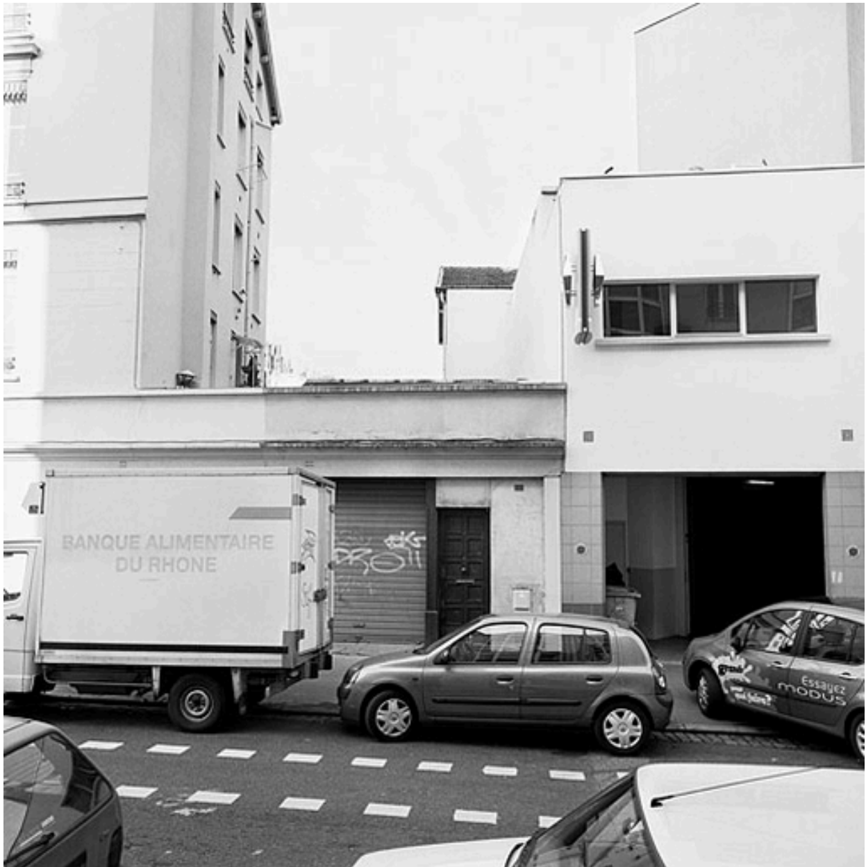
Vue est façade rue Rachais