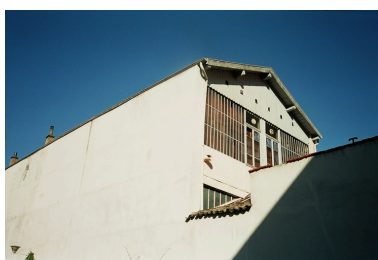
Vue générale nord-est, rue Rachais IVR82_20046902921NUCA