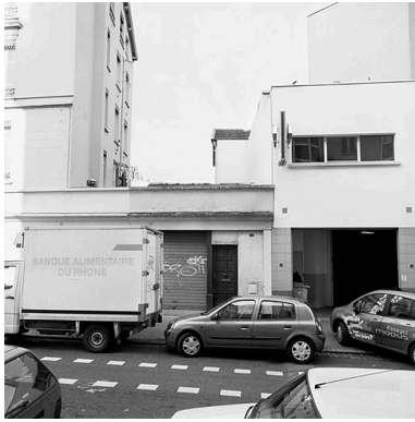
Vue est façade rue Rachais