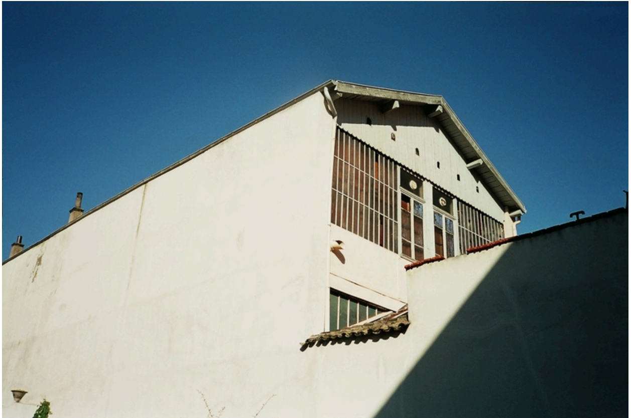
Vue générale nord-est, rue Rachais