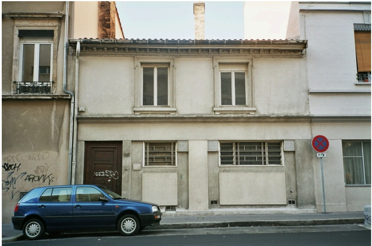
Vue est grande rue de la Guillotière