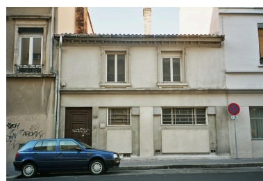
Vue est grande rue de la Guillotière IVR82_20046902922NUCA