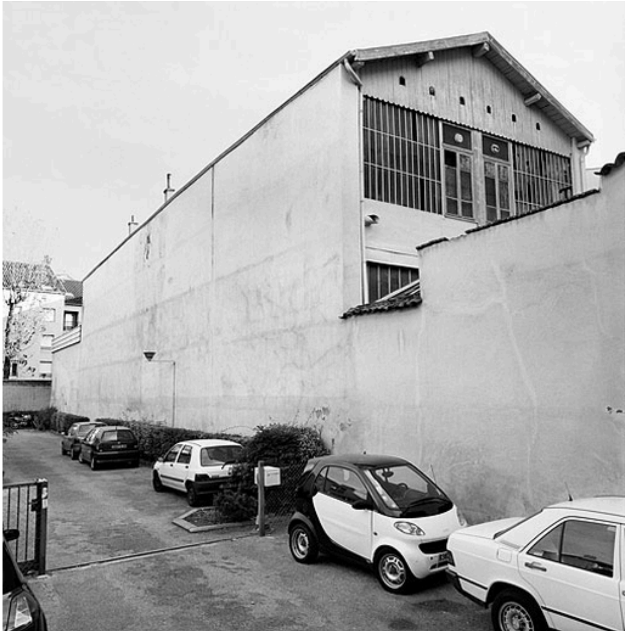
Vue générale sud