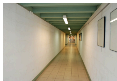
Distribution intérieure IVR82_20096901560NUCA