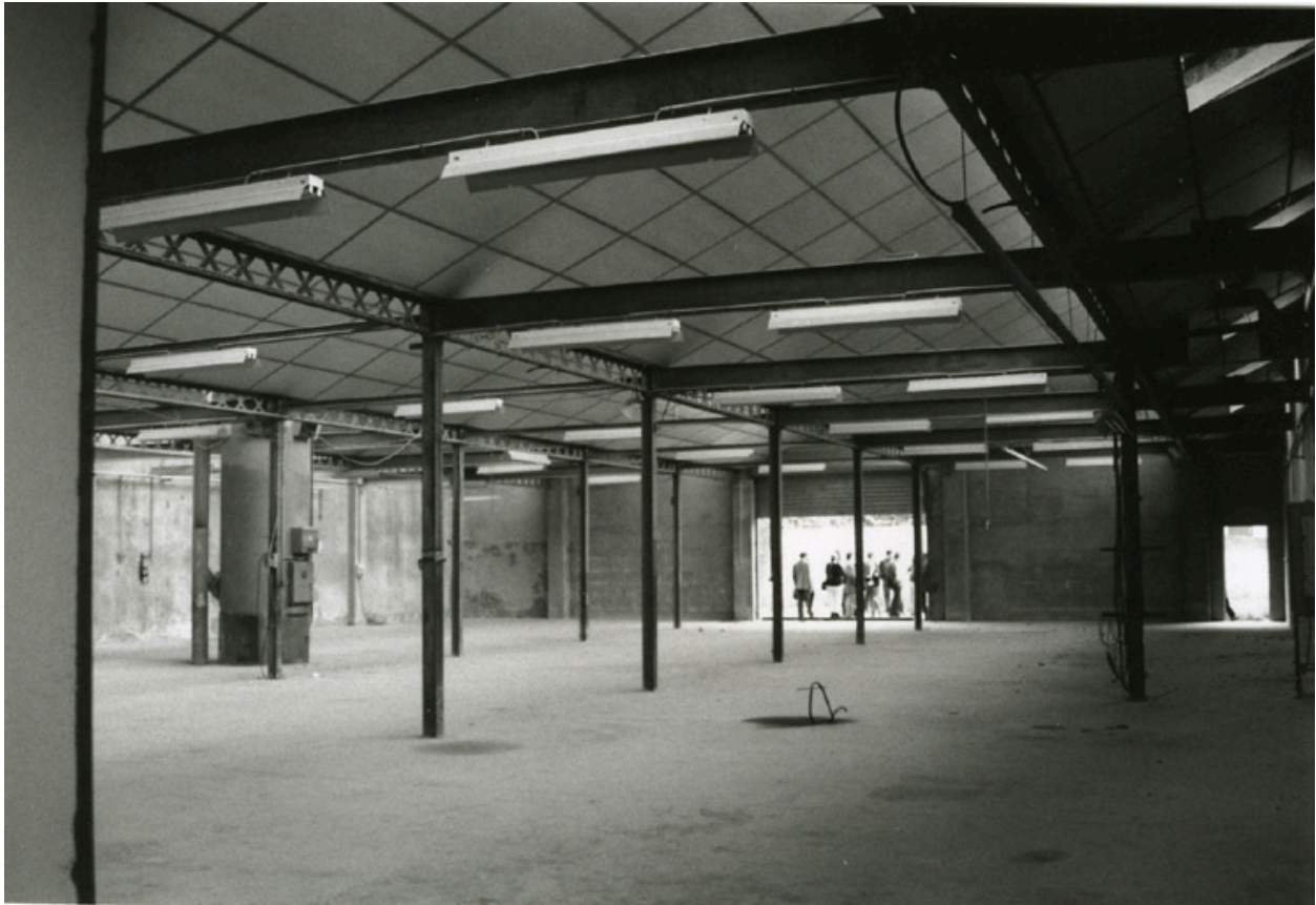
Espace en 1994 (début des travaux). Ecole Emile Cohl Archives privées. Ecole Emile Cohl