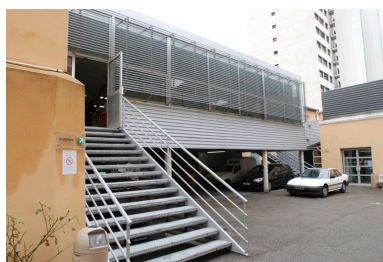
Vue nord-ouest IVR82_20096901574NUCA