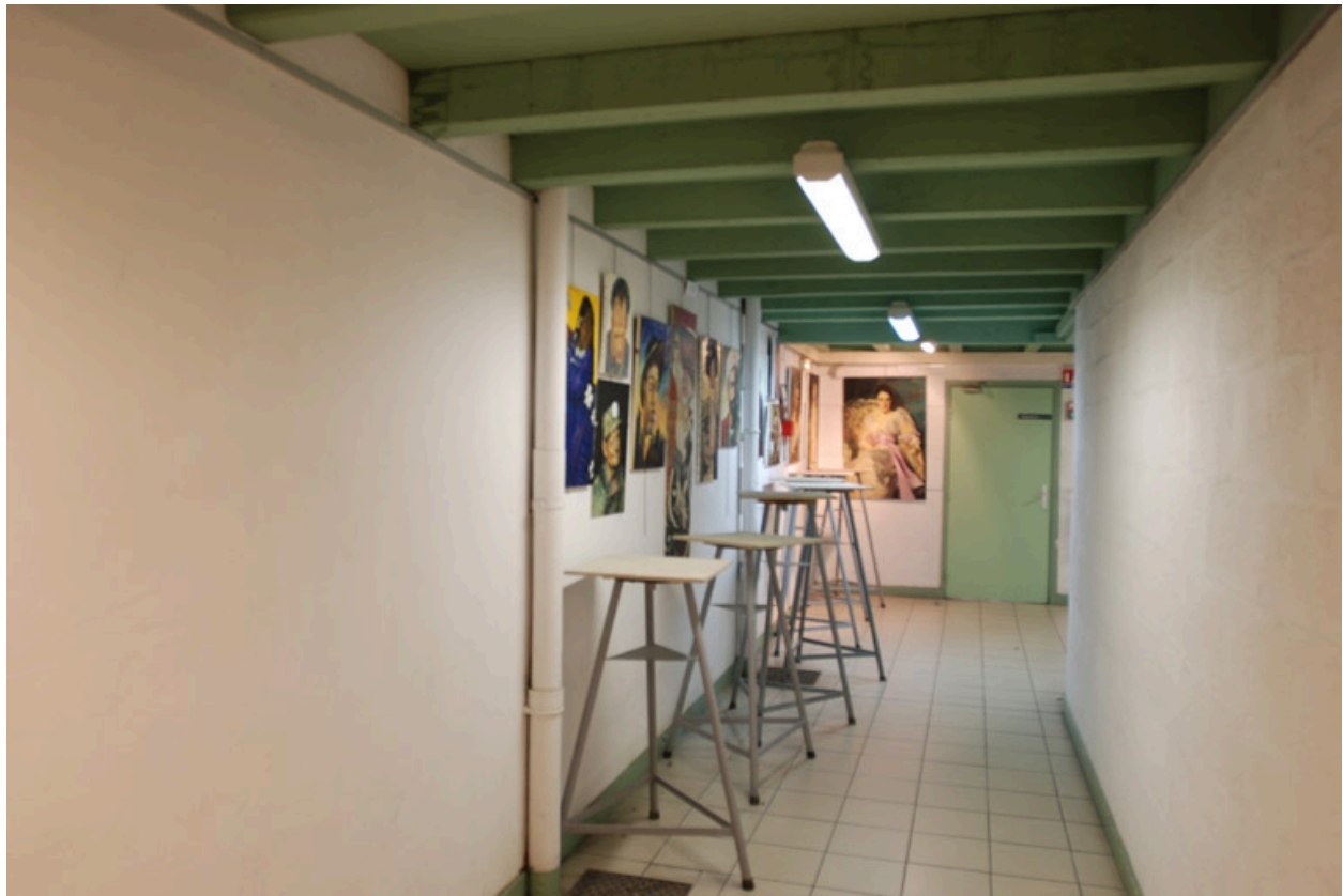
Couloir de distribution