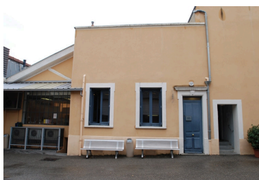
Vue est : partie administrative IVR82_20096901575NUCA