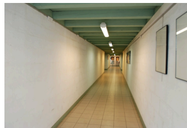
Distribution intérieure IVR82_20096901560NUCA