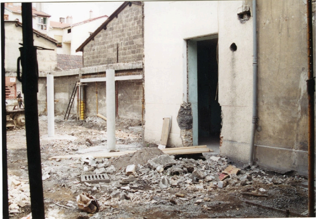
Etat en 1994 au moment de la réhabilitation. Ecole Emile Cohl Archives privées. Ecole Emile Cohl