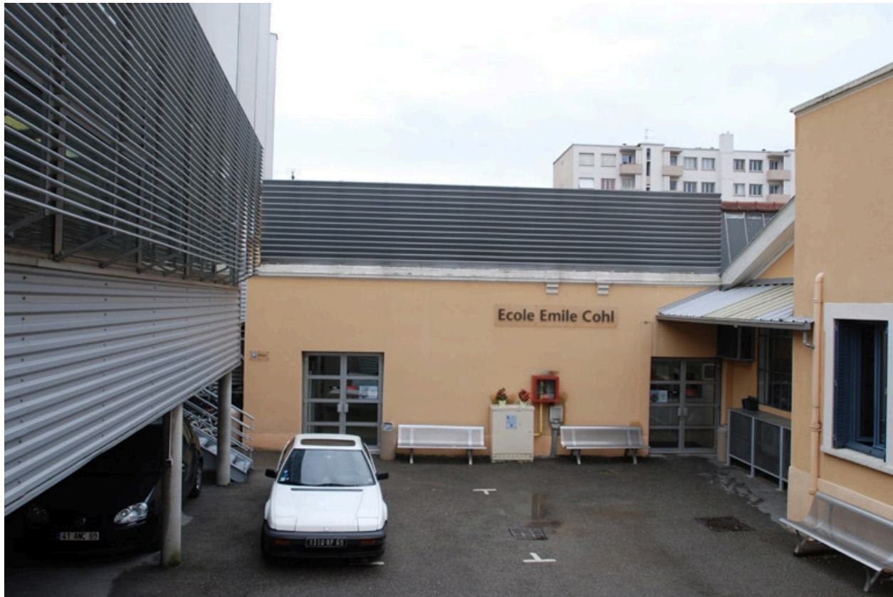
Vue d'ensemble nord