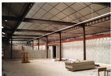
Travaux en 1994 : réhabilitation. IVR82_20096901552NUCAB