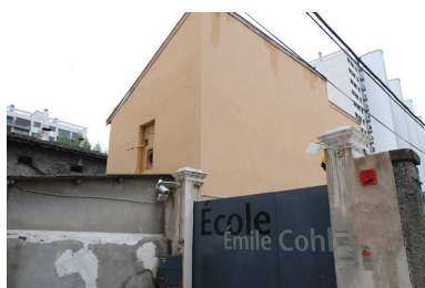
Vue nord ouest