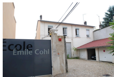
Vue nord-ouest IVR82_20096901579NUCA