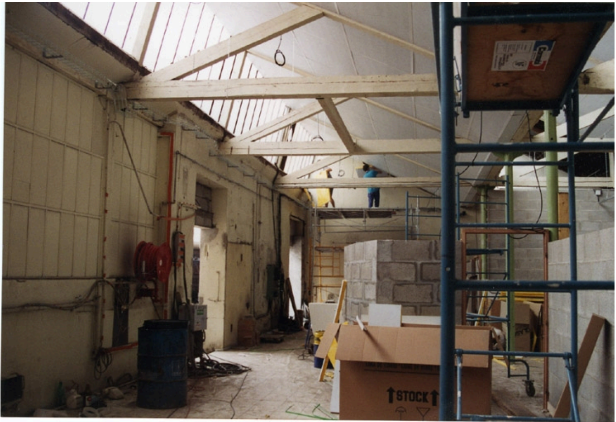
Etat au moment de la réhabilitation en 1994 : charpente en bois. Ecole Emile Cohl Archives privées. Ecole Emile Cohl