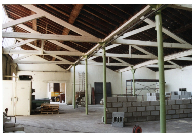
Etat en 1994. Ecole Emile Cohl IVR82_20096901550NUCAB