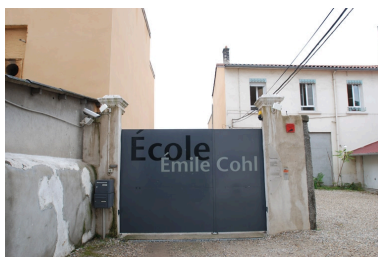
Entrée principale avec enseigne : Ecole Emile Cohl IVR82_20096901578NUCA