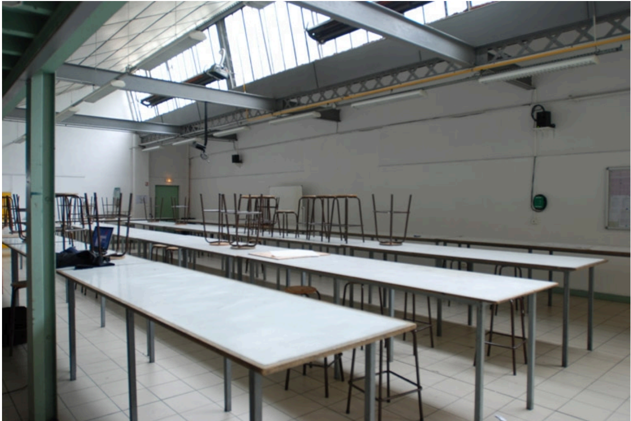
Salle de classe