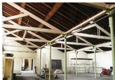
Chantier en 1994 : réhabilitation du site.