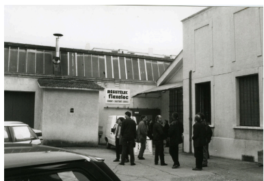
Site en 1994. IVR82_20096901549NUCAB