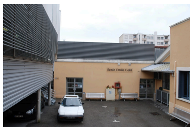
Vue d'ensemble nord IVR82_20096901577NUCA