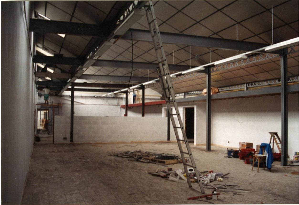
Etat au moment de la réhabilitation en 1994. Ecole Emile Cohl Archives privées. Ecole Emile Cohl