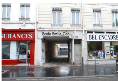
Porche de l'entrée principale rue Paul Bert IVR82_20096901581NUCA