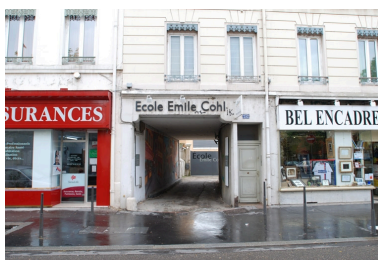
Porche de l'entrée principale rue Paul Bert IVR82_20096901581NUCA