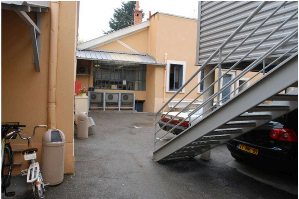
Vue extérieure nord