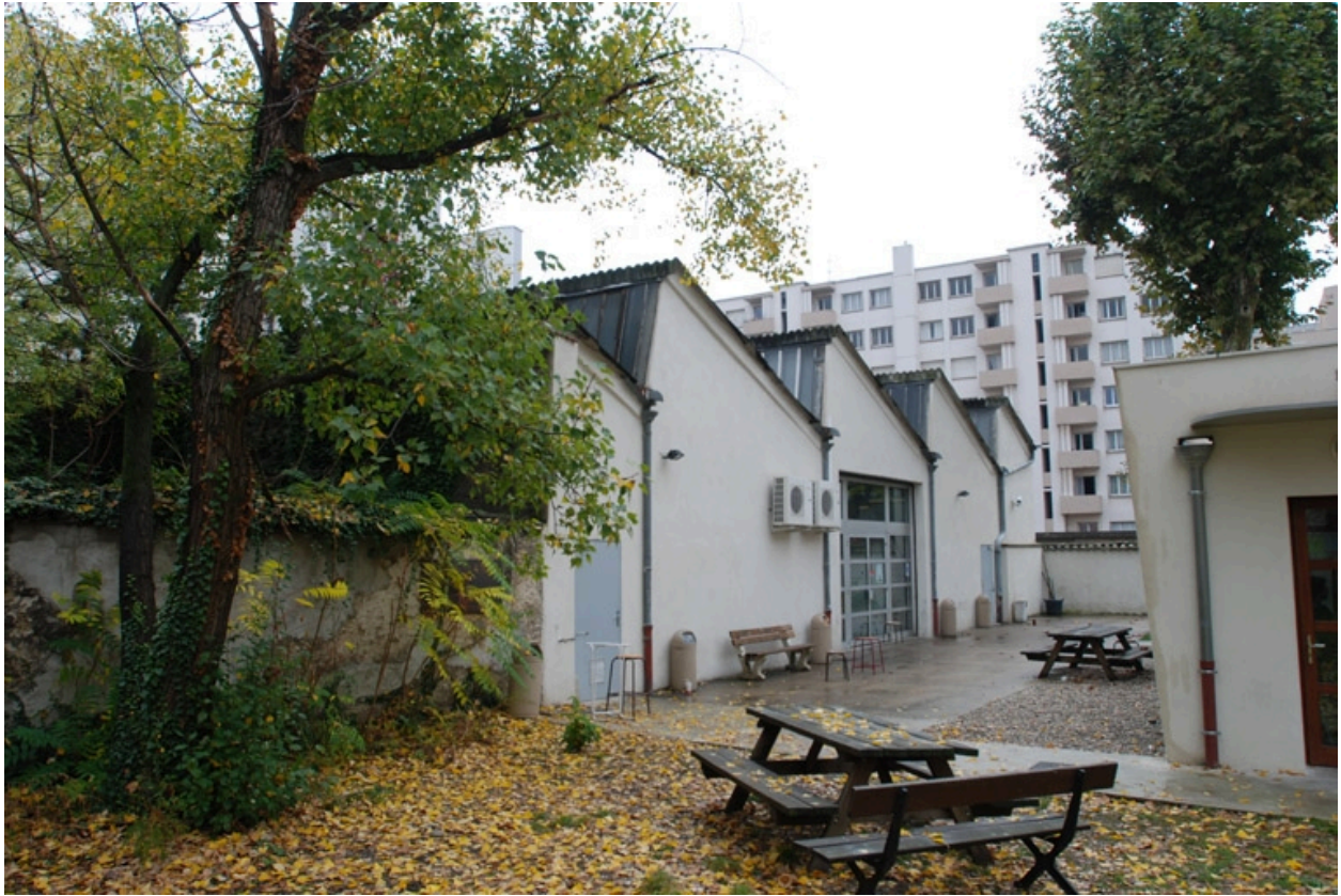
Vue ouest du site