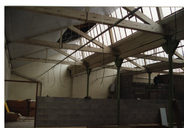
Etat avant réhabilitation : charpente en bois, poteaux fonte, 1994. IVR82_20096901542NUCAB