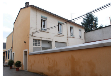
Vue nord-est