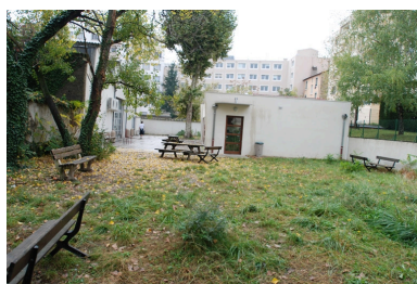
Vue nord (jardin)