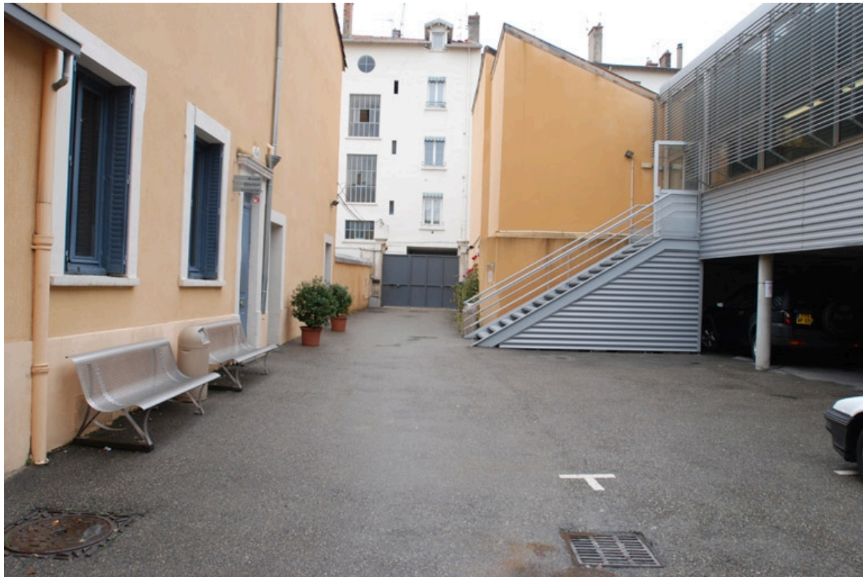
Vue d'ensemble sud