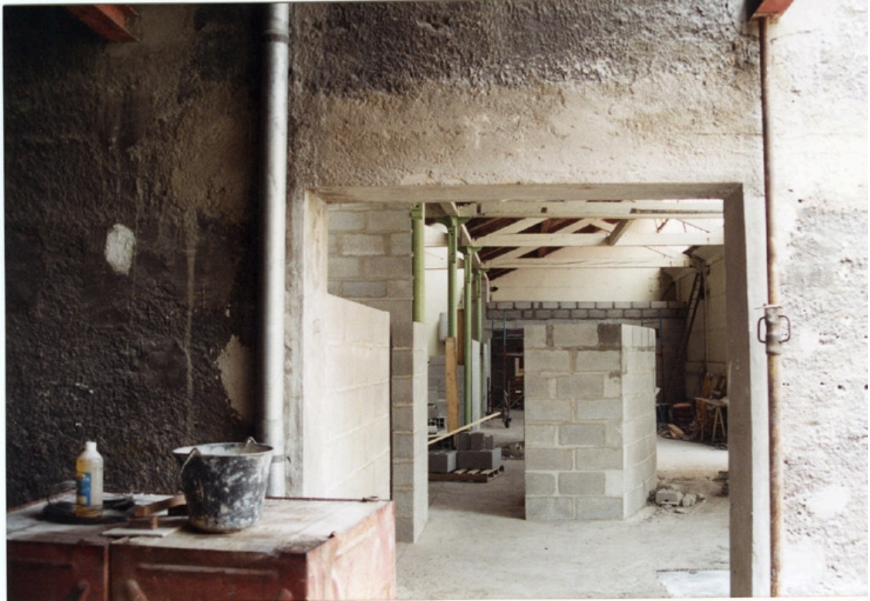
Etat au moment des travaux en 1994. Ecole Emile Cohl Archives privées. Ecole Emile Cohl