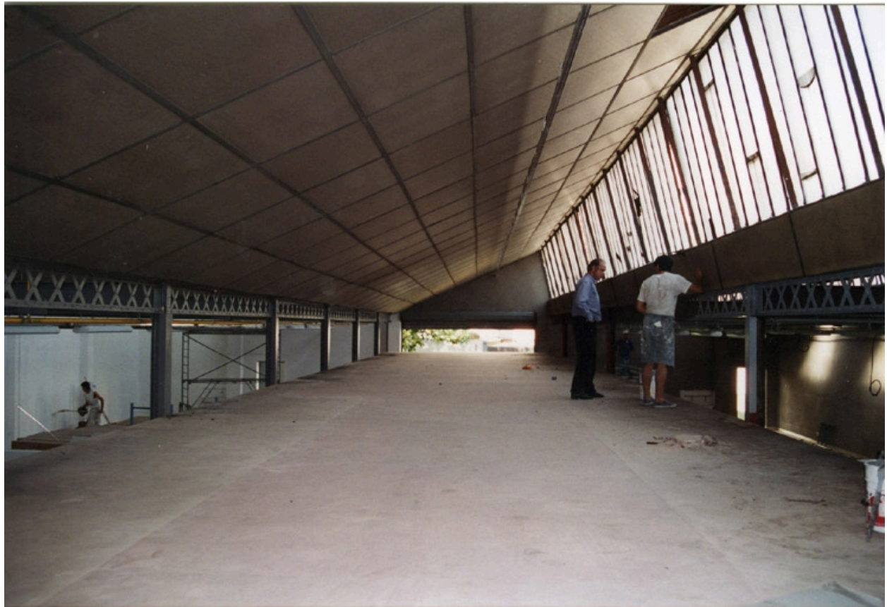
Chantier : réhabilitation en 1994. Ecole Emile Cohl Archives privées. Ecole Emile Cohl