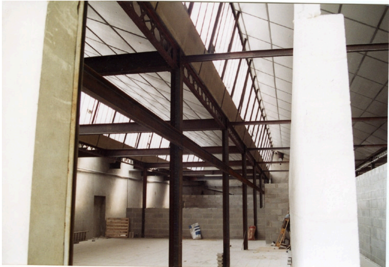
Réhabilitation du site : travaux en 1994. Ecole Emile Cohl Archives privées. Ecole Emile Cohl