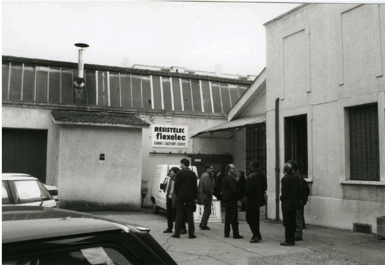
Site en 1994. Ecole Emile Cohl Archives privées. Ecole Emile Cohl