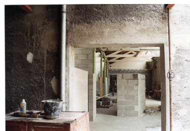
Etat au moment des travaux en 1994. IVR82_20096901543NUCAB