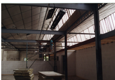
Travaux de réhabilitation du site en 1994.