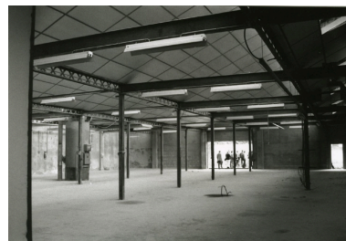
Espace en 1994 (début des travaux). IVR82_20096901548NUCAB