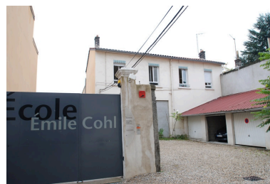
Vue nord-ouest IVR82_20096901579NUCA