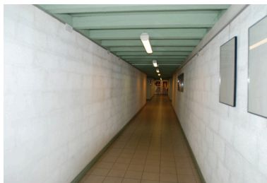
Vue intérieure de l'école, distribution