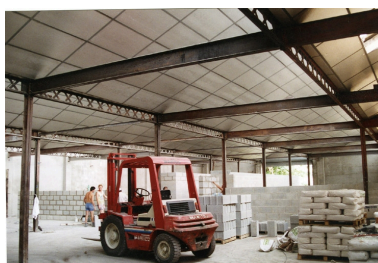
Etat au moment de la réhabilitation en 1994 : structure métallique conservée.