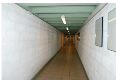
Vue intérieure de l'école, distribution IVR82_20096901559NUCA