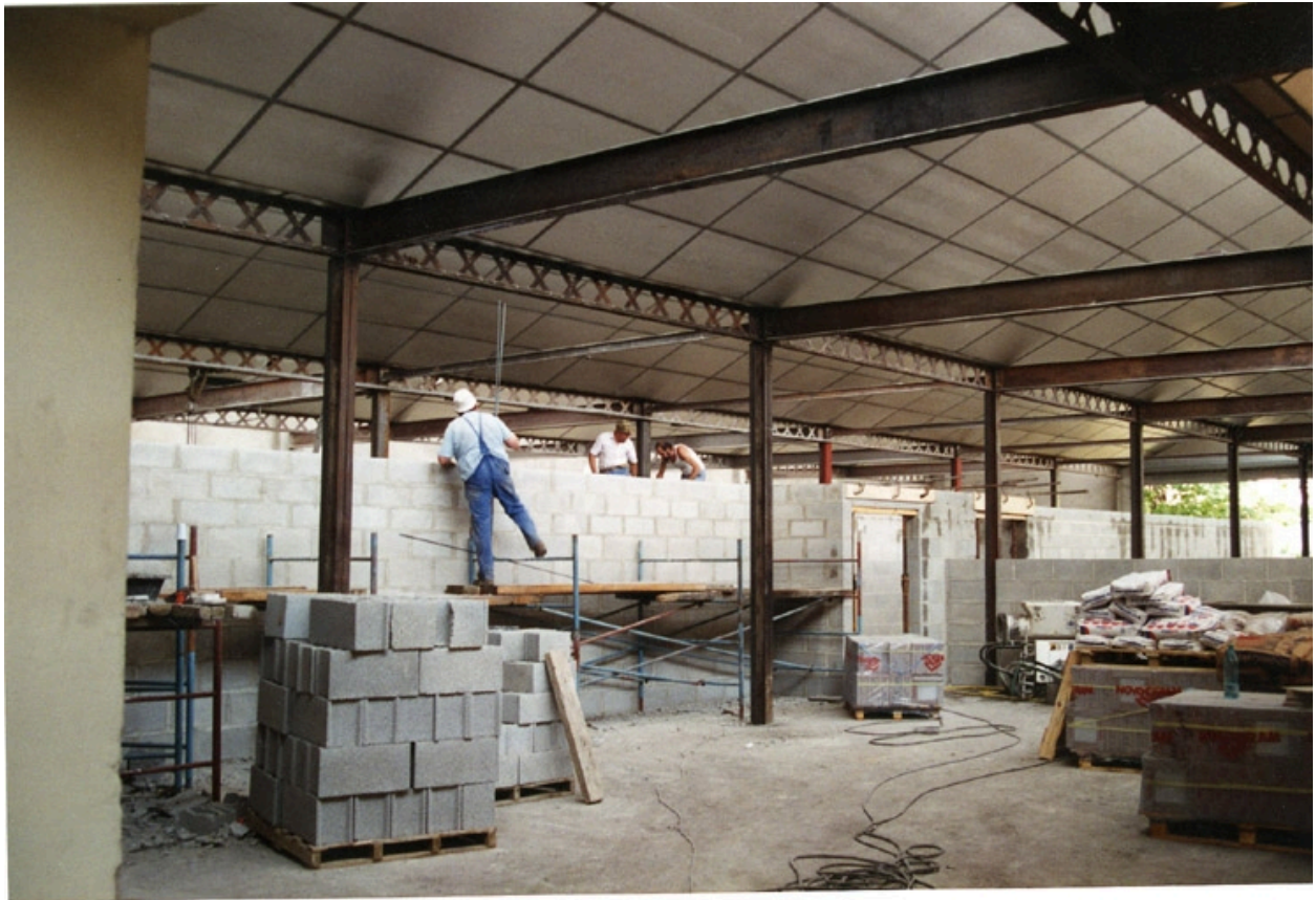
Travaux au moment de la réhabilitation du site 1994. Ecole Emile Cohl