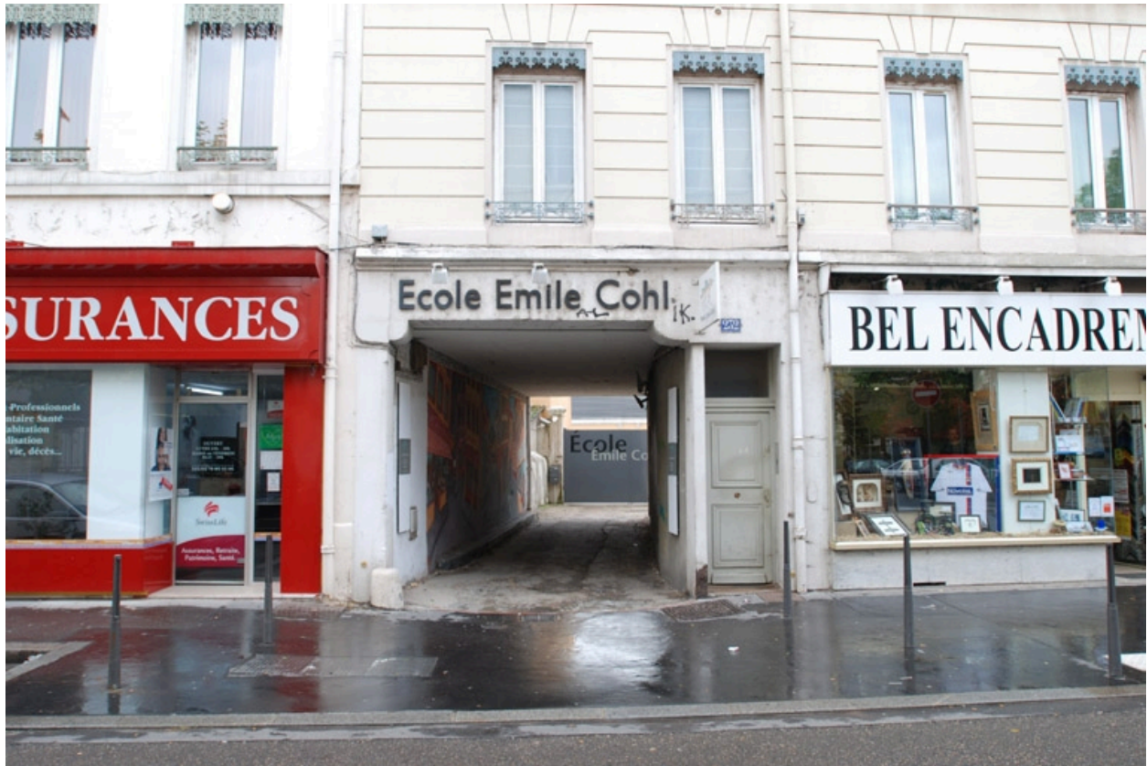
Porche de l'entrée principale rue Paul Bert