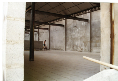
Chantier : réhabilitation en 1994.