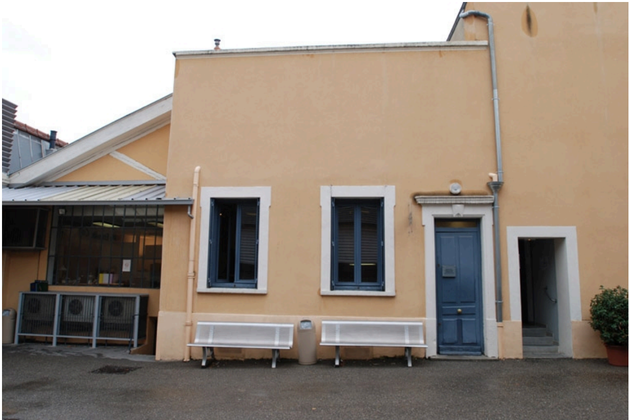
Vue est : partie administrative