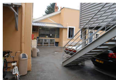
Vue extérieure nord IVR82_20096901570NUCA