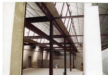
Réhabilitation du site : travaux en 1994.