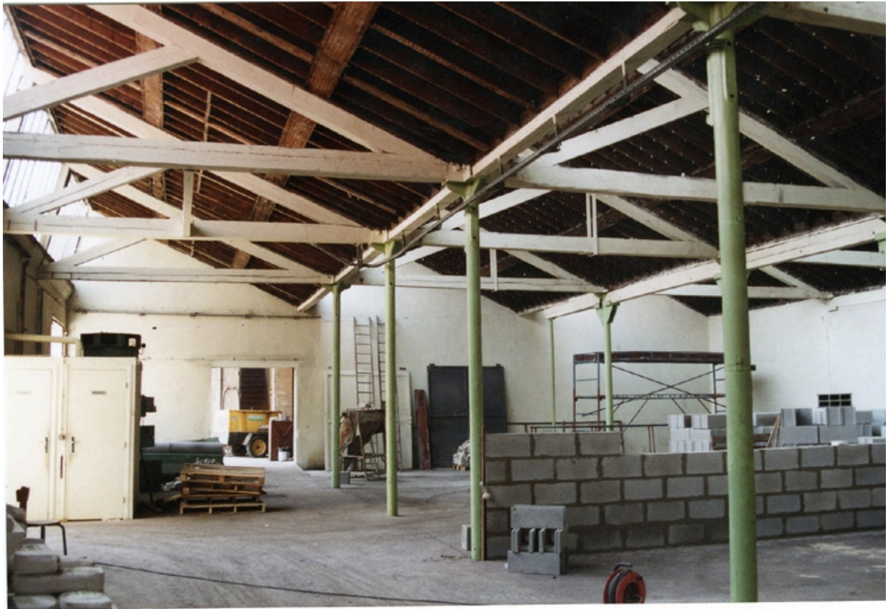
Etat en 1994. Ecole Emile Cohl