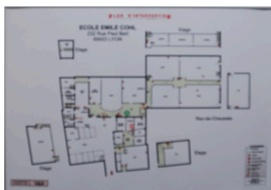
Plan du site IVR82_20096901567NUCA