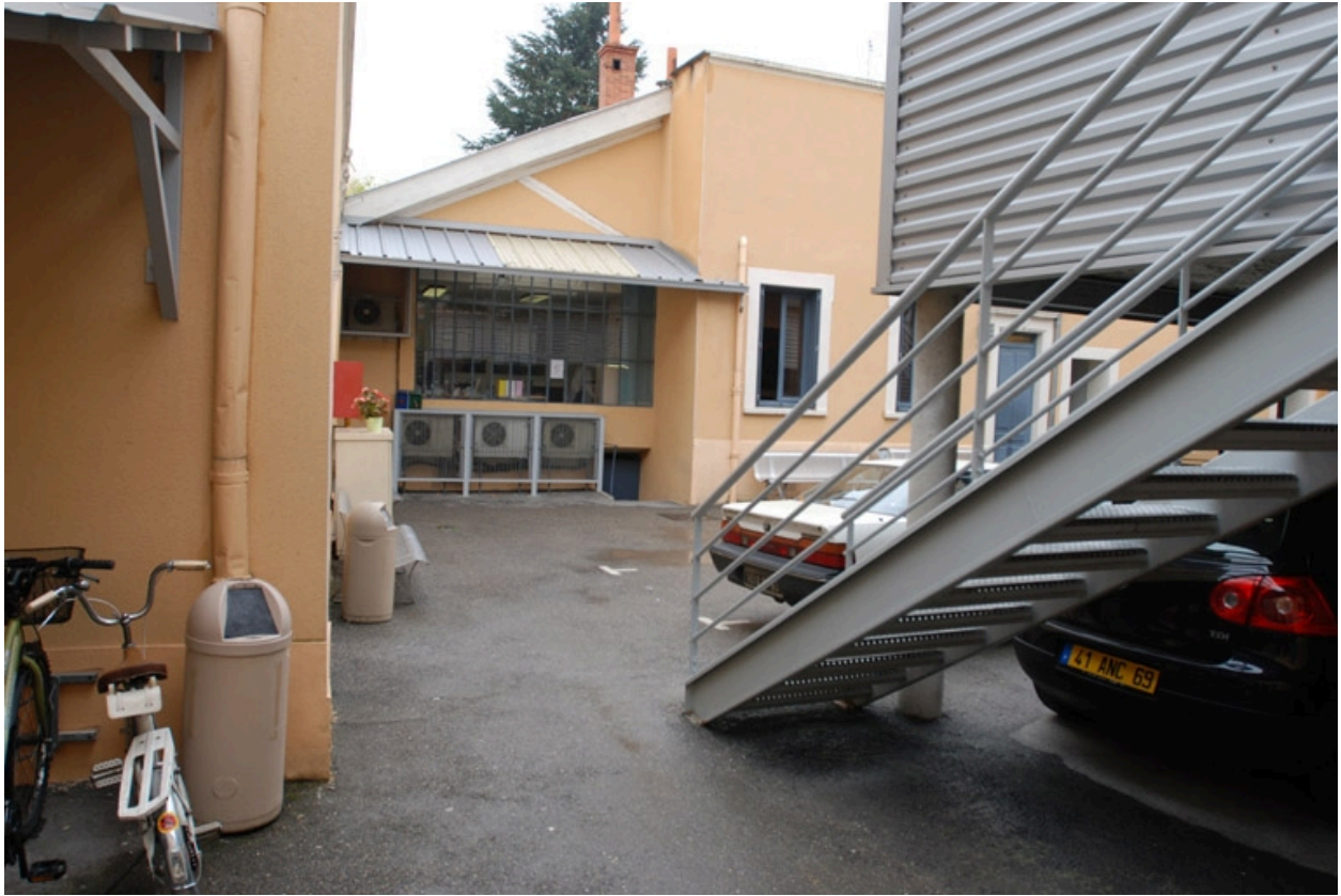
Vue extérieure nord