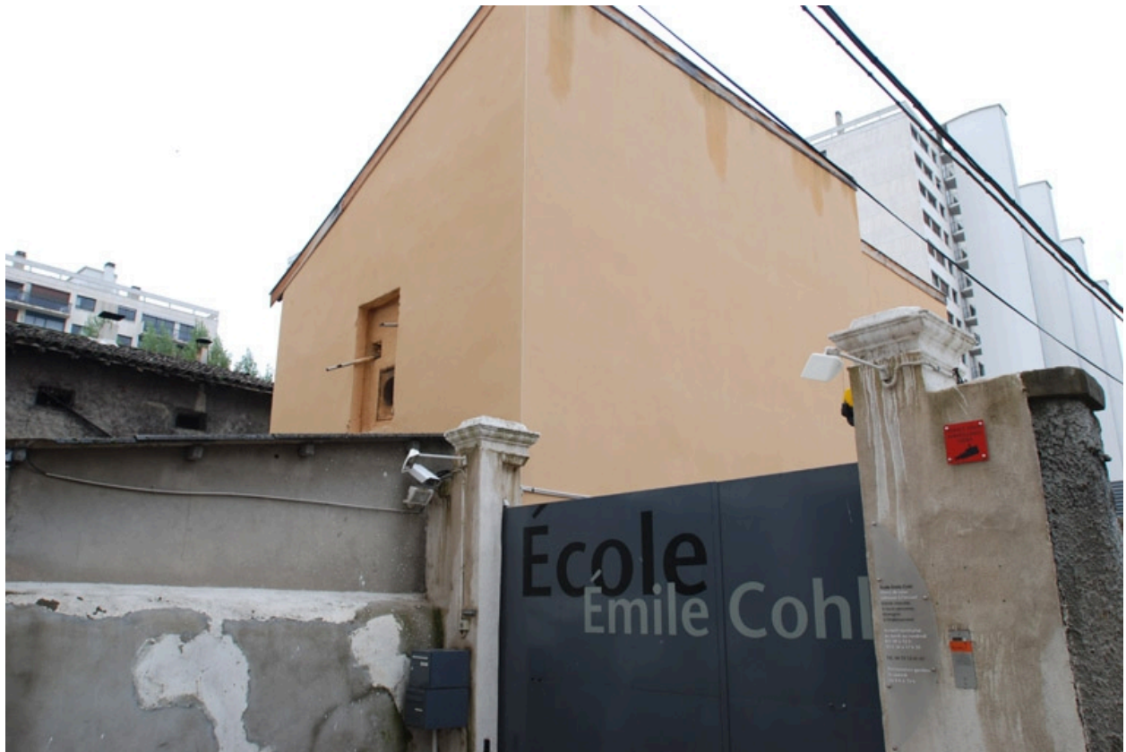
Vue nord ouest