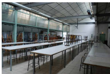
Salle de classe IVR82_20096901561NUCA