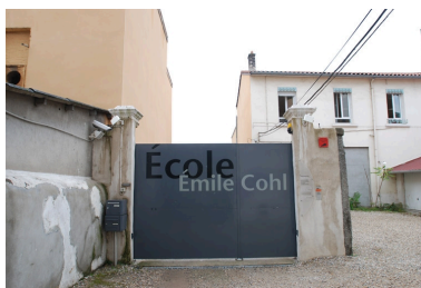
Entrée principale avec enseigne : Ecole Emile Cohl IVR82_20096901578NUCA