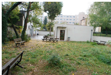
Vue nord (jardin) IVR82_20096901558NUCA