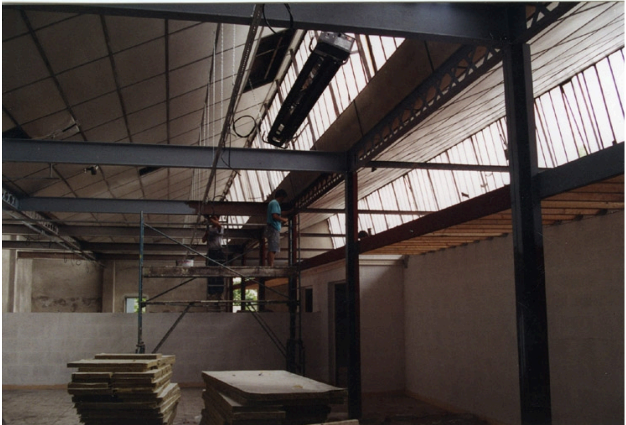
Travaux de réhabilitation du site en 1994. Ecole Emile Cohl Archives privées. Ecole Emile Cohl