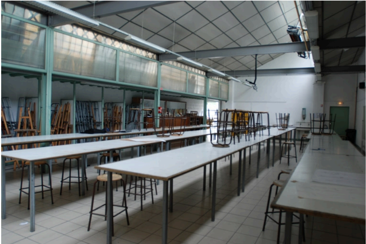
Salle de classe