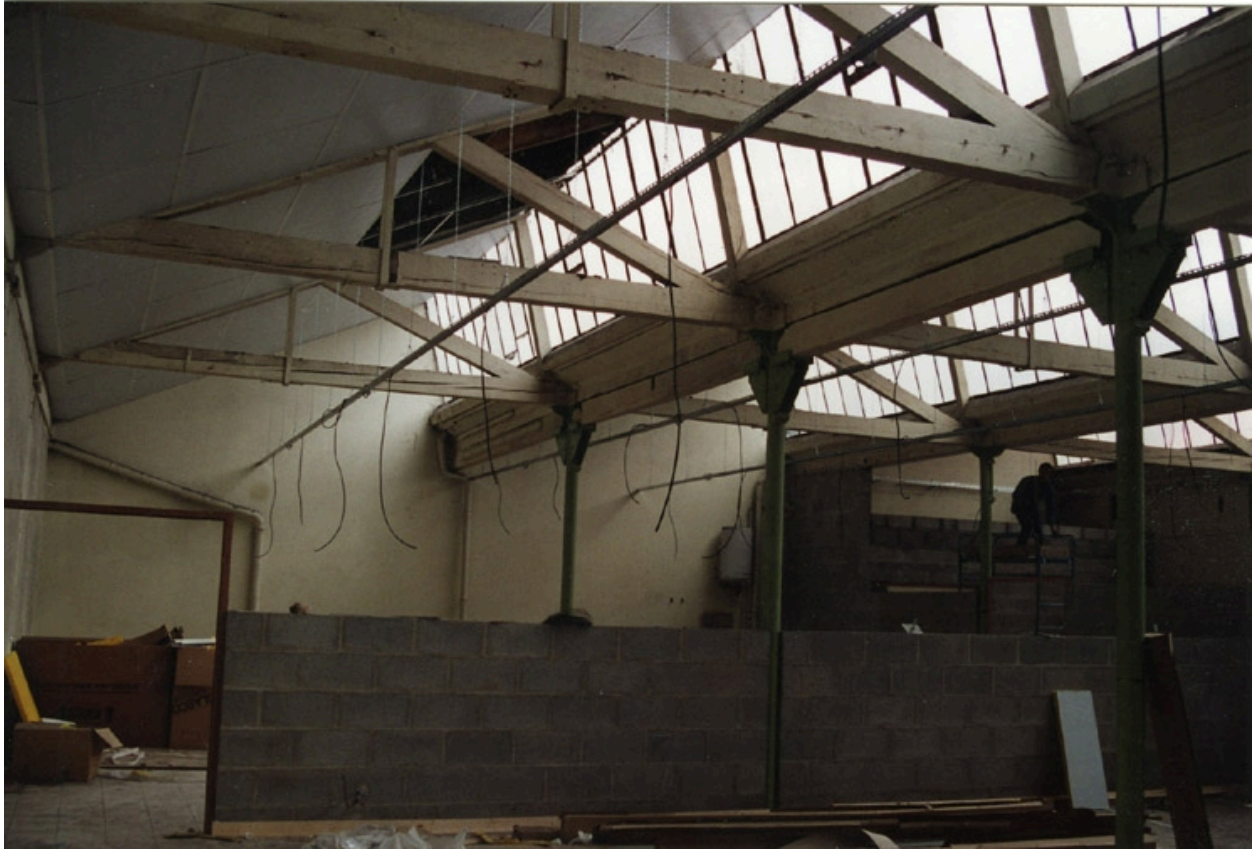
Etat avant réhabilitation : charpente en bois, poteaux fonte, 1994. Ecole Emile Cohl Archives privées. Ecole Emile Cohl