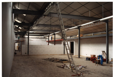
Etat au moment de la réhabilitation en 1994. IVR82_20096901546NUCAB