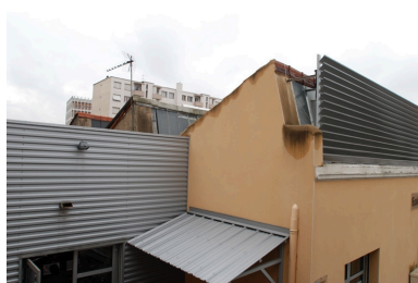
Toit shed