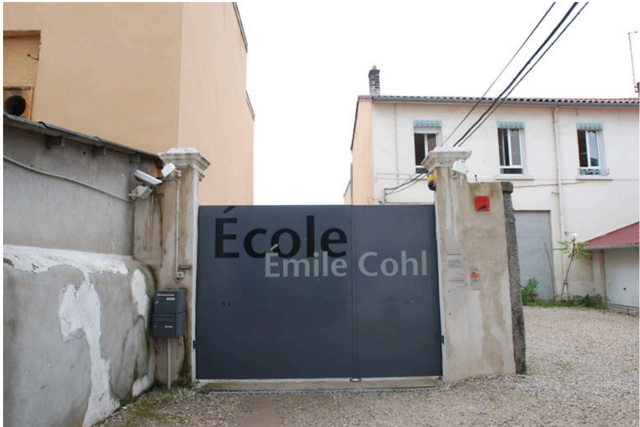
Entrée principale avec enseigne : Ecole Emile Cohl