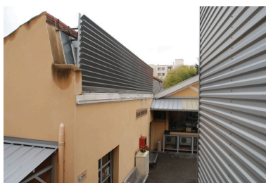
Aménagement des sheds