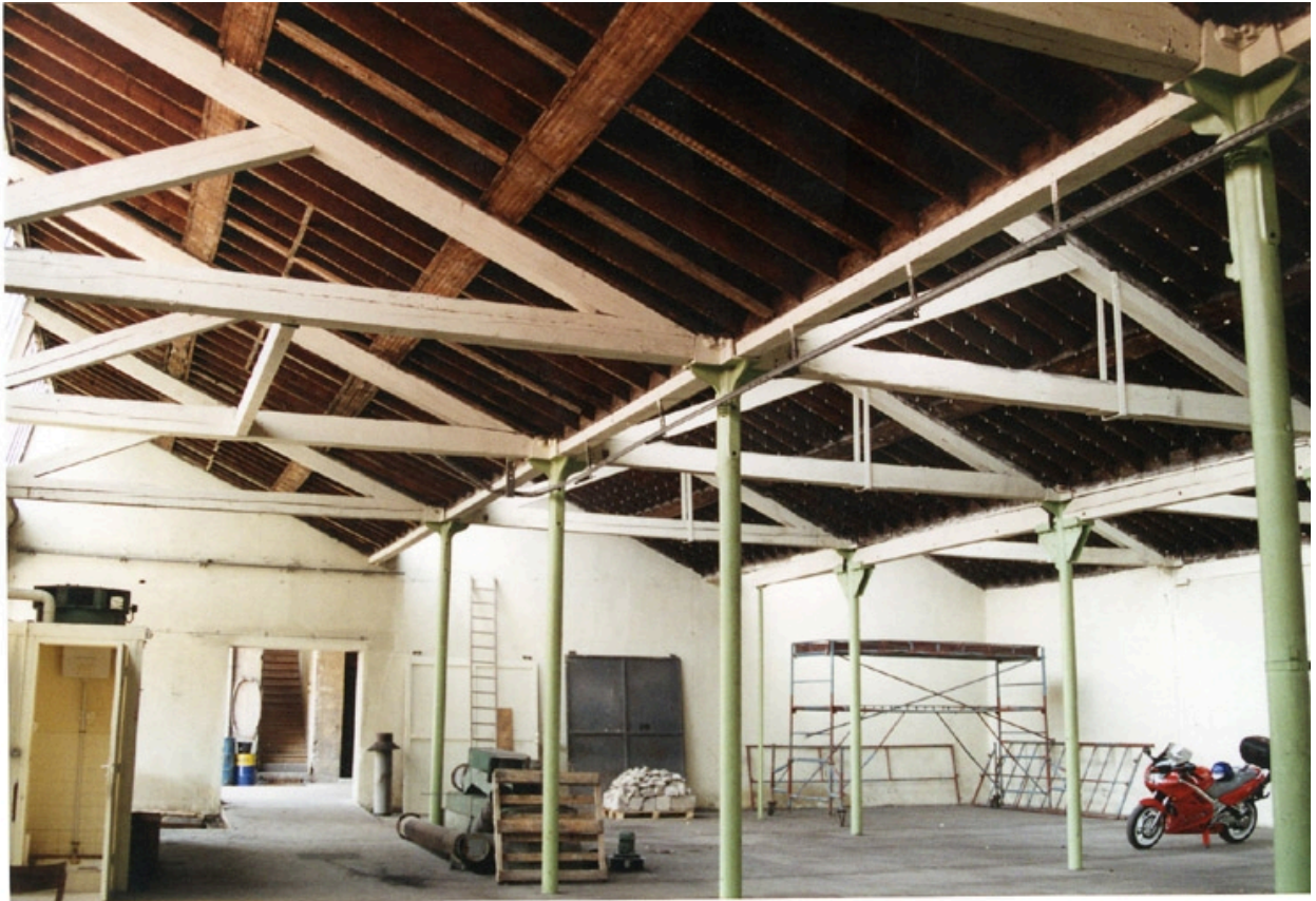
Chantier en 1994 : réhabilitation du site. Ecole Emile Cohl Archives privées. Ecole Emile Cohl