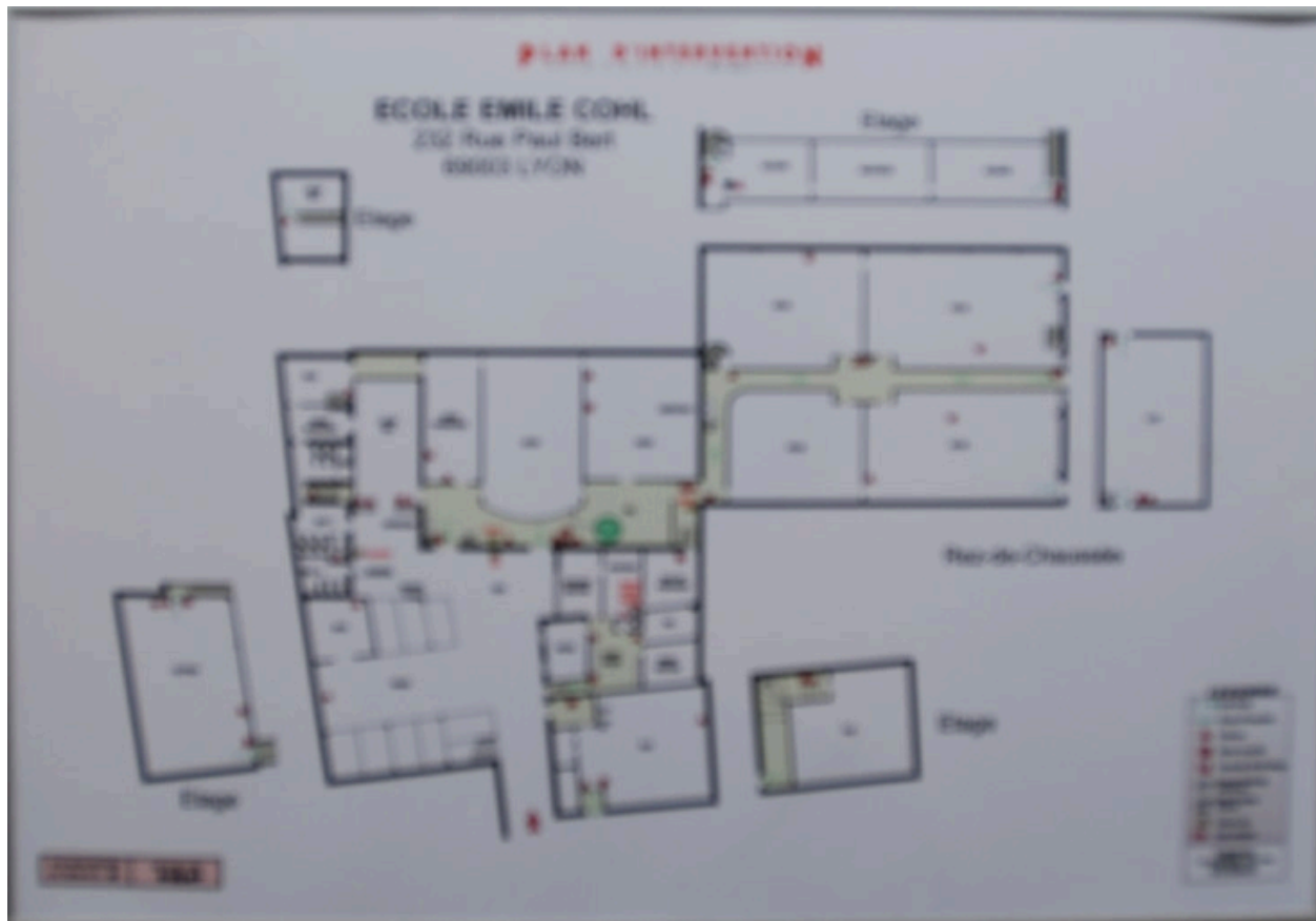
Plan du site