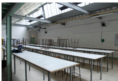
Salle de classe IVR82_20096901562NUCA