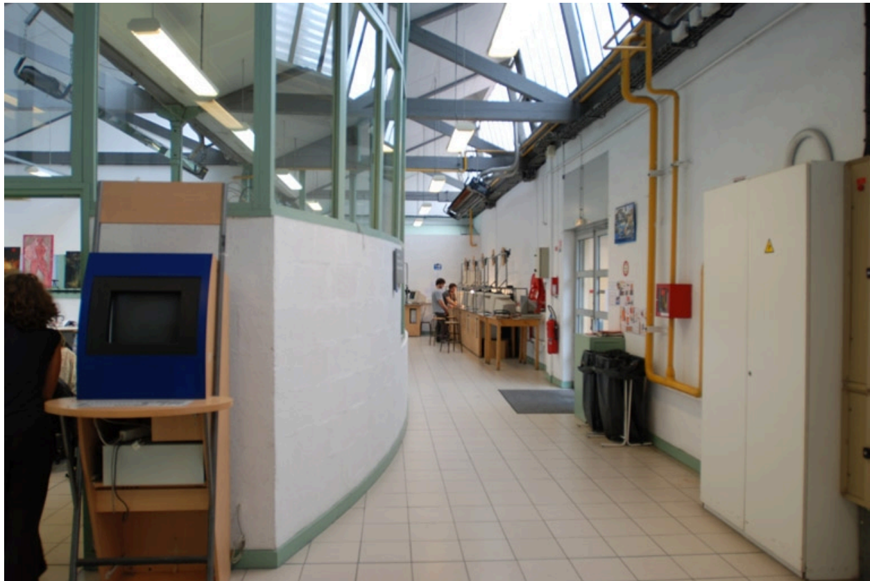
Espace de distribution