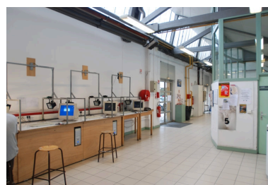
Aménagement des lieux IVR82_20096901566NUCA