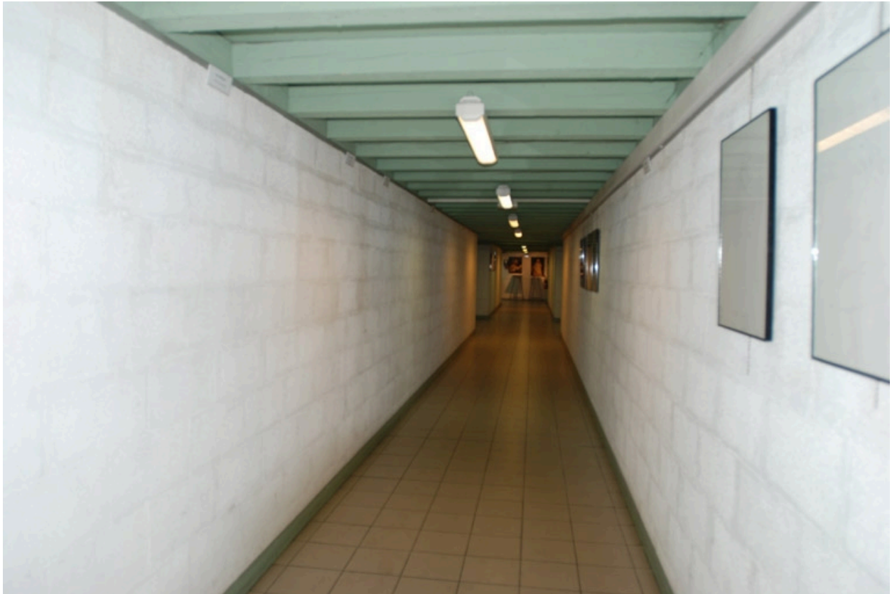
Vue intérieure de l'école, distribution