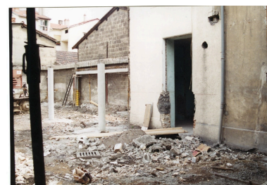
Etat en 1994 au moment de la réhabilitation.