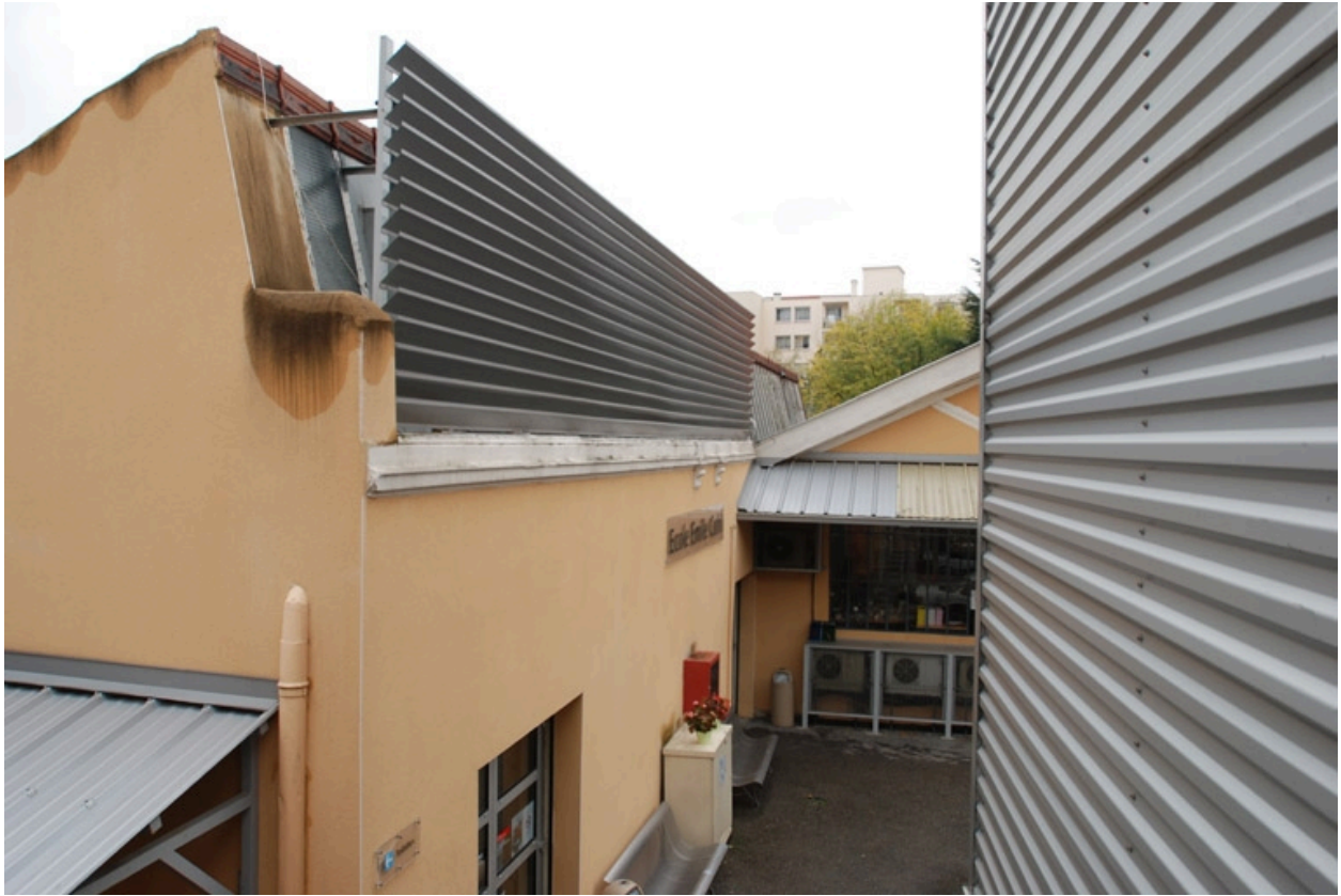
Aménagement des sheds