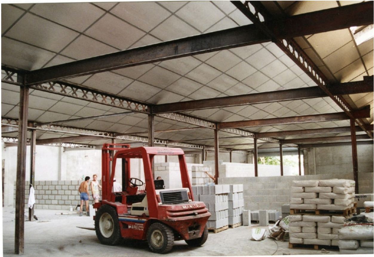
Etat au moment de la réhabilitation en 1994 : structure métallique conservée.