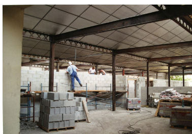
Travaux au moment de la réhabilitation du site 1994. IVR82_20096901541NUCAB