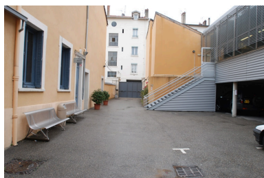
Vue d'ensemble sud IVR82_20096901571NUCA