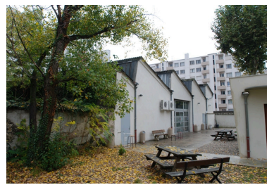
Vue ouest du site IVR82_20096901557NUCA