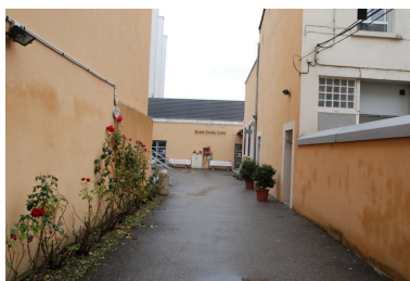
Vue d'ensemble nord IVR82_20096901572NUCA