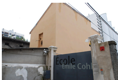
Vue nord ouest IVR82_20096901580NUCA