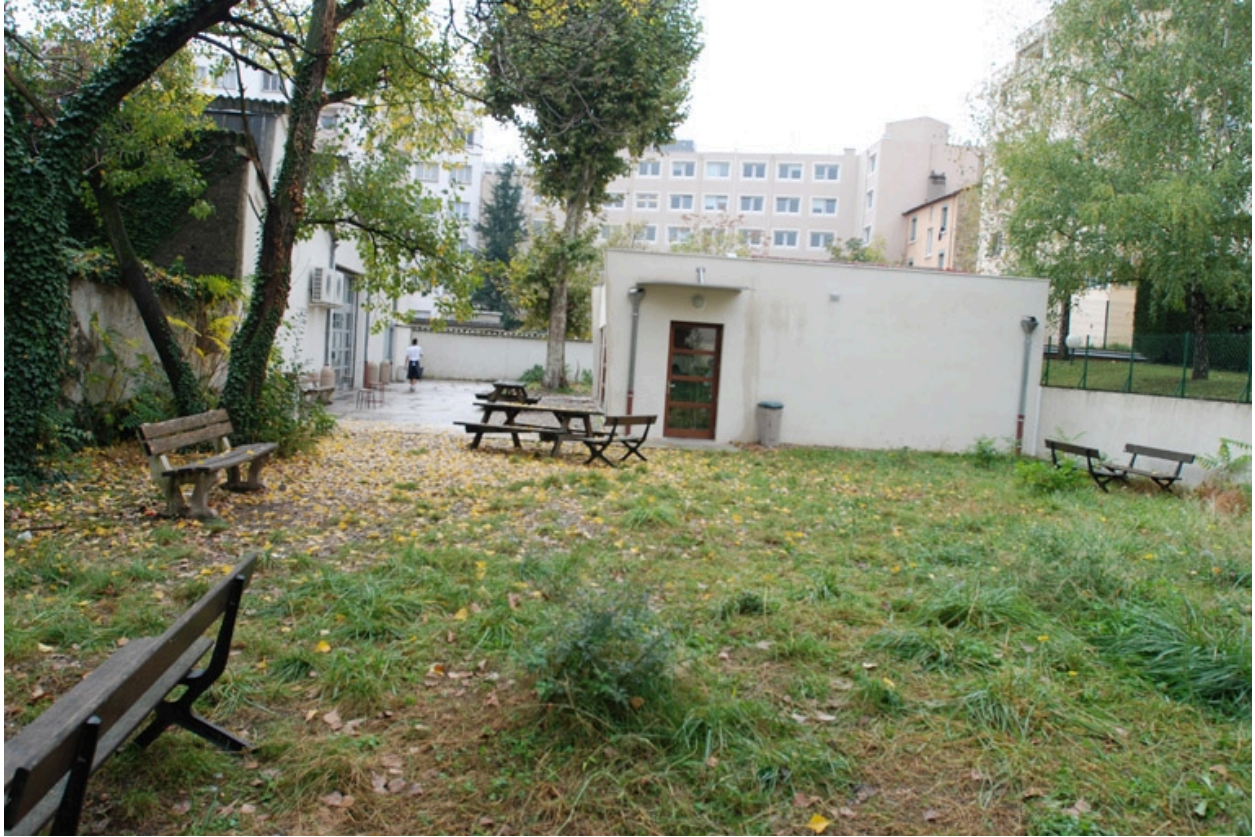
Vue nord (jardin)