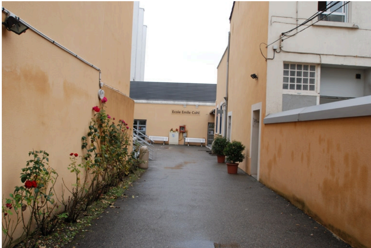
Vue d'ensemble nord