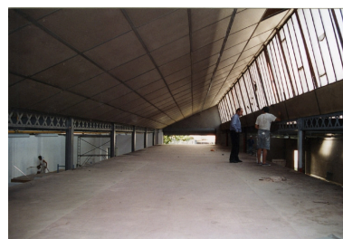
Chantier : réhabilitation en 1994. IVR82_20096901554NUCAB