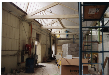
Etat au moment de la réhabilitation en 1994 : charpente en bois. IVR82_20096901547NUCAB