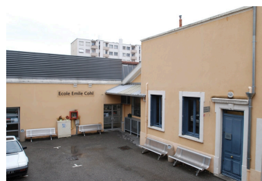
Vue nord-est