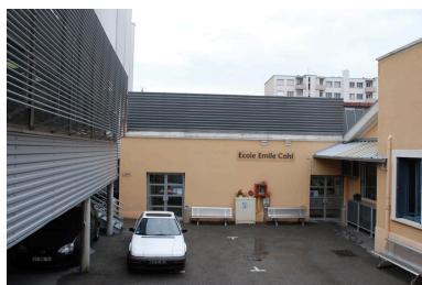
Vue d'ensemble nord IVR82_20096901577NUCA