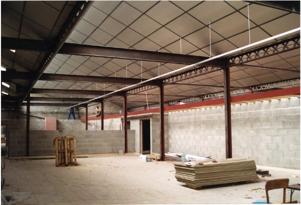
Travaux en 1994 : réhabilitation. Ecole Emile Cohl Archives privées. Ecole Emile Cohl