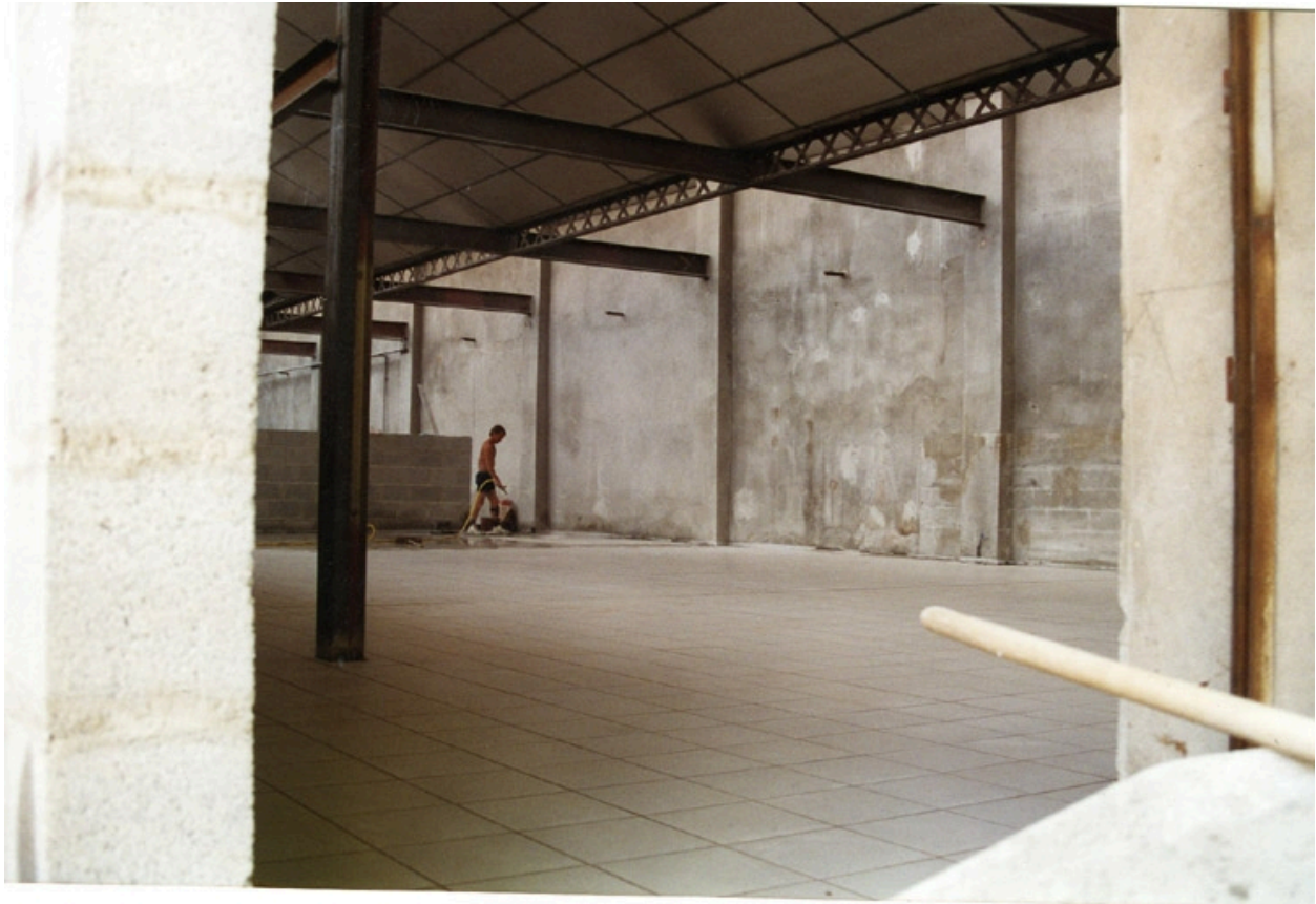
Chantier : réhabilitation en 1994. Ecole Emile Cohl