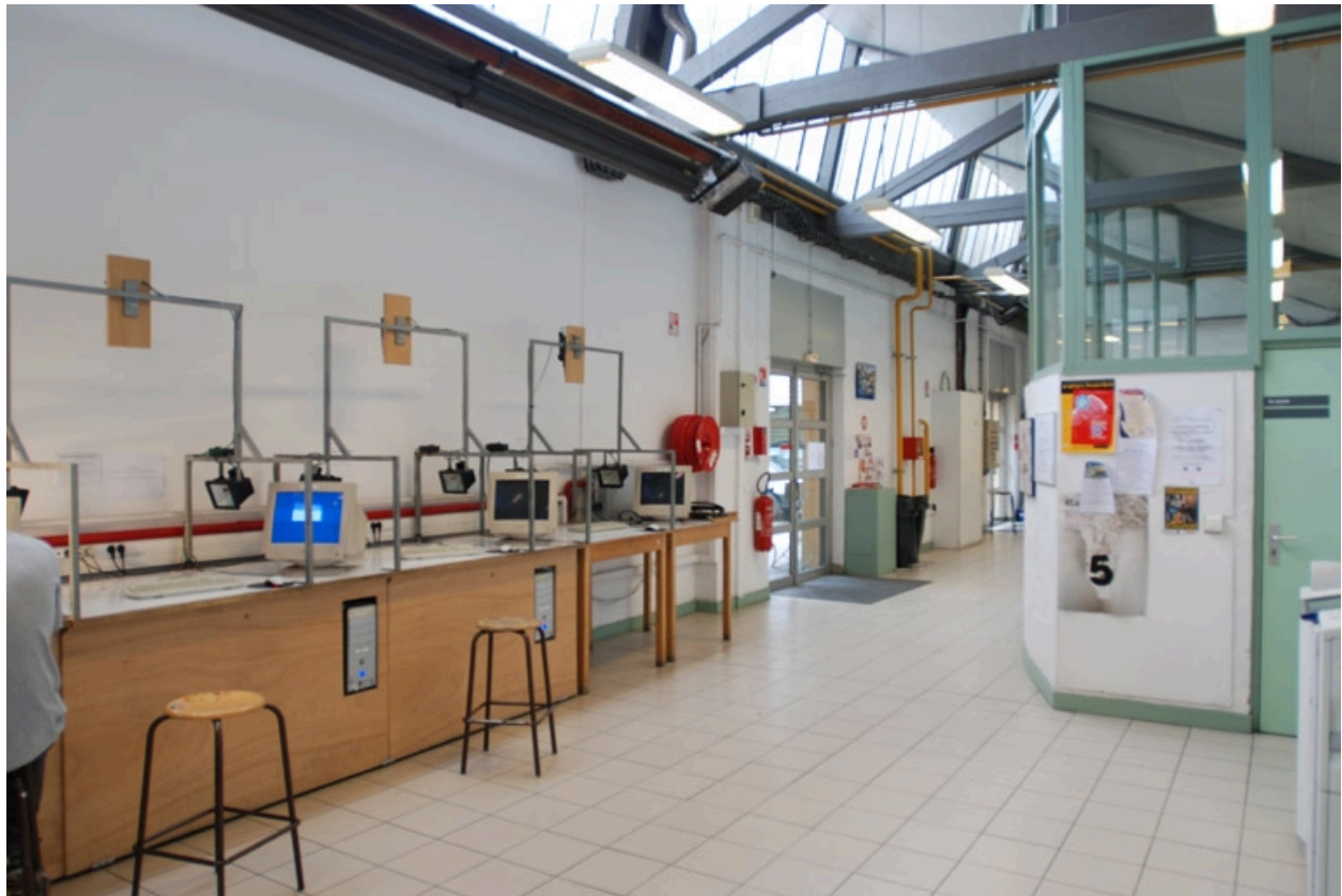
Aménagement des lieux