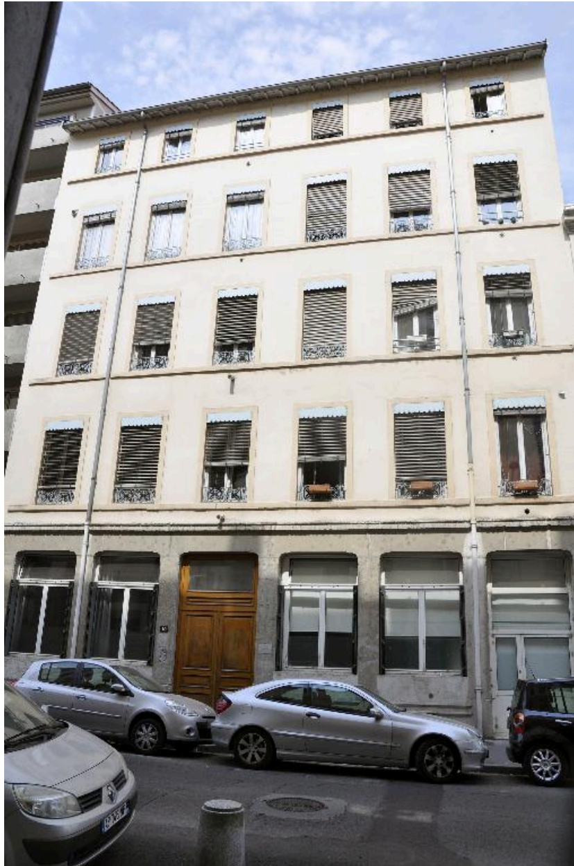
Vue générale de l'élévation sur rue