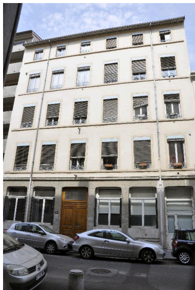
Vue générale de l'élévation sur rue IVR82_20146902691NUCA