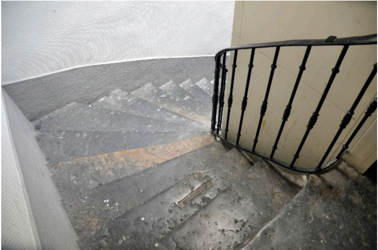
Vue partielle de l'escalier