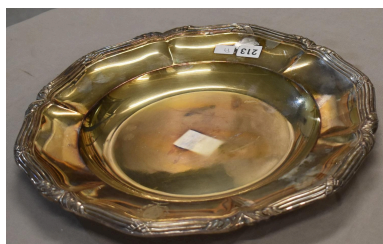
Vue générale IVR84_20226302853NUC4A