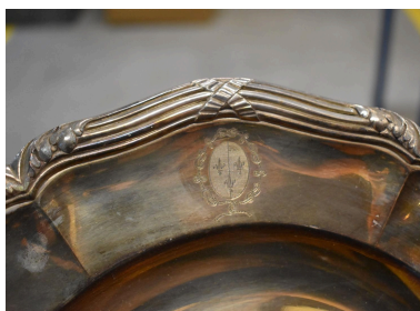
Détail IVR84_20226302854NUC4A