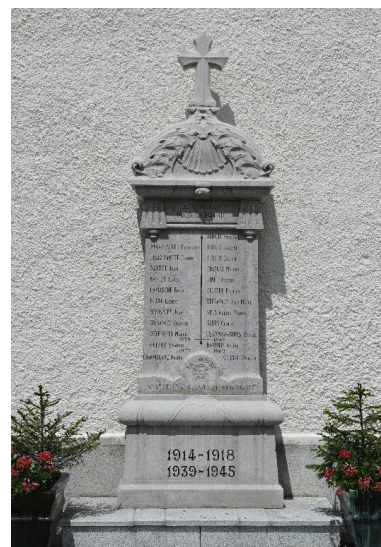
Vue d'ensemble du monument aux morts. IVR82_20137302028NUCA