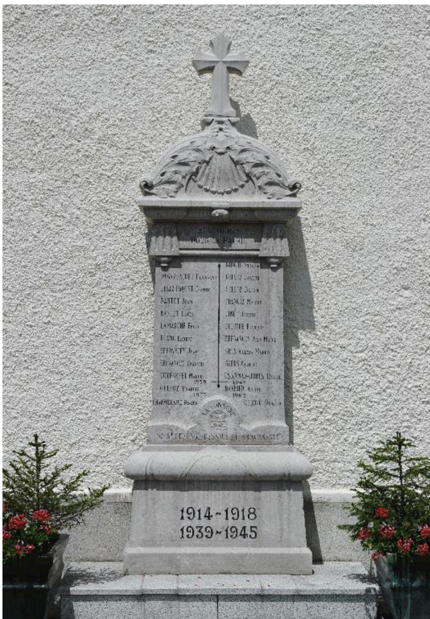
Vue d'ensemble du monument aux morts.