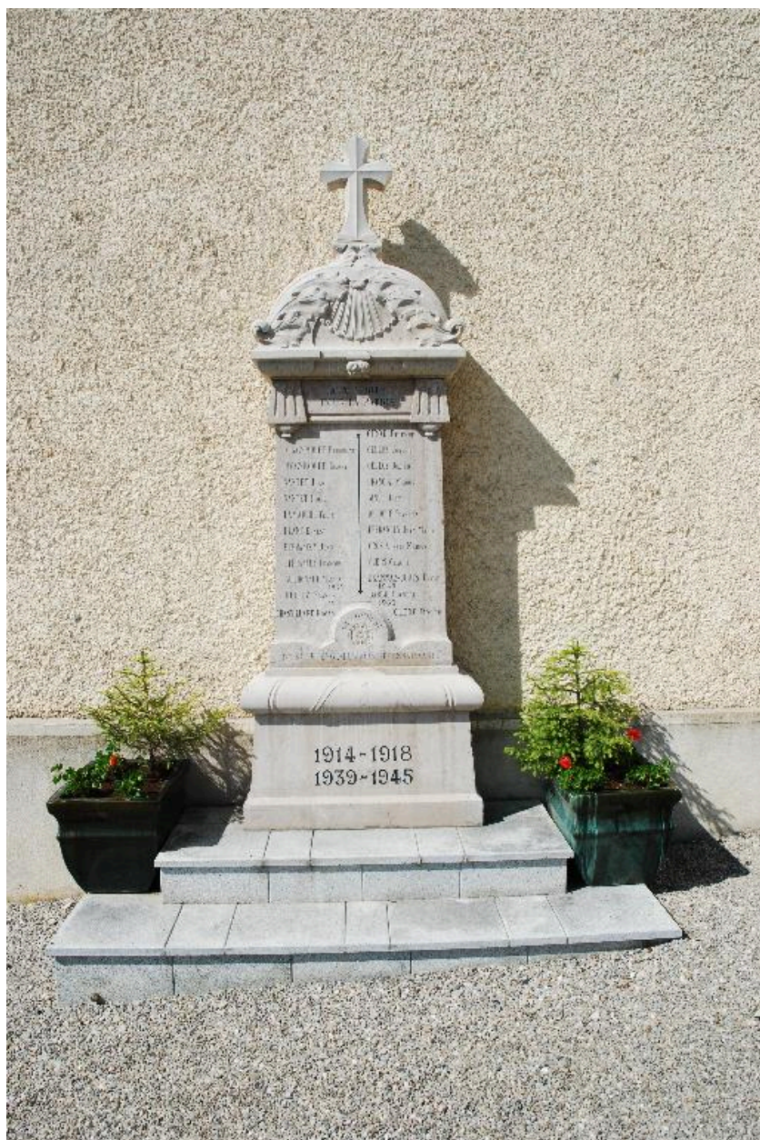
Vue générale du monument aux morts.