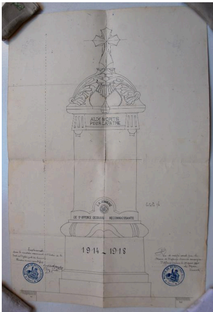
Plan du monument aux morts, architecte Pégaz Victor, 1919 (?).