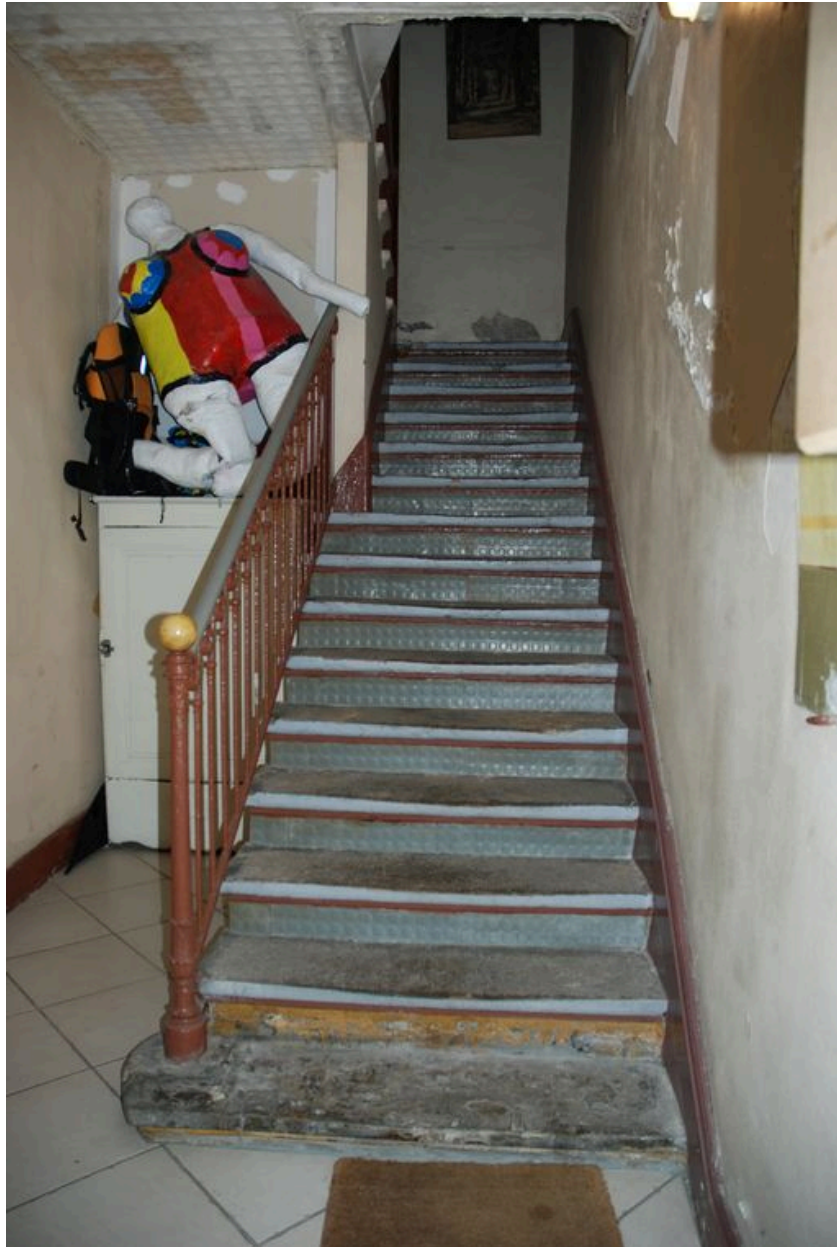
Vue de l'escalier d'accès au premier étage.