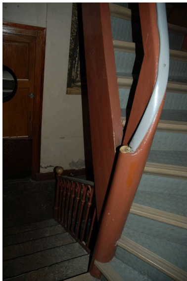
Vue prise du palier du premier étage. IVR82_20116903094NUCA