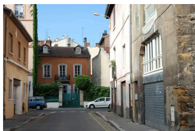
Vue générale, dans la perspective de la rue Mazagran.