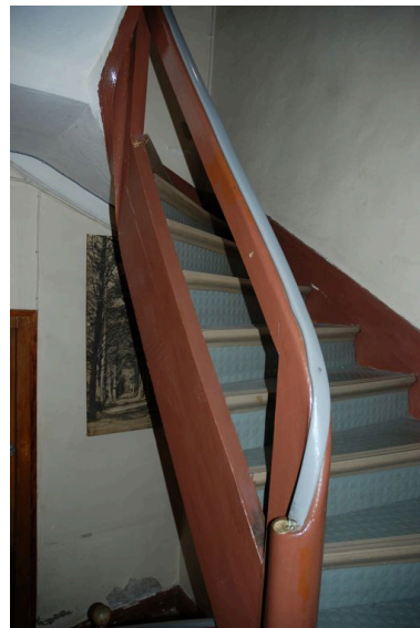
Vue de l'escalier menant à l'étage de combles. IVR82_20116903095NUCA