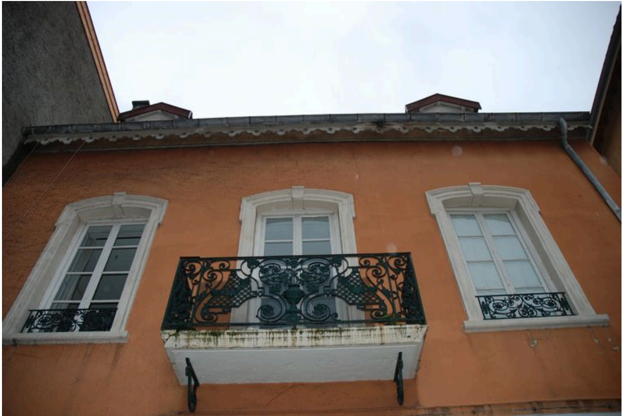
Détail de la travée centrale et du garde-corps du balcon.