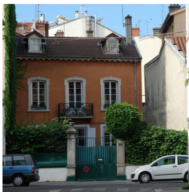
Vue générale. IVR82_20126901089NUCA