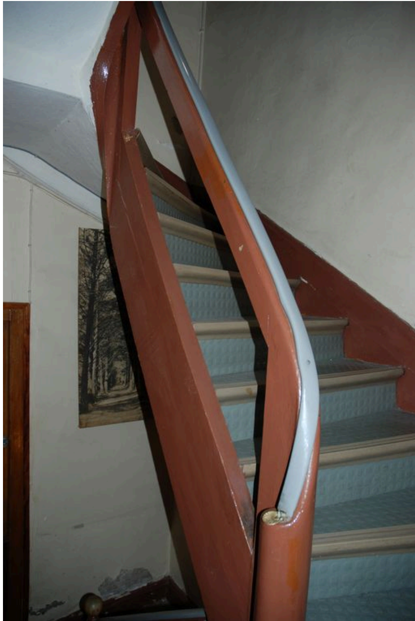
Vue de l'escalier menant à l'étage de combles.