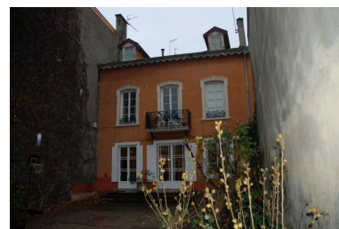
Vue générale depuis la cour. IVR82_20116903089NUCA