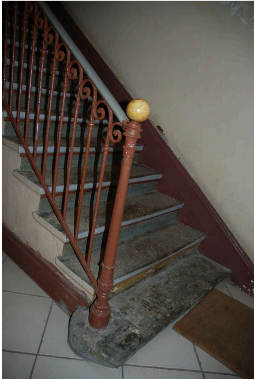
Détail de la rampe de l'escalier d'accès au premier étage.