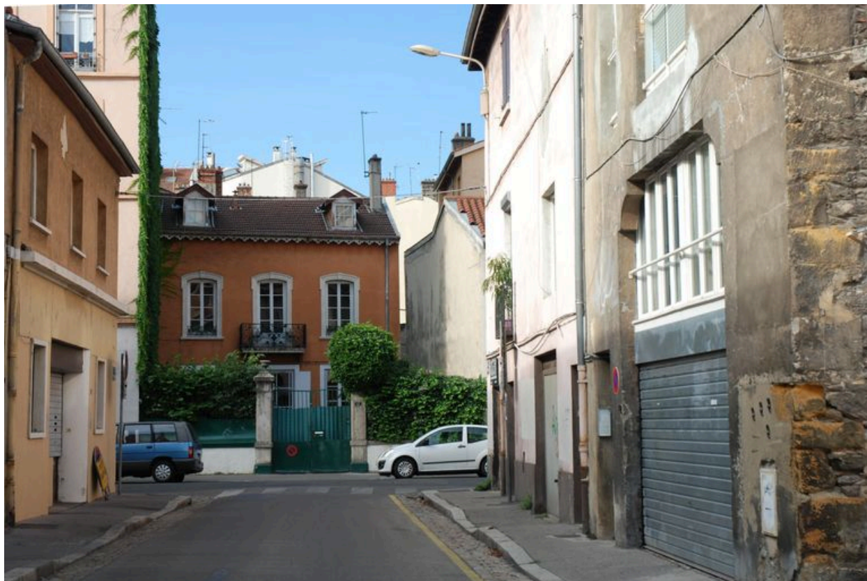
Vue générale, dans la perspective de la rue Mazagran.