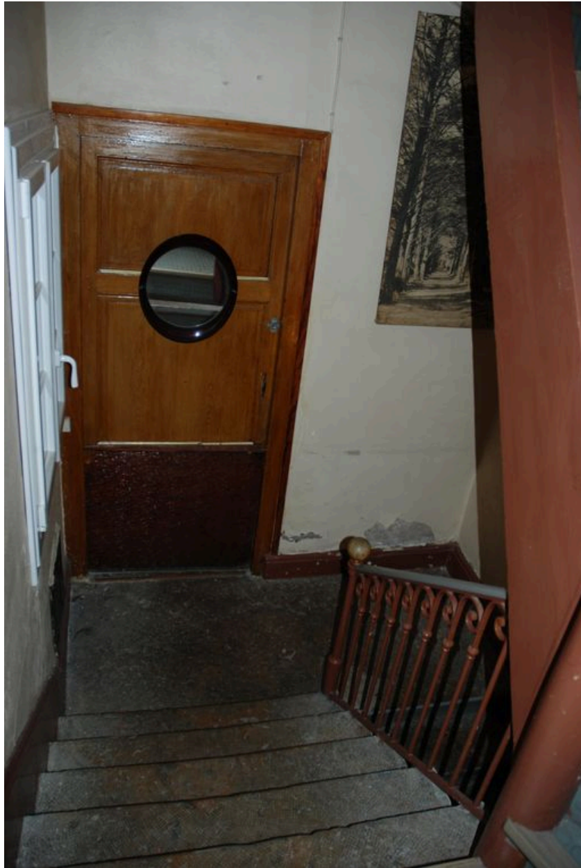
Vue du palier situé entre le rez-de-chaussée et le premier étage.