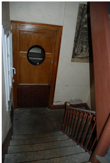
Vue du palier situé entre le rez- de-chaussée et le premier étage. IVR82_20116903093NUCA