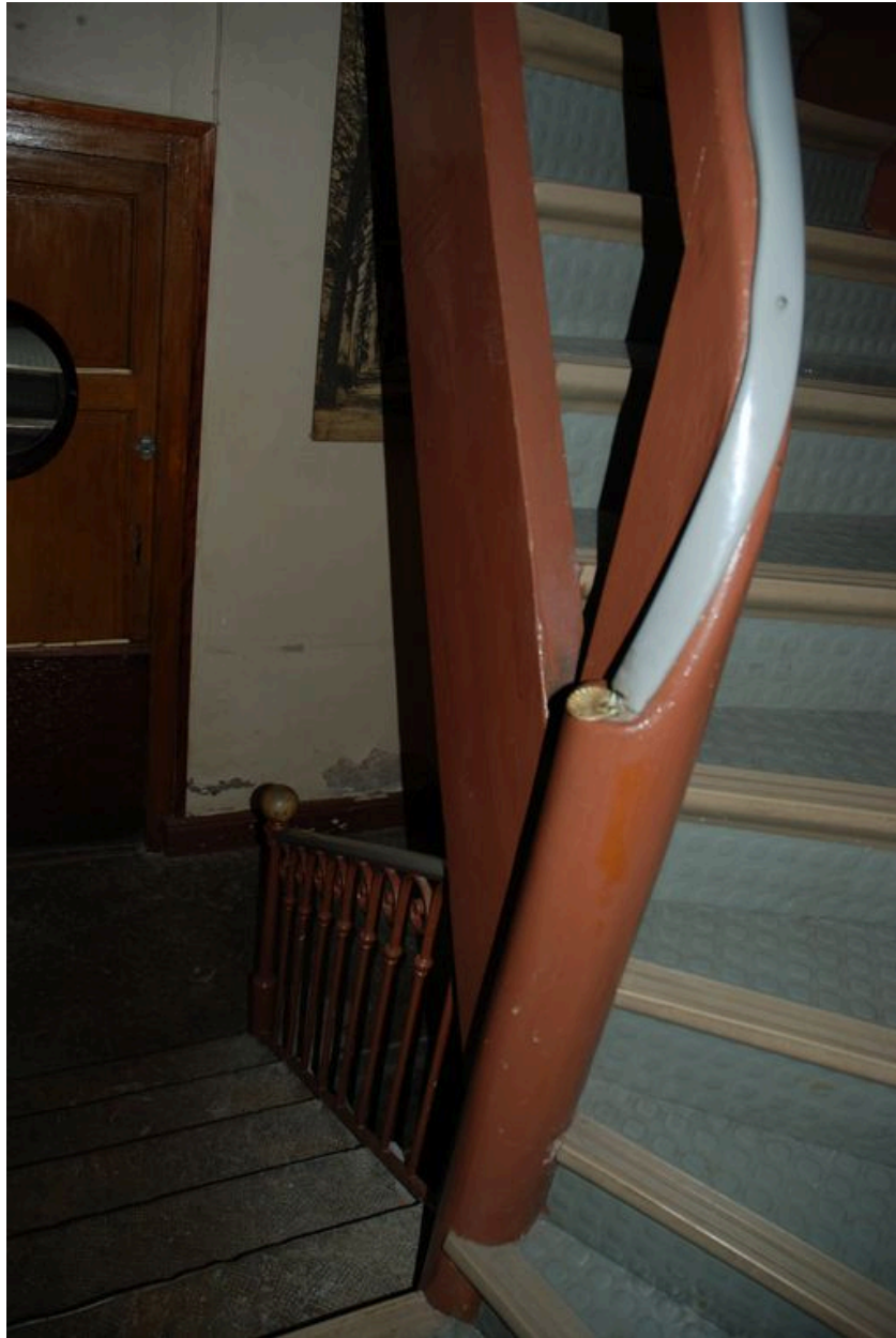
Vue prise du palier du premier étage.