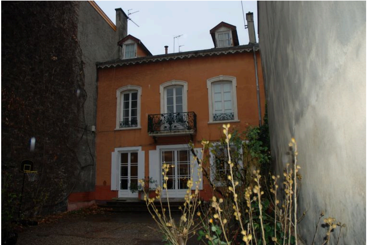
Vue générale depuis la cour.