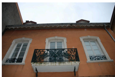
Détail de la travée centrale et du garde-corps du balcon.