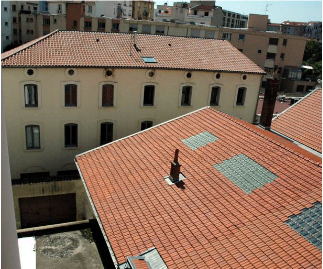
Vue générale depuis l'ouest