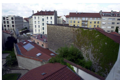
Elévation postérieure IVR82_20076902041NUCA