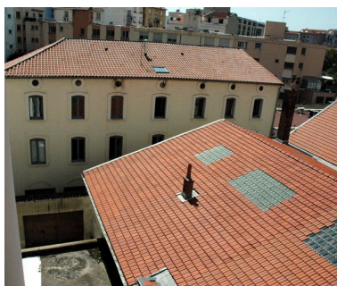
Vue générale depuis l'ouest IVR82_20076902037NUCA