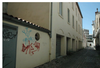
Vue d'ensemble depuis le nord IVR82_20076902038NUCA