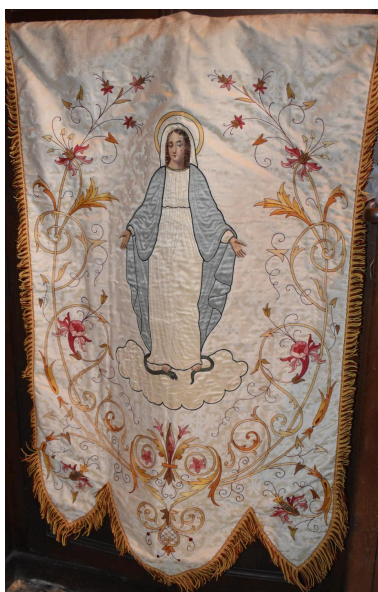
bannière de procession