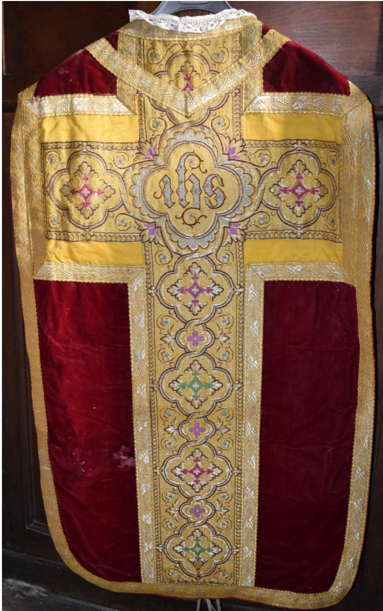
chasuble : ornement rouge, vue du dos