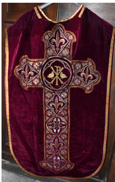
chasuble : ornement rouge n°3, vue du dos IVR84_20250300142NUCA