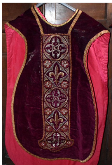
chasuble : ornement rouge n°3