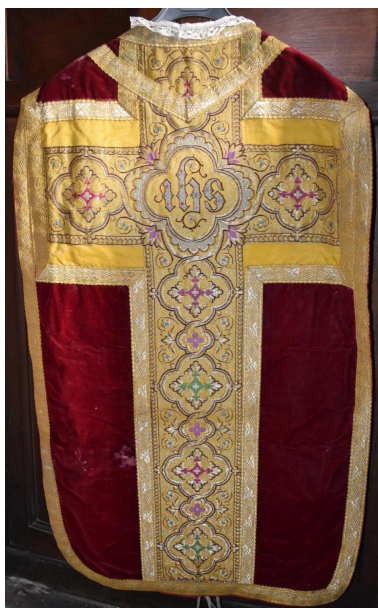
chasuble : ornement rouge, vue du dos IVR84_20250300139NUCA