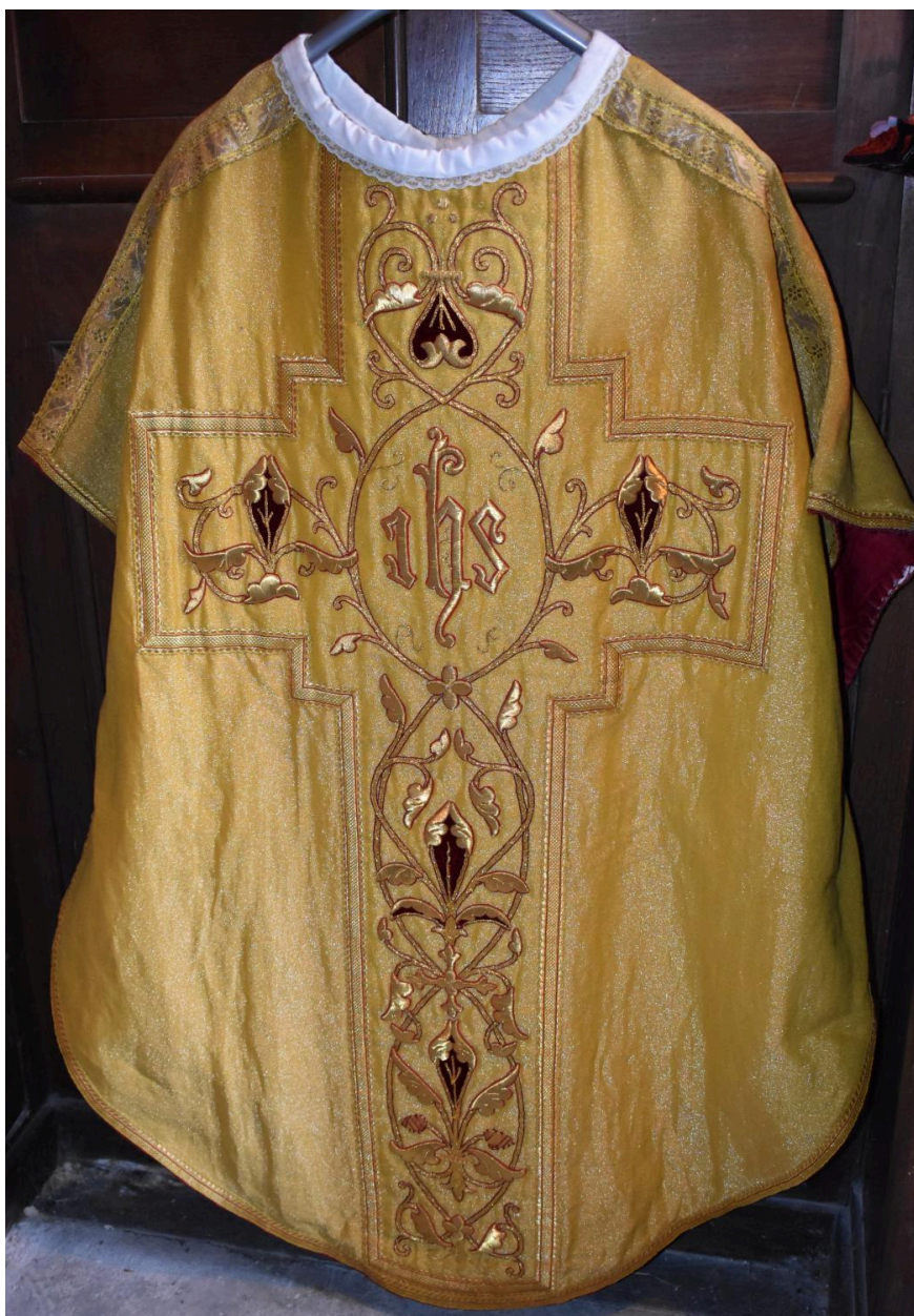
chasuble : ornement doré, vue du dos