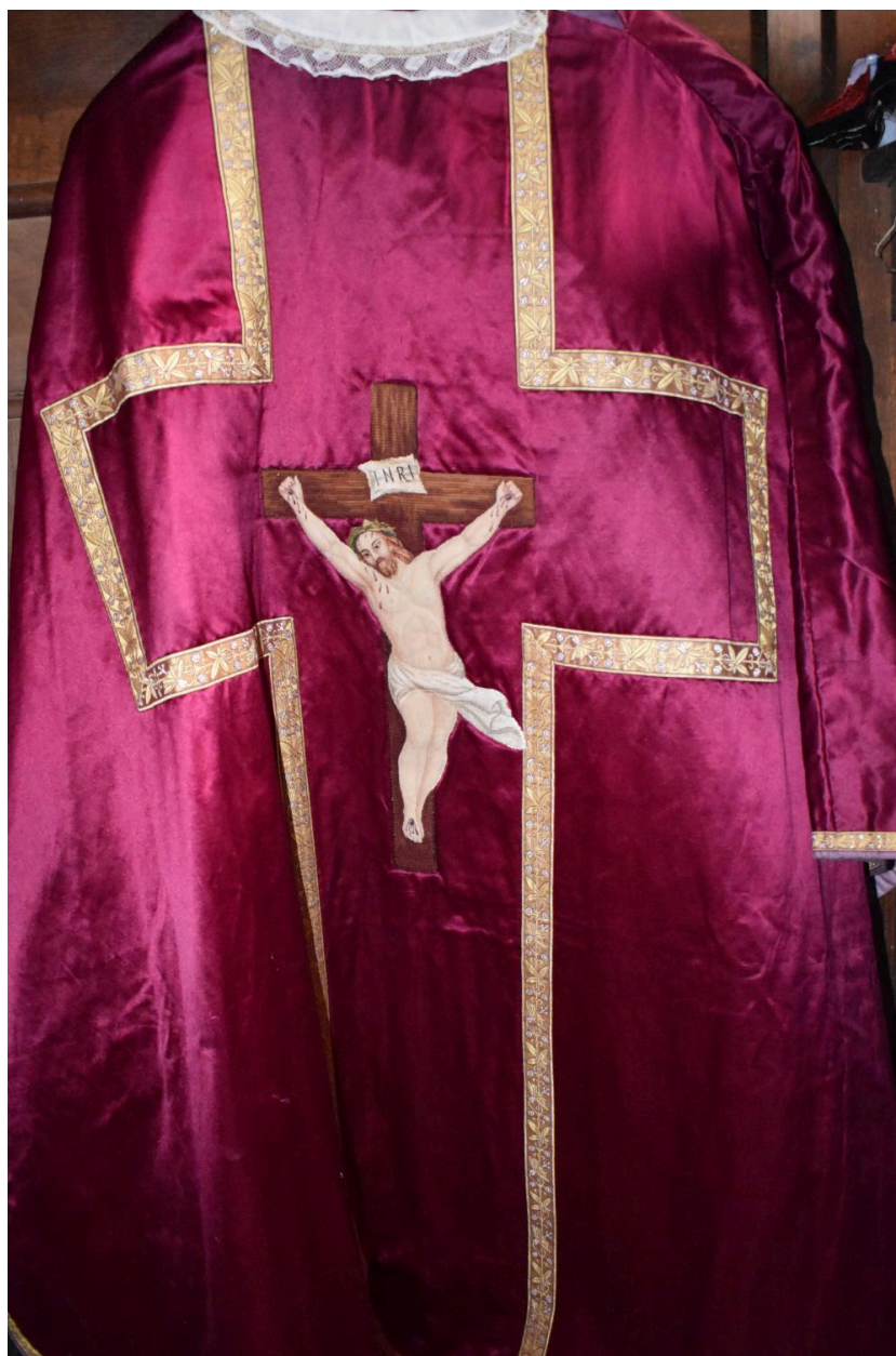
chasuble : ornement rouge n°2, vue du dos.