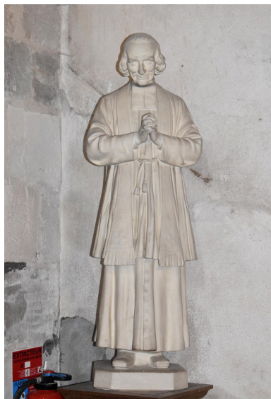
statue du saint Curé d'Ars IVR84_20250300190NUCA