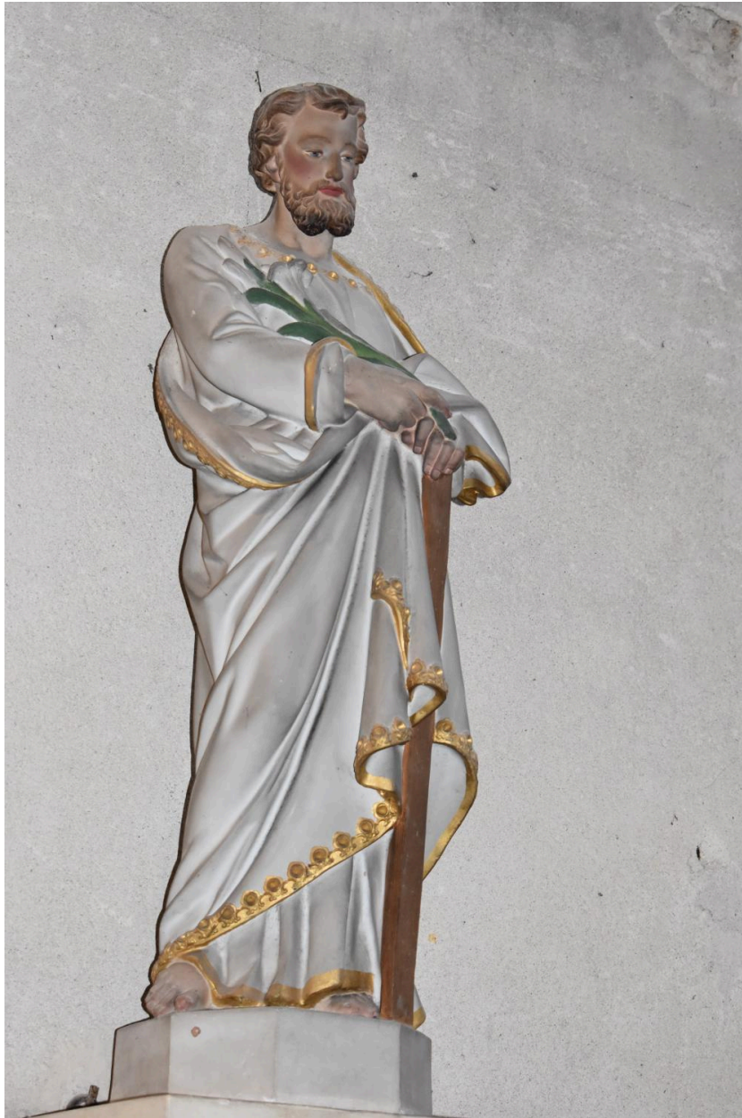
Statue de saint Joseph