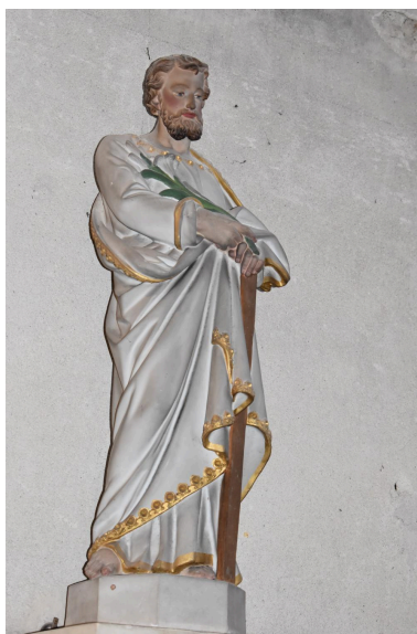
Statue de saint Joseph IVR84_20250300191NUCA