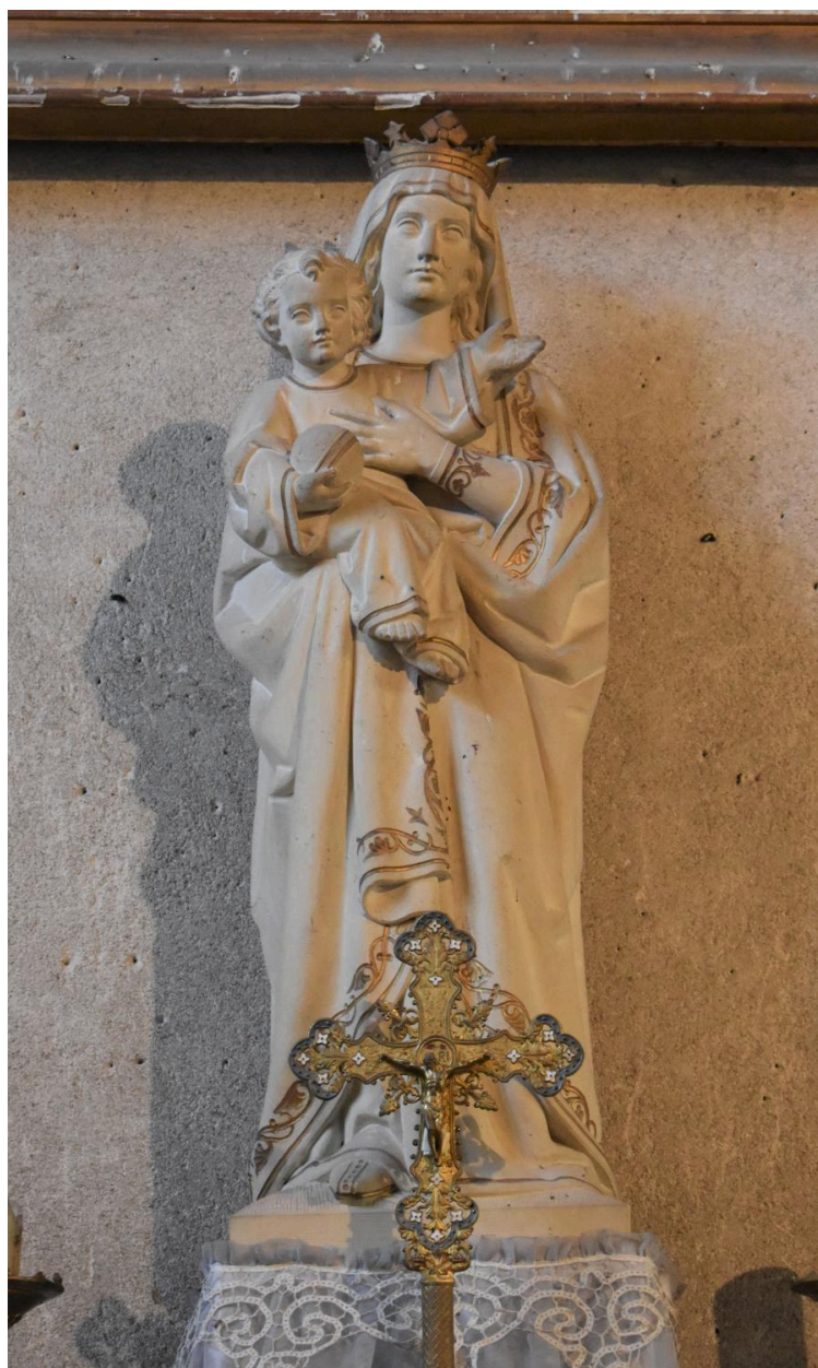
Statue : Vierge à l'Enfant