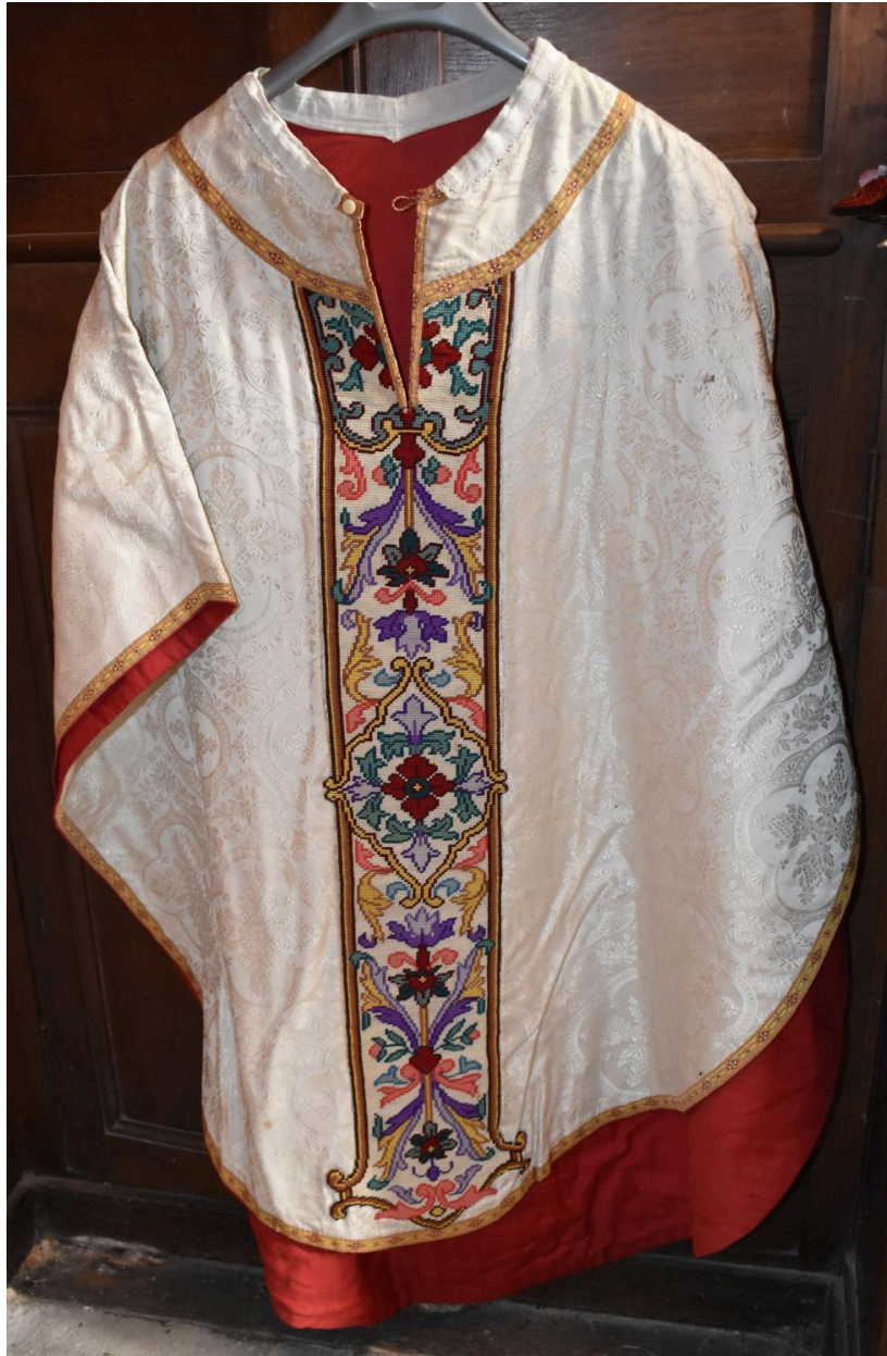
chasuble : ornement blanc