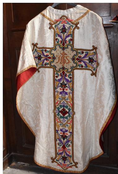
chasuble : ornement blanc IVR84_20250300146NUCA