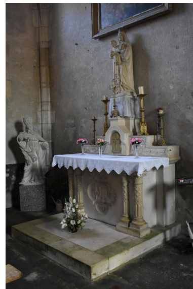
autel secondaire IVR84_20250300135NUCA