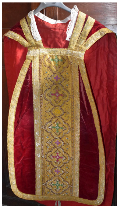
chasuble : ornement rouge, vue du devant.