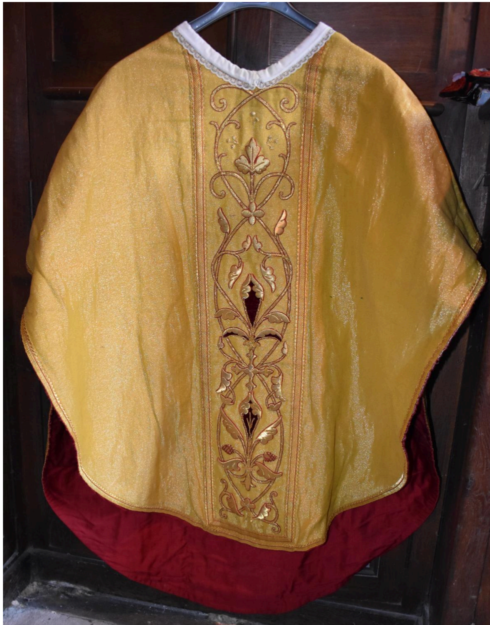
chasuble : ornement doré