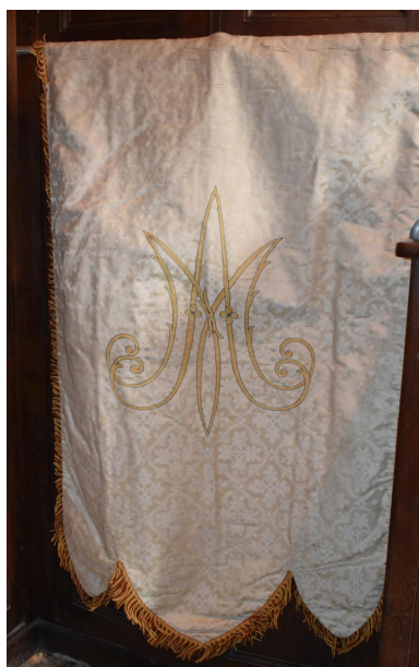
bannière de procession IVR84_20250300148NUCA

dalmatique : ornement noir IVR84_20250300150NUCA