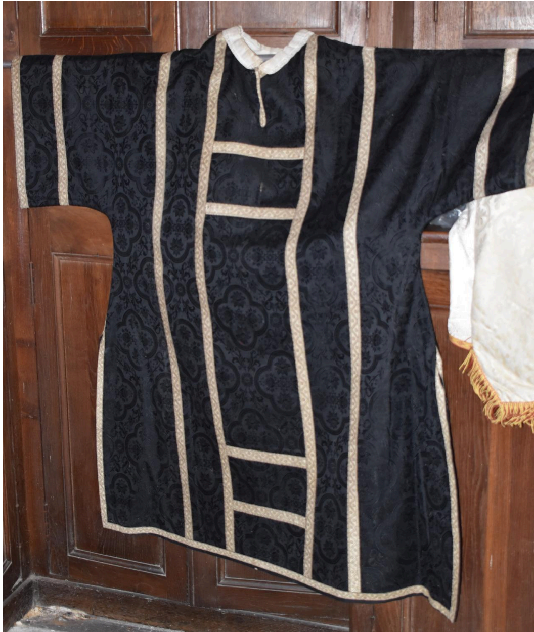
dalmatique : ornement noir