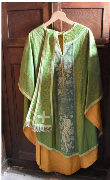
chasuble, étole : ornement vert IVR84_20250300136NUCA