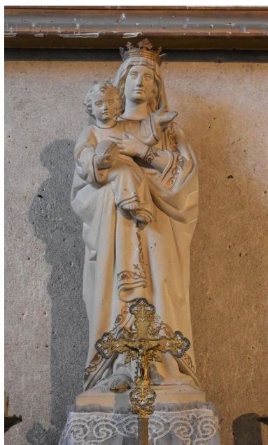
Statue : Vierge à l'Enfant IVR84_20250300192NUCA