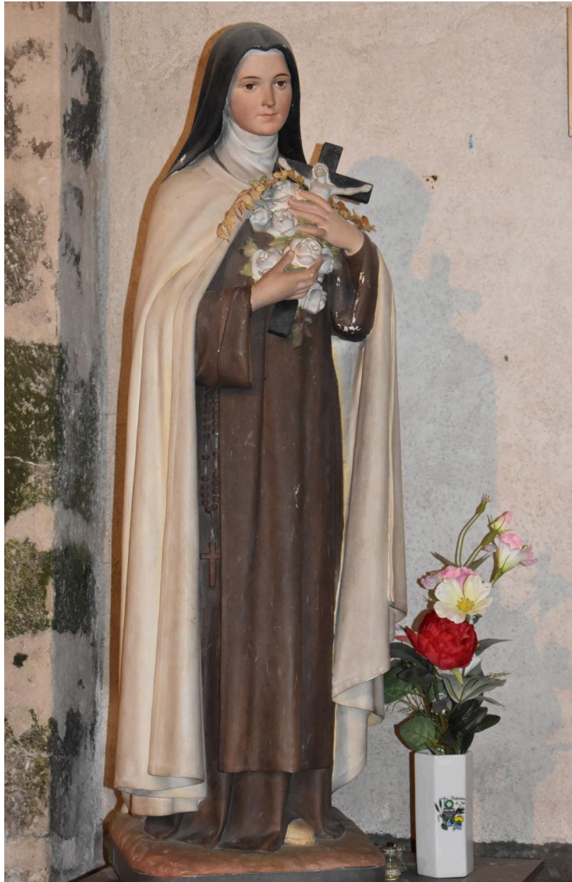
statue de sainte Thérèse de l'Enfant Jésus