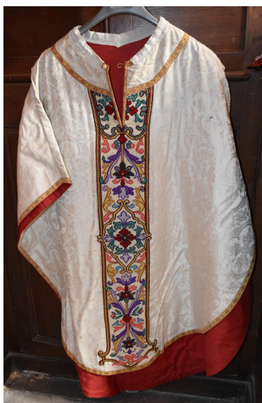
chasuble : ornement blanc IVR84_20250300145NUCA