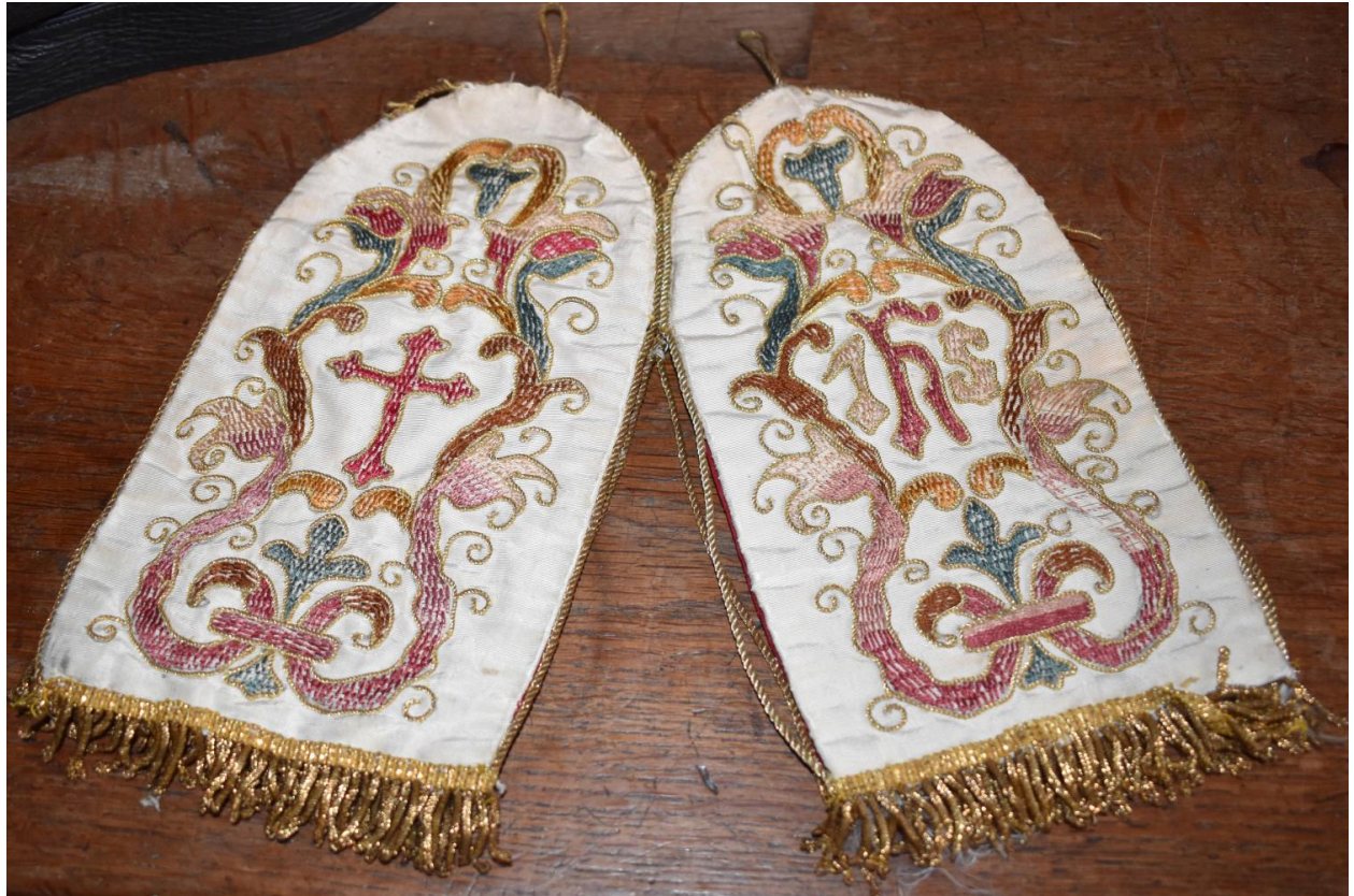
pavillon de ciboire