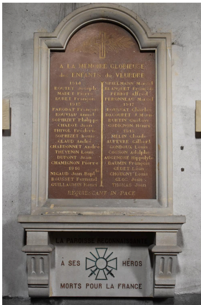
monument aux morts