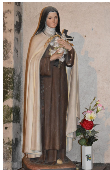
statue de sainte Thérèse de l'Enfant Jésus