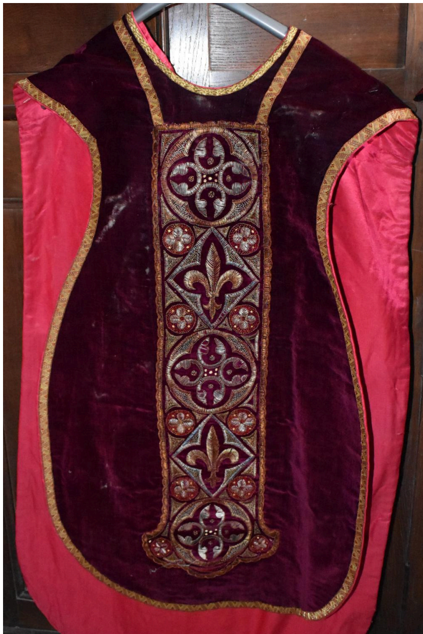
chasuble : ornement rouge n°3