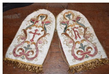
pavillon de ciboire IVR84_20250300151NUCA