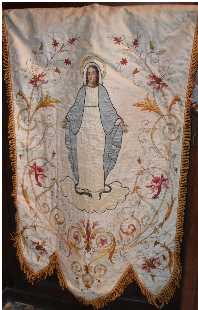
bannière de procession