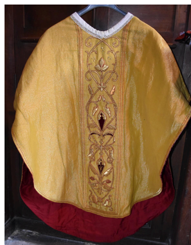
chasuble : ornement doré IVR84_20250300143NUCA