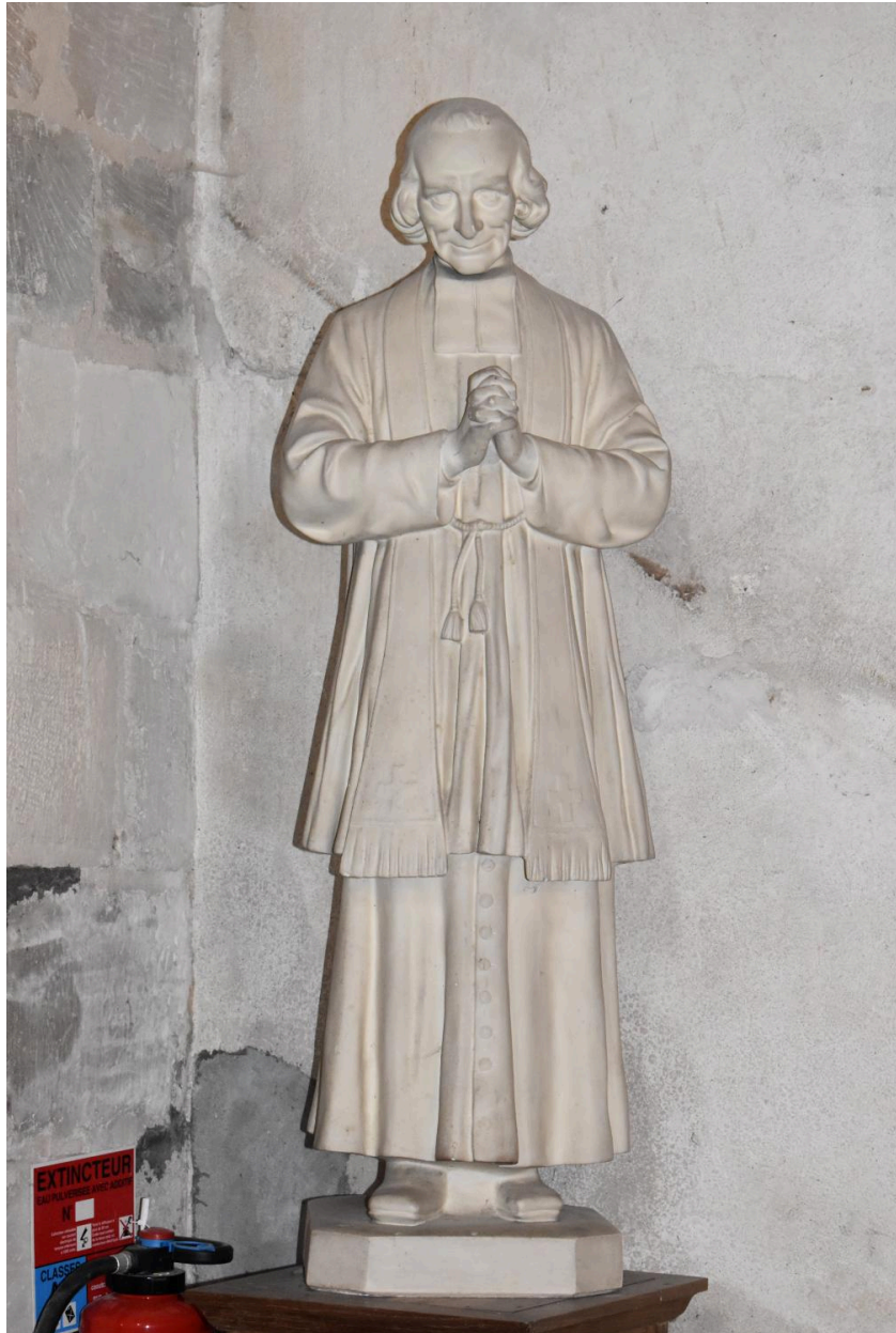
statue du saint Curé d'Ars