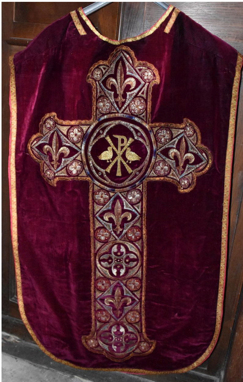
chasuble : ornement rouge n°3, vue du dos