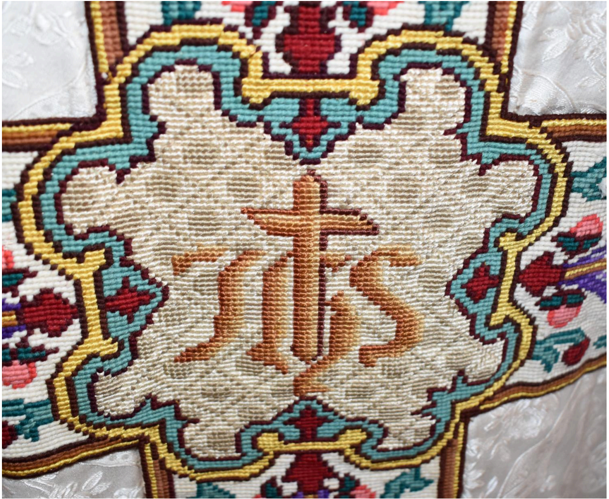
chasuble : ornement blanc