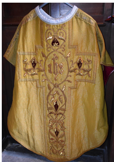
chasuble : ornement doré, vue du dos