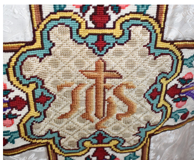
chasuble : ornement blanc IVR84_20250300147NUCA