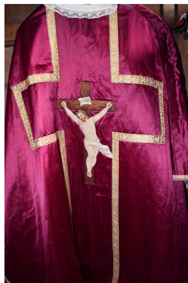
chasuble : ornement rouge n°2, vue du dos.