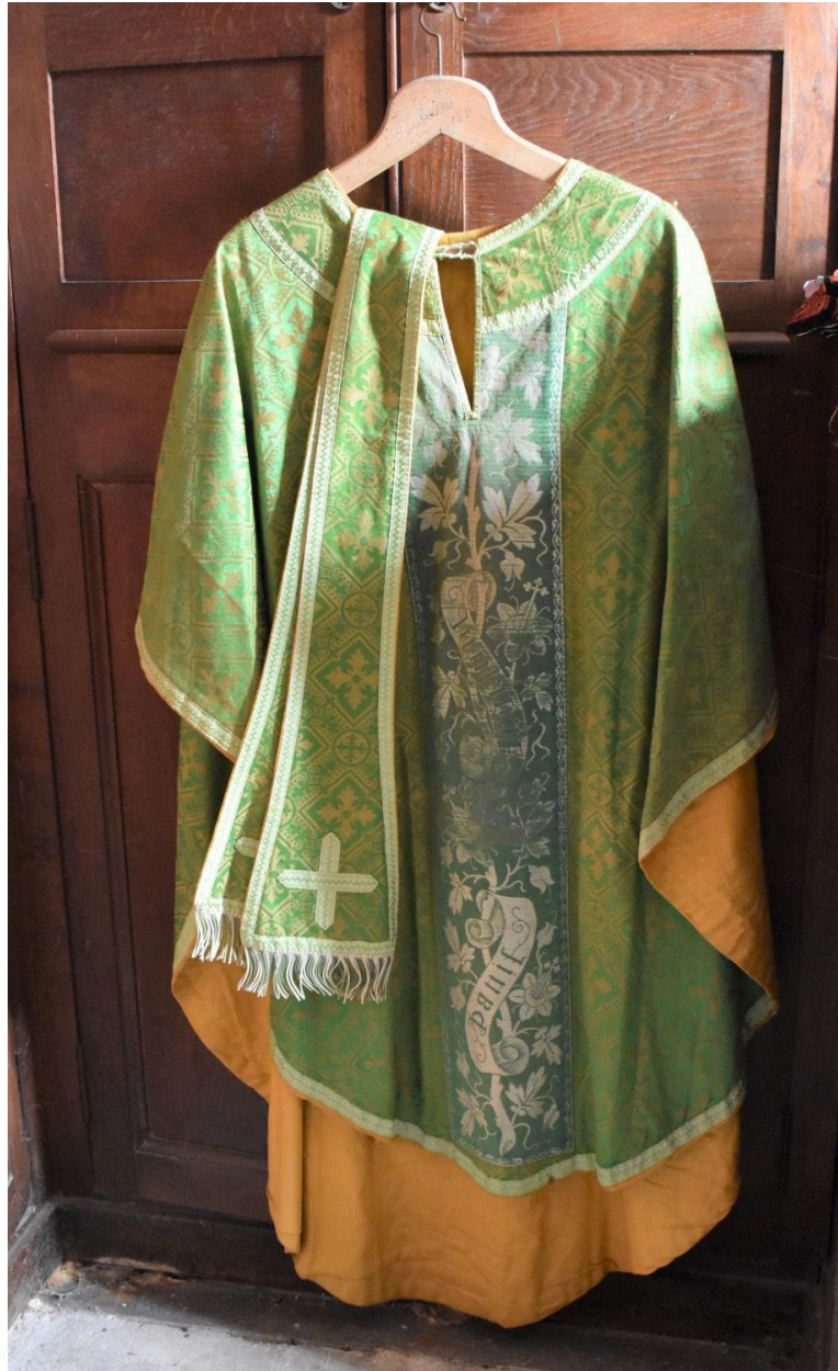
chasuble, étole : ornement vert