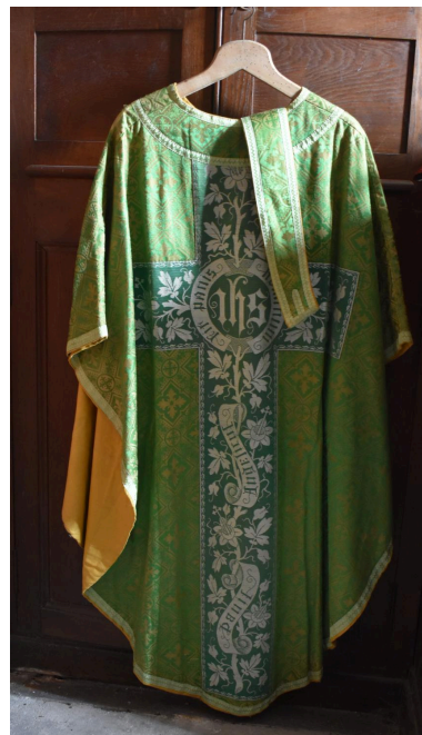
chasuble, étole : ornement vert IVR84_20250300137NUCA