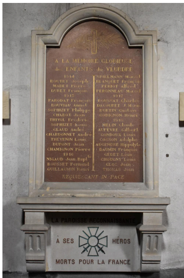
monument aux morts IVR84_20250300134NUCA