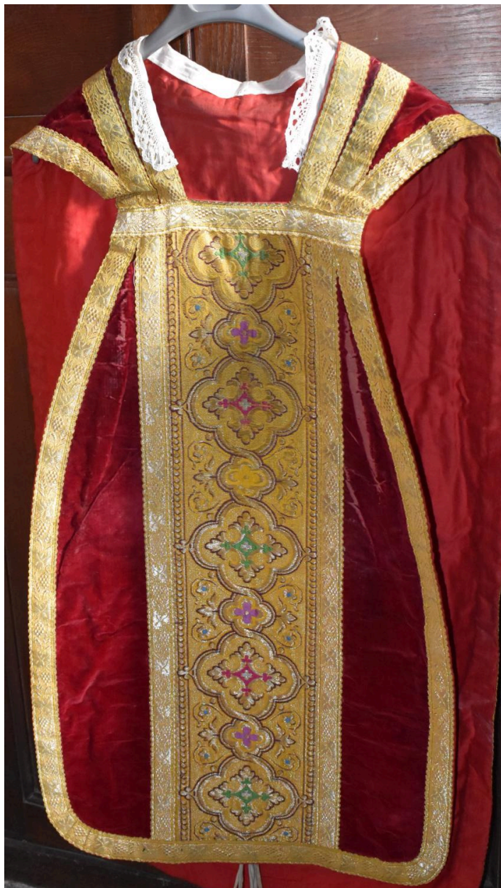
chasuble : ornement rouge, vue du devant.