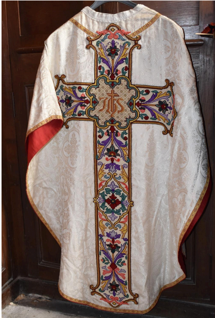
chasuble : ornement blanc