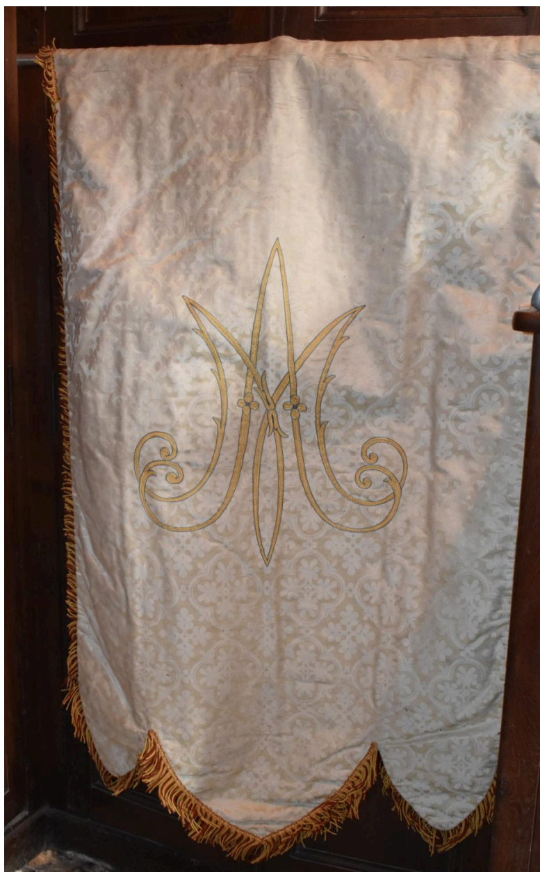
bannière de procession