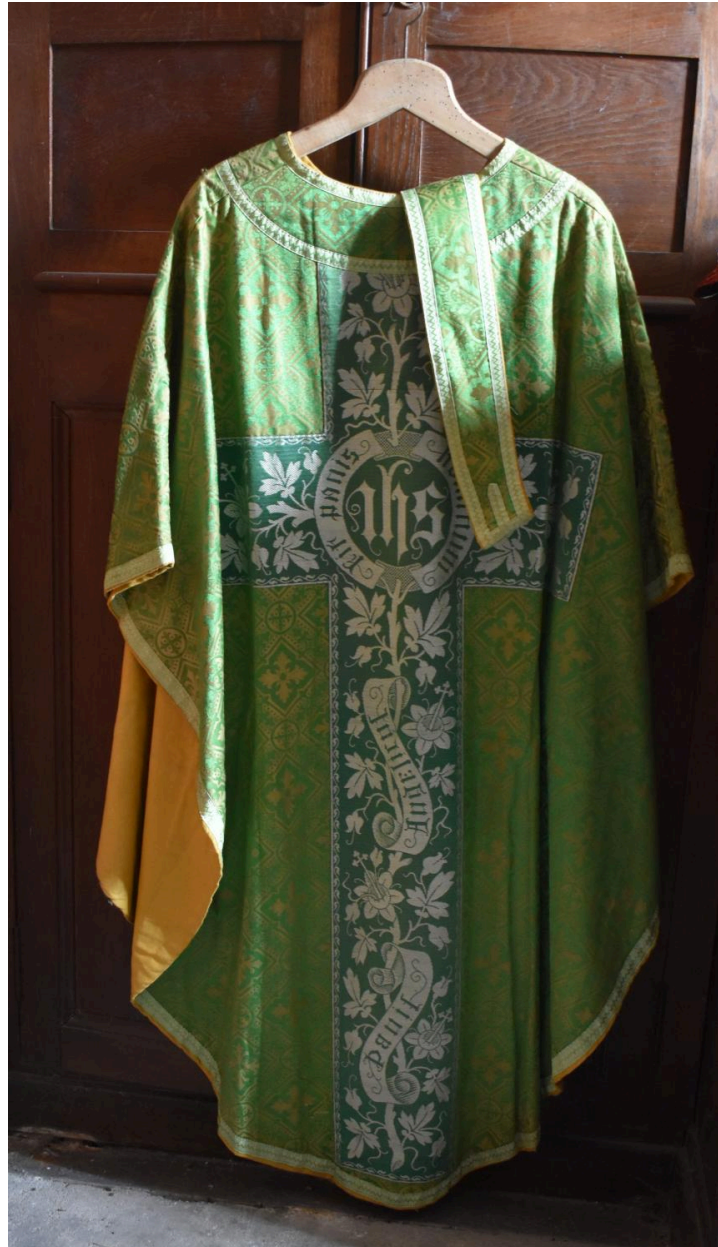
chasuble, étole : ornement vert