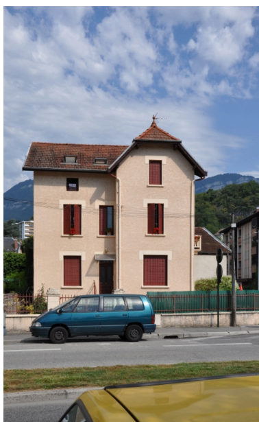
Vue générale IVR82_20117300418NUCA