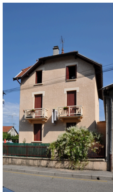
Façade latérale IVR82_20117300417NUCA