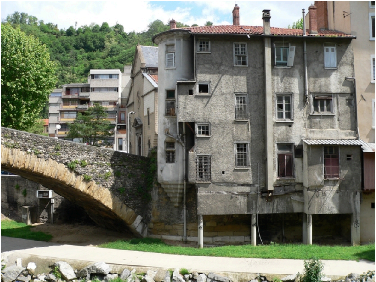
Façade sur Gère