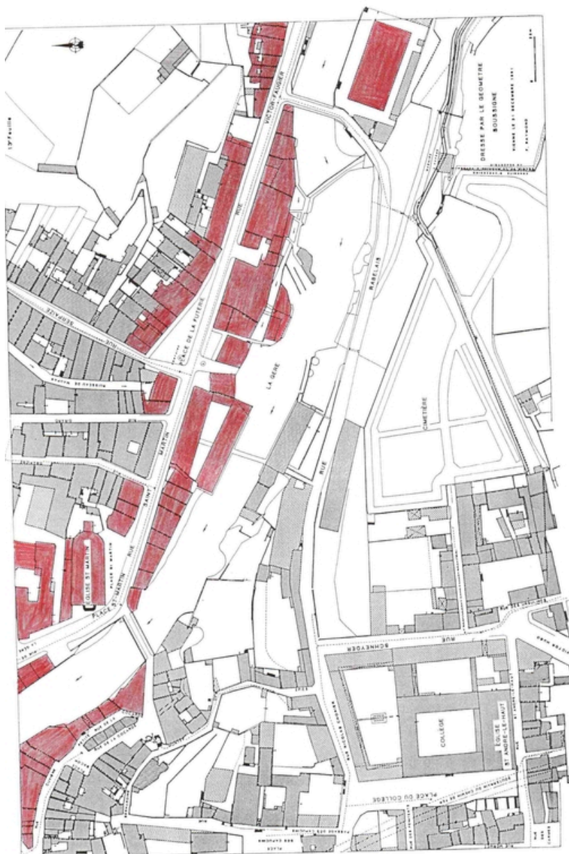
Plan Raymond, rue Saint-Martin, place de la Futerie, 1891 (3)