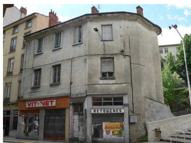
Façade sur rue IVR82_20093800573NUCA