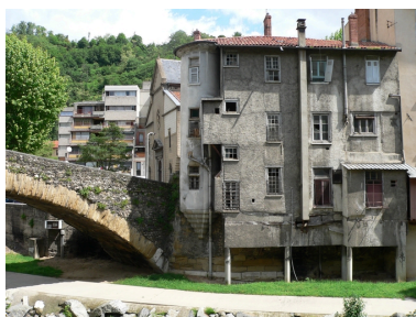
Façade sur Gère IVR82_20093800574NUCA