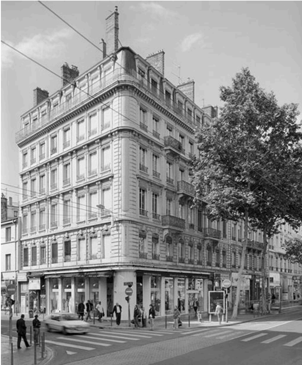
Vue générale depuis le sud-est