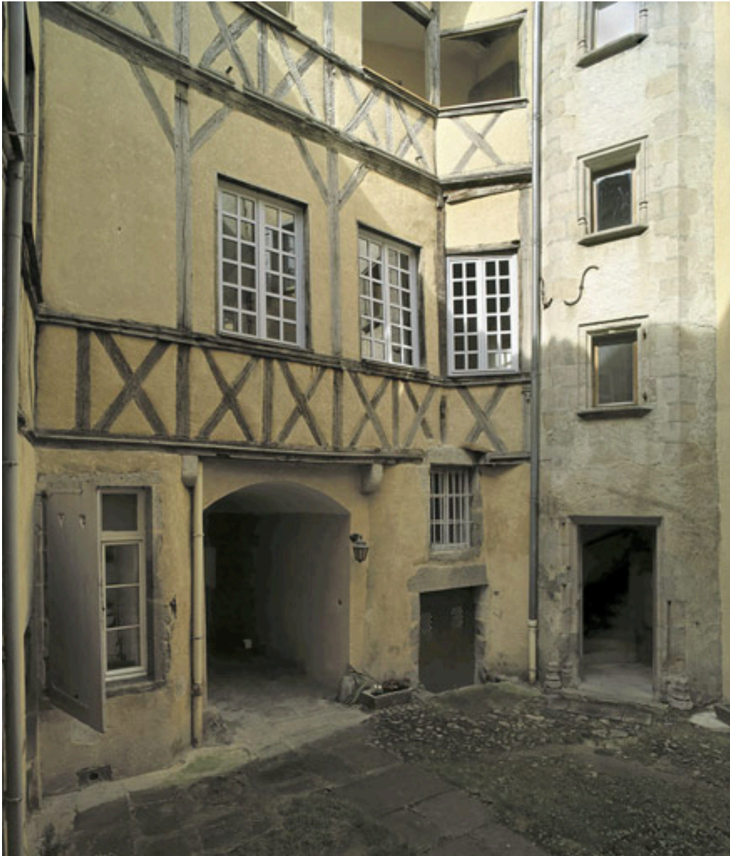
Vue partielle du corps principal : revers de façade sur cour.