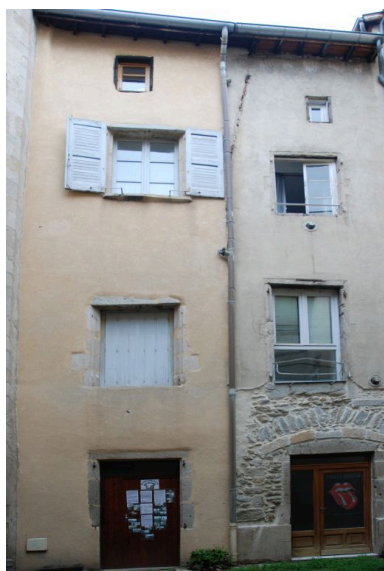
Vue de l'aile gauche sur cour (revers rue Pasteur).