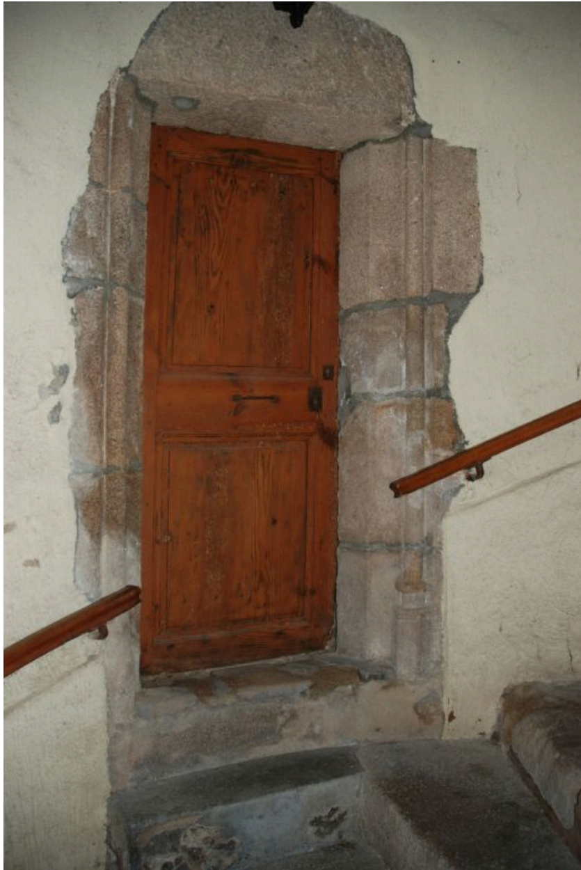
Porte palière de l'entresol.