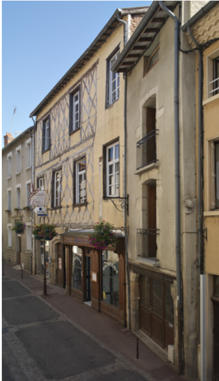
Vue de situation sur la rue de trois-quarts droit.