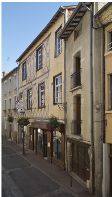
Vue de situation sur la rue de trois-quarts droit.