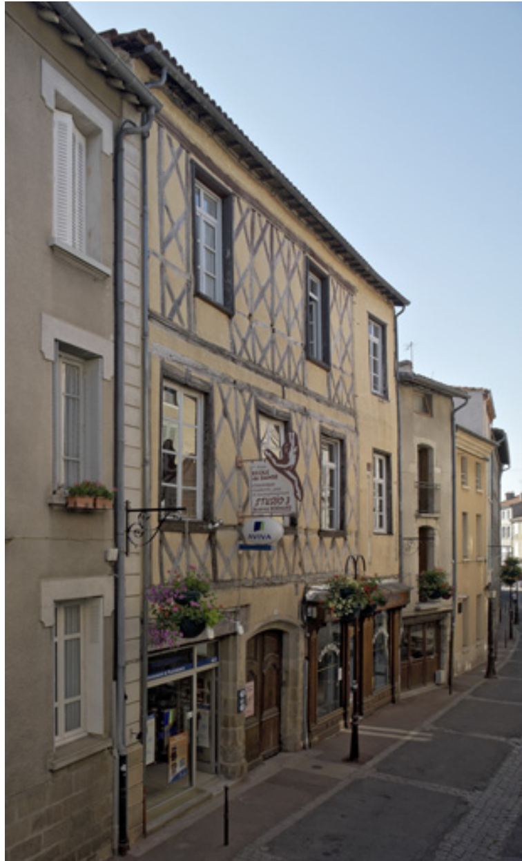
Vue de situation sur rue de trois-quarts gauche.