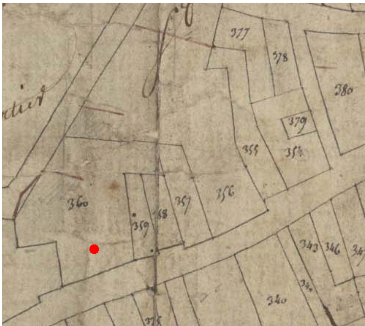
Extrait du plan cadastral de 1809, parcelle E 360 (partie ouest).