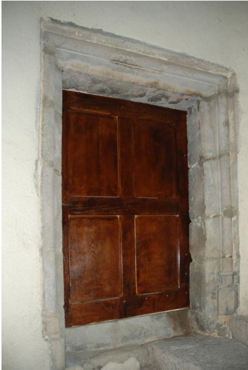
Porte palière du 2e étage.