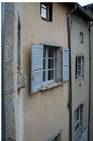
Vue partielle de l'aile gauche depuis la galerie du 2e étage. IVR82_20124202593NUCA