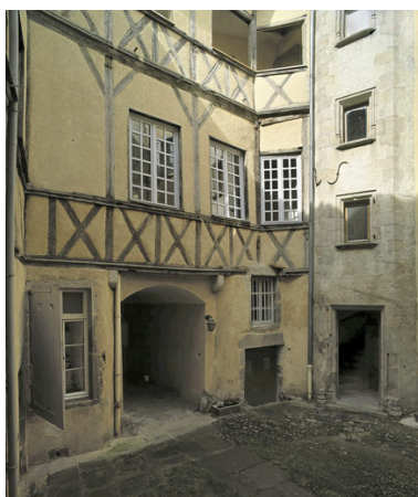
Vue partielle du corps principal : revers de façade sur cour. IVR82_20074200290NUCA