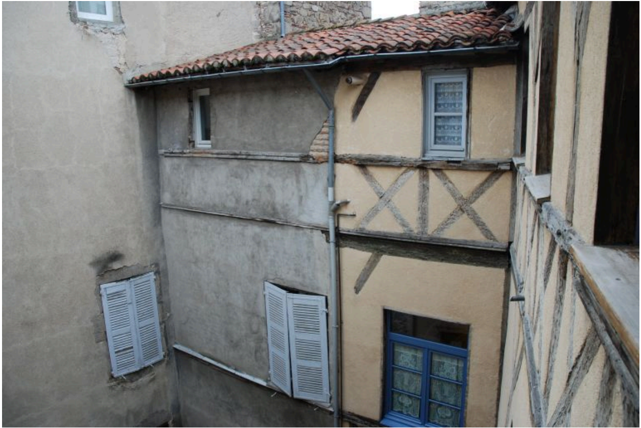
Vue de l'aile droite depuis la galerie du 2e étage.