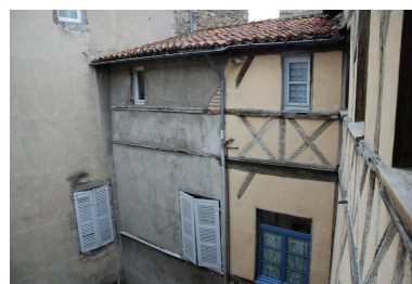
Vue de l'aile droite depuis la galerie du 2e étage. IVR82_20124202594NUCA