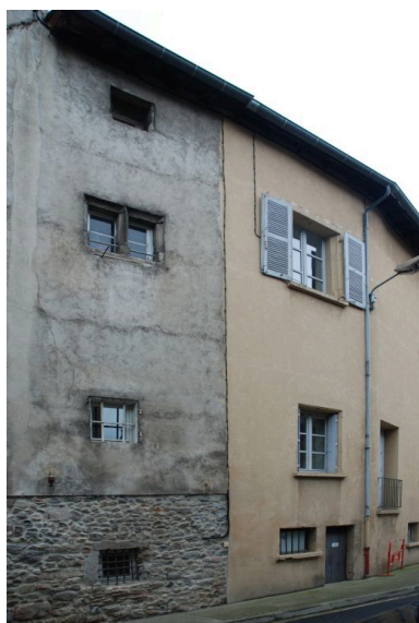
Vue partielle de l'élévation latérale donnant sur la rue Pasteur. IVR82_20124202595NUCA