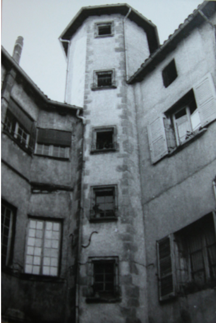
Cage d'escalier demi-hors-oeuvre, sur cour. Prise de vue avant restauration, 1975 (fonds Louis Bernard). photographie noir et blanc AD Loire. 1111 VT 128