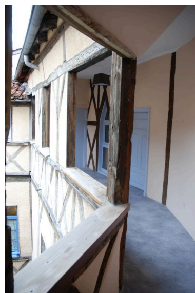
Vue de la galerie du 2e étage. IVR82_20124202591NUCA