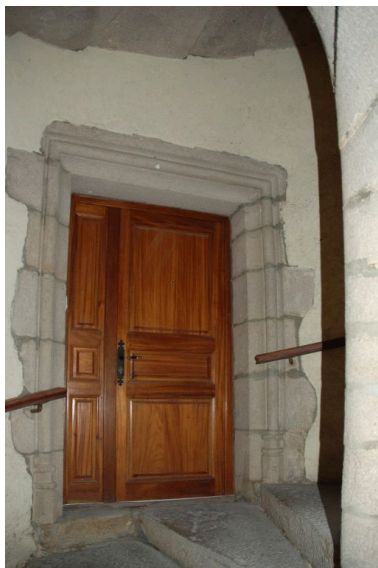
Porte palière du 1er étage.