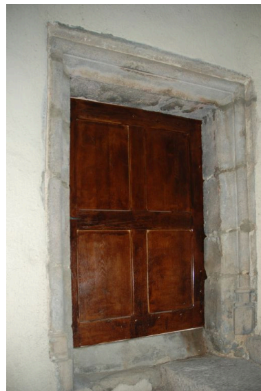
Porte palière du 2e étage. IVR82_20124202590NUCA