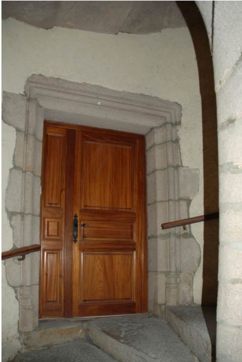
Porte palière du 1er étage.