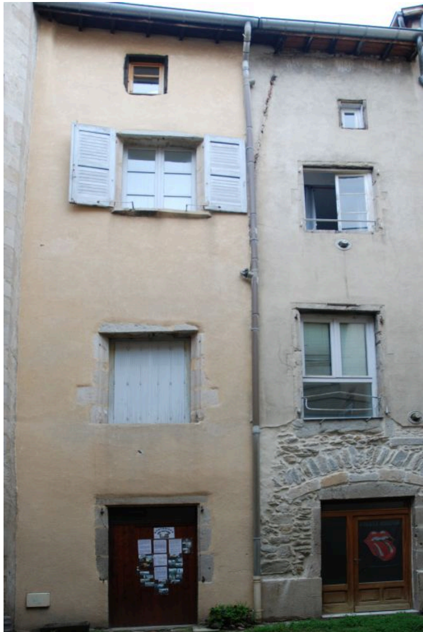
Vue de l'aile gauche sur cour (revers rue Pasteur).