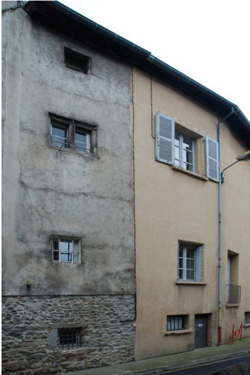
Vue partielle de l'élévation latérale donnant sur la rue Pasteur.