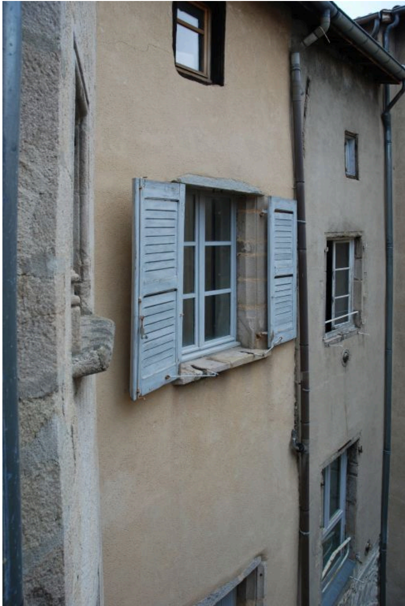
Vue partielle de l'aile gauche depuis la galerie du 2e étage.