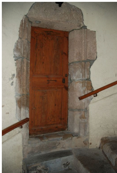
Porte palière de l'entresol.