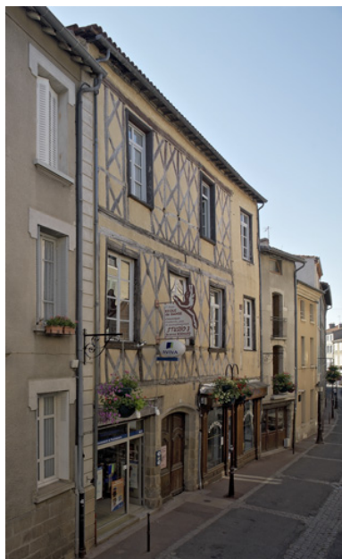
Vue de situation sur rue de trois-quarts gauche.