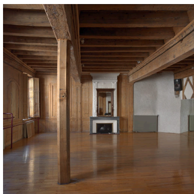
Salon du 1er étage, vue partielle.