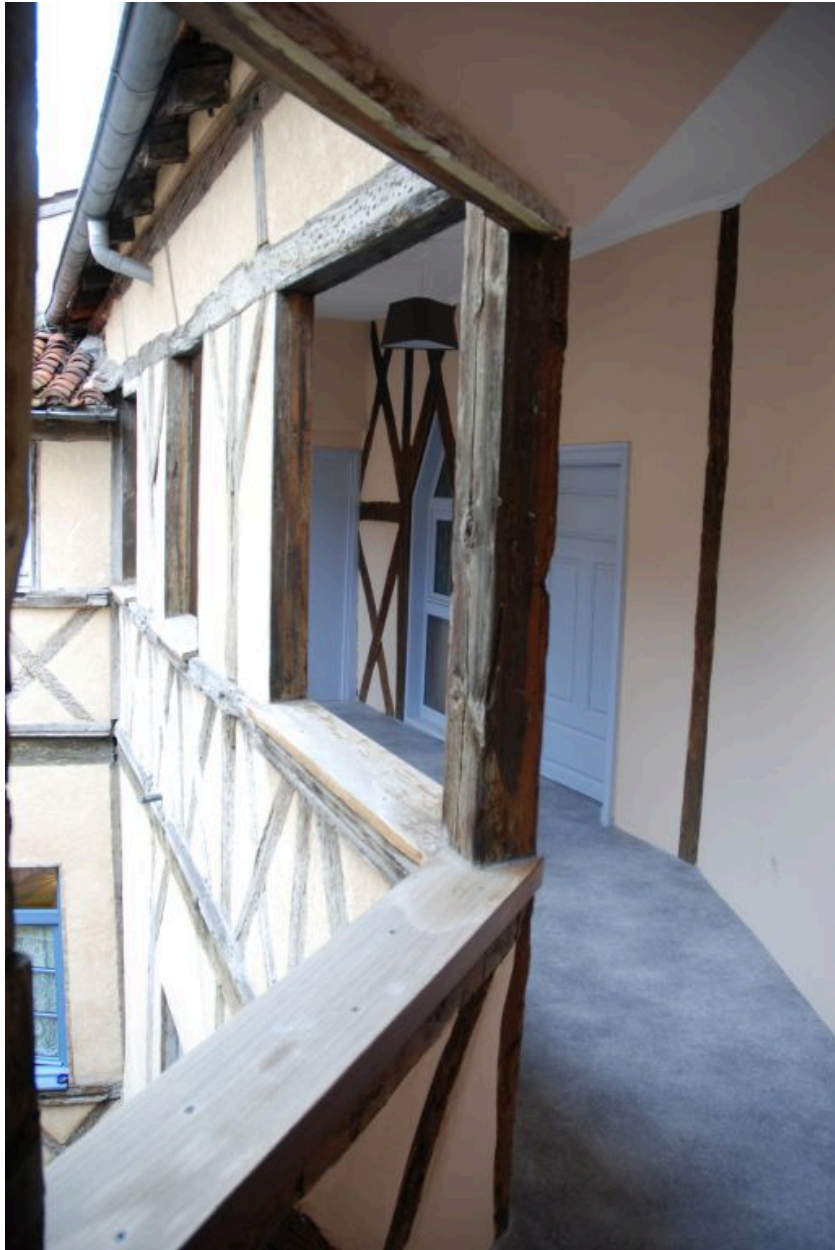
Vue de la galerie du 2e étage.