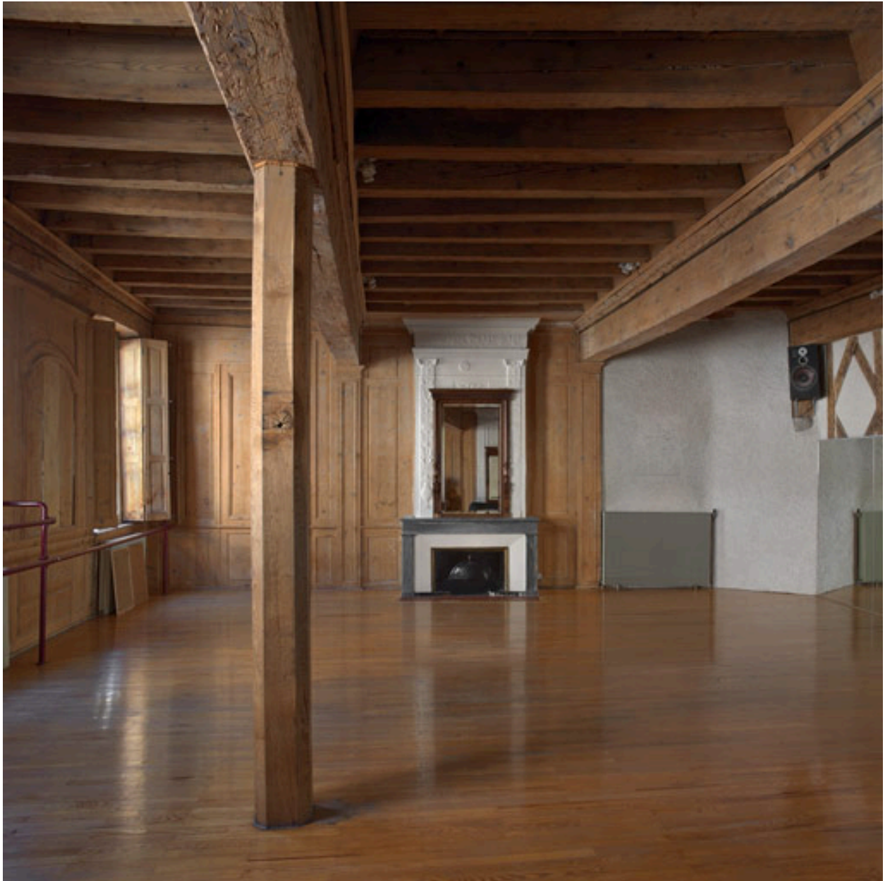
Salon du 1er étage, vue partielle.